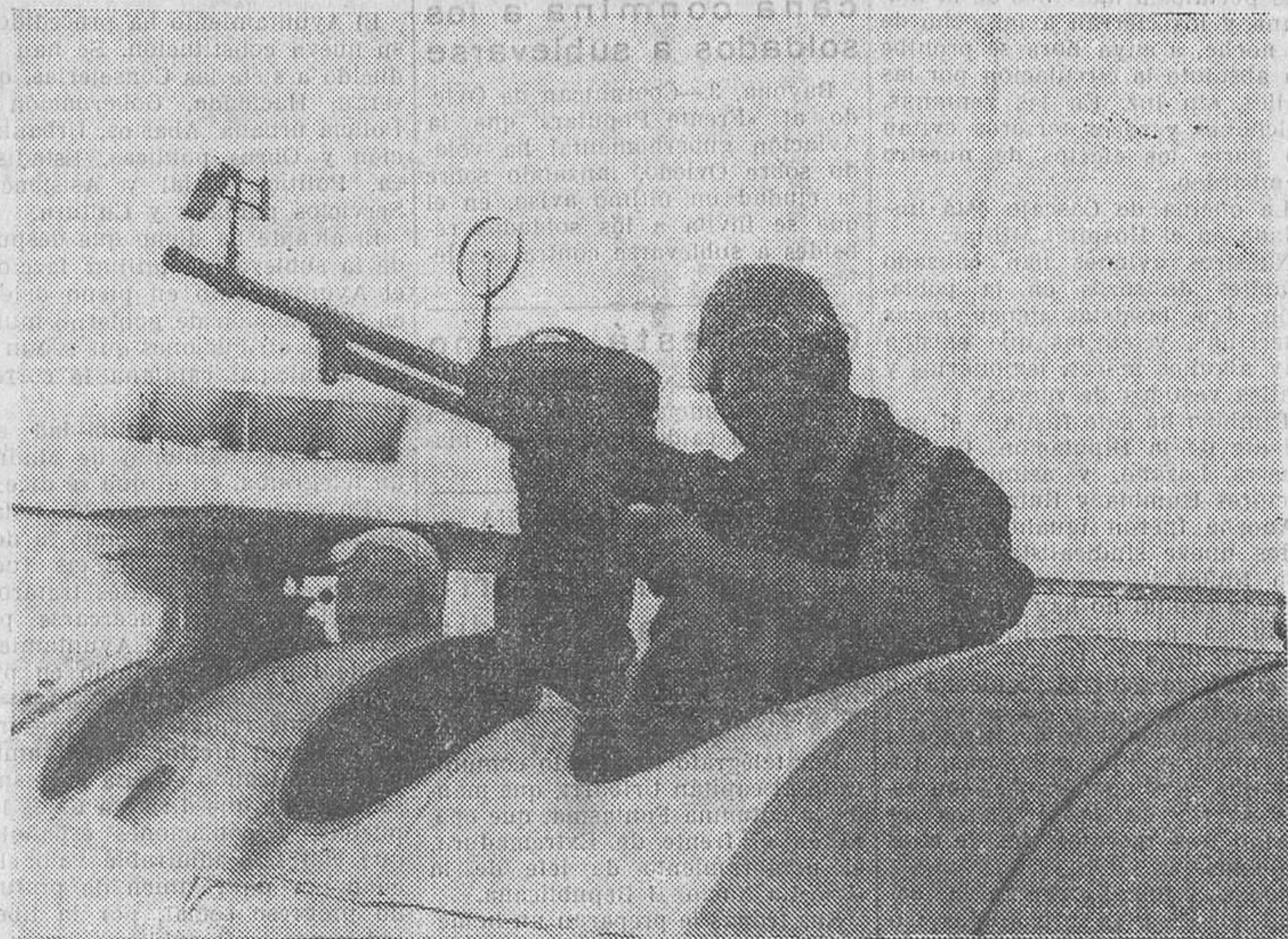
EN EL FRENTE DE EXTREMADURA.—Nuestra Aviación sigue con éxito sus proezas, dando todos los días nuevas victorias para nuestra causa. Aquí vemos a estos bravos aviadores preparando y examinando la ametralladora en el momento de levantar el vuelo con dirección a las líneas enemigas

—Ha dicho Gil Robles que ha ido a Burgos porque allí está España. —Pues más bien parece que está Cateria.