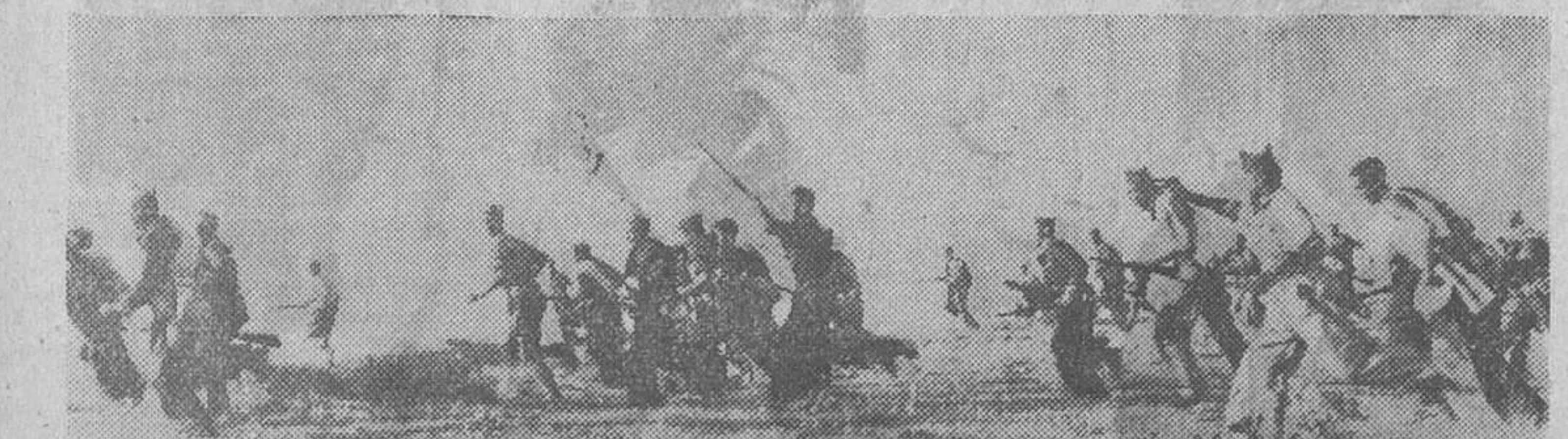
Milicianos y soldados avanzan en guerrilla sobre el frente fascioso de Peguerinos