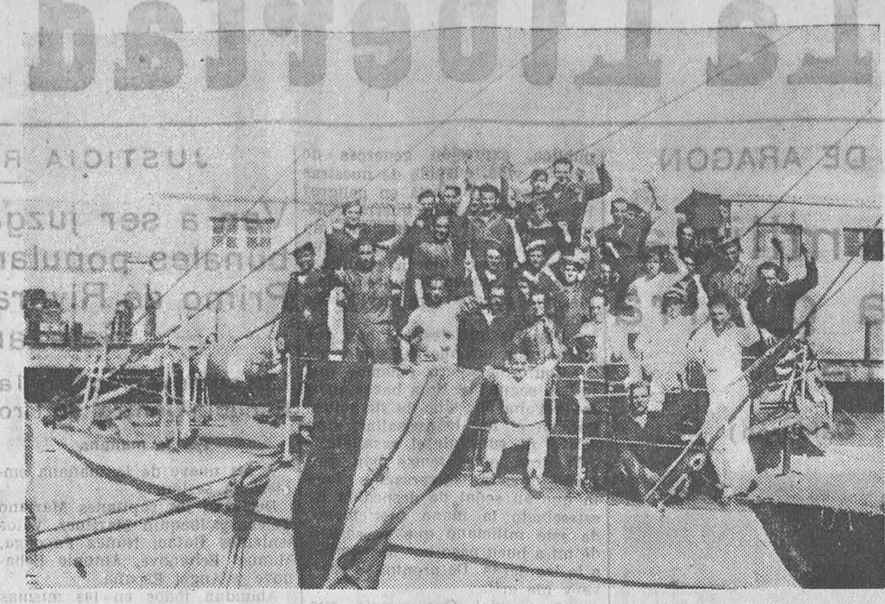
CARTAGENA.—La heroica tripulación del «Xauen»

Maestra niñas ofrece. Preciosos, 7, continental, González.