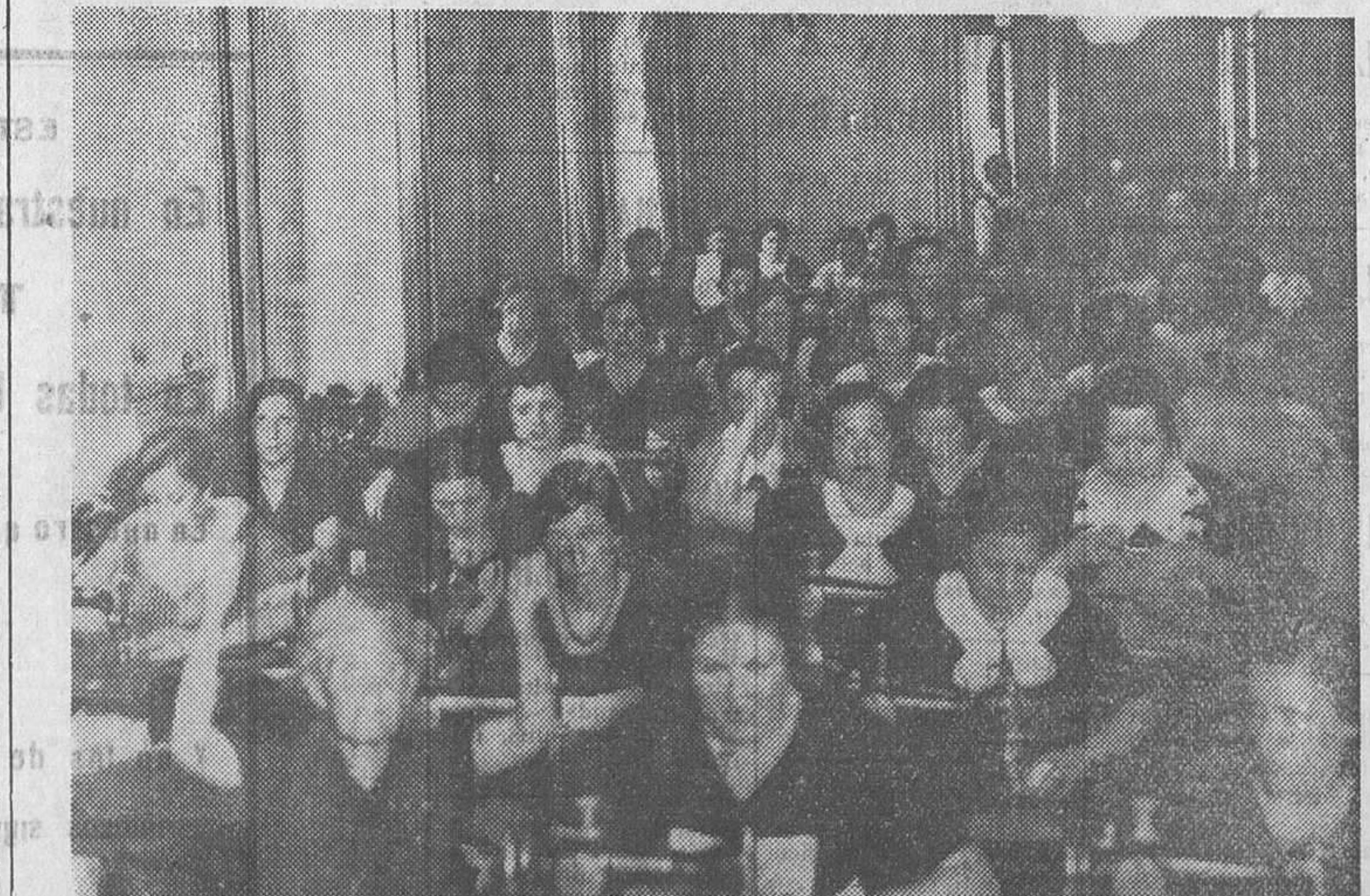
EN IZQUIERDA REPUBLICANA.—Jóvenes empleadas voluntarias en la confección de prendas que luchan en el frente.