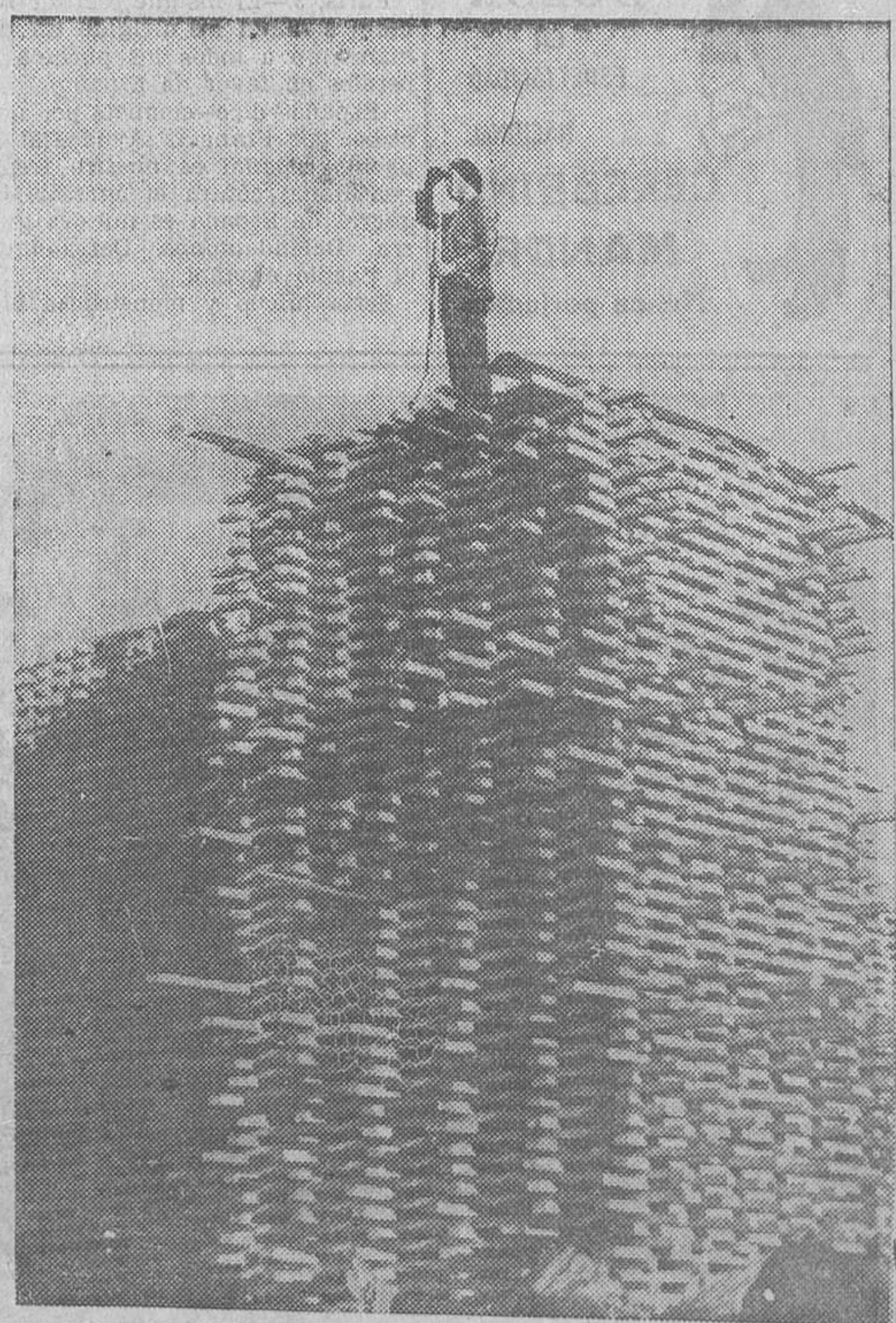
Este mozo armado, del pueblo de Peguerinos, vigila atenta y cuidadosamente desde lo alto de unas pilas de maderas el movimiento del enemigo, que acusa una retirada sorprendente