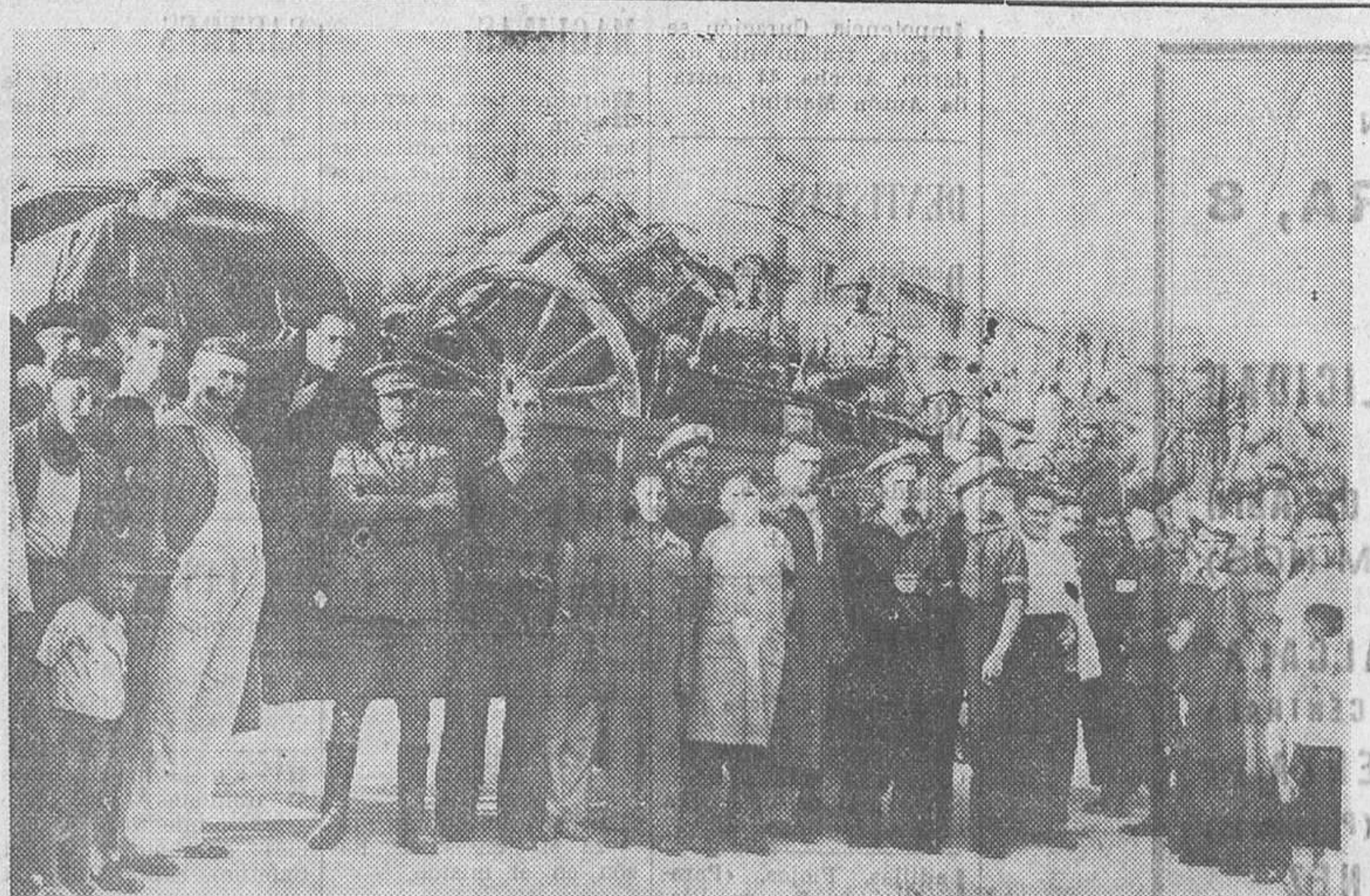
CARTAGENA.—Piezas de artillería que han marchado al frente, rodeadas de numeroso público que las despidió.