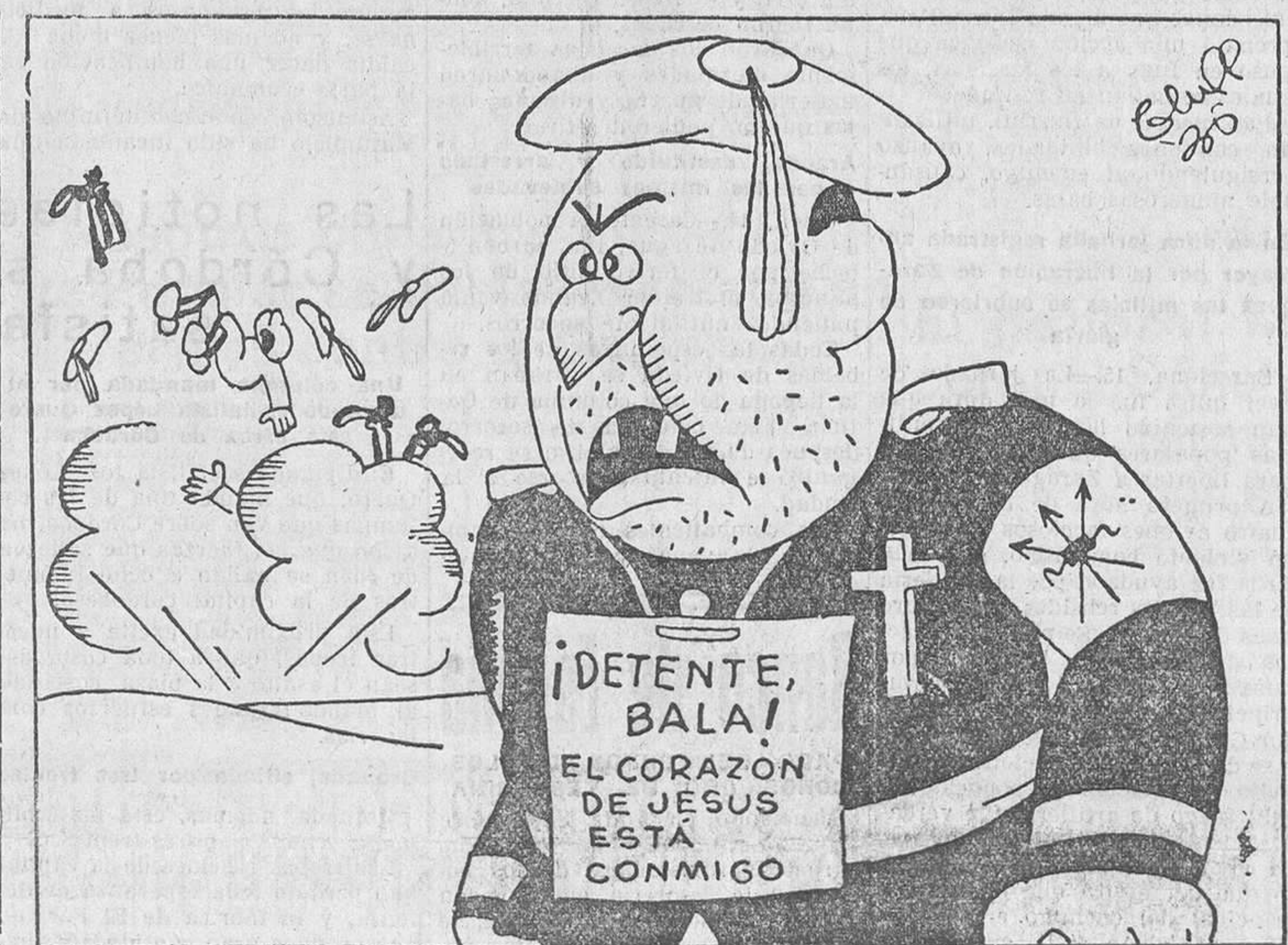
SORPRESA, por Bluff

Es lo que pasa en estas cosas. Unos esperan que se lancen otros para hacerlo ellos, y así ninguno se echa adelante; pero si hubiesen puesto sus relojes en hora, diciendo: «Mañana, a las seis de la