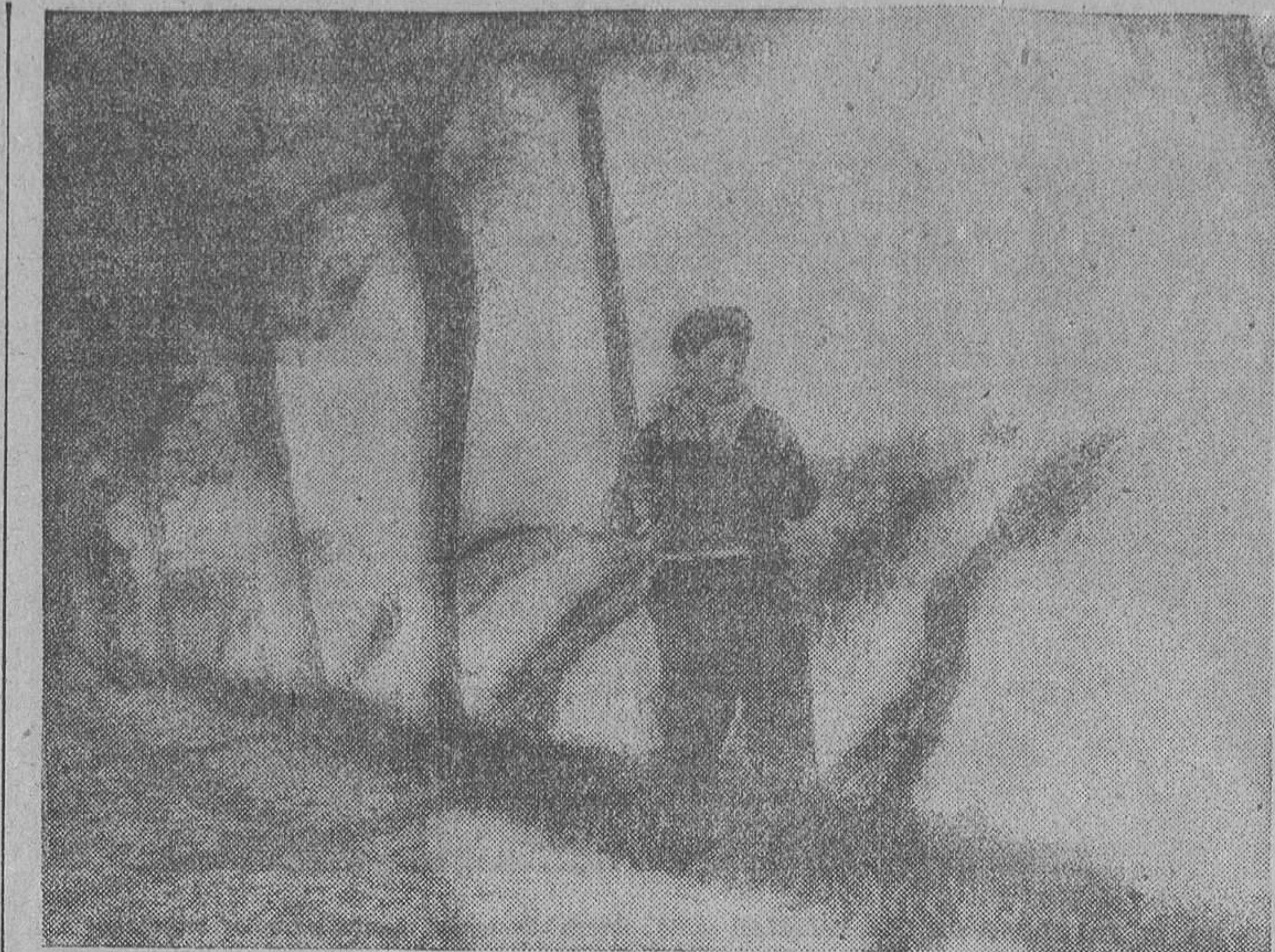
Después de conquistada una nueva posición, los soldados de Transmisiones siguen a las vanguardias tendiendo hilos telefónicos para comunicarse

En la sesión de esta mañana, el delegado italiano intervino pa-