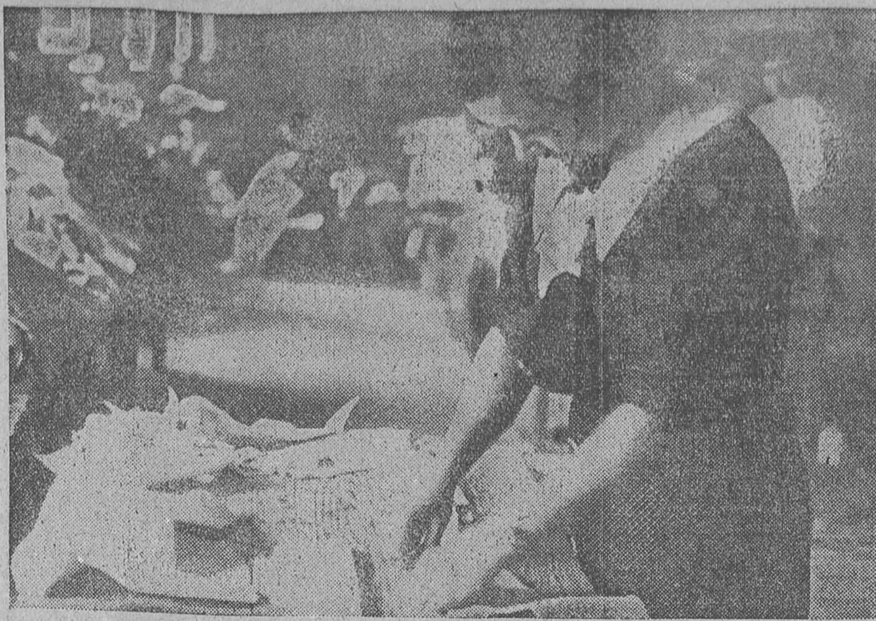
EN EL LAVADERO DE LAS MILICIAS.—Una obrera haciendo mudas para los milicianos