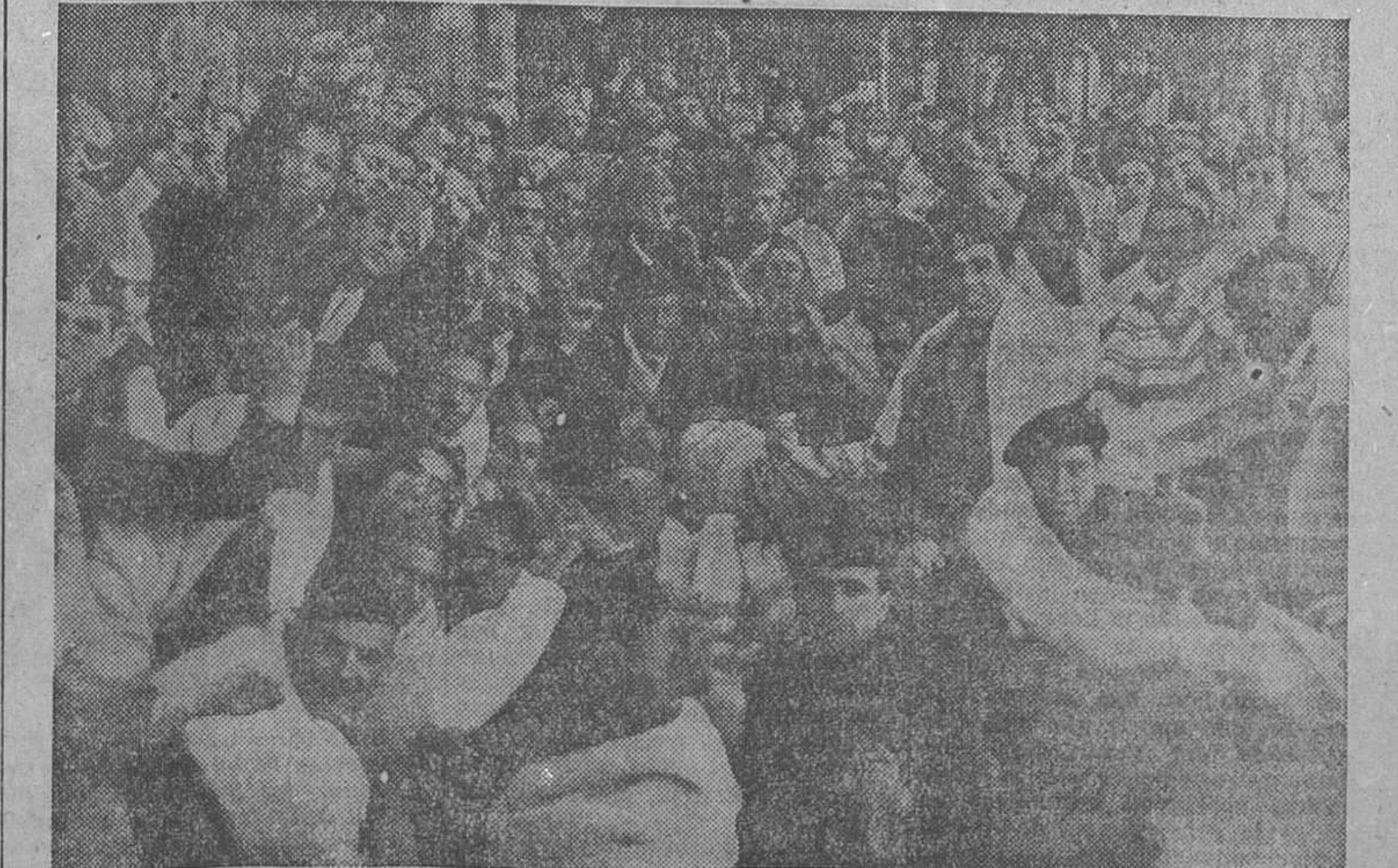
Grupo de milicianos que, después de un breve descanso, se reincorporan al frente con jovial entusiasmo

Refiriéndose a la situación de España, dijo que todo el Mundo sabe que querer mantener la no intervención es desagradable, puesto que es notorio que algunos países han intervenido.