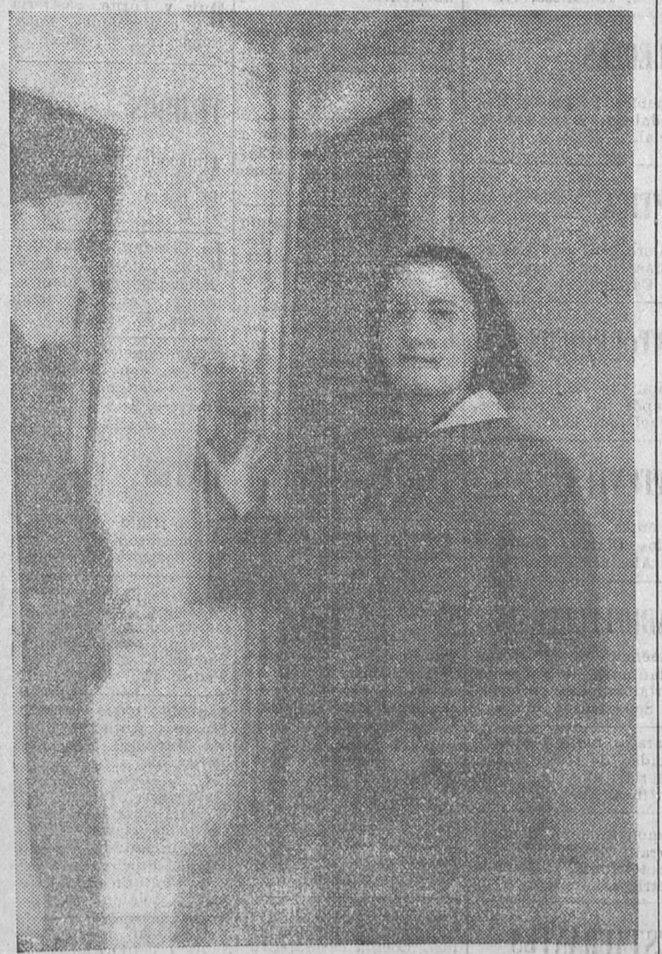
La defensa de Madrid obliga a la mujer a substituir al hombre en muchos empleos de retaguardia. En el «Metro», esta bella compañera presta sus servicios en el ascensor de la Gran Vía

Detrás de la piedra de mármol de un lavabo estaban ocultos 165.000 francos suizos, 10.000 libras esterlinas y valores españoles por 25.000 pesetas.