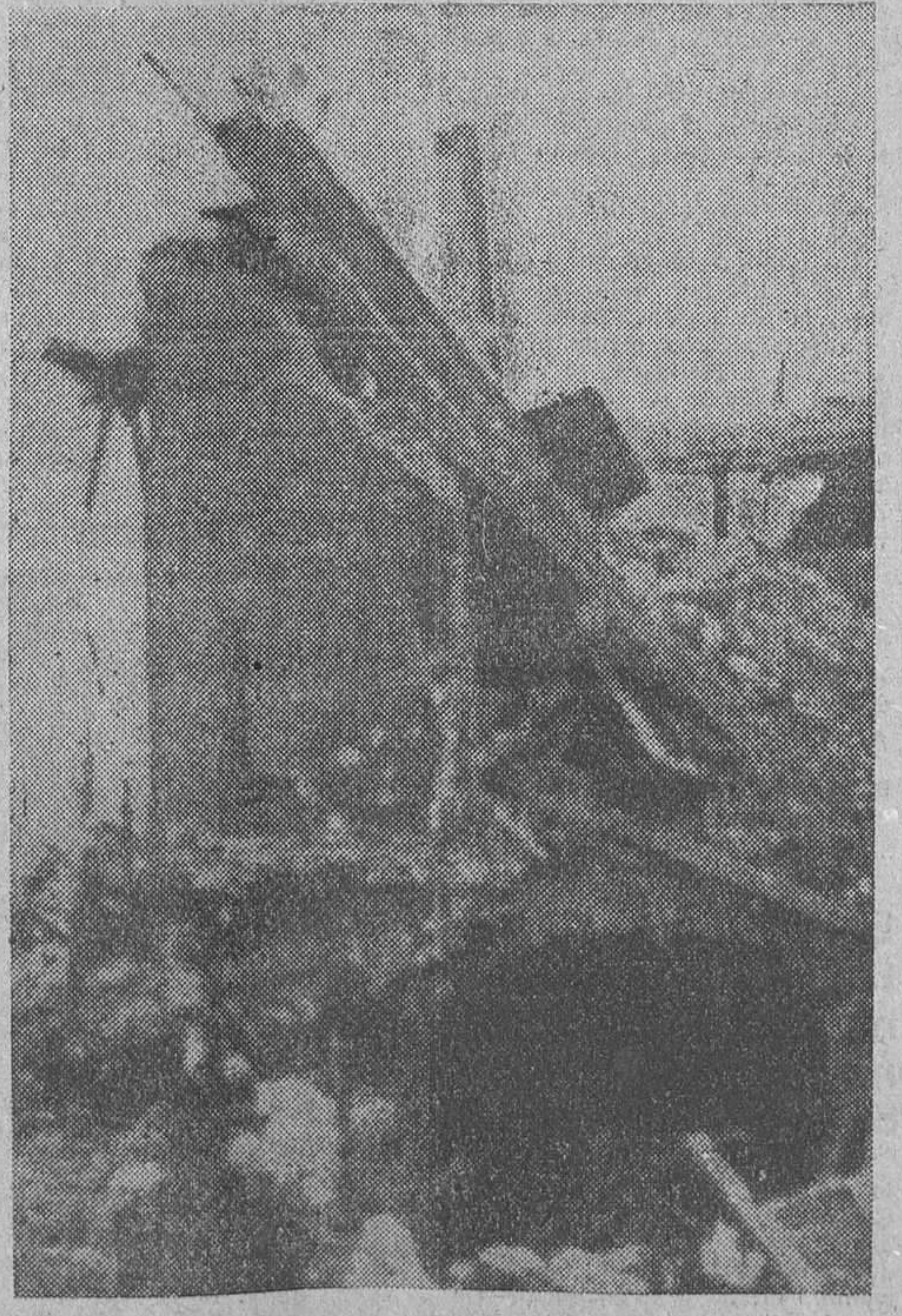
RUINAS.—El paso de las fuerzas fascistas deja en todos los pueblos la huella de su barbarie sin límites. Antes de abandonar sus posiciones, obligados por el empuje de nuestras milicias, reducen a escombros las humildes casas donde se hacían fuertes. He aquí una impresionante instantánea obtenida a la entrada de nuestras tropas en uno de los últimos pueblos reconquistados