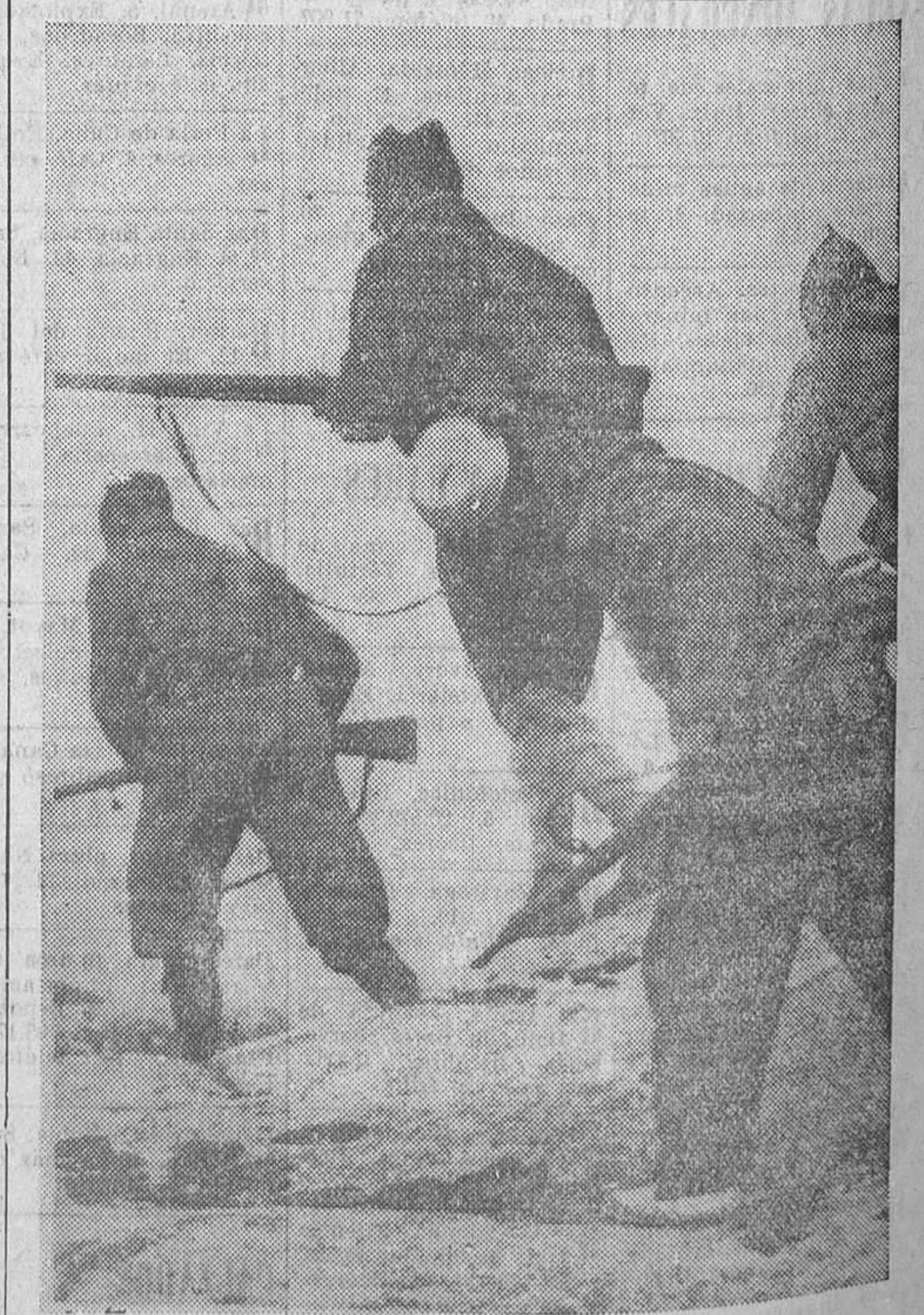
Un avance de nuestras fuerzas leales en el sector de la Sierra (Pol. D. Casariego.)