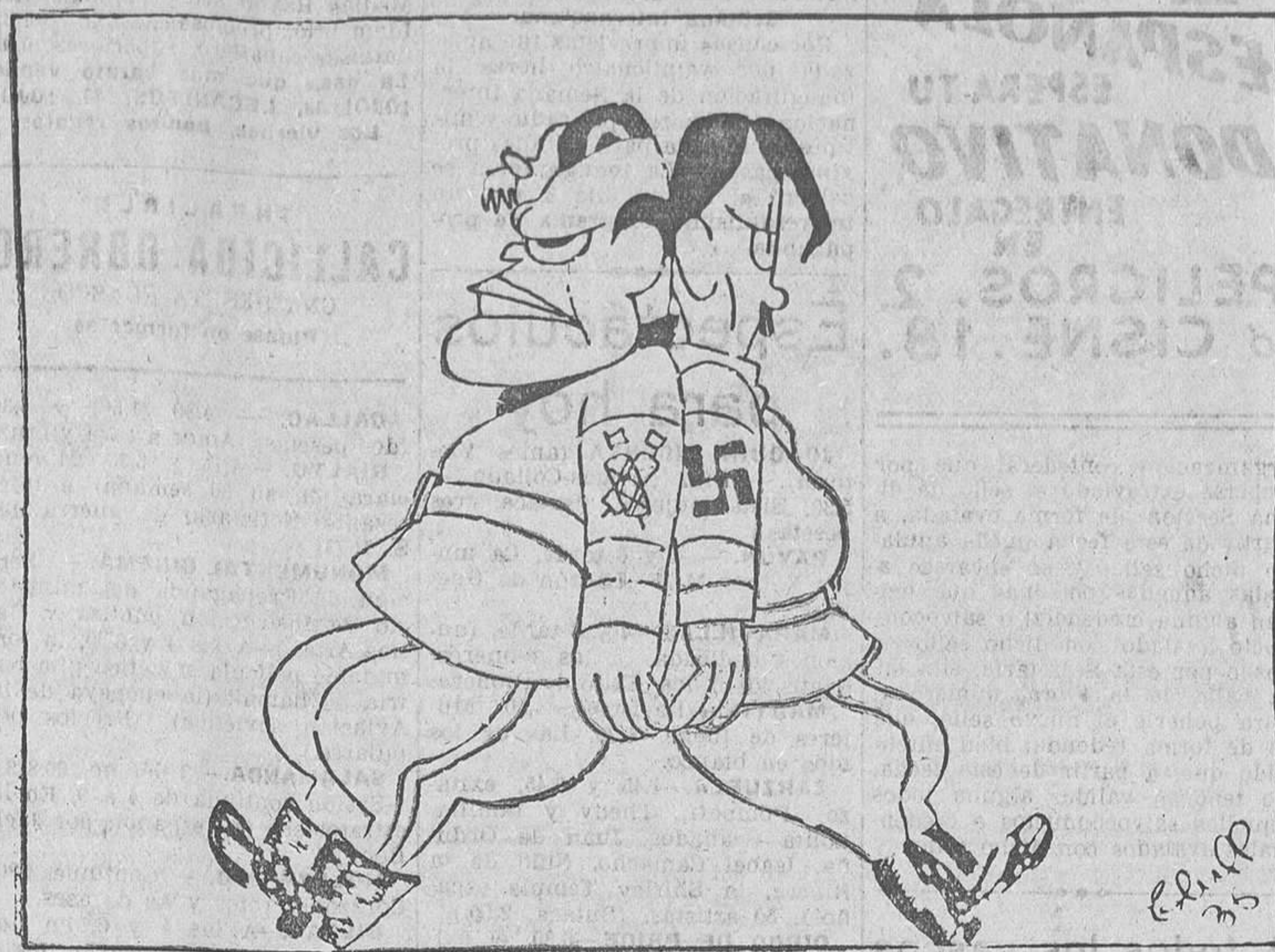
LA "VERTICAL" ROMA-BERLIN, por Bluff Hitler apoya a Mussolini y Mussolini apoya a Hitler