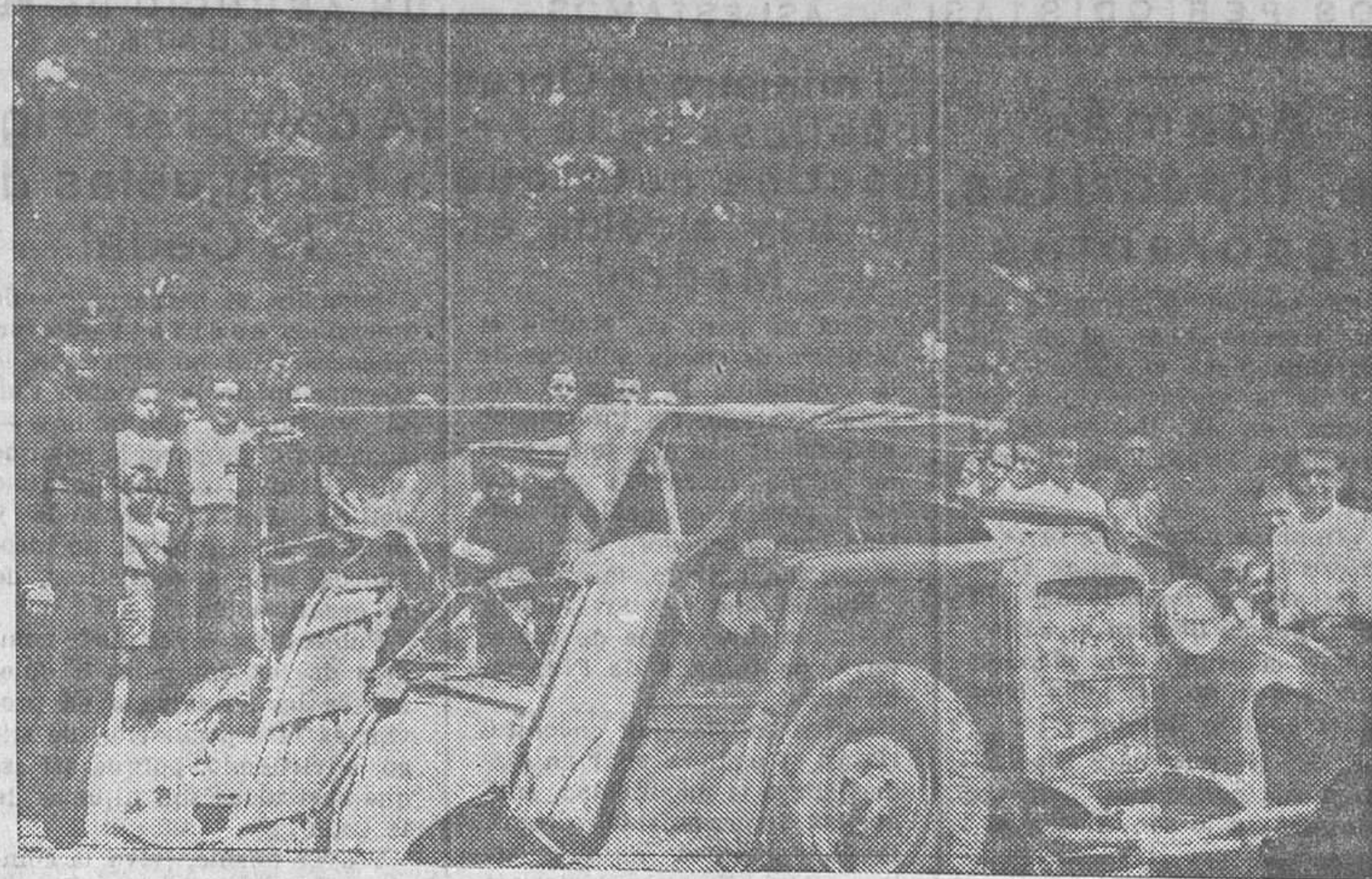
Estado en que quedó el automóvil de turismo que ayer mañana chocó contra un autocar en San Antonio de la Florida

A favor de la ponencia de los señores Salazar Alonso, Morales y Serrano Coruña, que consiste en dedicar cinco puestos para la Factoría municipal, uno para la Federación de Armadores de buques de pesca y 23 para nuevos abastecedores, votaron los Sres. Morales, Serrano Coruña y Ortega Mayor. En contra, el delegado de Abastos,