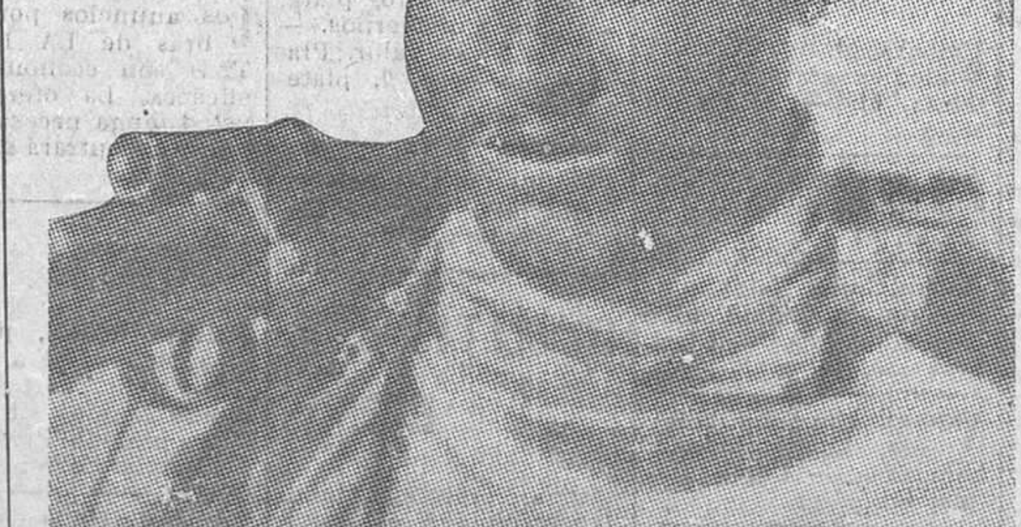
Interesante tipo de guerrero abisinio.

Berlín, 24.—El mayor hotel de Yugoslavia, el Kupari, situado cerca de Raguse, en Dalmacia, ha quedado totalmente destruido por un incendio. Este establecimiento estaba integrado por cinco grandes hoteles, casetas de baños y grandes jardines, todo lo cual ha quedado destruido. El fuego se inició ayer tarde en uno de los edificios del hotel y se propagó con rapidez, ayudado por el fuerte viento reinante. Para combatir el siniestro acudieron rápidamente los bomberos de Raguse y la tripulación de los barcos de guerra yugoslavos anclados en el vecino puerto de Batage. Sin embargo, dada la amplitud que desde los primeros momentos había tomado el incendio fué imposible intentar siquiera los primeros trabajos de extinción. Los huéspedes del hotel fueron sorprendidos por las llamas en los salones de baile y en los bares, así como en la sala del cinematógrafo del hotel. También