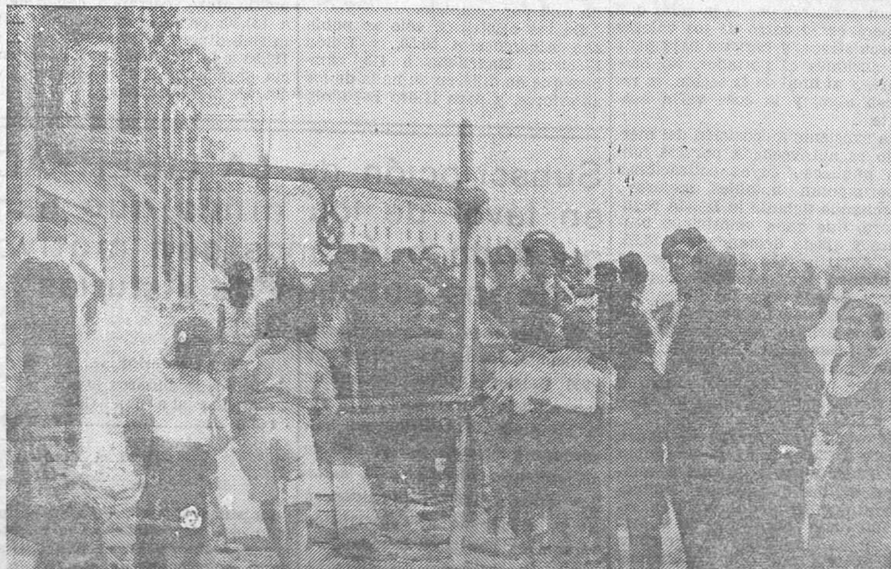
EL SUCESO DEL MARTES EN TETUAN DE LAS VICTORIAS.—El pozo donde ocurrió la tragedia, en la que perecieron tres obreros