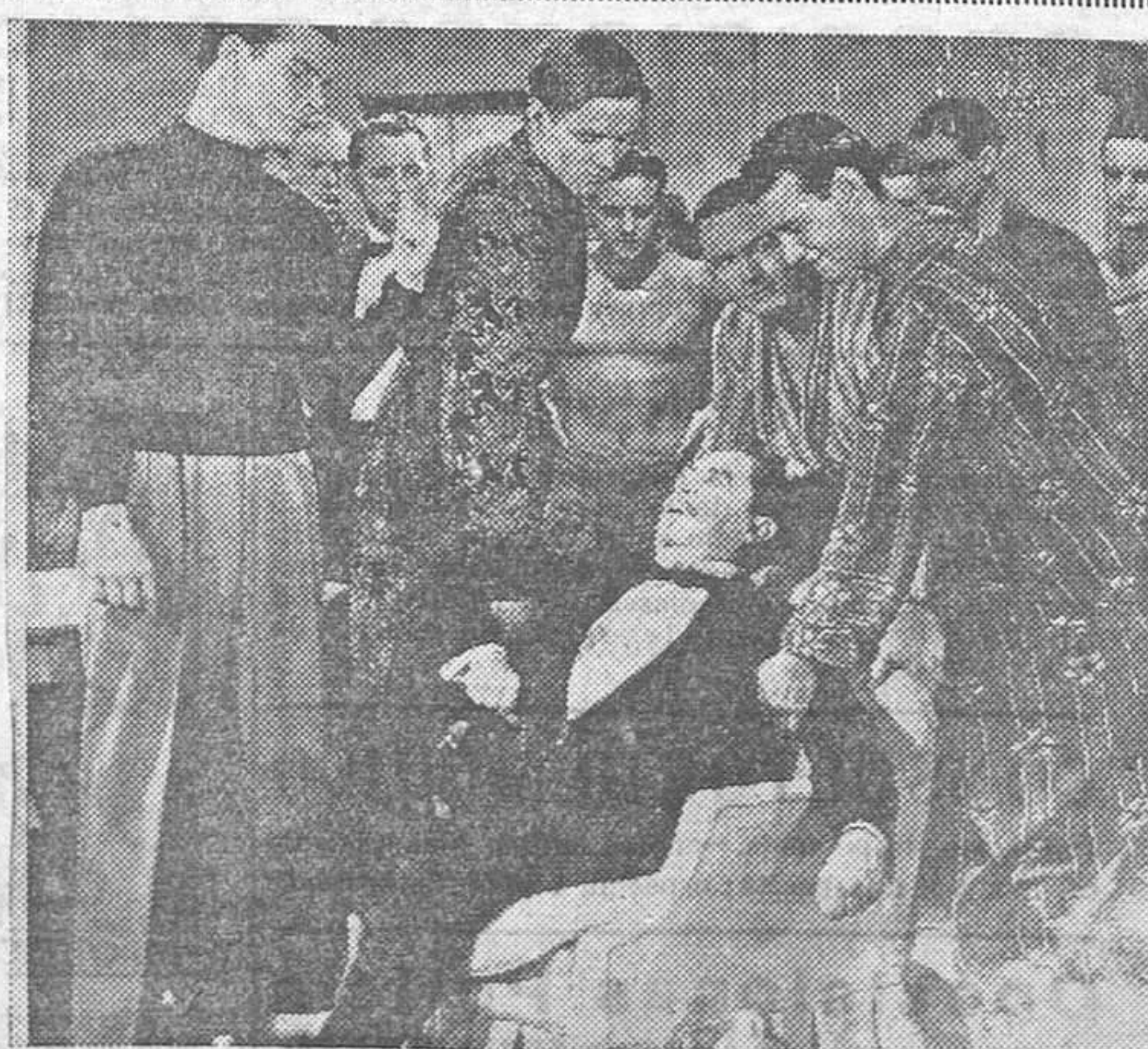
Una escena de la divertida comedia deportiva «Campeones Olímpicos», interpretada por Buster Crabbe y la bellísima Ida Lupino, que el lunes se estrenará en Madrid-Paris