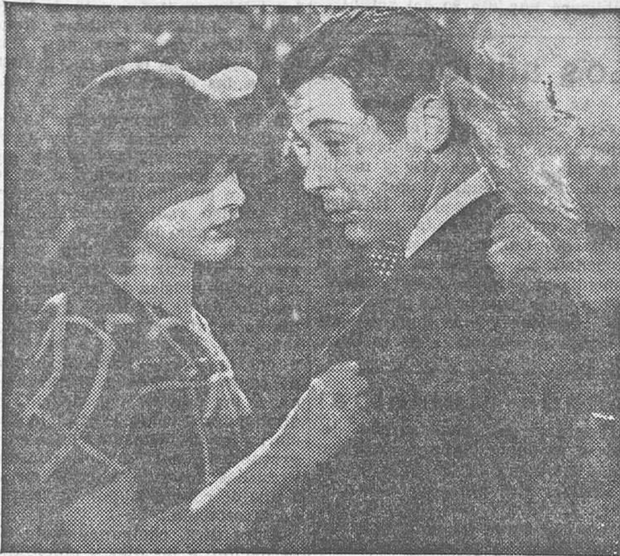
Fernand Gravey y Max Dearly en «Si yo fuera el amo», film que se estrenará el lunes en el Palacio de la Música