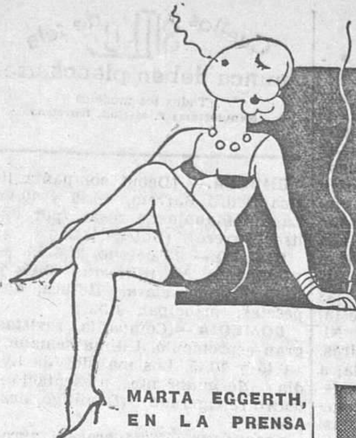
MARTA EGGERTH, EN LA PRENSA