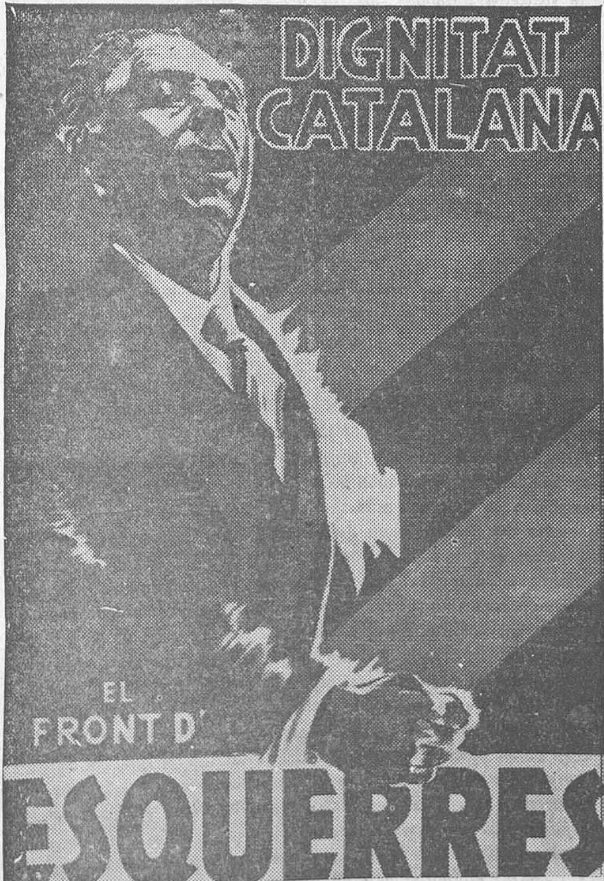
En el cartel electoral, Luis Companys, presidente de Cataluña, arenga al pueblo como en los días triunfales en que contribuyó a la instauración de la República en España entera