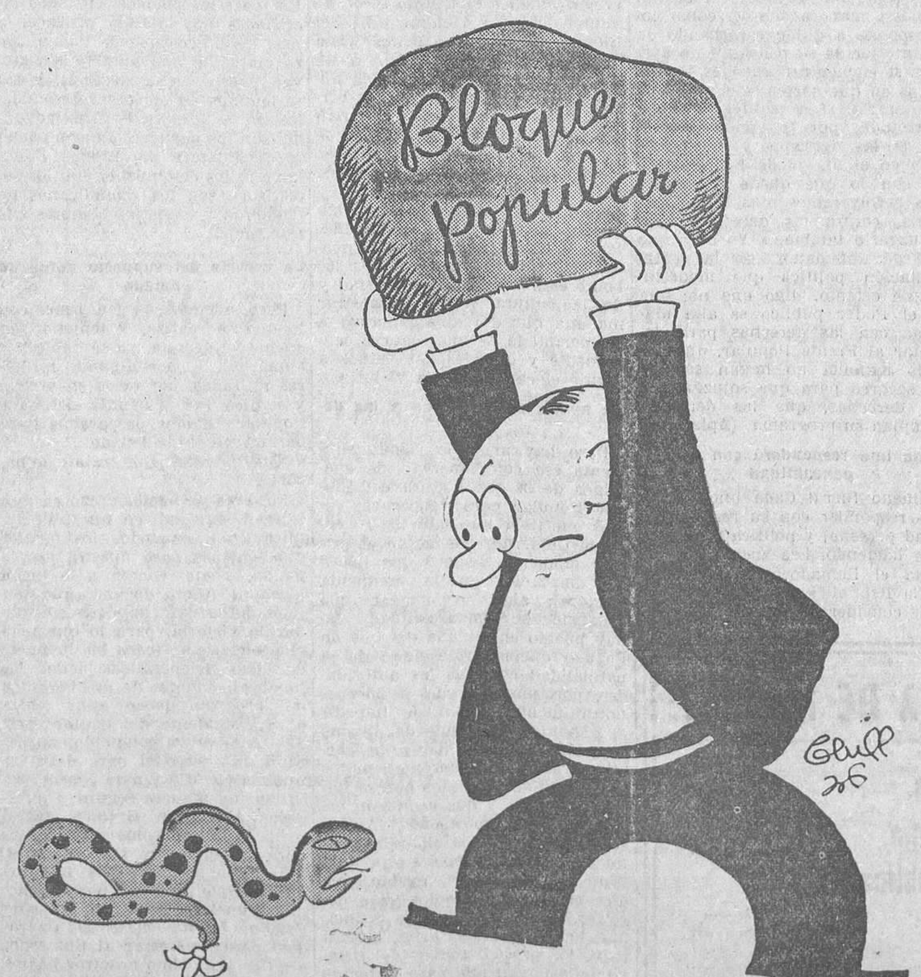
La víbora monárquica intenta levantar la cabeza ¡APLASTADSELA CON VUESTROS VOTOS!