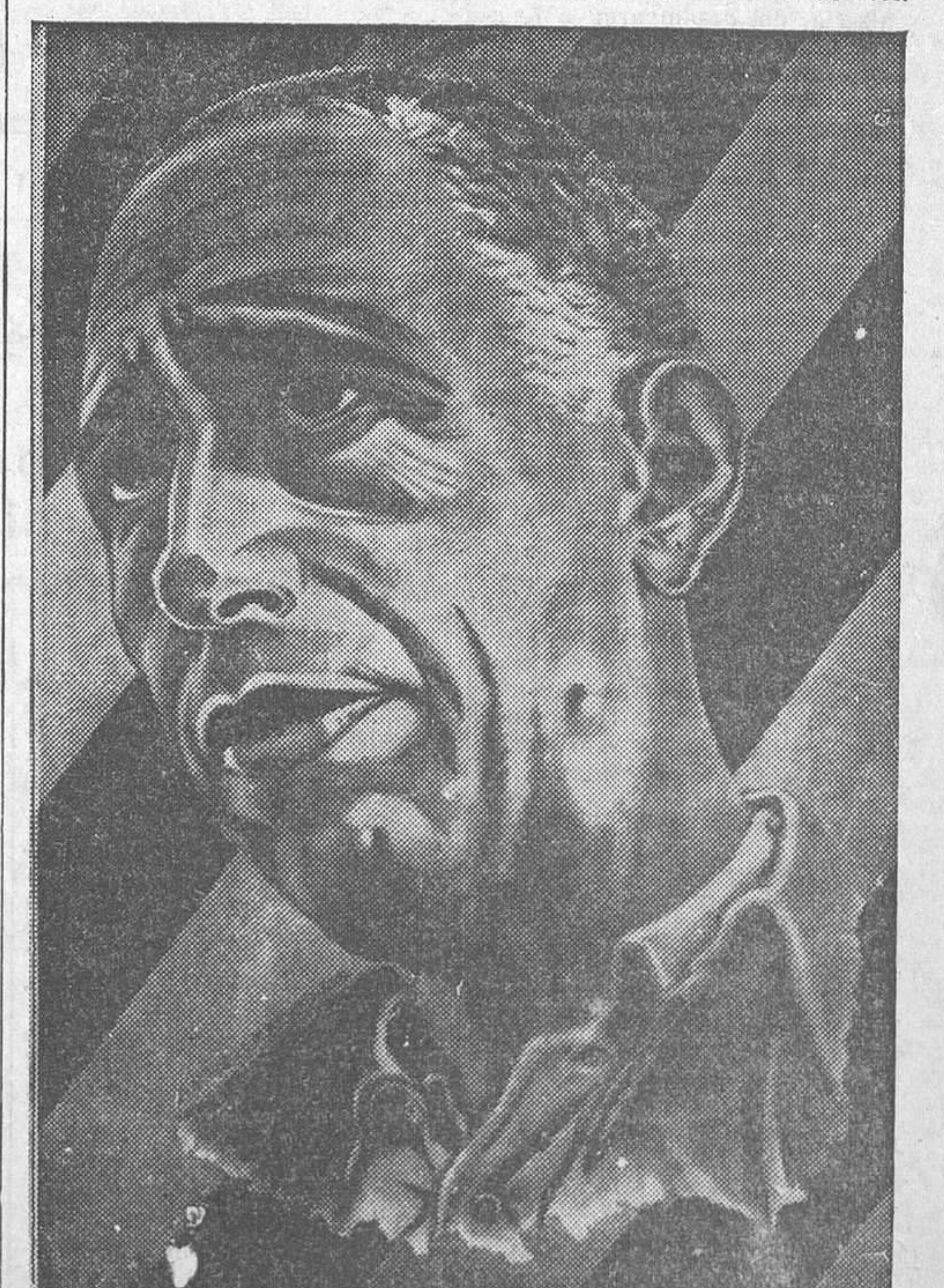
Un cartel electoral simbólico.—Sobre el fondo de la bandera de Cataluña destaca el rostro de Luis Companys, encerrado en prisión por defender las esencias democráticas del régimen en pie

Resultó muerto Bautista López de Señorín, y gravísimamente herido Norberto Correa Taberes, de nacionalidad portuguesa. Se teme que fallezca también.