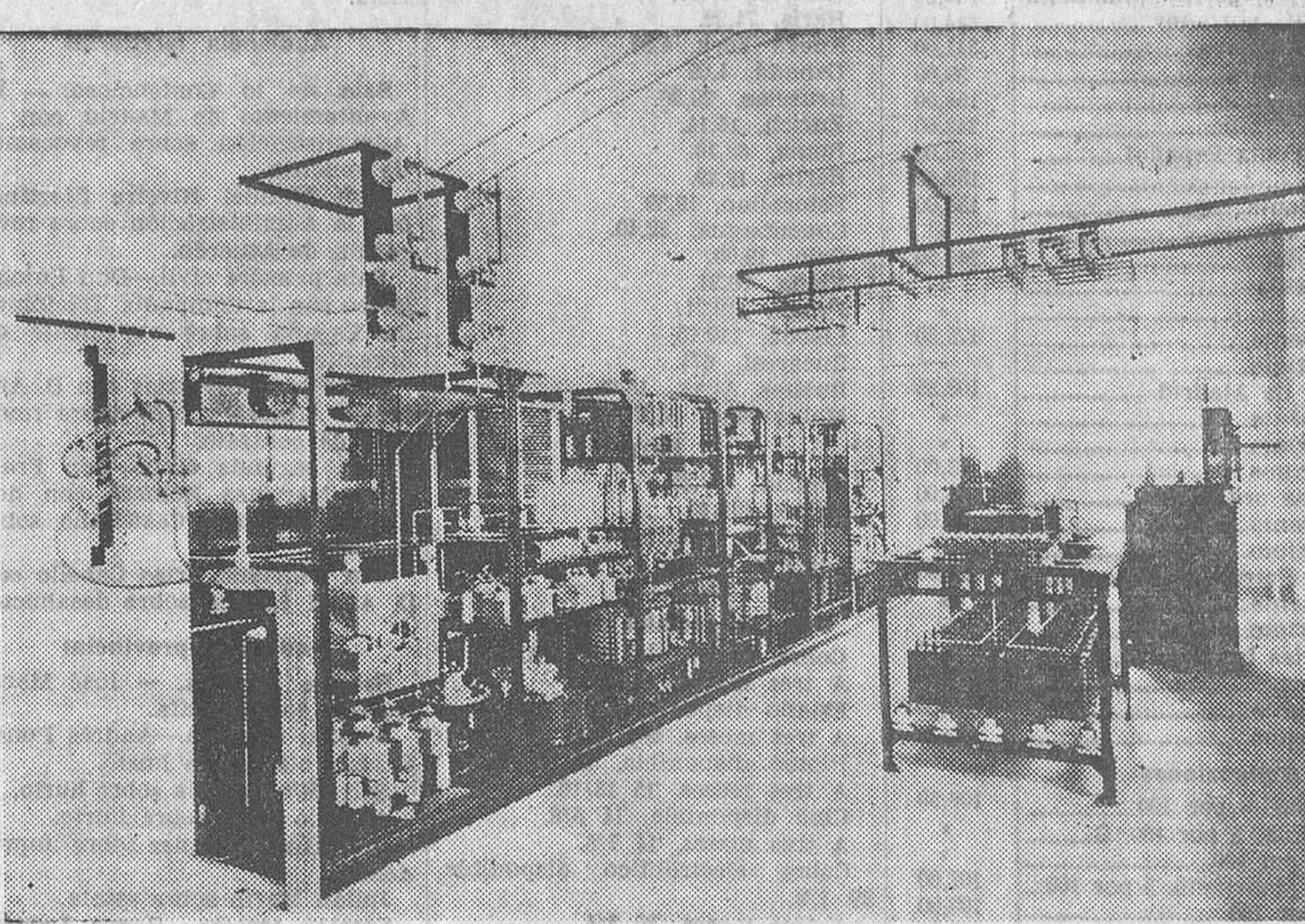
Vista del transmisor Standard Eléctrica de la nueva estación de Lisboa

La revista checa «Svět Mluvís», en su último número, expone algunos datos interesantes acerca del trabajo de las centrales encargadas de luchar contra los parásitos. Todo radioyente cuya recepción está perturbada por un aparato eléctrico puede presentar una queja en una oficina de Telégrafos. Seguidamente se hace una encuesta a fin de determinar la causa del parásito. Cuando se ha localizado el centro perturbador, se avisa al propietario, indicándole la manera de suprimir los parásitos. Hasta la fecha, la central anti-perturbadora ha trabajado con mucho éxito.