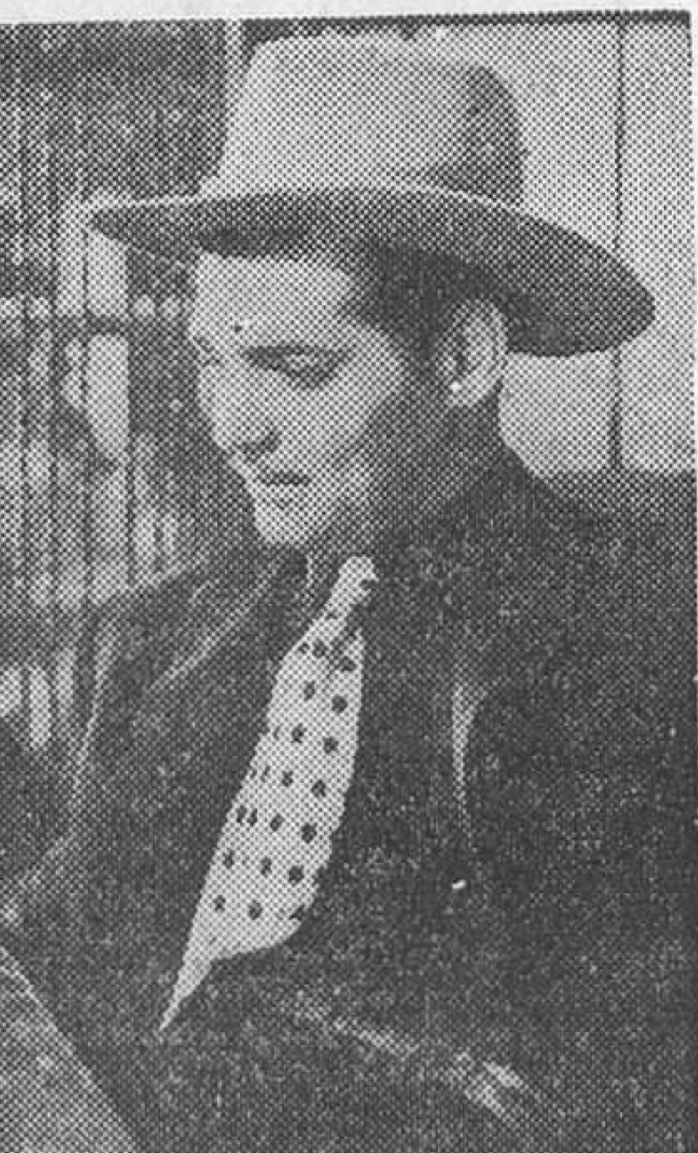
Clark Gable en «La llamada de la selva», film Artistas Asociados que se estrenará mañana en el Capitol

No se asusten, pues, los lectores ante el grito de batalla de «Abajo los hombres!» que lanza un ejército de mujeres. Porque en este siglo, al igual que en los tiempos de Adán, el sexo débil es el sexo débil, y así vemos que en los últimos metros del film aquella colección de belldades que an-