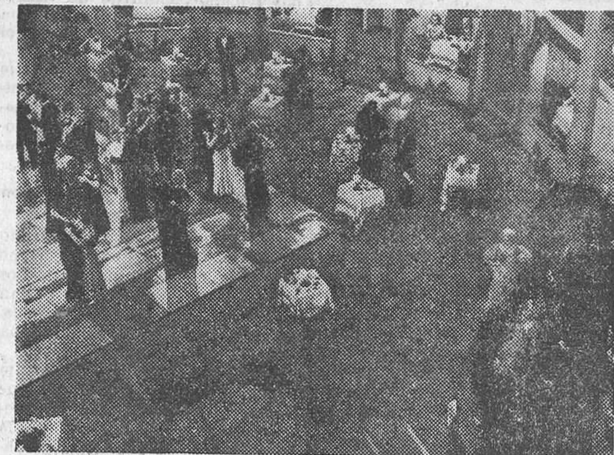
Un aspecto del cabaret que se construyó por Selecciones Capitolio para el film «El secreto de Ana María», enorme éxito del cine Rialto

Alemania, Canadá, Rumania, la India y los Estados Unidos de América contribuyeron con talentos para llenar los principales papeles de «Crimen y castigo», la