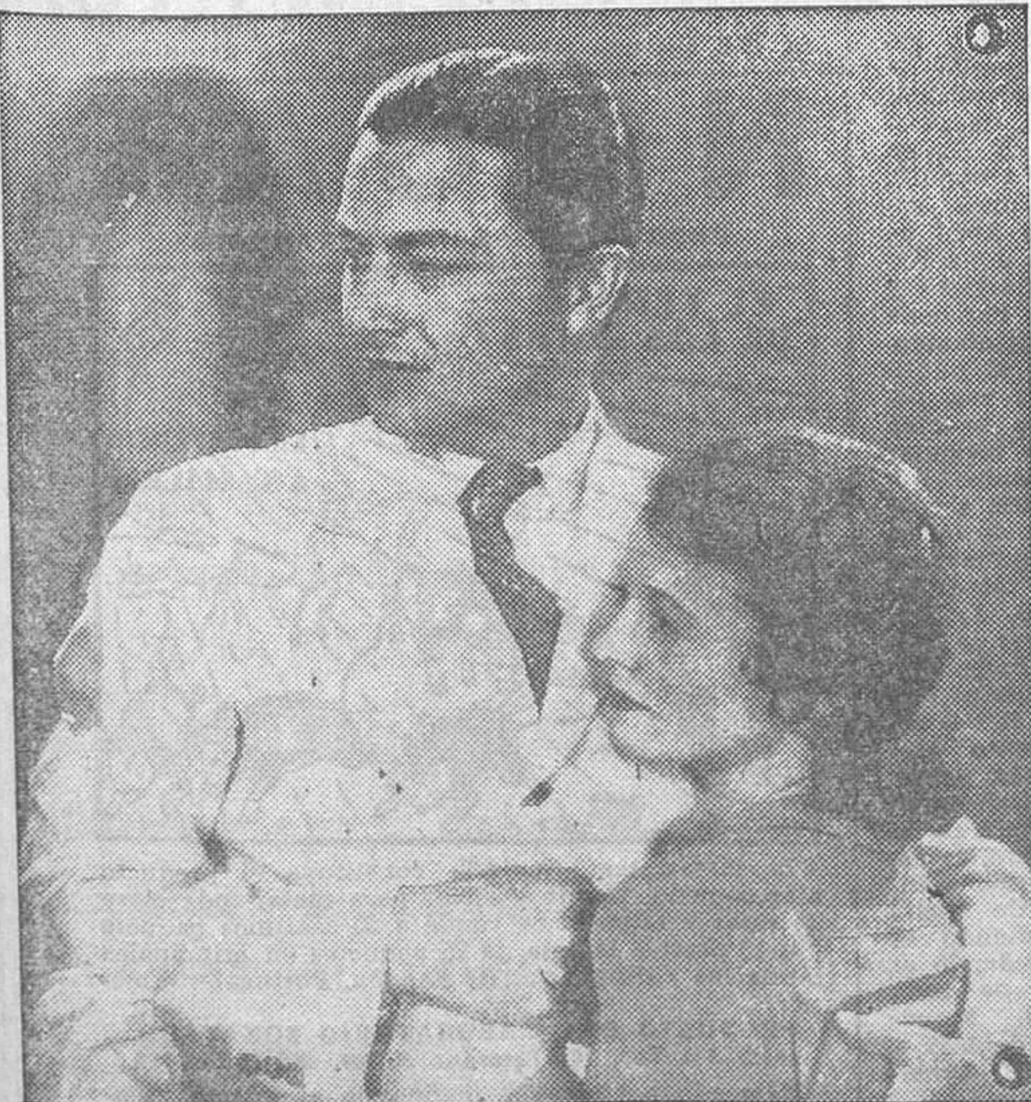
Janet Gaynor en «Carolina», producción Fox que el lunes se presentará en la Opera