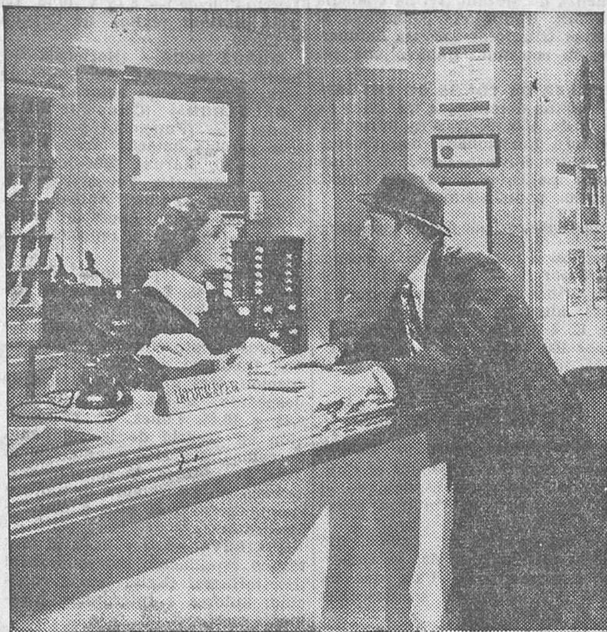
Una escena de «Viudas habaneras», film Warner Bros que el lunes se estrenará en Rialto

En detalle podrían destacarse de esta cinta, la más perfecta en su género hasta ahora, el tormento en el acantilado y los recios caracteres de la mujer y el niño,