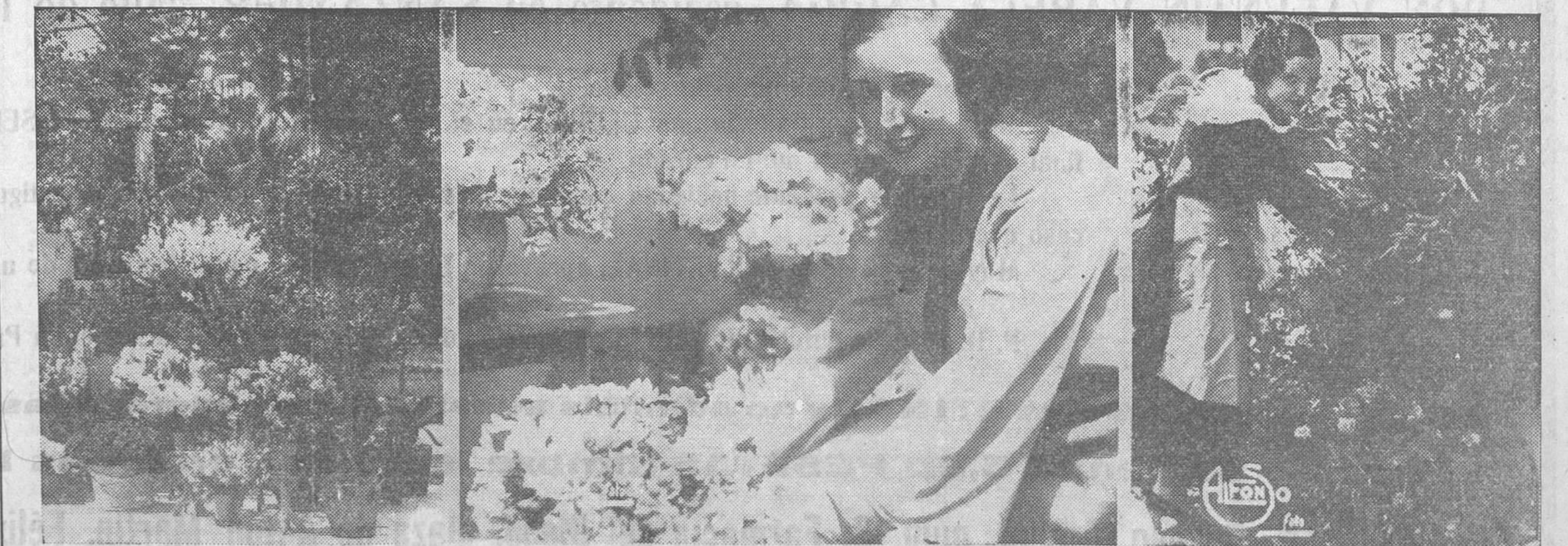
Varios aspectos de la Exposición de flores, inaugurada ayer en Recoletos