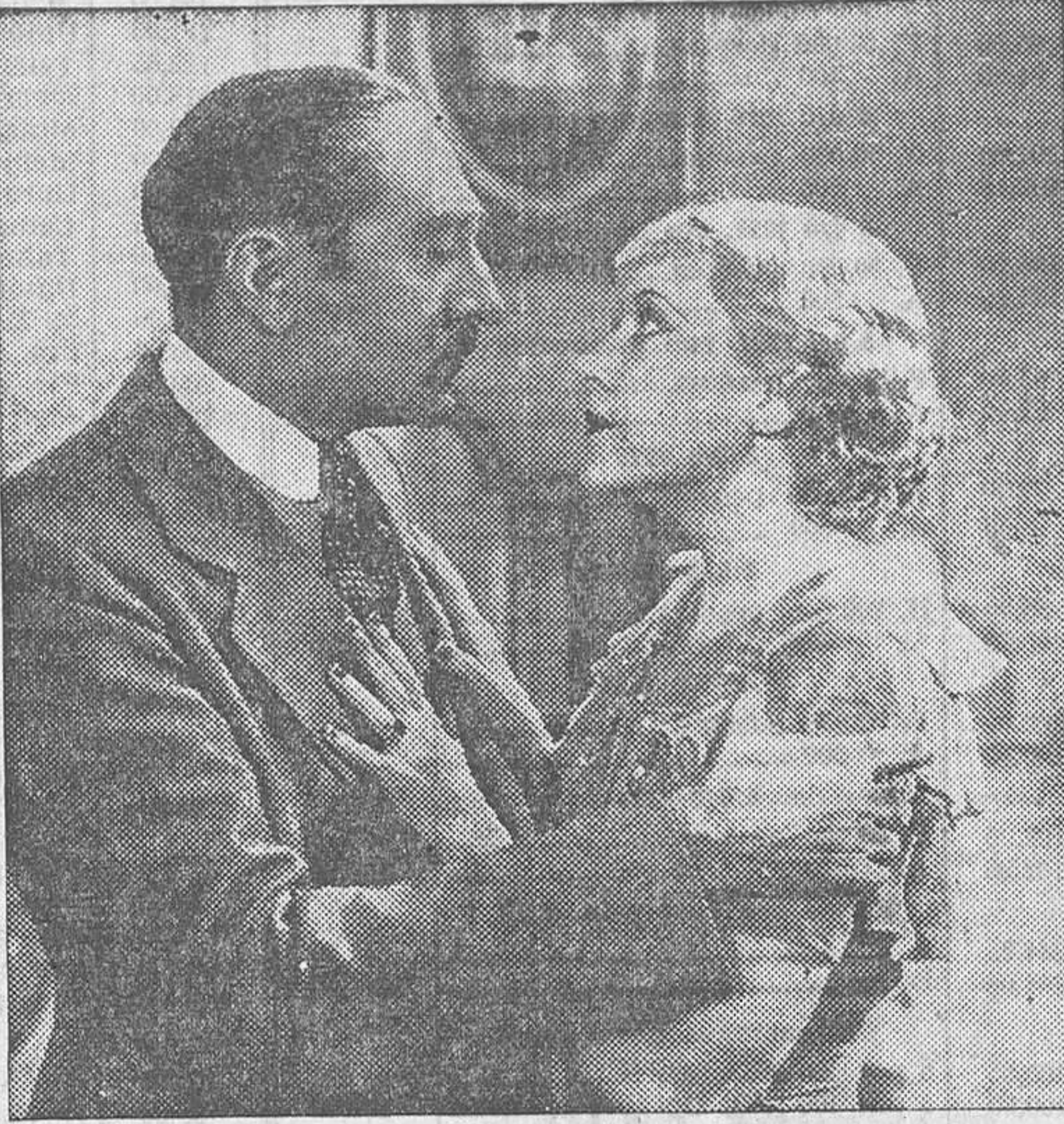
Adolphe Menjou en «Facil de amar», película Warner Bros que el lunes se estrenará en la Prensa

NO APTA MAS QUE PARA SENORITAS DEL AÑO 1935