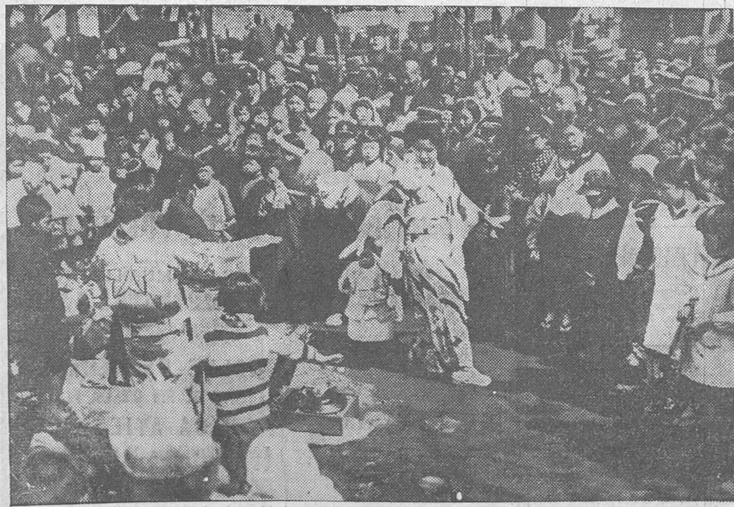
En el Japón la llegada de la primavera se celebra solemnemente. Bailarines en la danza nueva el «Sakura-Ondo»