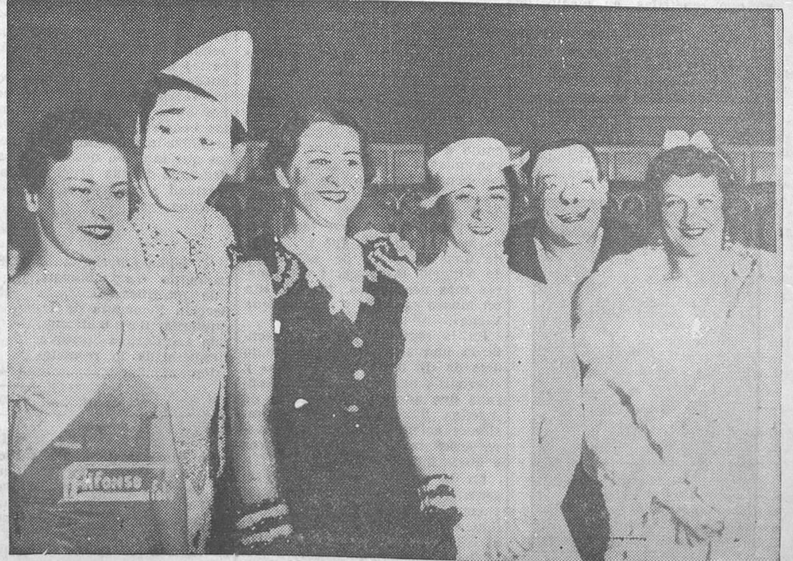
Principales artistas de la nueva compañía que se presentó anoche en el circo de Price