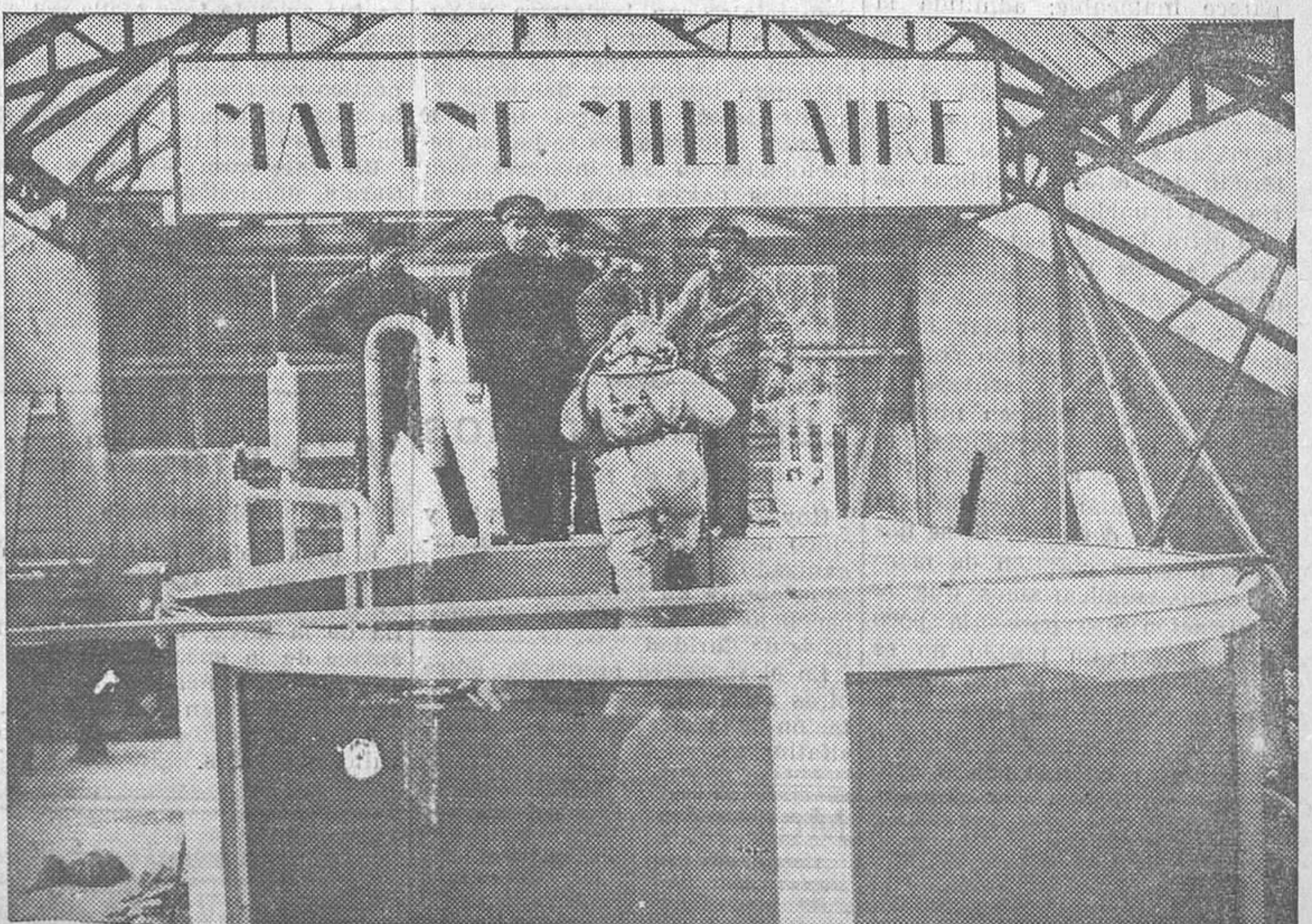
PREPARATIVOS DEL SALON NAUTICO DE PARIS.—Ensayo de un buzo en el stand de la Marina militar