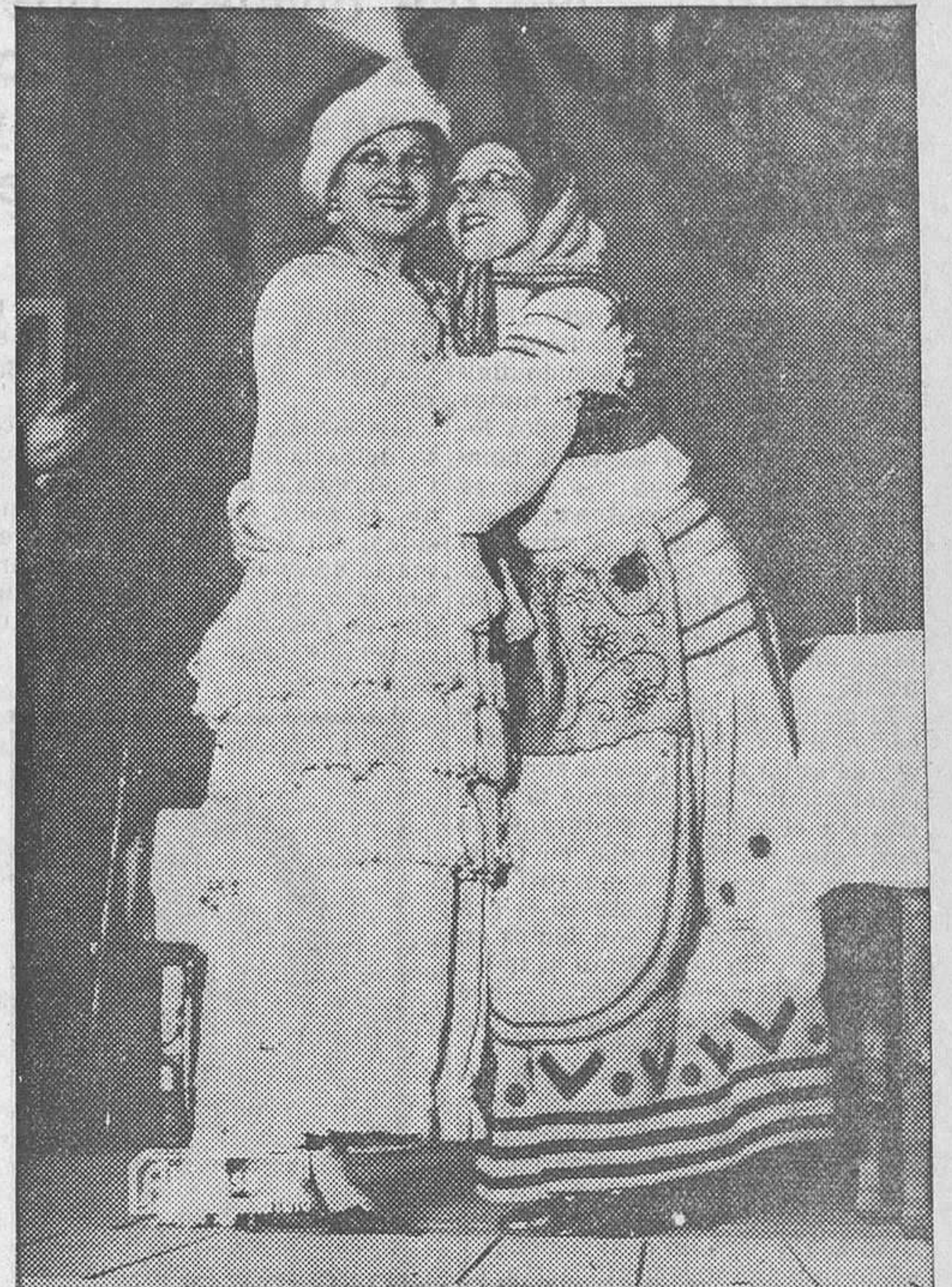
Una escena de la zarzuela 'No me olvides', de Romero, Fernández Shaw y maestro Sorozábal, estrenada anoche en la Zarzuela