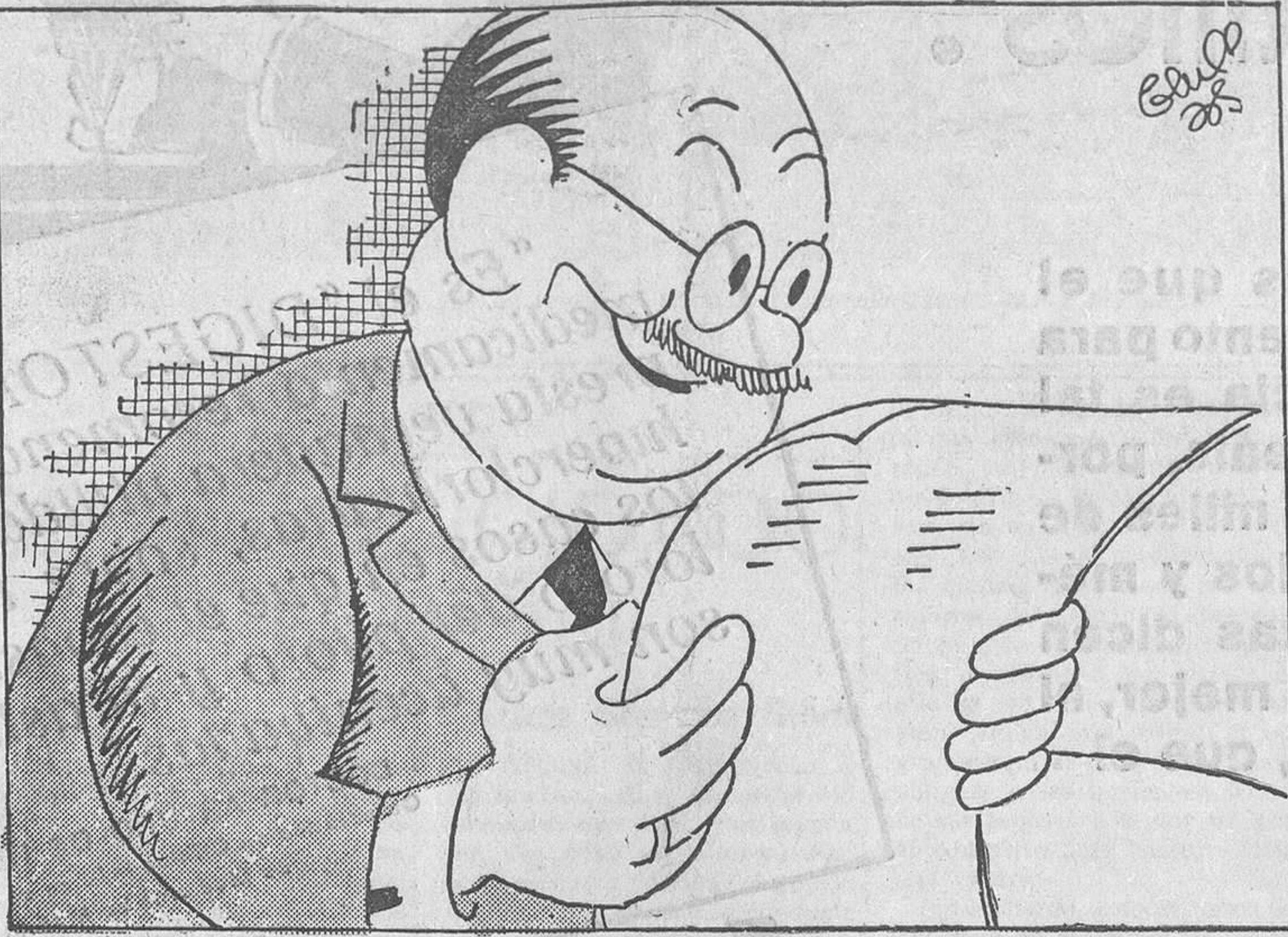
ESPECTACULOS, ESPECTACULOS, por Bluff

Se nos figura que el Gobierno debería meditar sobre lo que apuntamos. Ahí tiene un sector de actividades en que desenvolverse con eficacia para la concordia.