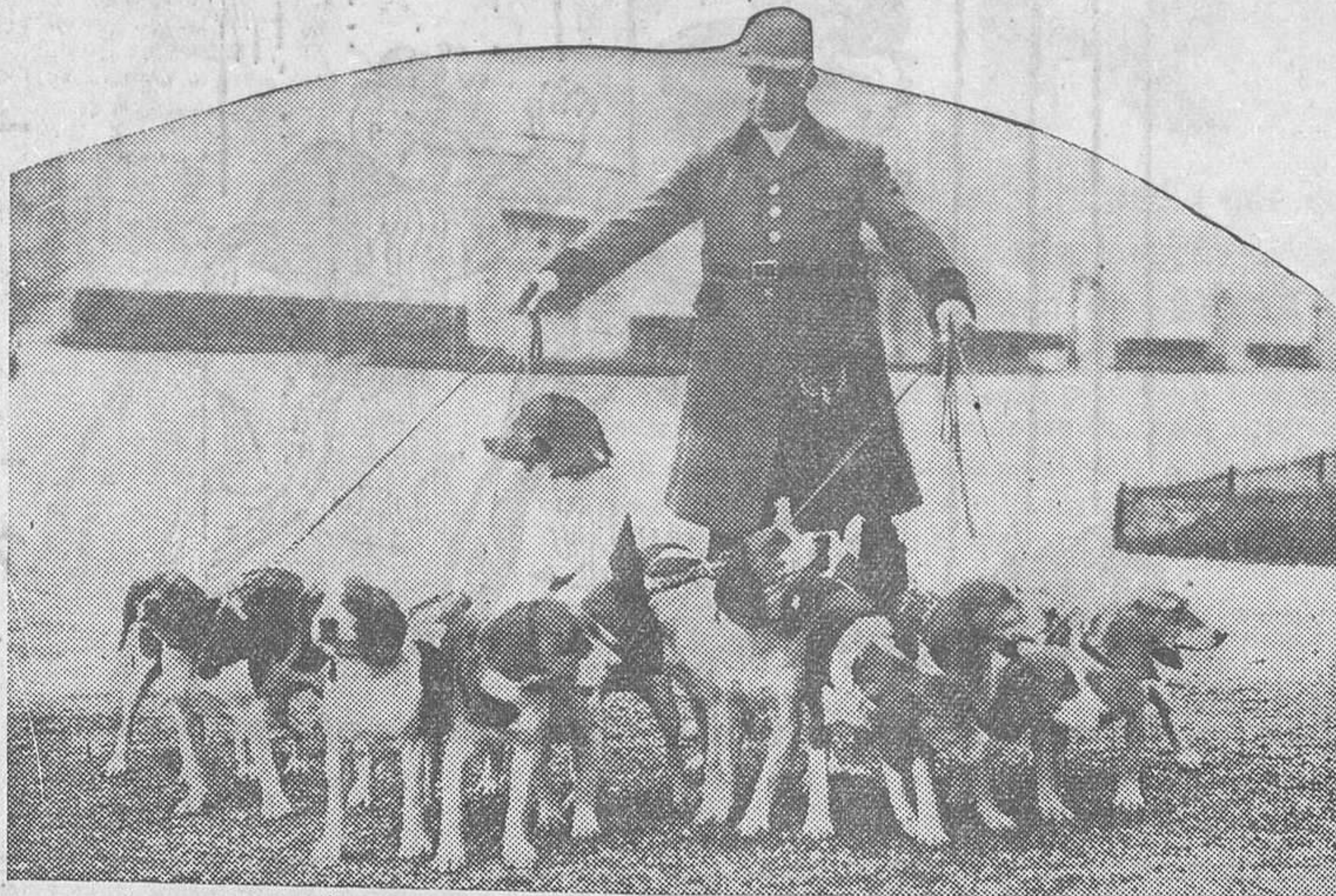
Grupo de perros que figura en la Exposición del Palacio de los Deportes, de París, que se ha inaugurado recientemente

Shanghai, 20.—La revuelta, que estaba aislada en la provincia de Szechuan, se está extendiendo, según informes telegráficos, y amenaza ahora a Chengtu. Unos cien misioneros extranjeros que estaban en Szechuan se cree que están ahora en camino hacia Chinking, donde podrán ponerse bajo la protección de los cañoneros que patrullan en el río Tangtze. Se sabe que Chang-Kai-Shek está con fuertes tropas en la zona de los disturbios; pero hasta ahora no se han recibido noticias suyas.