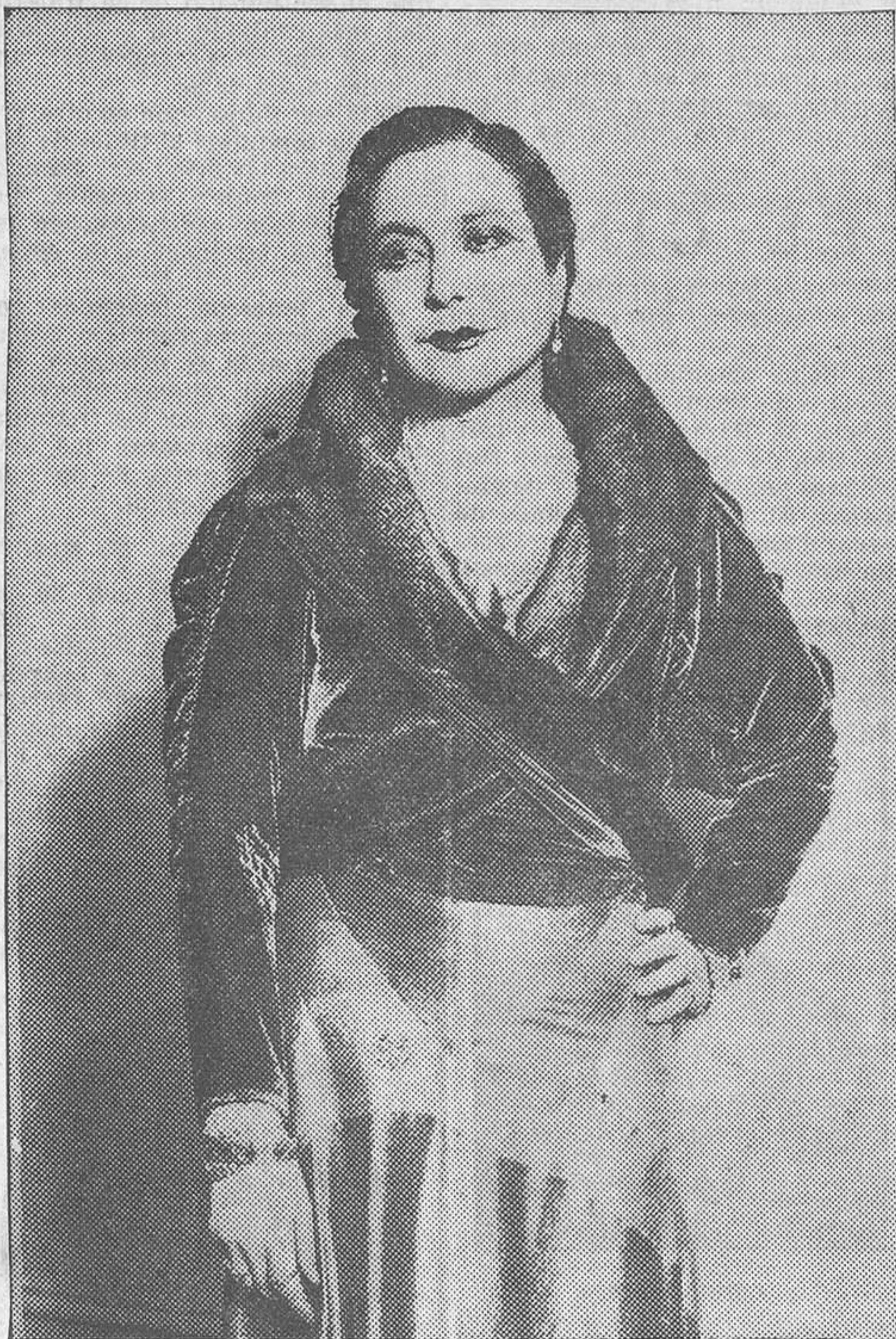
La eminente actriz Margarita Xirgu, valor y prestigio auténtico del teatro castellano, que anoche reanudó su magnífica temporada del Español