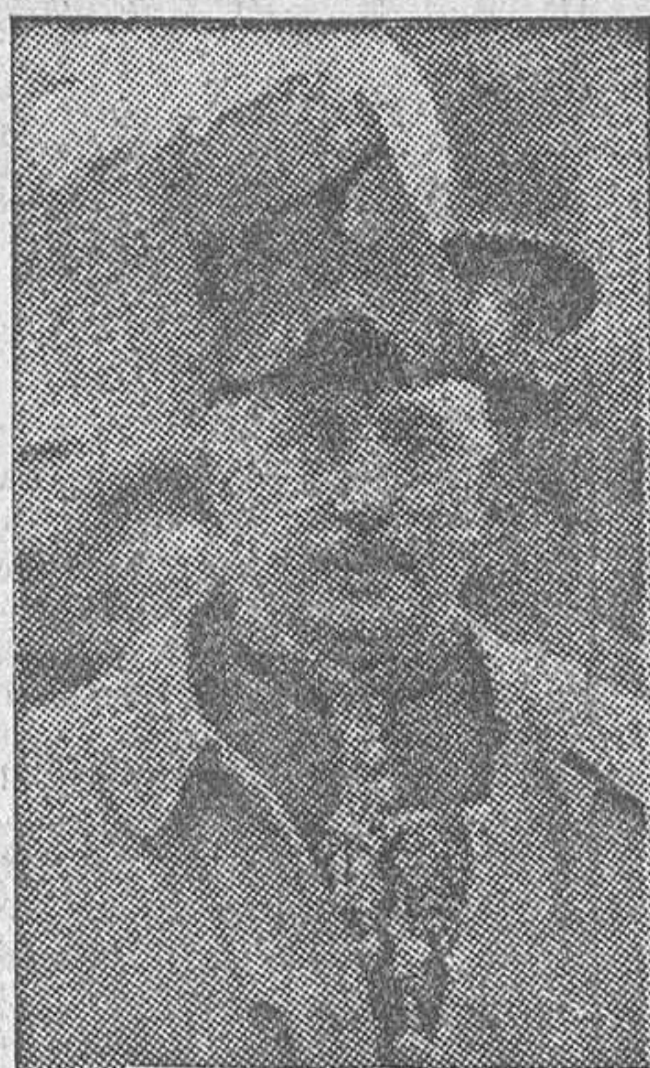
El mayor general J. E. S. Brind, a cuyo mando estarán las fuerzas internacionales que han de mantener el orden en el Sarre durante el plebiscito

Sarrebruck, 14.—La Comisión de Gobierno del Sarre ha dispuesto que toda persona que desee entrar en el territorio del Sarre entre el