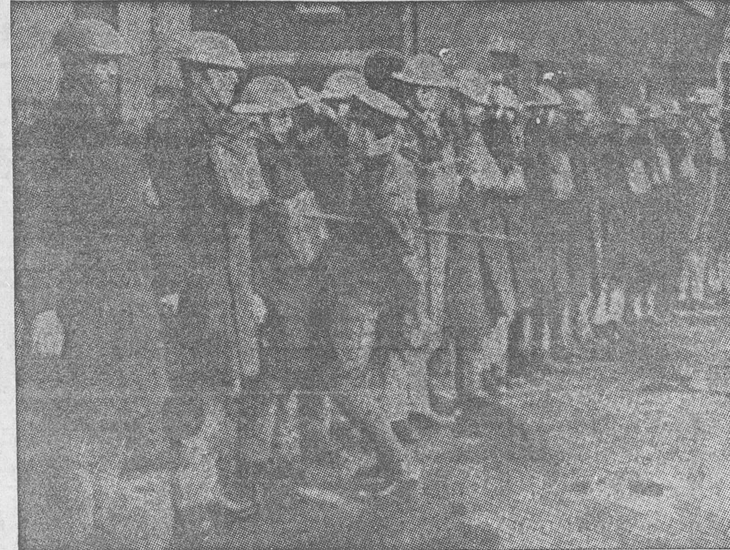
Un destacamento de tropas inglesas de Egipto ha salido de la Gran Bretaña para Calais y con destino al Sarre, después de ser escrupulosamente seleccionadas y revistas por sus oficiales

Los jefes de las fuerzas llegan a la capital de la región