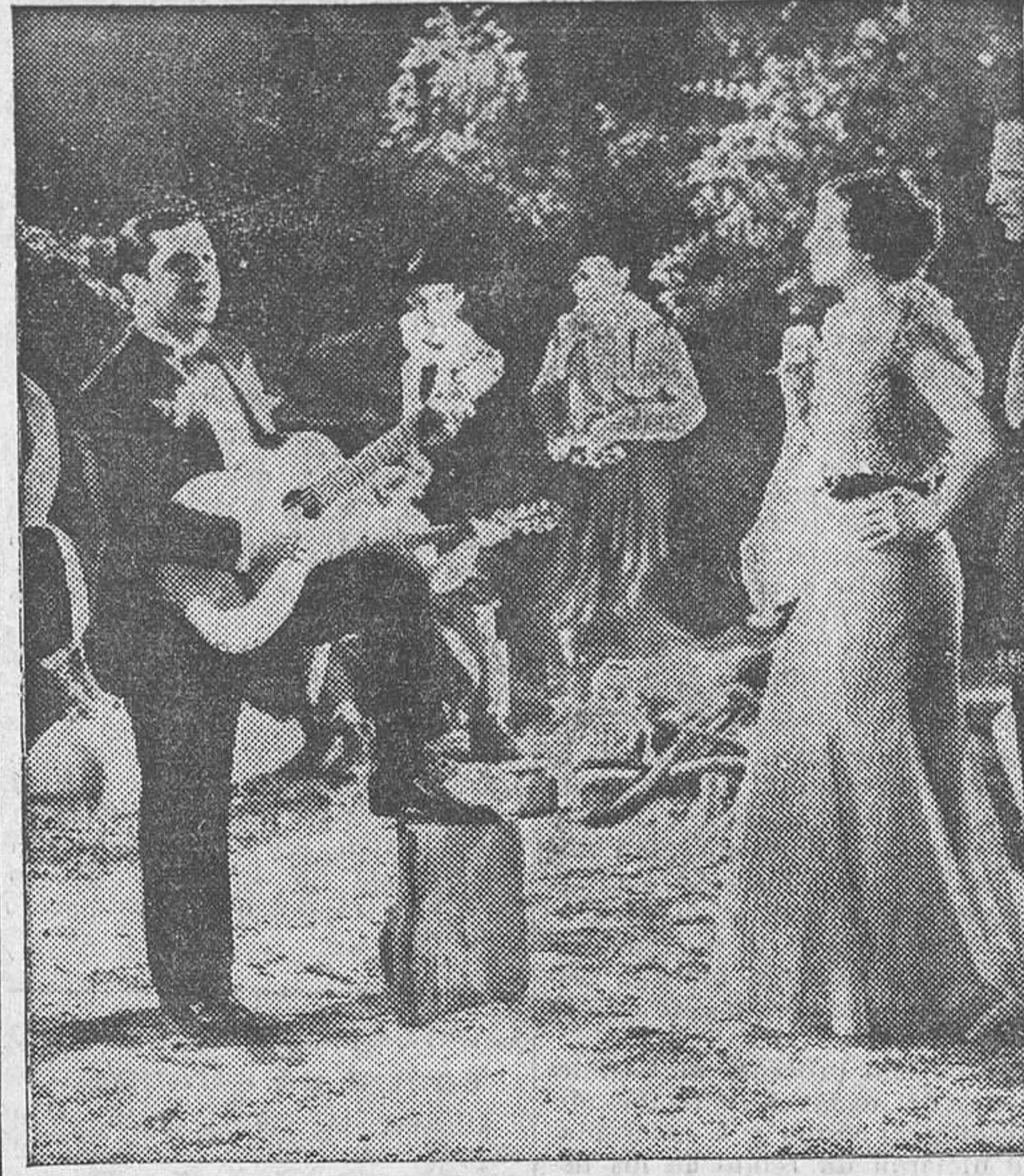
Carlos Gardel y Anita Campillo en «Cuesta abajo», film Paramount que se proyecta con gran éxito en Rialto