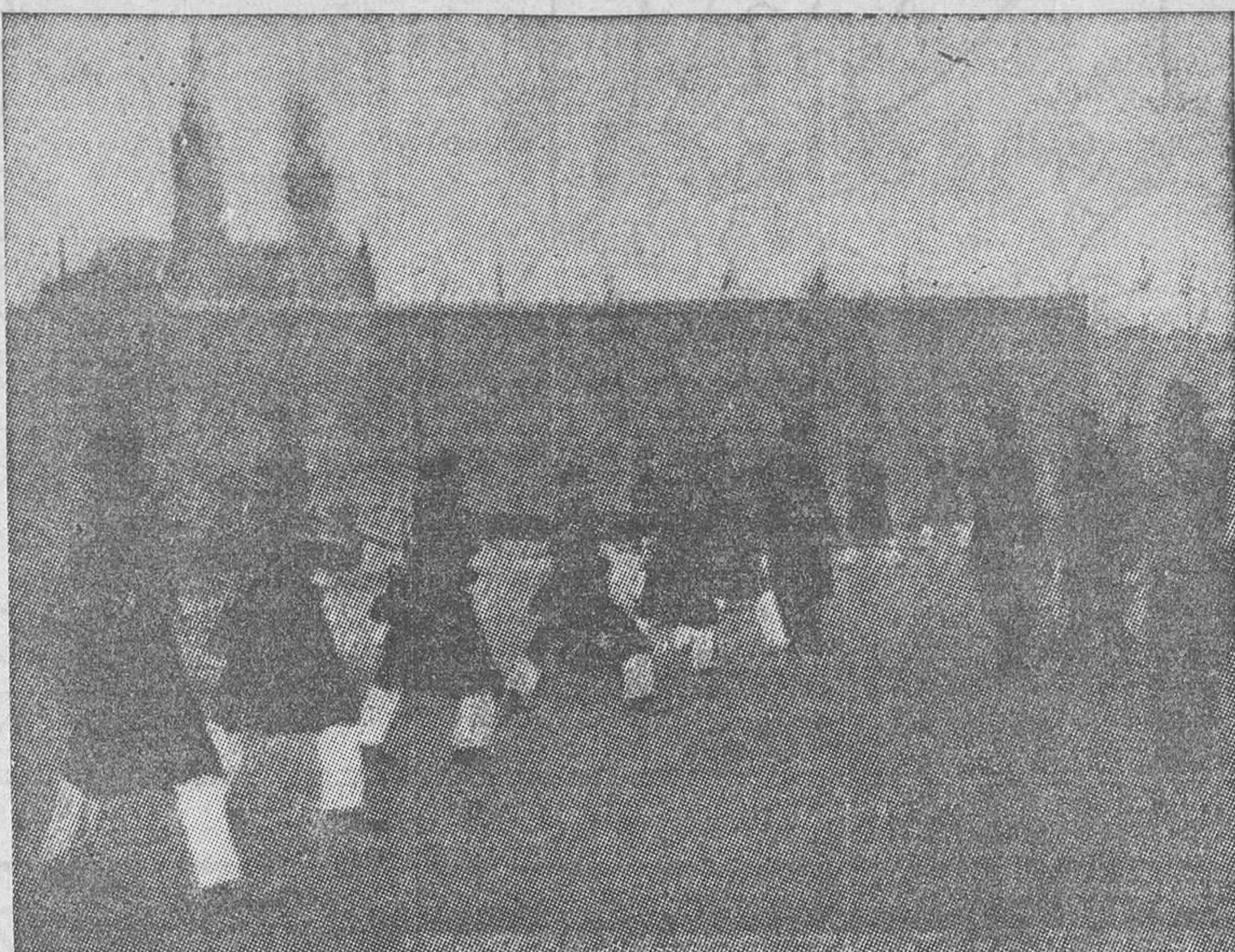
En Rotterdam, antes de salir para Sarrebruck, las tropas holandesas que han de asegurar el orden en el Sarre hacen ejercicios militares en el cuartel, pensando acaso que su actuación pueda ser francamente guerrera