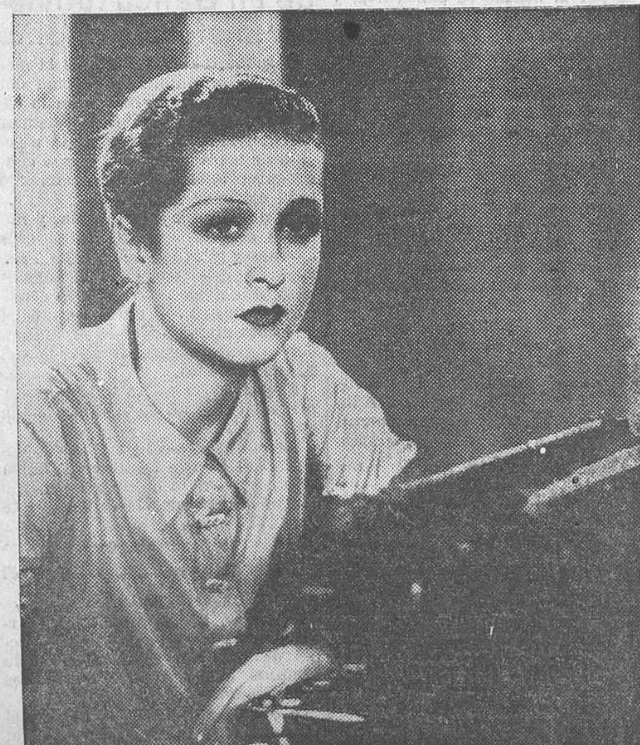
Danielle Darrieux, protagonista de «Curvas peligrosas», producción Filmófono que el lunes se estrenará en la Prensa