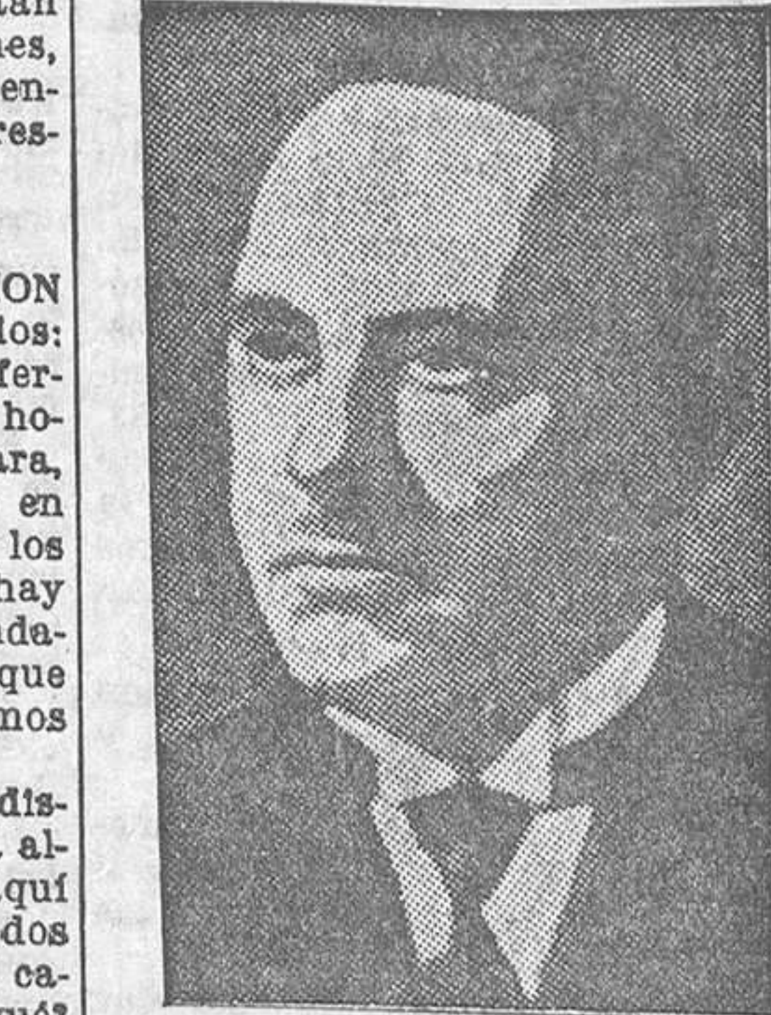
Roberto Minger, consejero federal, elegido presidente de la Confederación suiza para 1935. Los dos filiputenses más pequeños del Mundo acaban de casarse en Londres, causando el asombro de la gente la pareja de enanos, pues la desposada tiene 90 centímetros, y su esposo, 99.

La presidencia acoge con singular efusión las elocuentes pala-