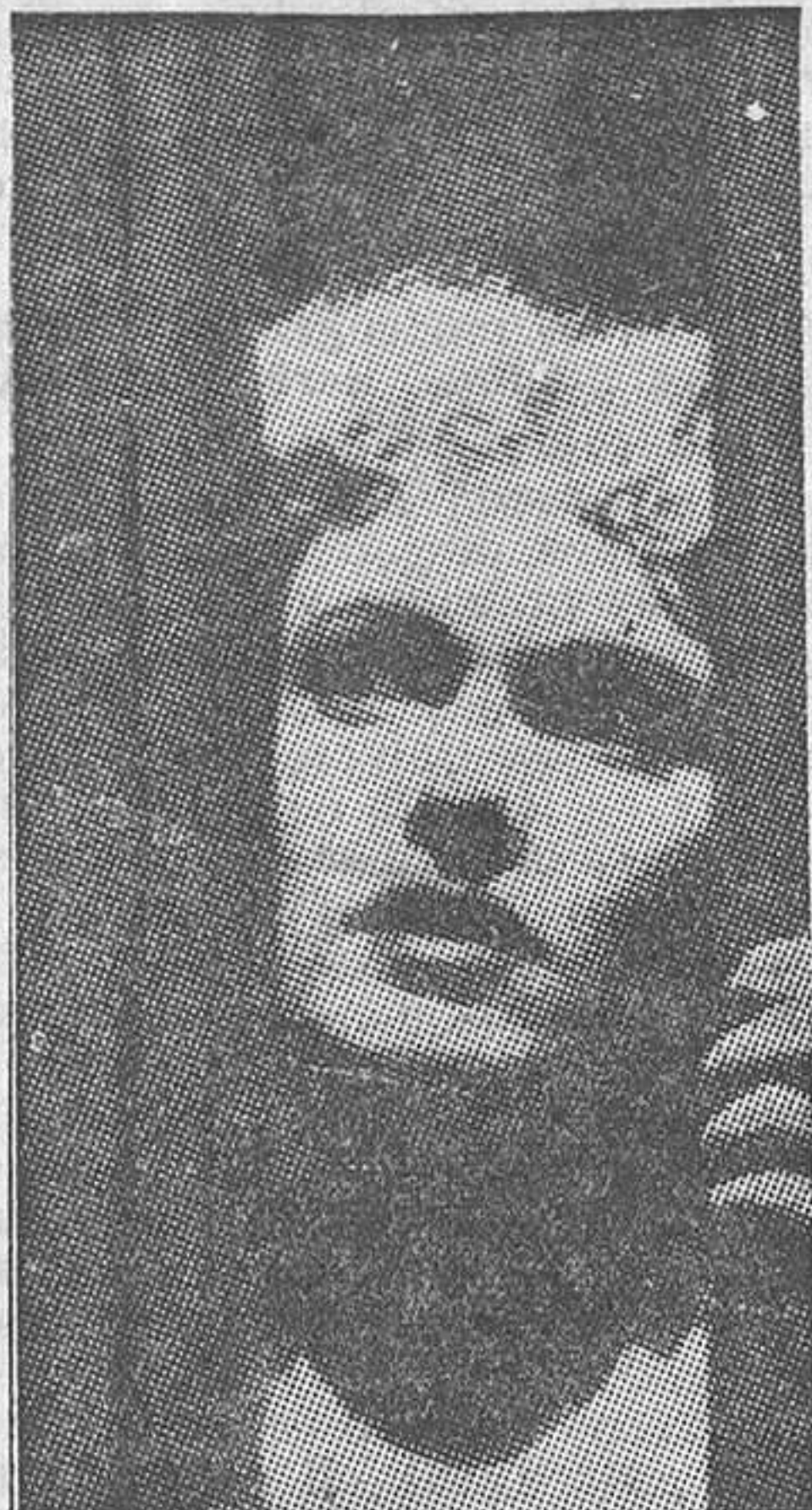
Anna Neagle, protagonista de «Neil Gwyn, el amor de Carlos II», película de la Meyler Films que se proyecta con gran éxito en el Alkazar