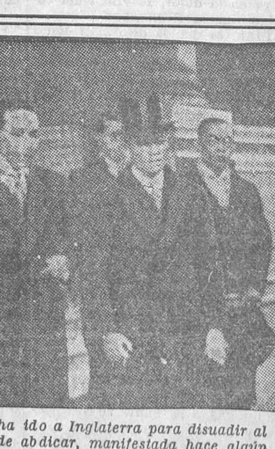
Delegación siamesa que ha ido a Inglaterra para disuadir al rey de Siam de su idea de abdicar, manifestada hace algún tiempo, por estar menoscabada su regia autoridad.