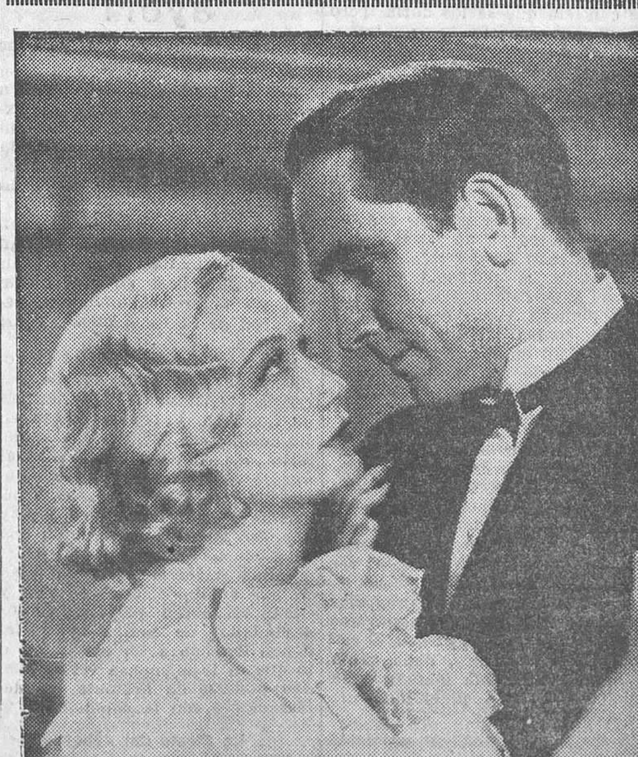
Myriam Hopkins y Fredric March en «Una mujer para dos», film Paramount que el lunes se estrenará en el Palacio de la Música