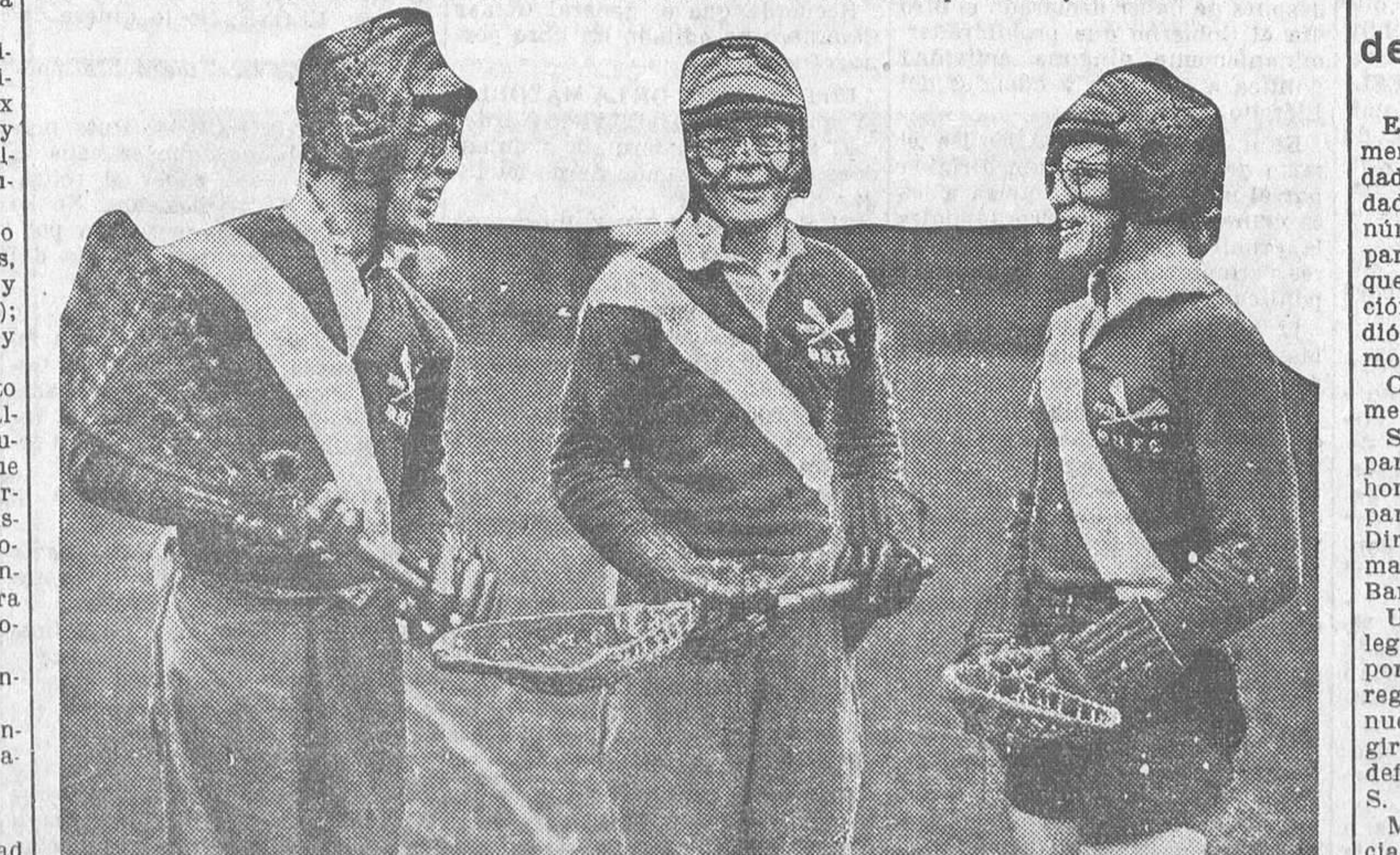
Preparados para una batalla campal? Casi, casi... Pero no son sino simples jugadores de «acroses», cuyo campeonato se acaba de jugar en Oxford entre los estudiantes de la Universidad de dicha ciudad y los de la Universidad Cambridge. Ganaron estos últimos por 10 goles contra seis

REDACCION, ADMINISTRACION Y OFICINA DE PUBLICIDAD LA LIBERTAD MADERA, núm. 8