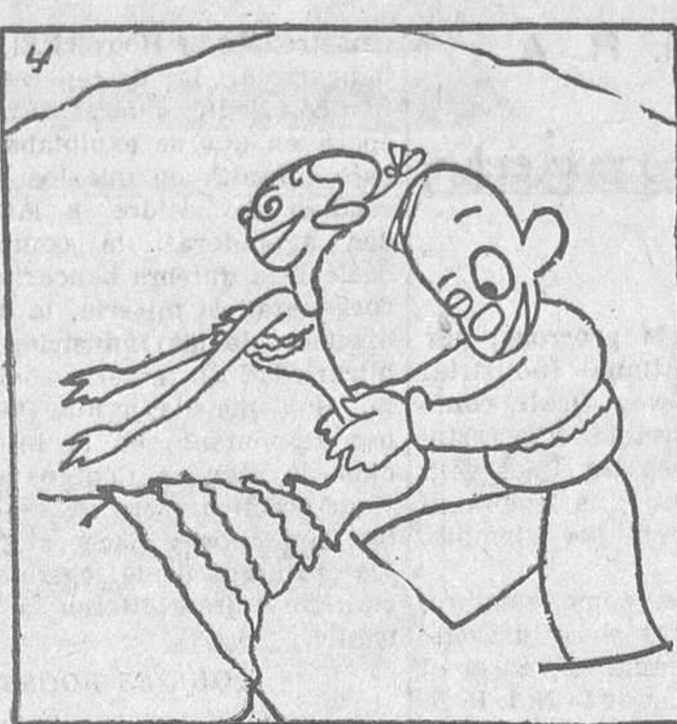
UN PASO MAS Y...