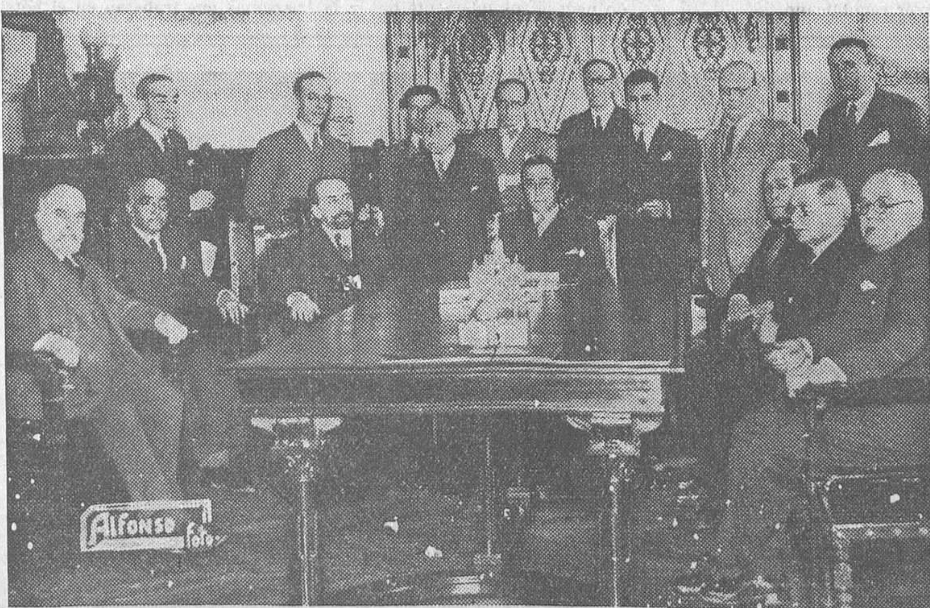
Dice una nota oficiosa del Gobierno civil que las «fuerzas vivas»—daríamos algo por una definición acerca de cuáles son las fuerzas muertas—de la ciudad se han reunido para estudiar el problema del paro obrero. De buenas intenciones...