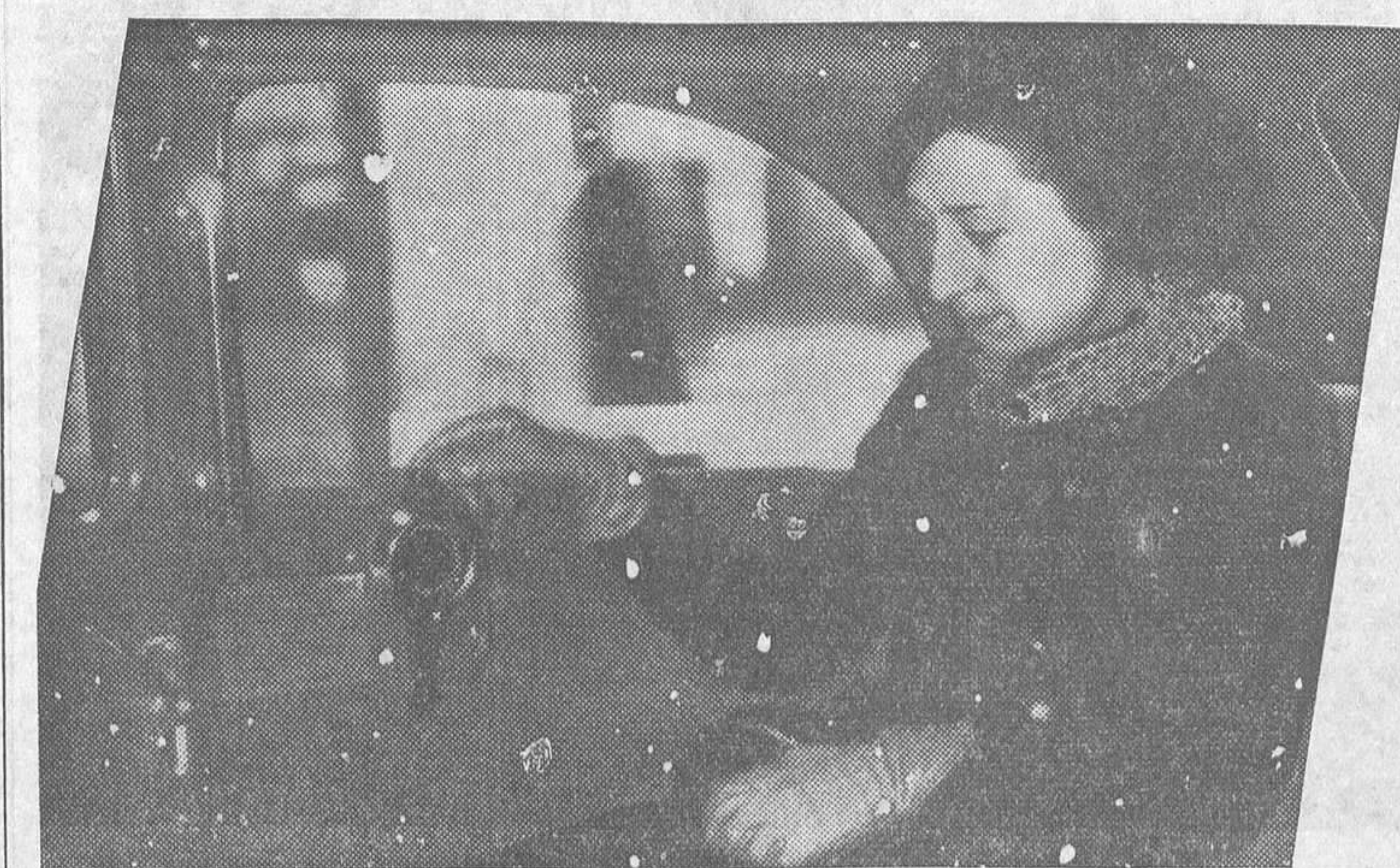
Una Compañía de «taxis» parisiense ha tenido la feliz idea de instalar aparatos de radio en los coches, con lo cual entretiene al pasajero, que mientras escucha una romanza se olvida de lo que corre el contador.