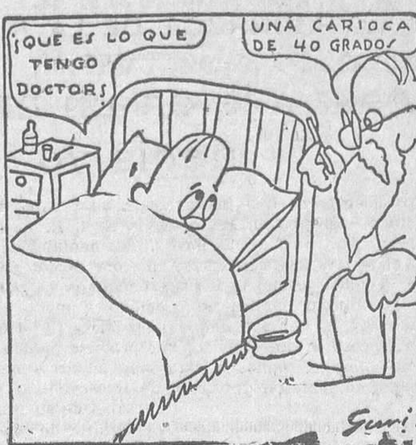
EL ULTIMO PASO