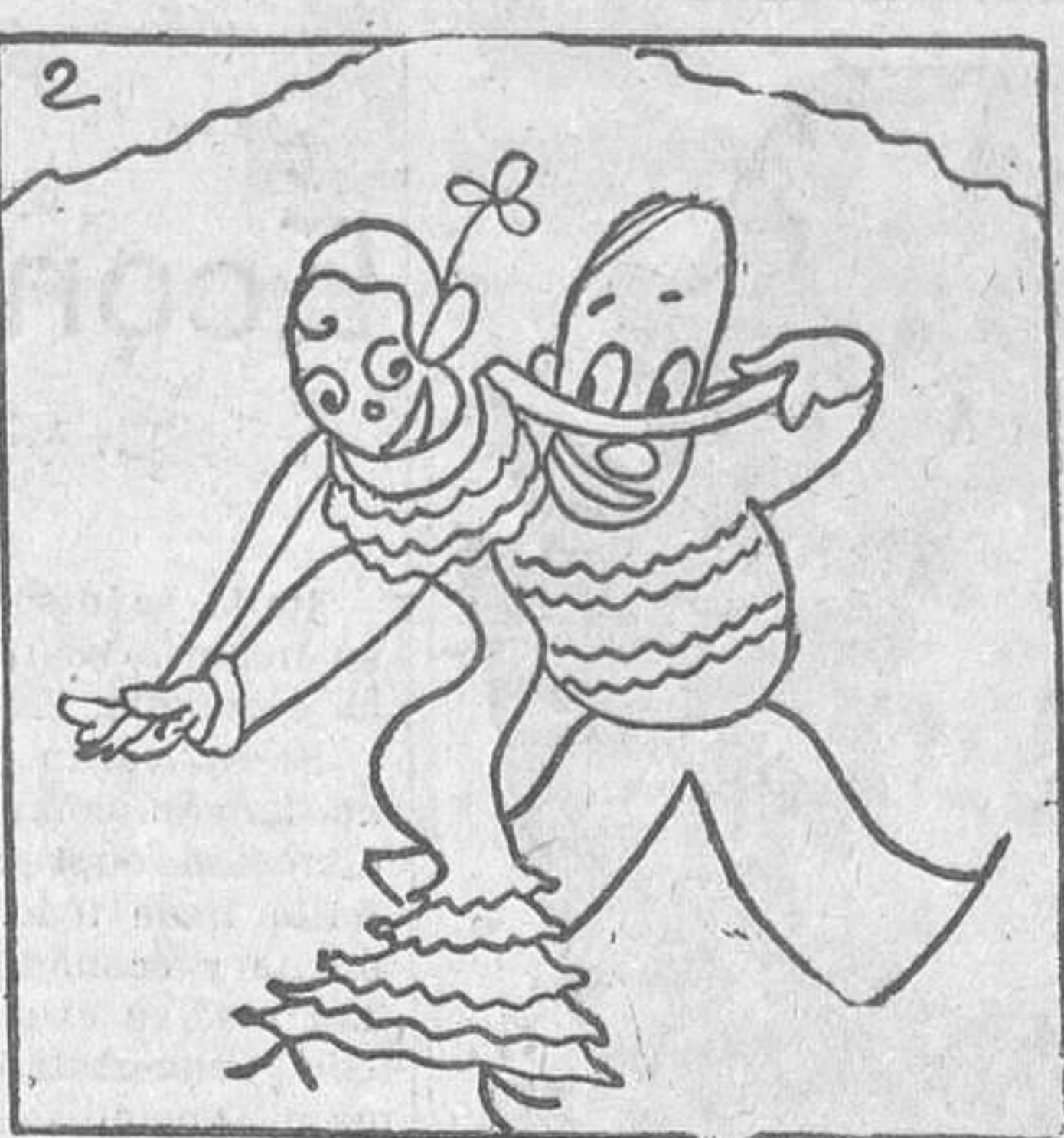
UN PASO DE CARIOCA