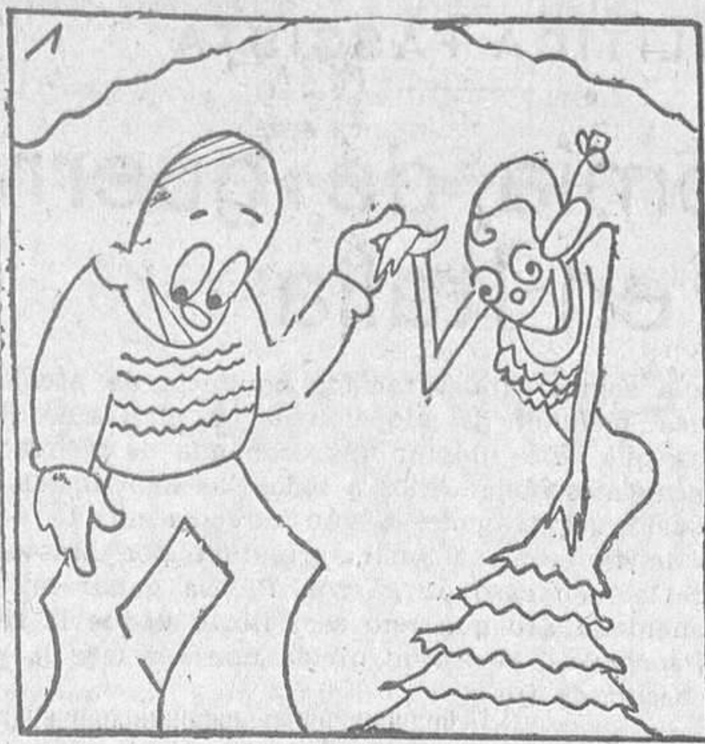
PRESENTACION DE LA CARIOCA