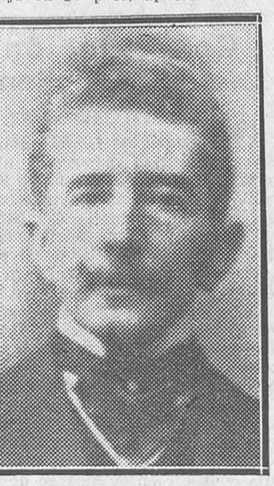
Adolfo de Sandoval

El libro que acaba de publicar el ilustre novelista Adolfo de Sandoval, con el título de «El hombre que necesita España», es, ante todo, el propósito noble de un espíritu que conoce y siente las inquietudes universales de nuestro tiempo, y que, con la vista fija en su país, aporta solución