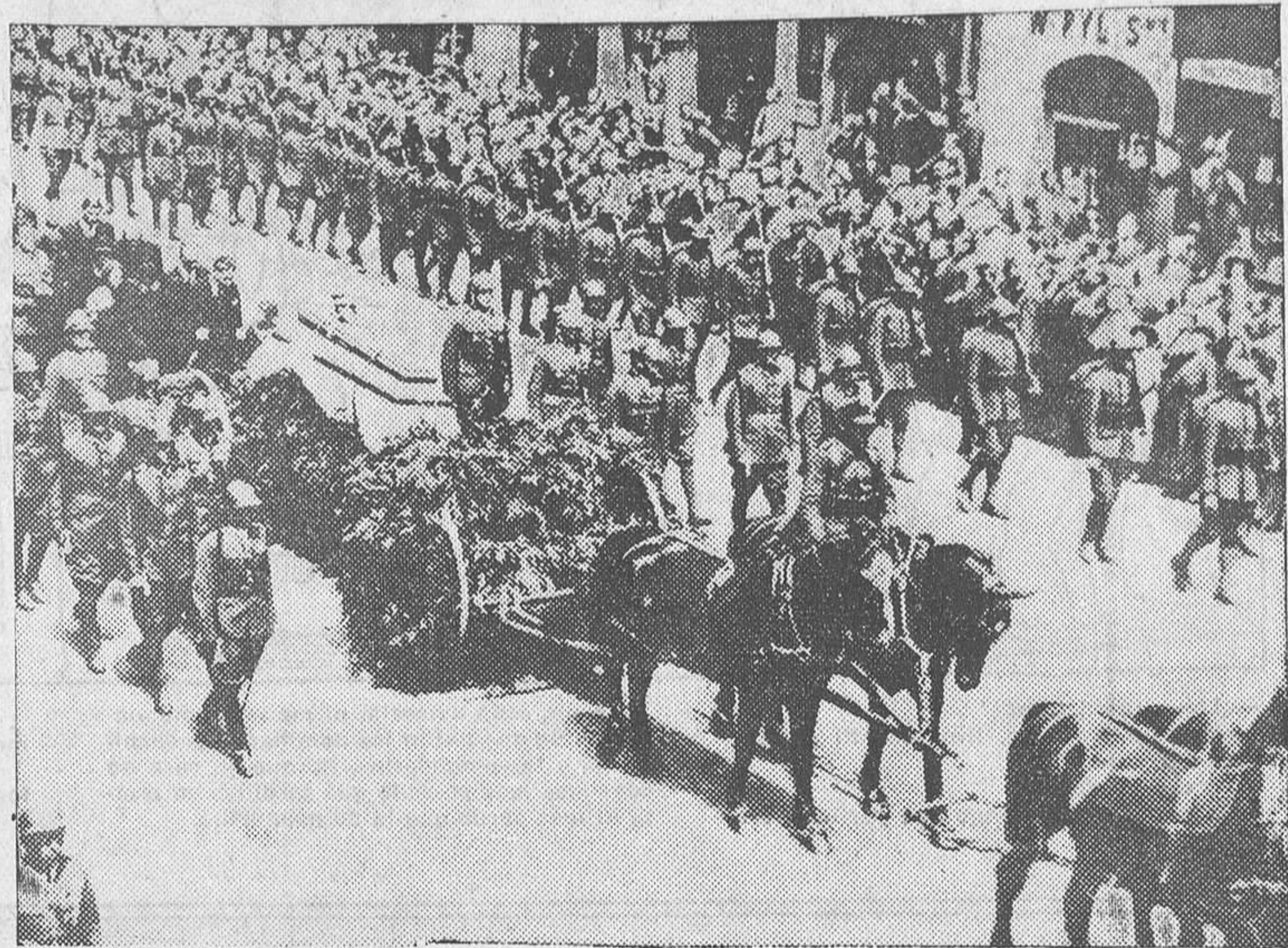
Cortejo fúnebre en el entierro del ministro Pieracki, en Varsovia, camino de la estación para trasladarse al pueblo de nacimiento de aquél, Nowy Sącz

EL FRUTO Alcanzado el éxito, Morris emprendió la propaganda de sus ideales estéticos. Viajando conoció de cerca la tristeza del problema obrero. Por ser poeta sintió la verdad, brasa sin llama de que sobre la preocupación de la belleza decorativa debe colocarse la de asegurar el pan cotidiano. Esta idea le llevó al socialismo. Stendo socialista murió. Su aspiración a las violencias, su amor al gesto bello le valieron incomprendiones y sinsabores, que no resultaron capaces de apartarlo de su fe social.