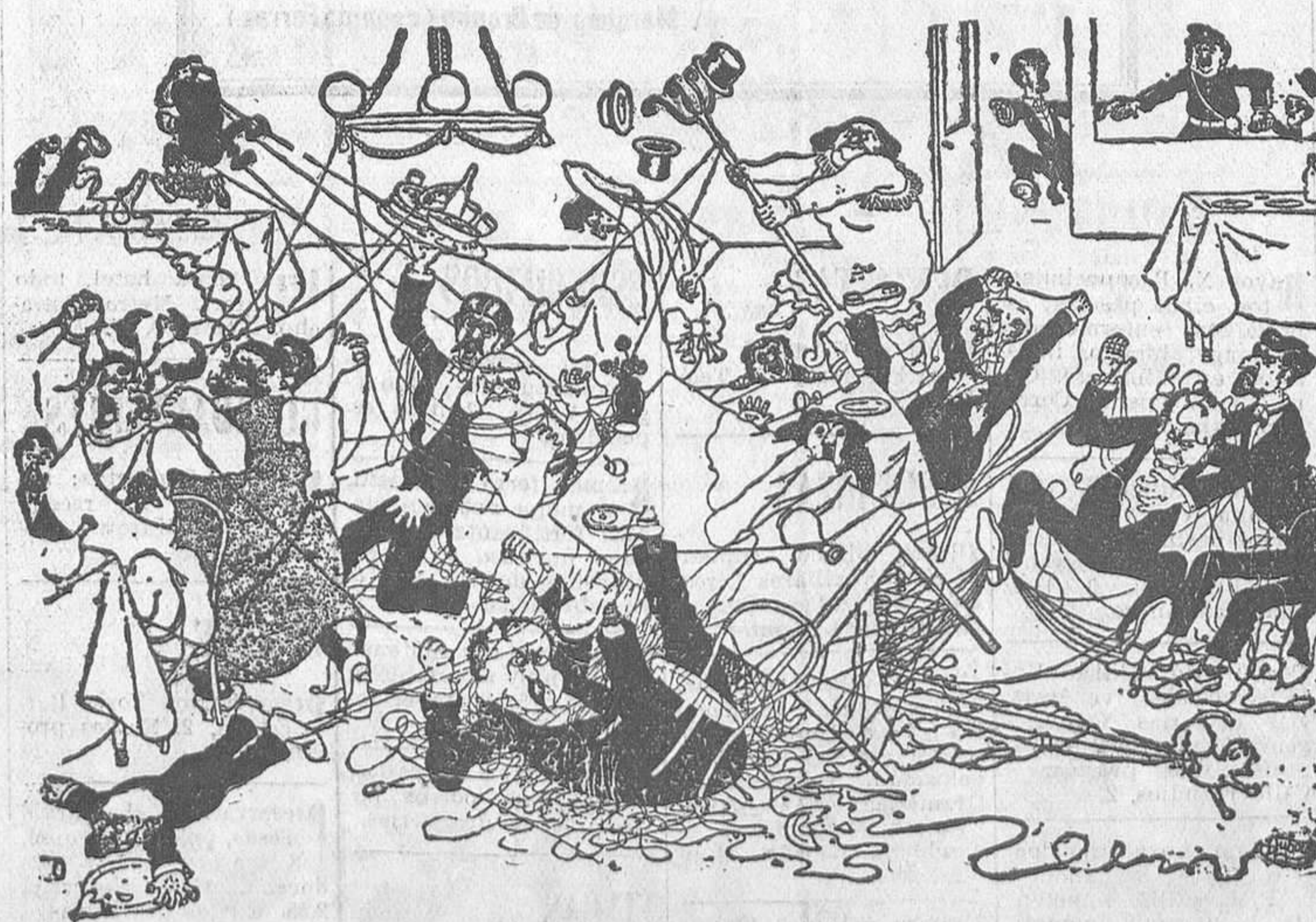
EN EL RESTAURANTE ITALIANO La catástrofe producida por el cliente que no sabía comer magarrones. («Rit. et Rac.»)