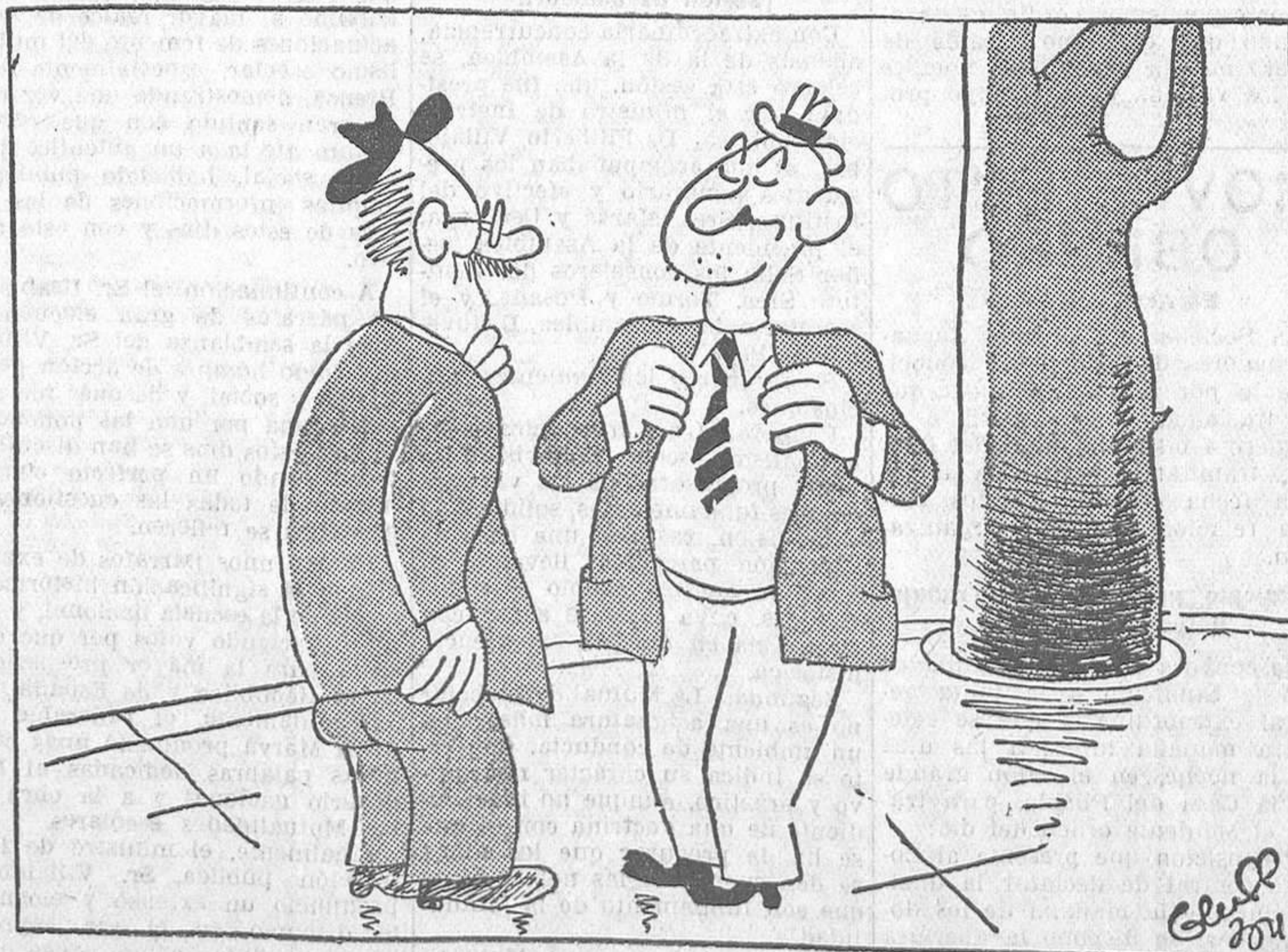
—Chico, estoy contento. Me toman por diputado. Ayer ya me dieron dos palos a la salida de un mitin.