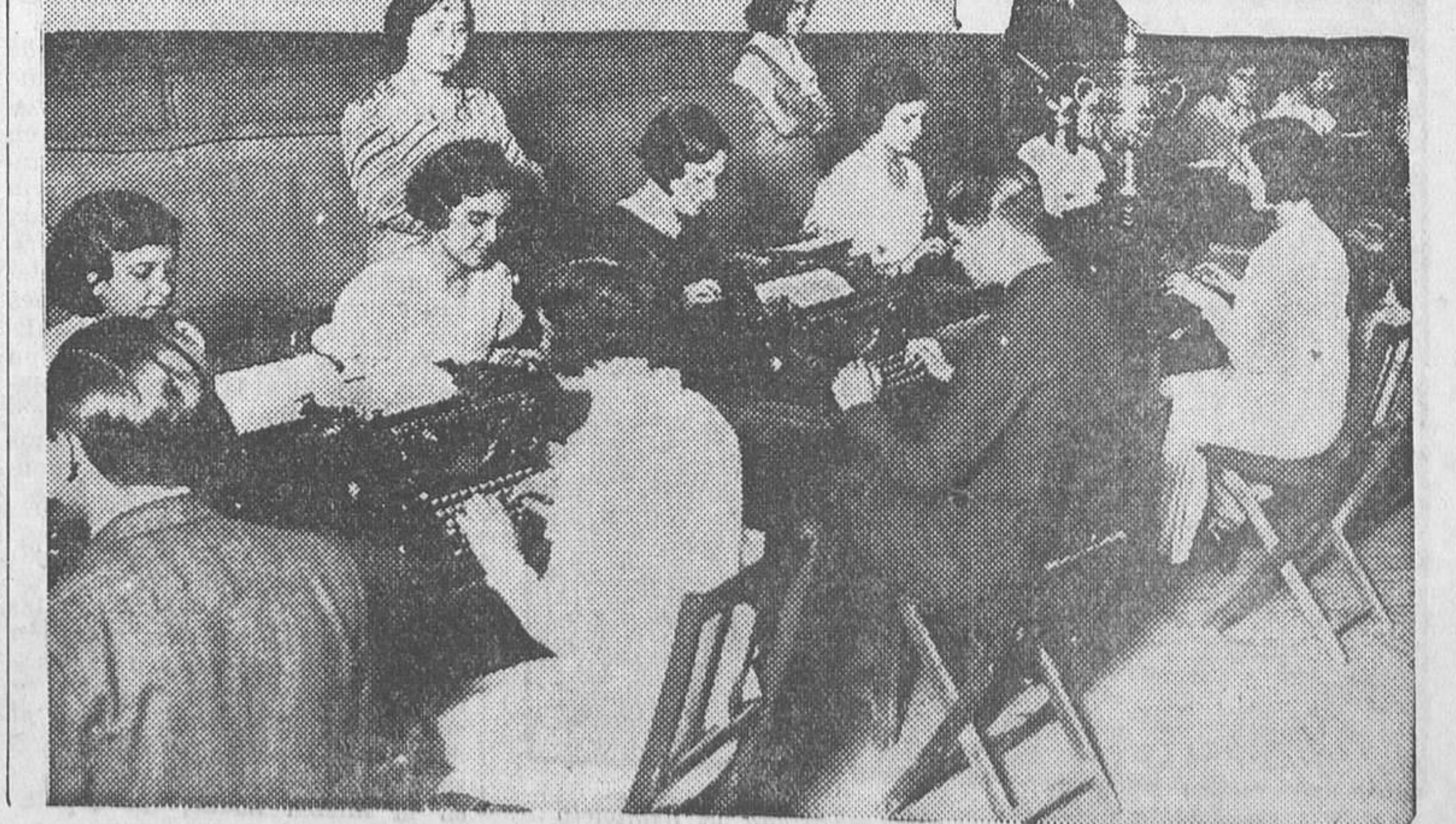
Un momento de la prueba mecanográfica en que fué disputada la copa de la Sociedad Matritense de Amigos del País