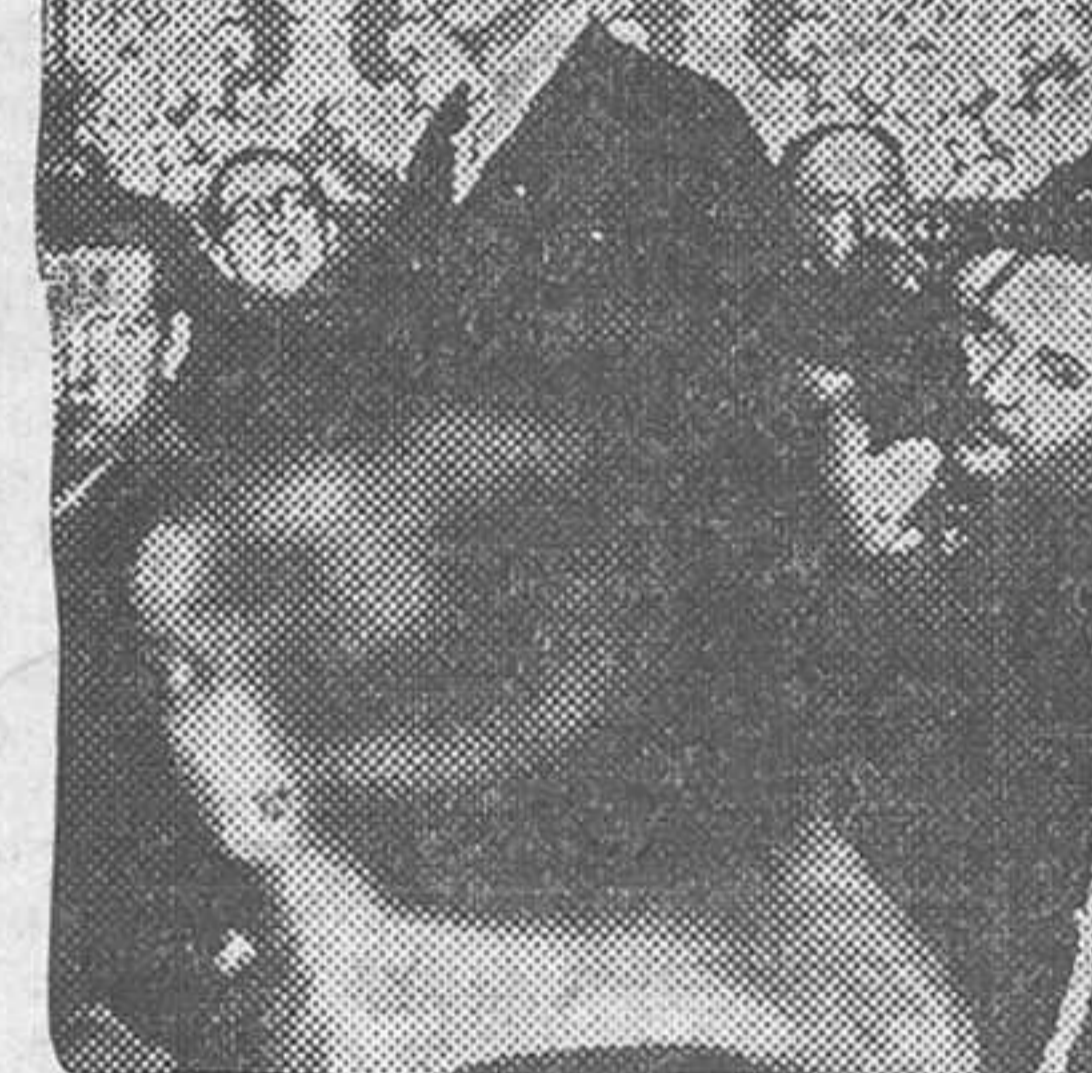
El general Fernández Pérez contestando a las preguntas del fiscal