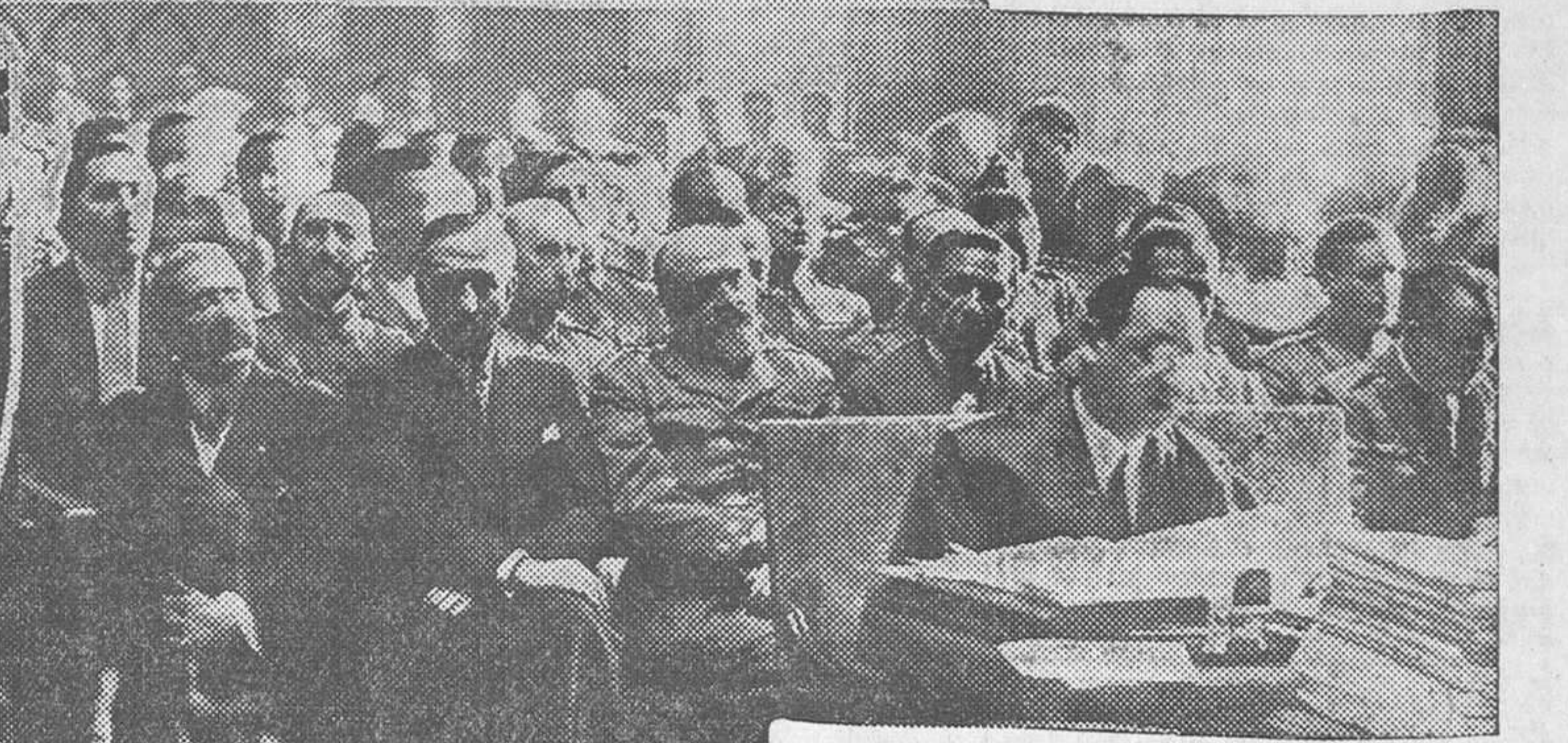
Los procesados ocupando los banquillos durante el desarrollo de la vista

El general Fernández Pérez y el coronel Cano, conducidos desde Prisiones Militares al Palacio de Justicia.—Algunos procesados al salir de Prisiones Militares para ser conducidos al Palacio de Justicia