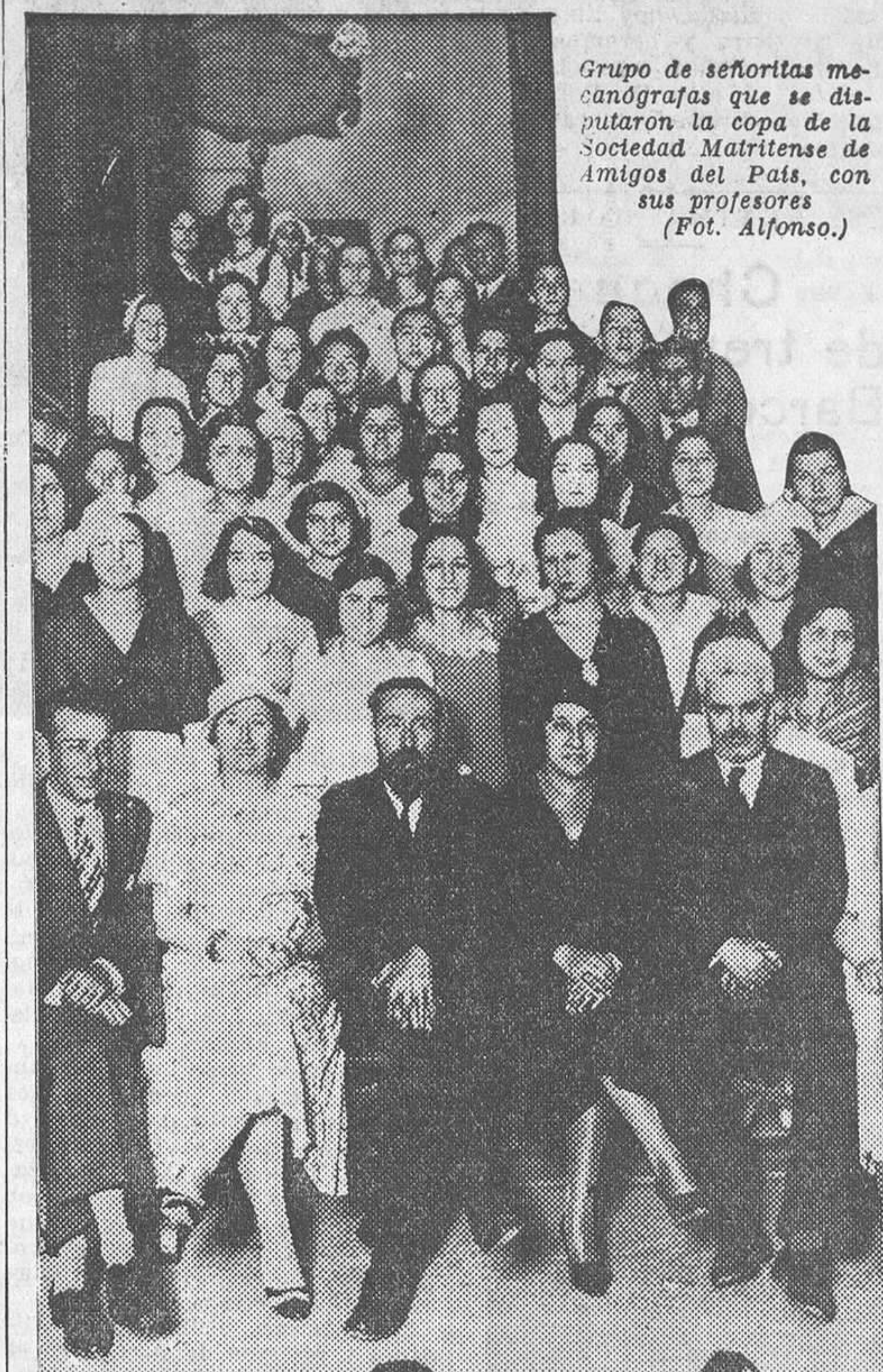
Grupo de señoritas mecanógrafas que se disputaron la copa de la Sociedad Matritense de Amigos del País...