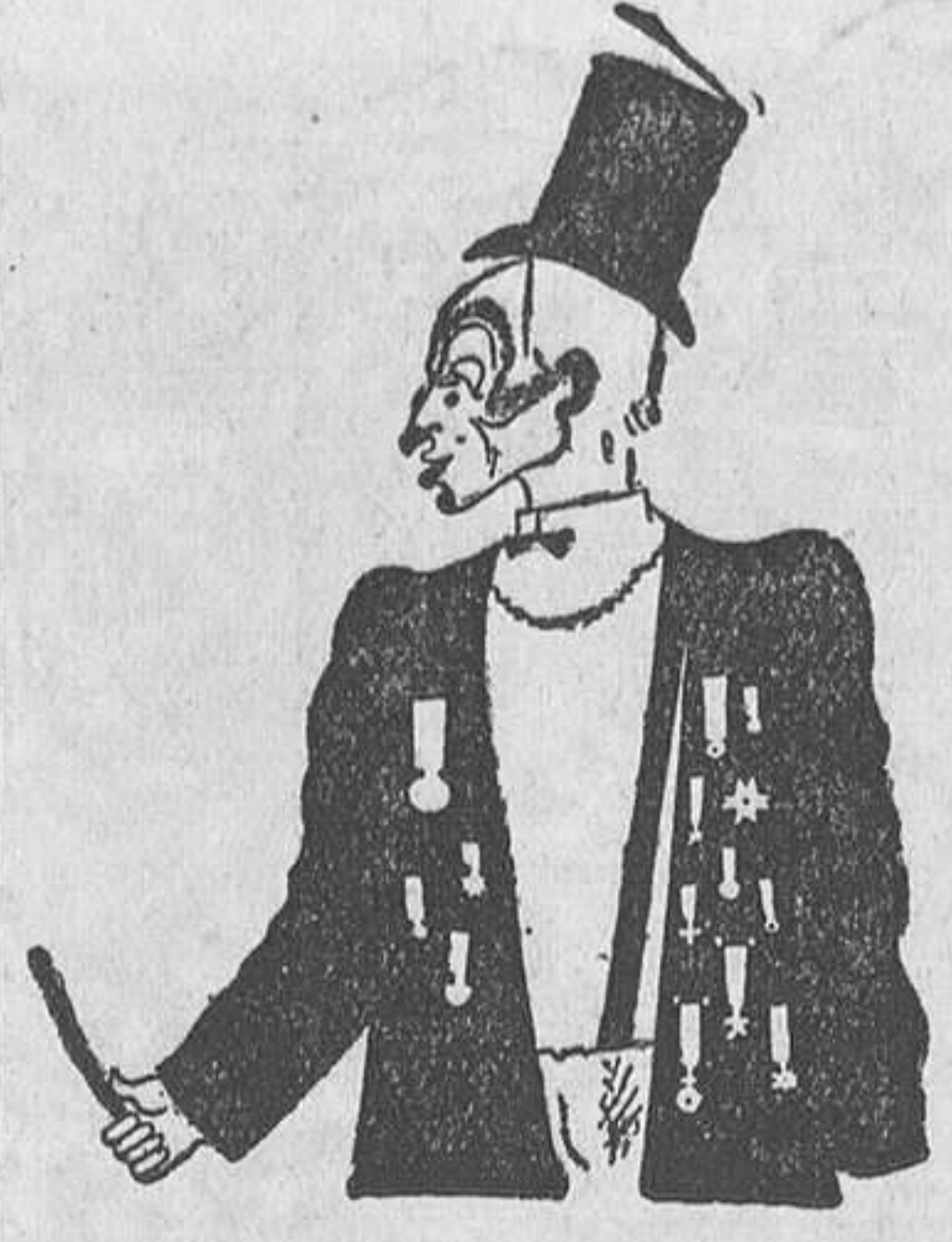
El clown Porto