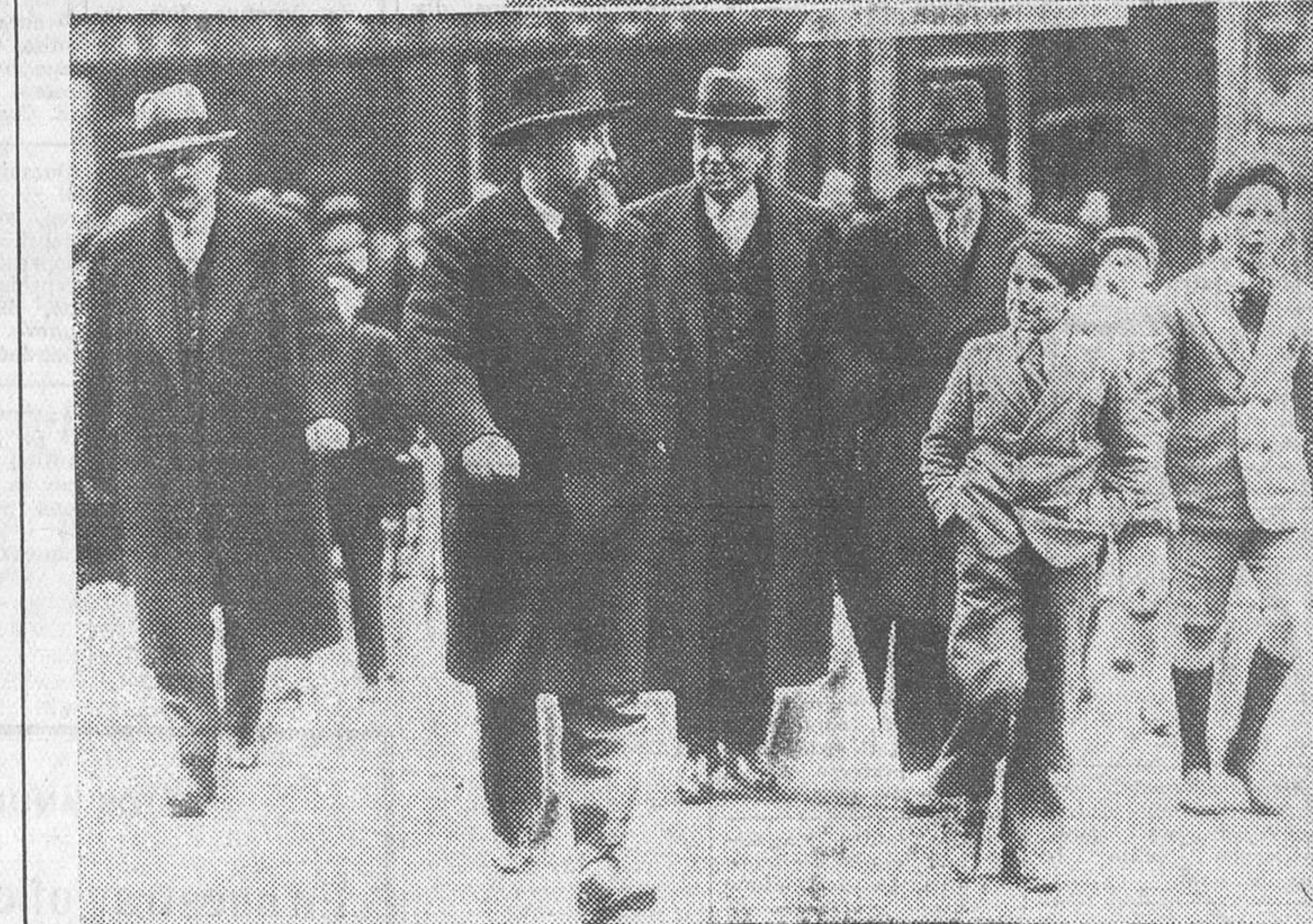
Todavía—hay para mucho tiempo—el «affaire» Staviski. El juez de instrucción saltando del domicilio del doctor Vachel, en el cual se han encontrado varios documentos relacionados con el asunto. (Fot. Ortiz-Keystone.)

Modelo de la estatua, de 450 metros de altura, que será inaugurada el 21 del corriente mes de Abril, en Berlín, al Trabajo alemán (Fot. Ortiz-Keystone.)