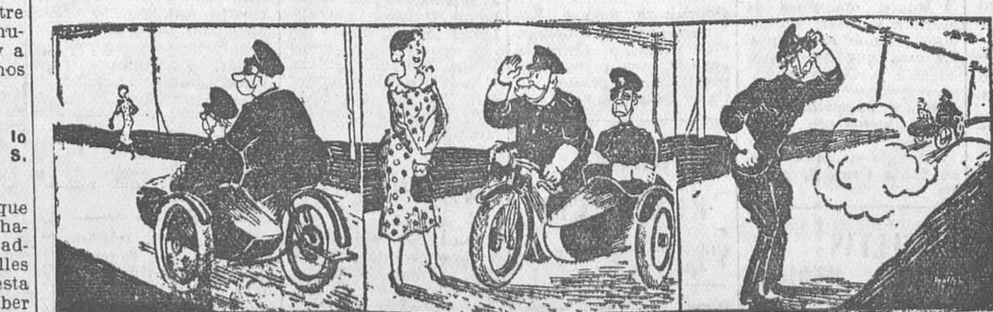
UN POLICIA GALANTE («Daily Express».)