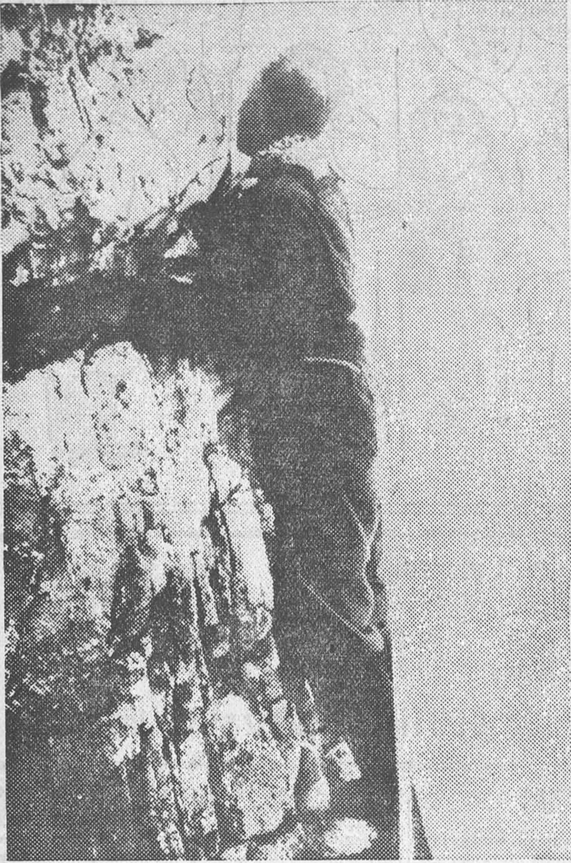
El rey Alberto I de Bélgica era un ferviente alpinista. Había realizado las más peligrosas excursiones en los Alpes, y escalaba puntos verdaderamente difíciles. En la foto le vemos en una ascensión, llena de dificultades, que realizó hace algún tiempo en los Alpes