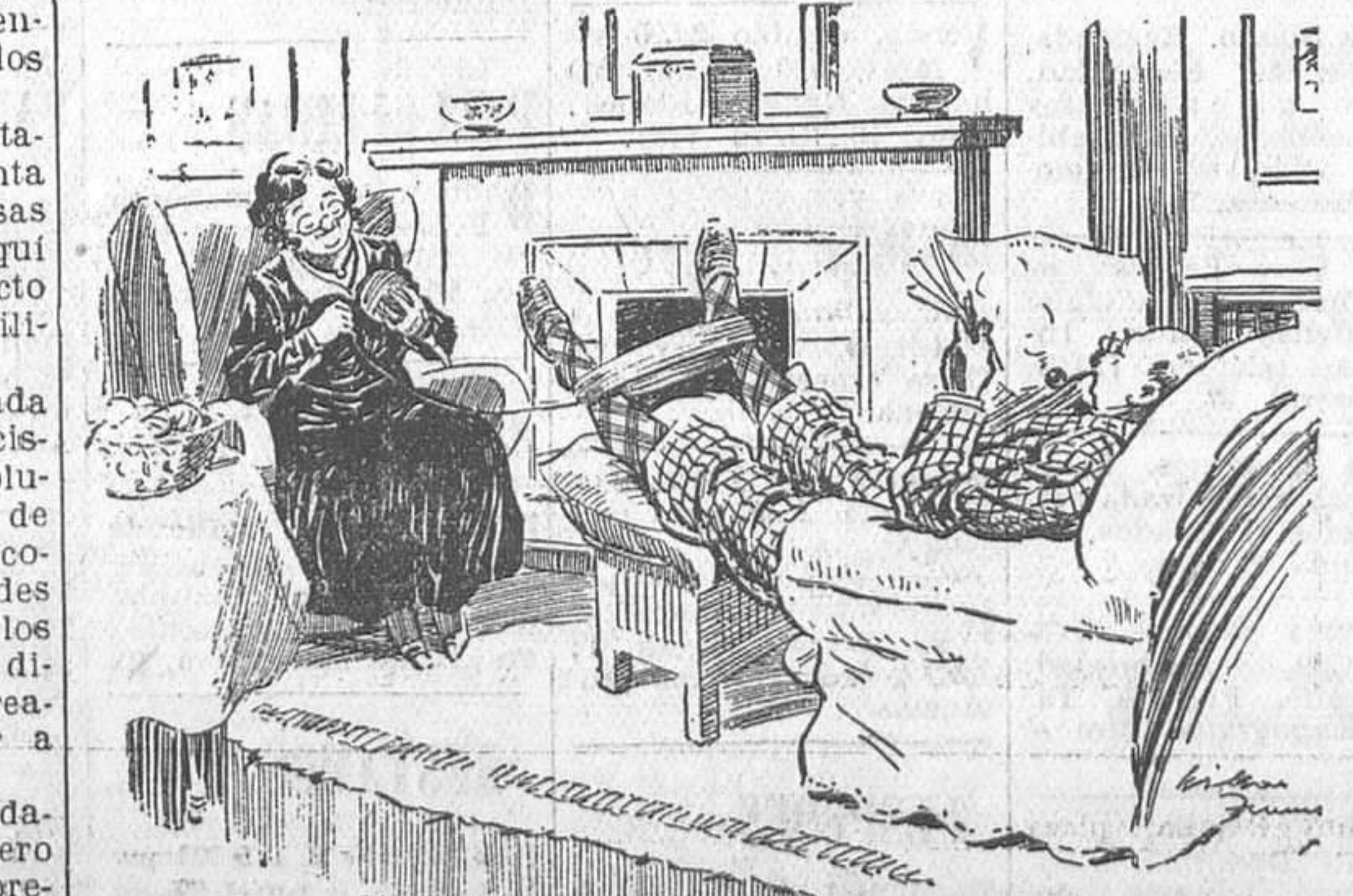
Utilidad del marido con el mínimo esfuerzo (The Humorists)