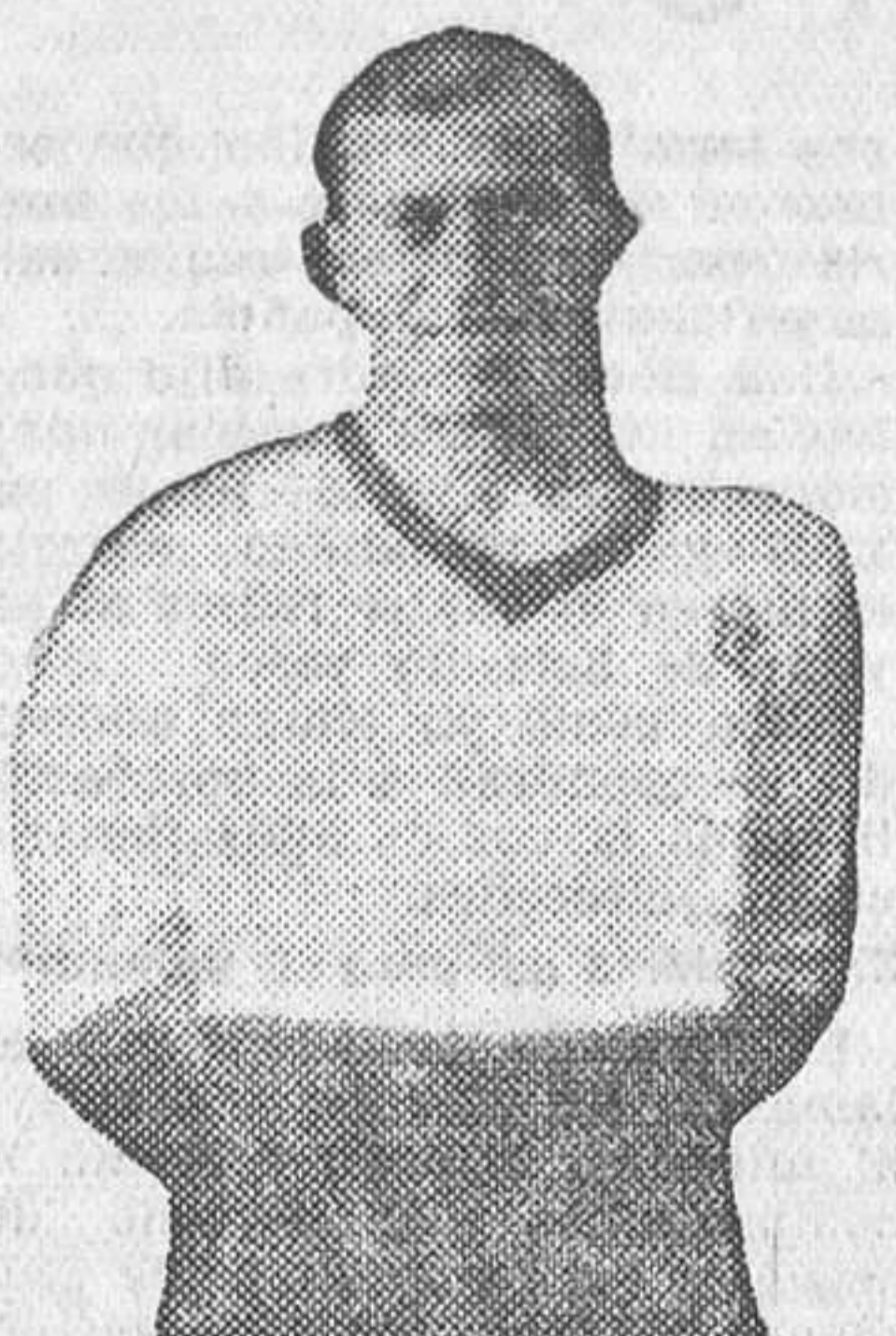
José Loredo, notable delantero del Racing Club de Santander, que anoche falleció repentinamente en la capital montañesa.