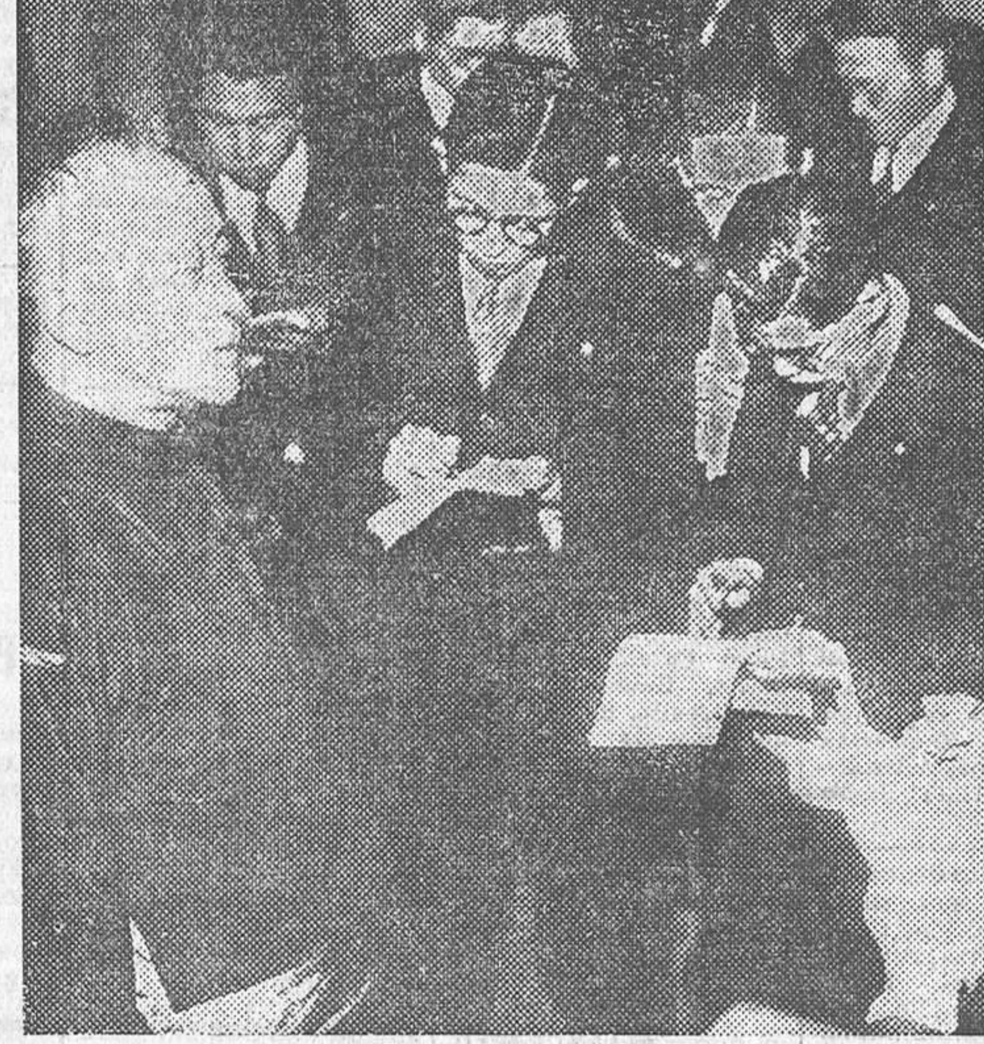
El jefe del Gobierno del nuevo Estado de Mandchoukuo, a su llegada a Tokio, rodeado de periodistas. El presidente-general Ting Shih-yua leyendo la proclamación de la independencia