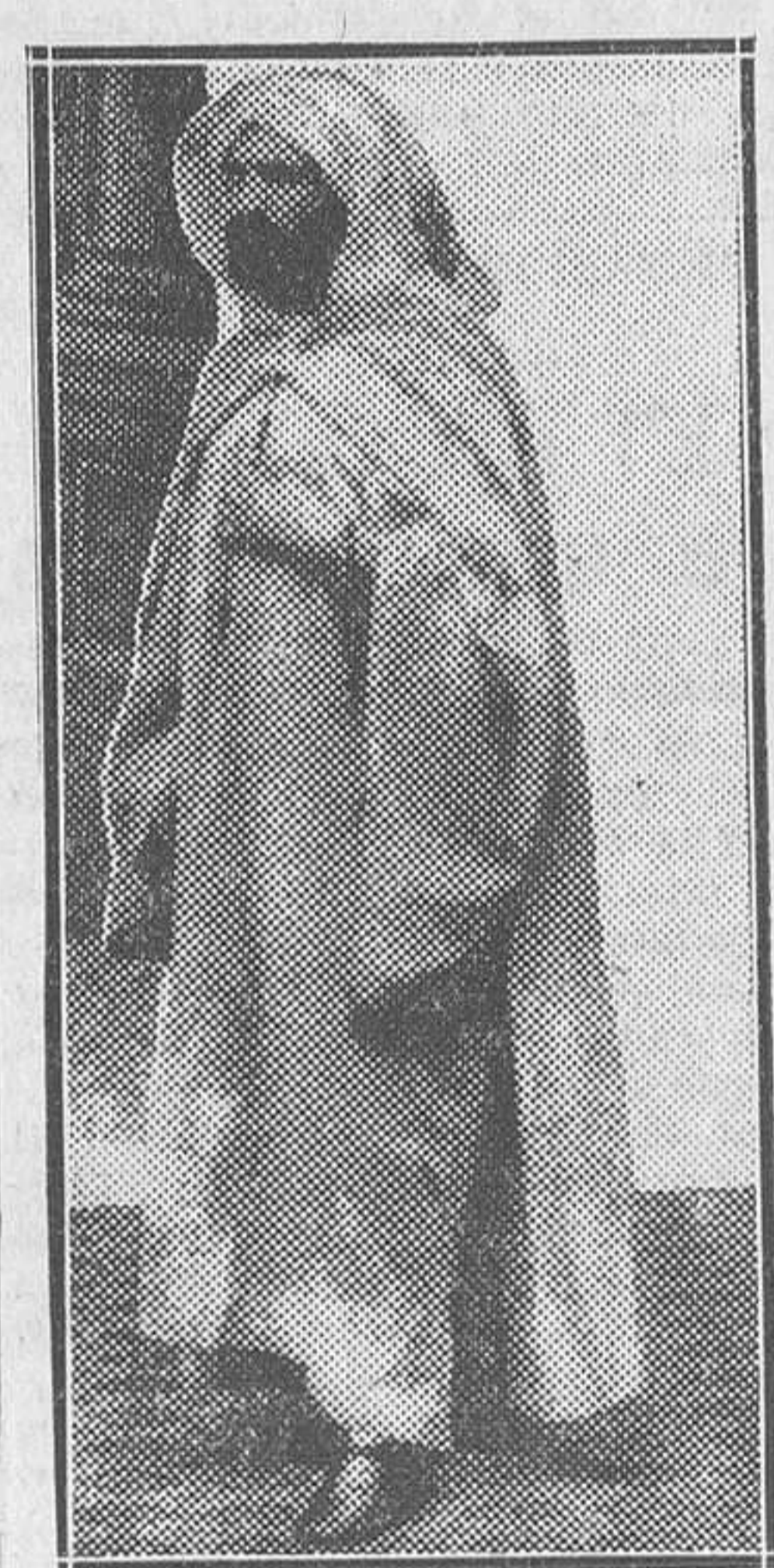
Don Pedro Antonio de Alarcón cuando, en 1860, volvió de la guerra de Africa y escribió su famoso libro «Diario de un testigo»