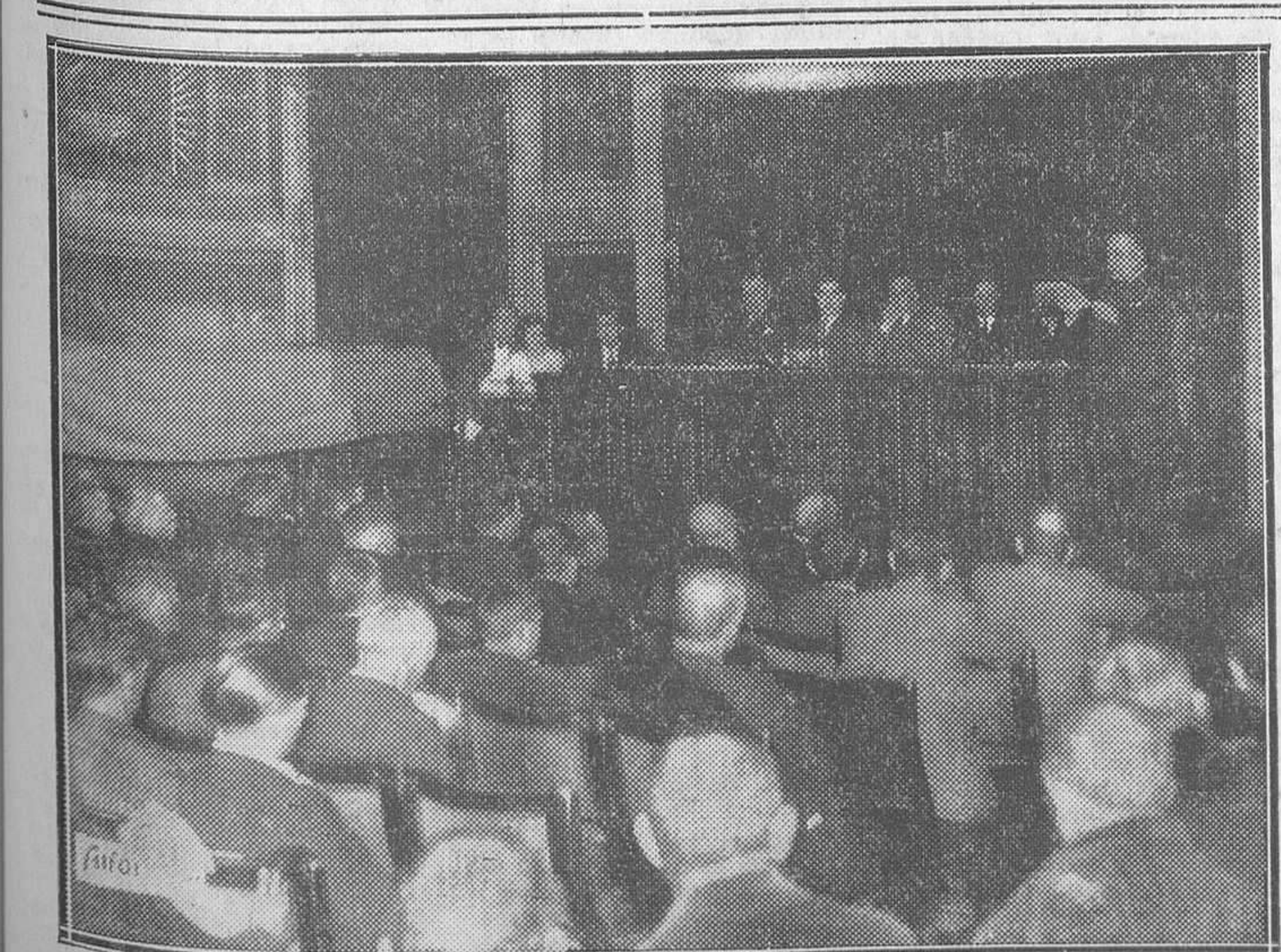
Inauguración de la Asamblea de cultivadores de tabaco de España, celebrada ayer en el Ateneo

El total de lo hallado es de 126 monedas de cinco pesetas y 134 de a dos. Del hecho se ha dado cuenta al Juzgado.