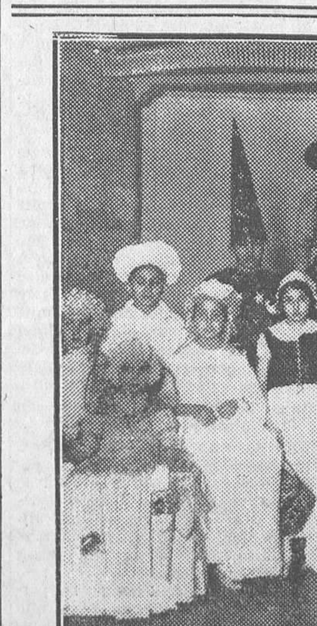
EL CARNAVAL EN MADRID.—Balle infantil celebrado en el Círculo de Bellas Artes el domingo de Piñata

Como resultado del gran baile de máscaras celebrado en el cine Barceló el día 3, organizado por esta Sociedad benéfica de Auxilios Corporativos de Telégrafos, y en el cual fué elegida «Señorita Comunicaciones 1933», resultaron premiados en la tómbola de regalos los números siguientes, que hacemos públicos para que los recojan los agraciados en las oficinas de la mencionada Sociedad, sita en el Palacio de Comunicaciones, planta baja: Premio primero, al número 1.266; 2, al 650; 3, al 1.401; 4, al 782; 5, al 1.026; 6, al 1.302; 7, al 323; 8, al 1.366; 9, al 1.149; 10, al 926; 11, al 1.798; 12, al 1.764; 13, al 972; 14, al 1.179; 15, al 1.347; 16, al 1.987; 17, al 1.161; 18, al 2.110; 19, al 1.371; 20, al 1.118; 21, al 22; 22, al 8; 23, al 887; 24, al 352; 25, al 305; 26, al 252; 27, al 1.752; 28, al 752; 29, al 1.477; 30, al 766; 31, al 2.209; 32, al 1.960; 33, al 1.498; 34, al 1.586; 35, al 783; 36, al 364; 37, al 1.653; 38, al 963; 39, al 1.559; 40, al 1.854; 41, al 1.583; 42, al 1.835; 43, al 1.840; 44, al 313; 45, al 1.280; 46, al 479; 47, al 146; 48, al 1.885; 49, al 1.097. Los premios pueden ser recogidos en Auxilios Corporativos desde el lunes, día 6 del corriente.