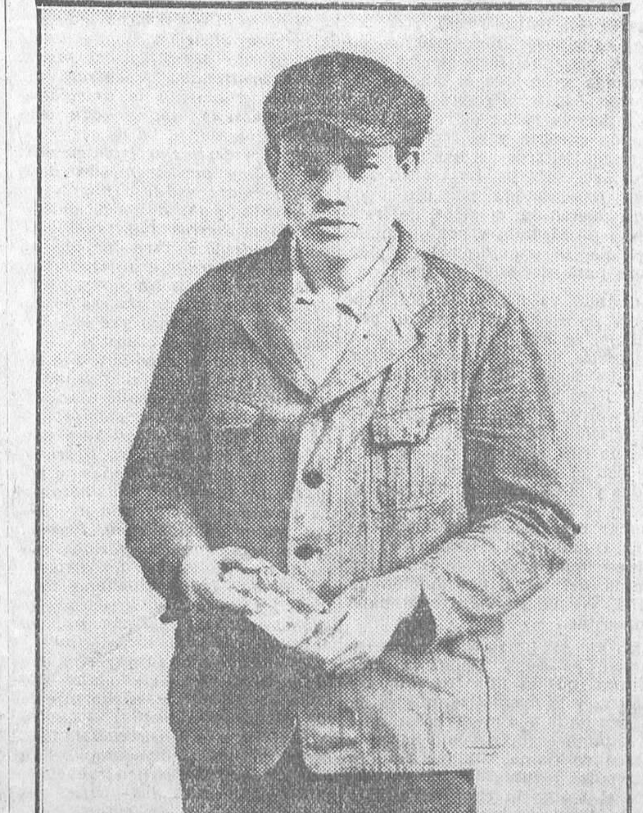
Primera fotografía del comunista holandés Van der Lubbe, al que se atribuye el incendio del Reichstag