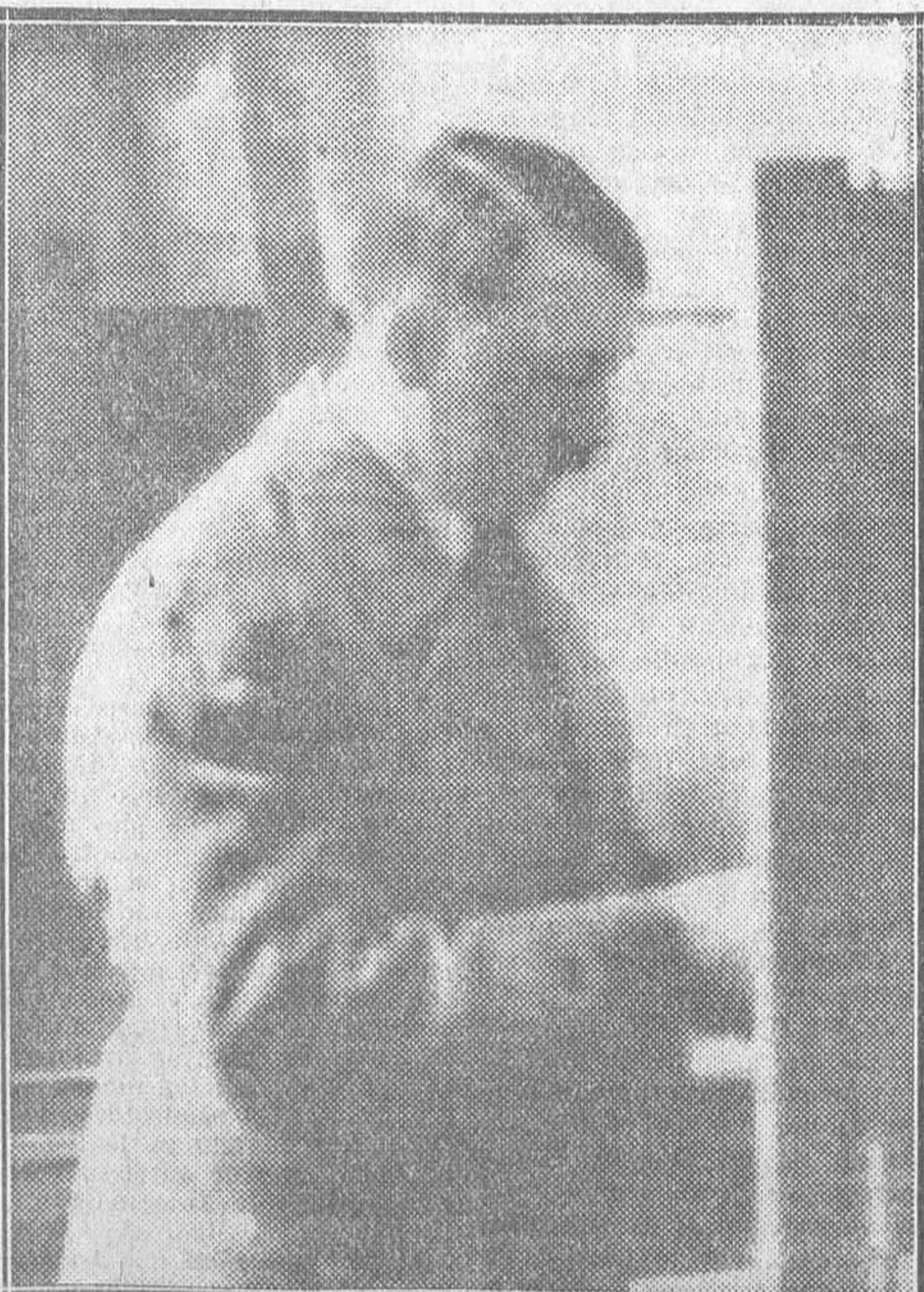
Hitler emitiendo su voto en las elecciones del domingo pasado.