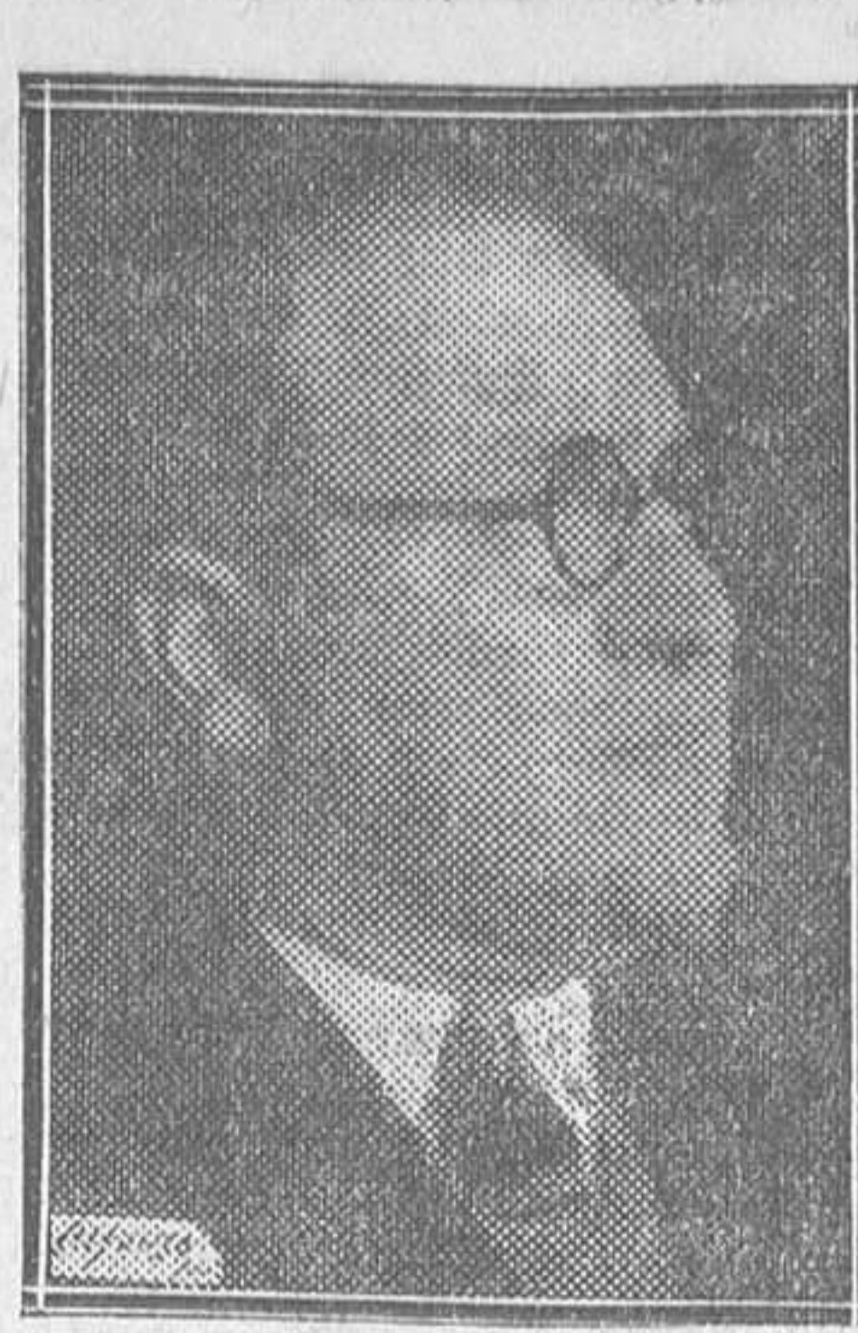
Don Agustín Millares, a quien la Academia Española ha otorgado el premio Fastenrath...