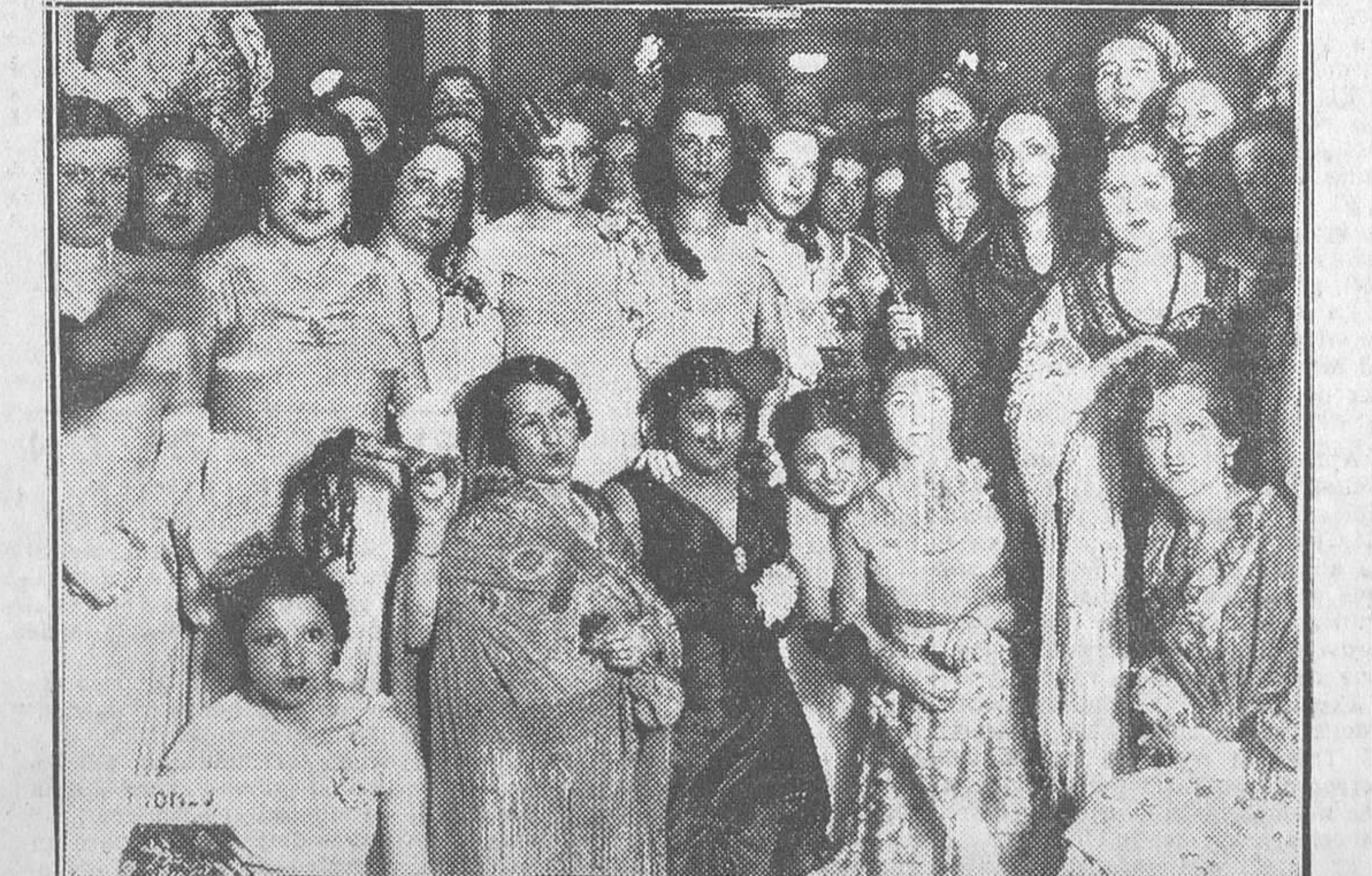
EL CARNAVAL EN MADRID.—Bellás señoritas que asistieron al brillante baile organizado por el elemento joven del Círculo de la Unión Mercantil