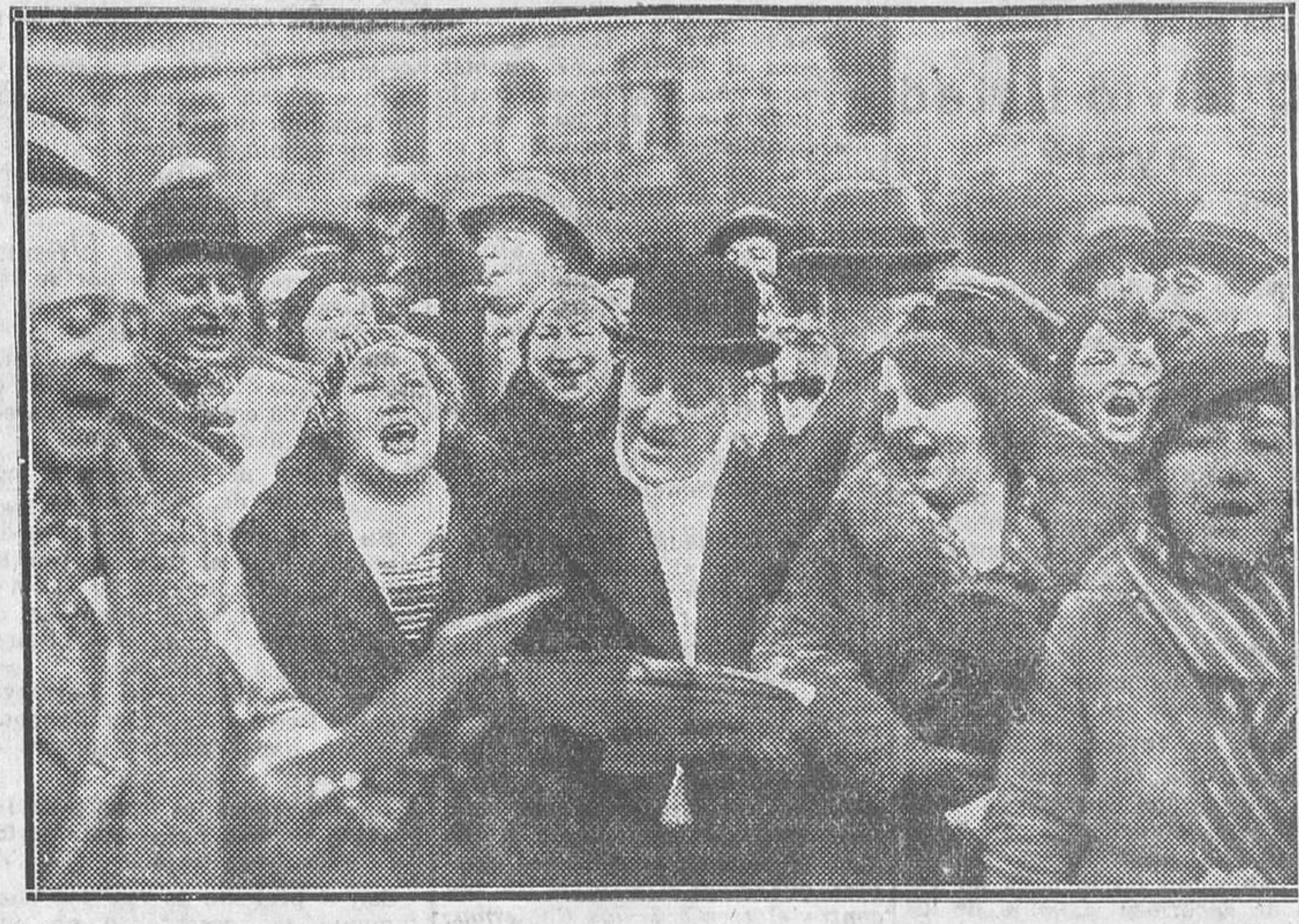
En el patio de la Prefectura de París, los artistas dieron un concierto a beneficio de la Caja de Socorros de los guardias de la paz. Aquí aparecen el prefecto, M. Chiappé, y su esposa (la que está detrás, con la gorra blanca), repitiendo el estribillo de una canción durante el concierto

Durante las pocas semanas que lleva de vida el Gabinete Hitler éste ha hecho todo lo posible para intensificar las diferencias entre su propio partido y los partidos de la izquierda.