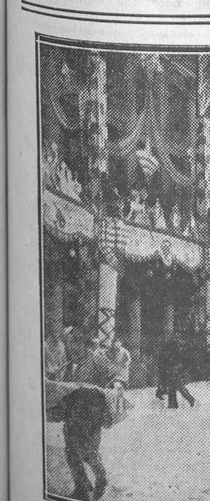
El Carnaval en Niza se ha inaugurado con la tradicional brillante.—Un grupo de figuras grotescas durante el desfile

El Comité de Artes y Letras, que se reúne a primeros de Mayo en Madrid.—La Conferencia de Prensa. Ginebra, 25.—Ha marchado a Bruselas para asistir, en nombre de la Sociedad de Naciones, a la reunión del Congreso de Asociaciones pro Sociedad de Naciones.