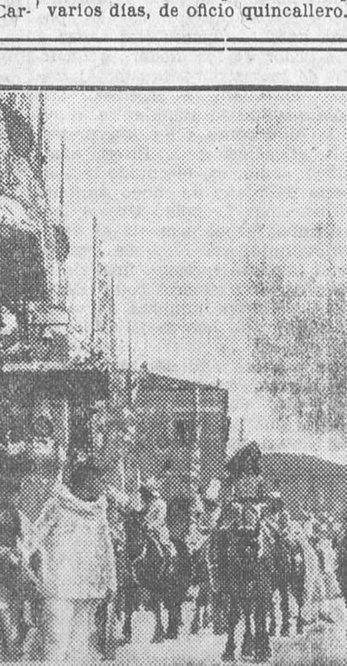
Un detalle del brillante cortejo con que ha hecho su entrada en Niza el Carnaval de 1933

Roban la caja del Ayuntamiento. Palencia, 25.—En la noche del día 23 fué robada la caja de caudales del Ayuntamiento de Guaza Campos.