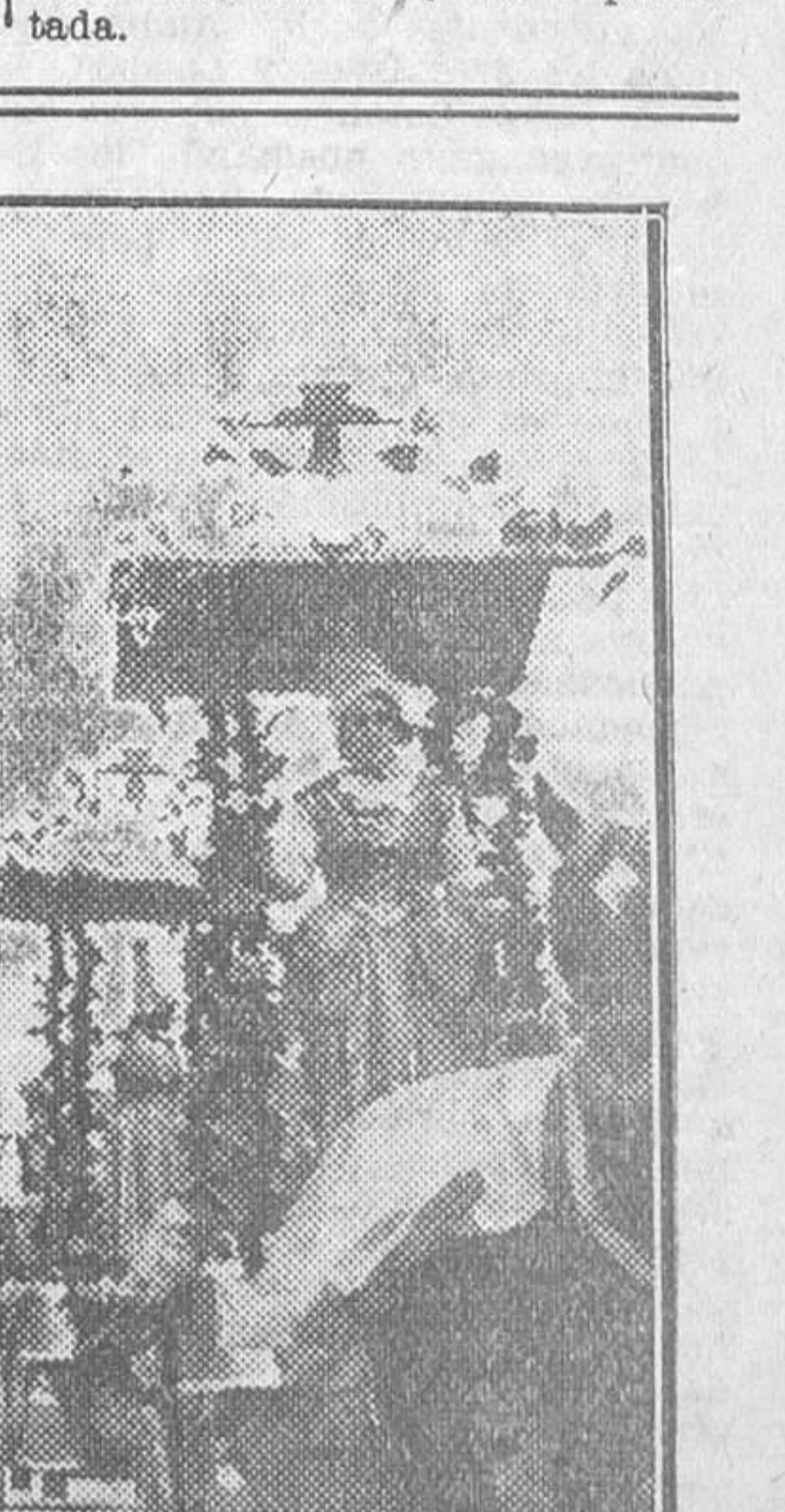
Un detalle del brillante cortejo con que ha hecho su entrada en Niza el Carnaval de 1933

Roban la caja del Ayuntamiento. Palencia, 25.—En la noche del día 23 fué robada la caja de caudales del Ayuntamiento de Guaza Campos.