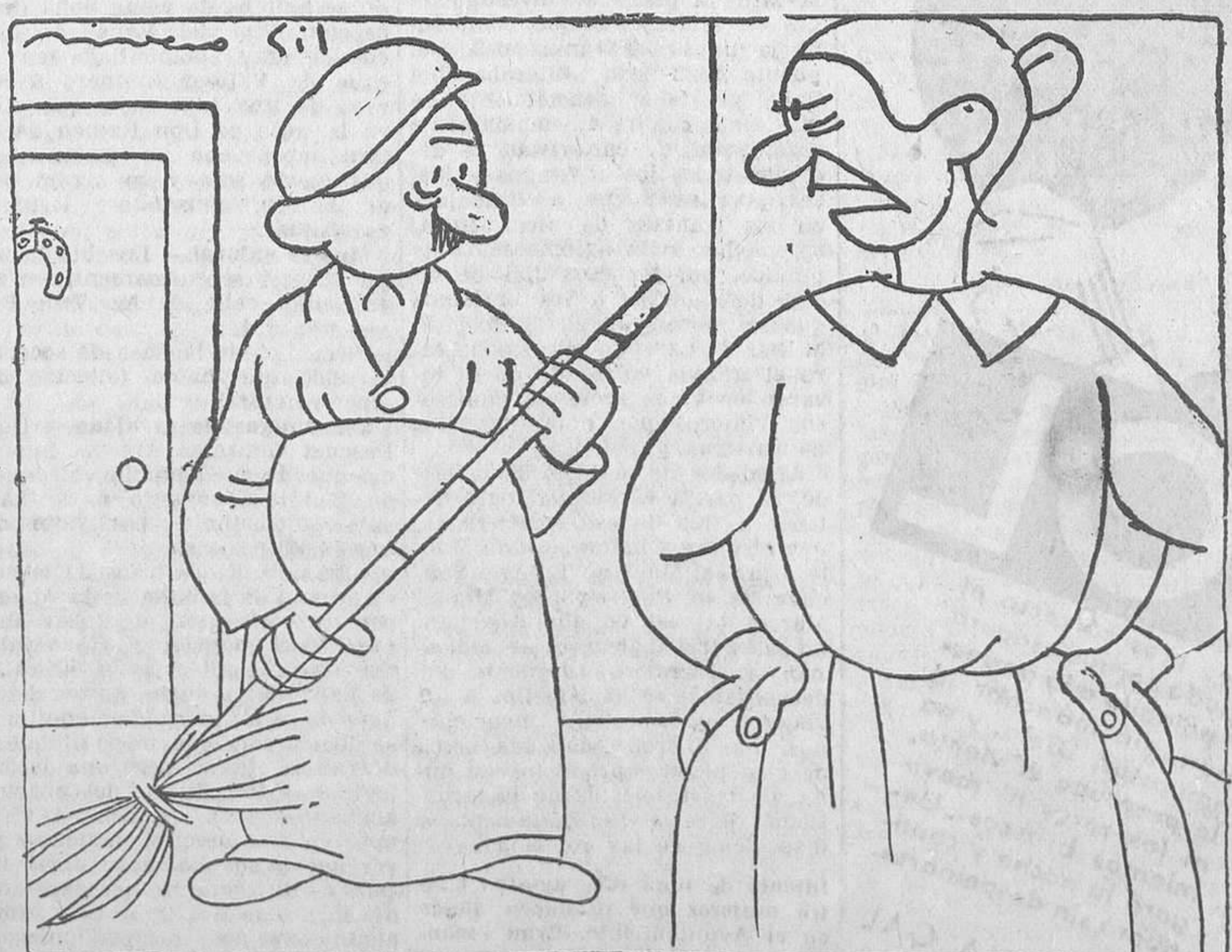
—¿No te da vergüenza? Eres el único que está conforme con la elección de Miss Madrid!