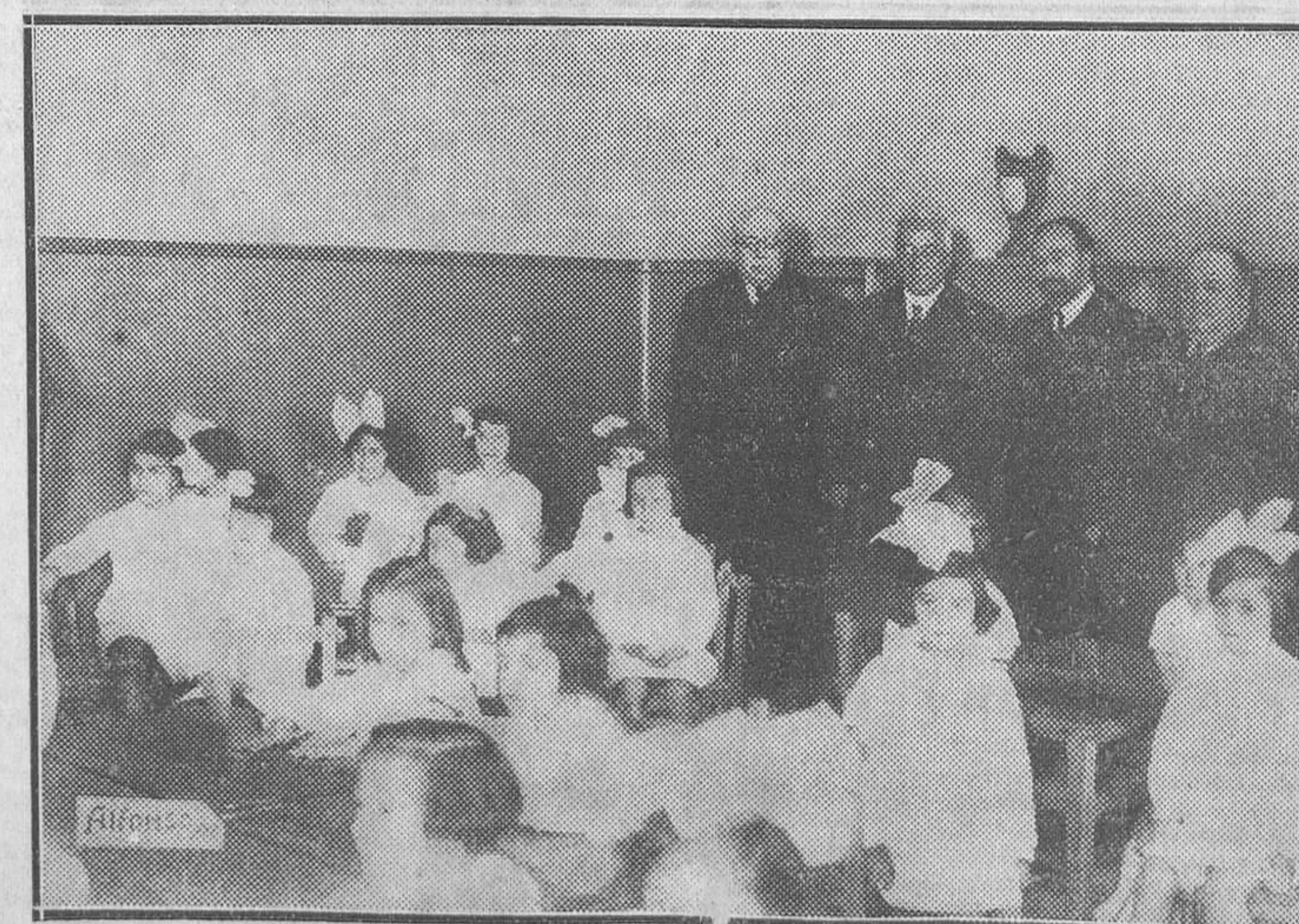
EN LA INAUGURACION DEL GRUPO ESCOLAR BLASCO IBANEZ.—El presidente de la República, el jefe del Gobierno, el ministro de Instrucción pública y el alcalde de Madrid visitando las clases

Hicieron uso de la palabra el señor Rico, alcalde de Madrid, y el Sr. De los Ríos, ministro de Instrucción pública.