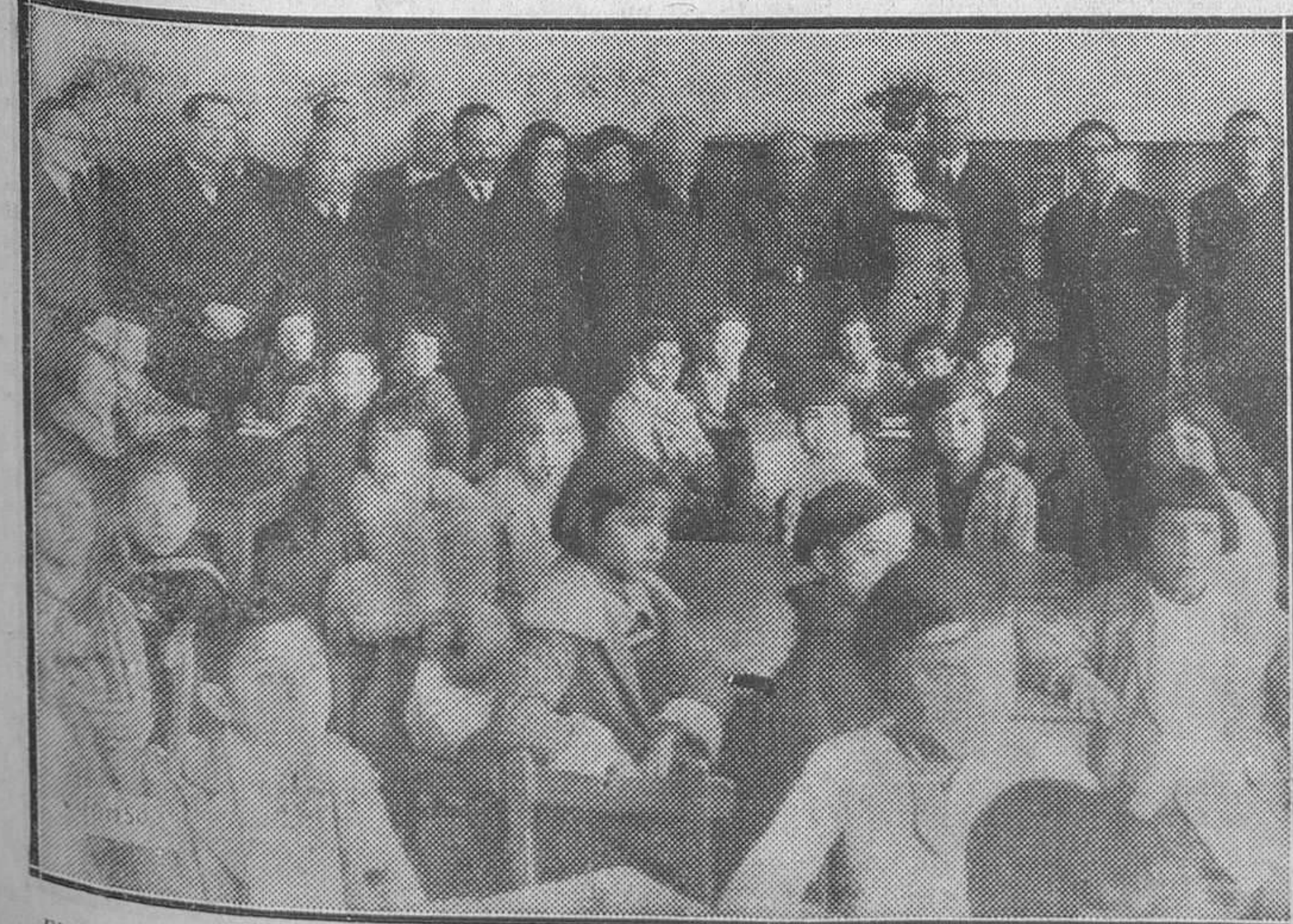
EN LA INAUGURACION DEL GRUPO ESCOLAR LOPE DE RUEDA.—S. E. el presidente de la República con el ministro de Instrucción pública, el alcalde de Madrid, el director de Primera enseñanza, el arquitecto Sr. Giner de los Ríos y otras personalidades en una de las clases