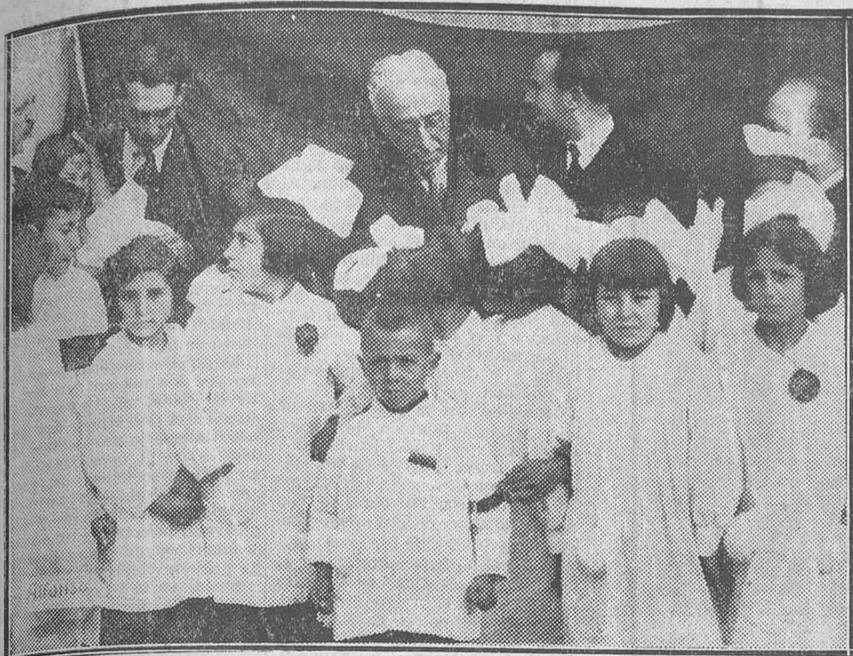
EN LA INAUGURACION DEL GRUPO ESCOLAR ROSARIO DE ACUNA.—S. E. el presidente de la República, el ministro de Instrucción y el alcalde de Madrid con un grupo de colegiales

son los siguientes: Lope de Rueda, de nueve clases; paseo de los Pontones, nueve clases; Pablo Iglesias, en la calle de Larra, 18 clases; calle de España, seis clases; plaza de España, ocho clases; total, 50 clases, que dan escolaridad a 2.500 niños.