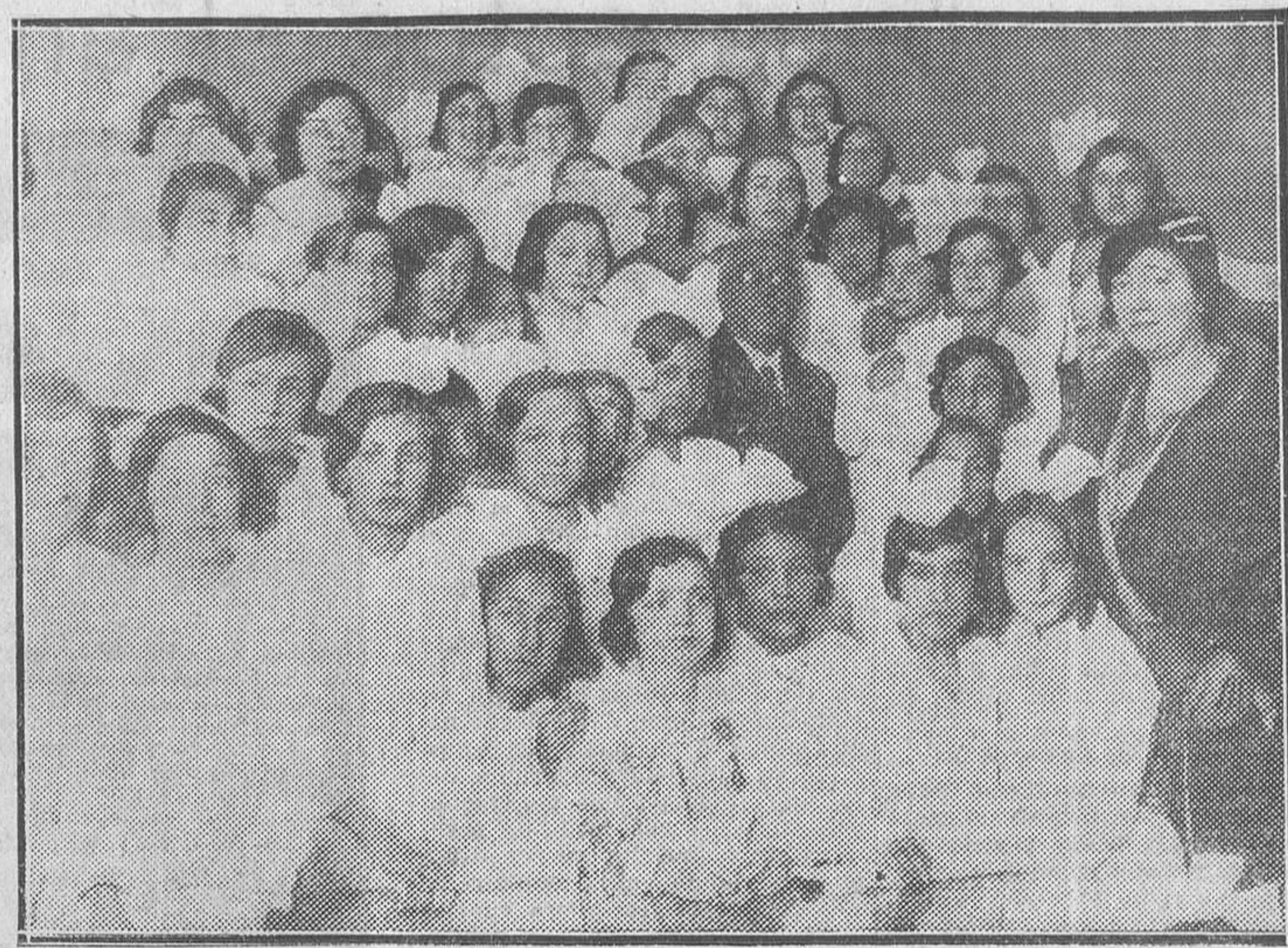
EN LA INAUGURACION DEL GRUPO ESCOLAR TOMAS BRETON.—S. E. el presidente de la República rodeado de alumnas

El grupo escolar estaba profusamente engalanado con flores y macetas. Las clases funcionaban