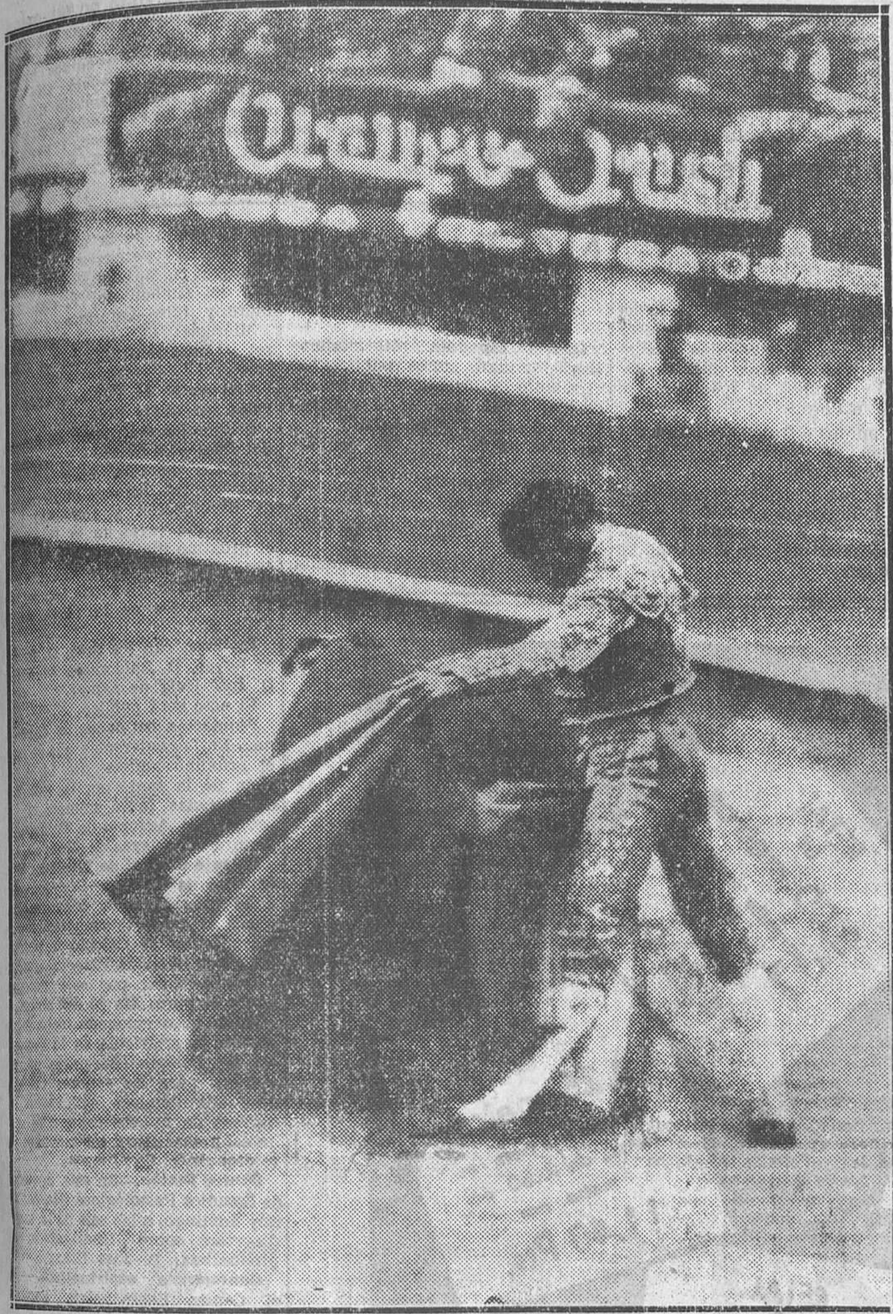
COMO SE TOREA CON EL CAPOTE

Las dos fotografías que publicamos son una muestra de cómo torea Fermín Espinosa (Armillita Chico), el más completo, el más artista y el mejor de los toreros actuales.