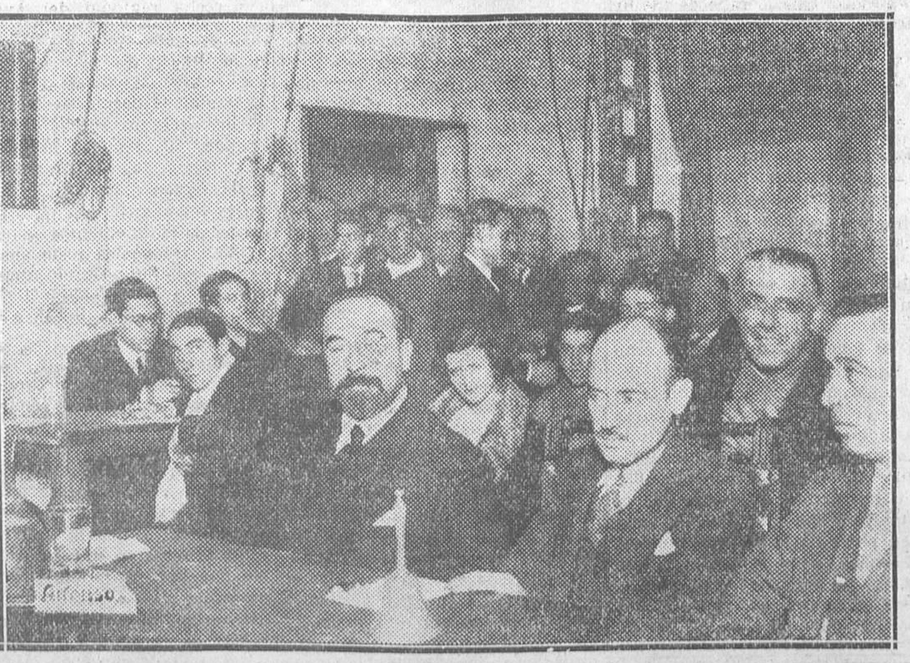
Don Fernando de los Ríos dando su conferencia, en el teatro de la Casa del Pueblo, sobre «Orientación social de la educación moderna», con motivo del IV aniversario de la fundación del Grupo de Antiguos Alumnos y Amigos de la Escuela de Aprendices Tipógrafos

Cádiz, 6.—Por informes autorizados se sabe que los barcos que se construirán para Méjico son dos cañoneros y un transporte de 1.000 toneladas de desplazamiento. La prueba, con 20 millas de velocidad, tres cañoneros transporte, de 1.000 toneladas y de igual andar; dos lanchas cañoneras de 140 toneladas cada una y 24 millas de velocidad.