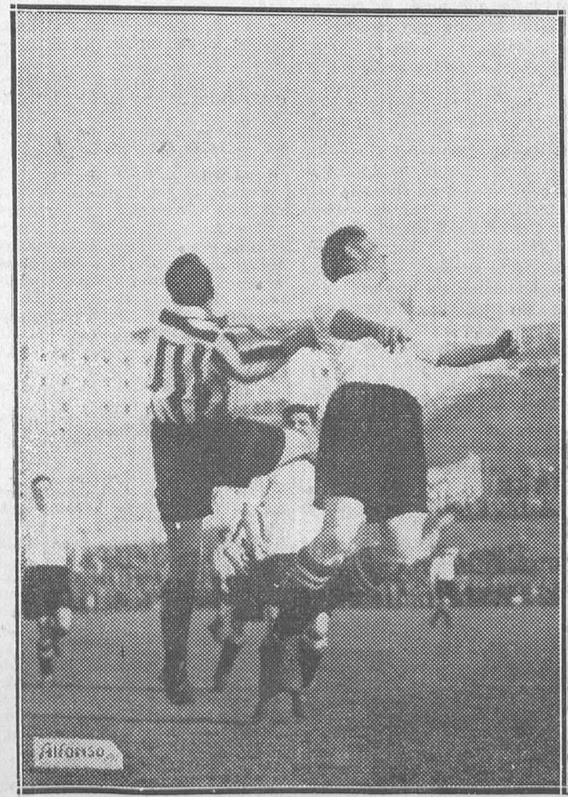
Un momento del partido de fútbol jugado el domingo en Madrid entre Unión Irún y Athletic Madrid

Segunda eliminatoria.—1, Espartero, de Comercio, 1 m. 37 s. 1/5; 2, Va, de Comercio, 1 m. 38 s. 2/5; 3, Alvarez, Industriales, 1 m. 38 s. 2/5.