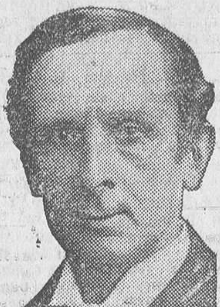
Cura recomendada por la gran autoridad médica Sir Morell Mackenzie.