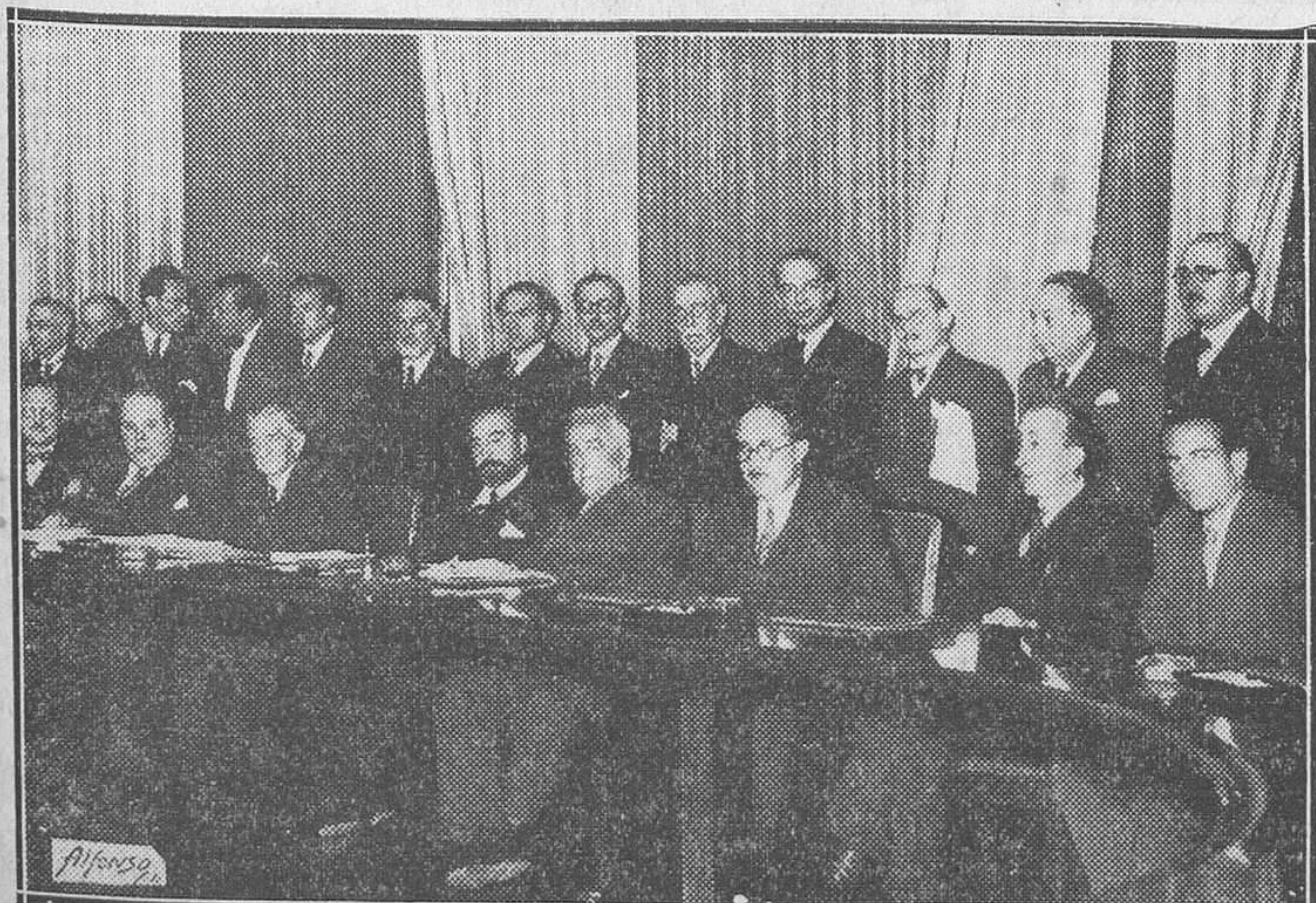
S. E. el presidente de la República presidiendo por primera vez la Junta de la Ciudad Universitaria, reunida ayer.

La ilustre escritora Concha Espina en el momento de depositar su voto para la elección de nueva Junta directiva de Unión Republicana Femenina