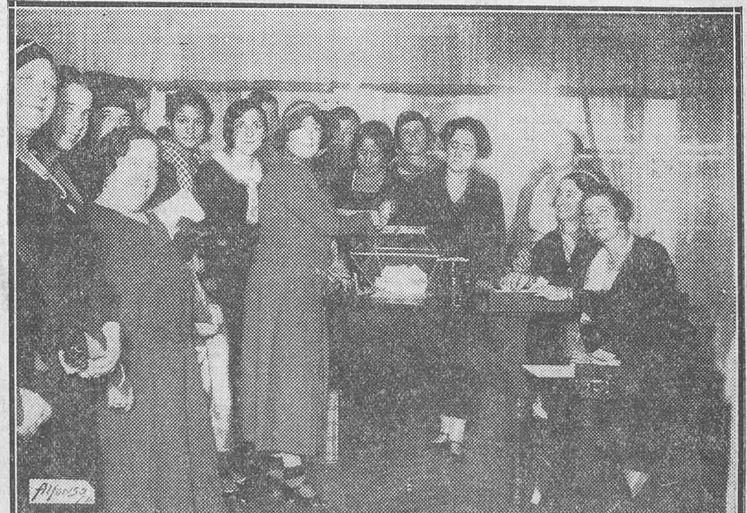
La ilustre escritora Concha Espina en el momento de depositar su voto para la elección de nueva Junta directiva de Unión Republicana Femenina.