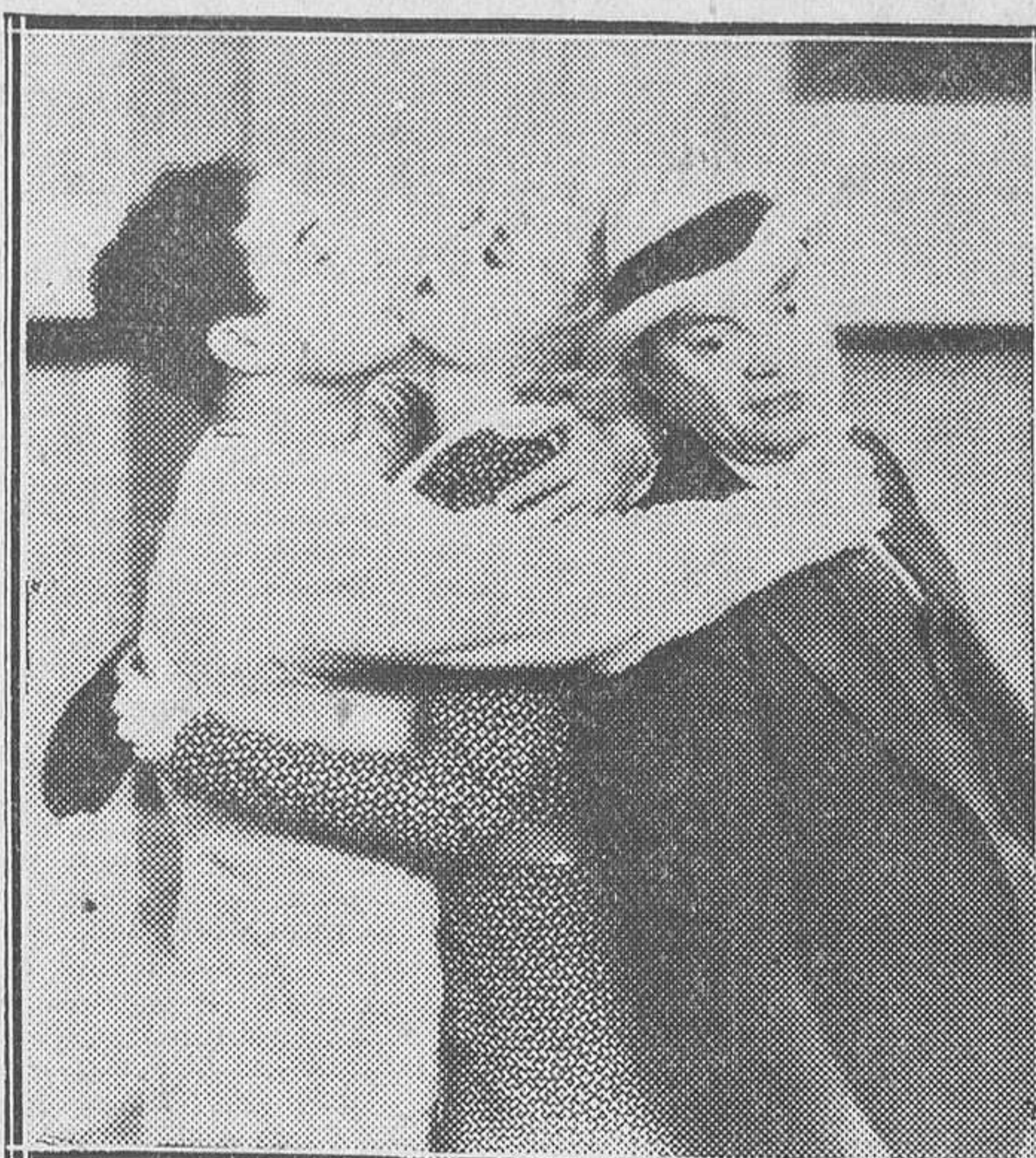
UNA ESCENA DE «LAS CALLES DE NUEVA YORK», FILM METRO-GOLDWYN DE BUSTER KEATON, QUE EN BREVE ESTRENARA EL PALACIO DE LA MUSICA

Con ser infinitos los hombres que reúnen estas cualidades en Barcelona, no se ha conseguido encontrar uno dispuesto a participar de tal honor, pues nosotros