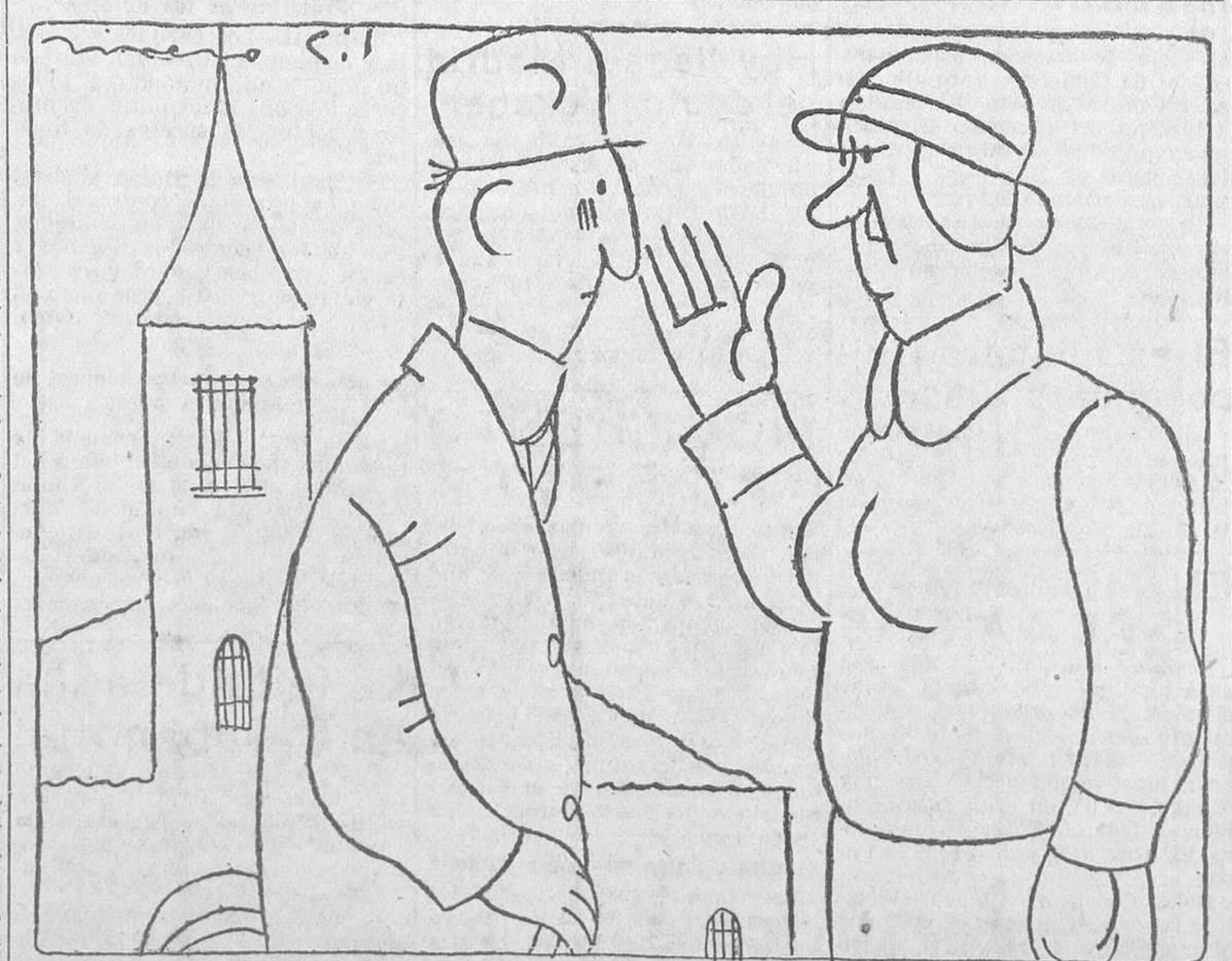
—¿Pero a quién se le ha ocurrido la barbaridad de abolir la prostitución? Por que si la «abolens», ¿quiere usted decirme, amigo mío, cómo vamos a saber cuáles son las personas decentes?

Gabuti, uno de los militantes de la organización italiana de Módena, era muy bien recibido en la población y trataba, sobre todo, a los oficiales de la guarnición y de los fuertes de la frontera. Los espías trataban, sobre todo, de apoderarse de los planos de trabajos de defensa efectuados en la región. Varias muchachas italianas están comprometidas en el asunto y se creen inminentes nuevas detenciones.