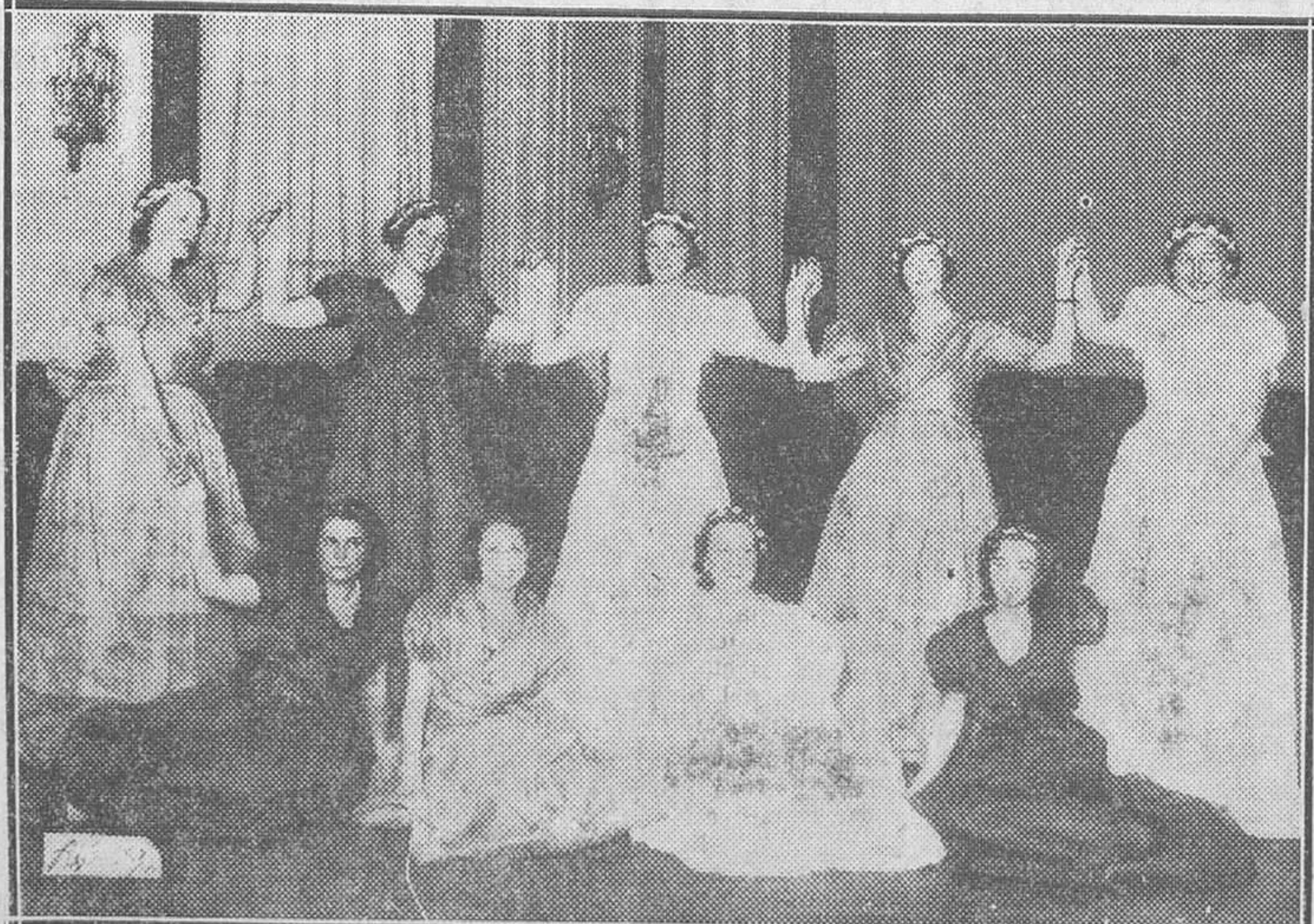
Señoritas que toman parte en el festival que a beneficio del Sanatorio Angloamericano se celebrará esta noche en el Hotel Ritz

Los servicios sanitarios trabajan activamente para curar a los heridos y prevenir epidemias.