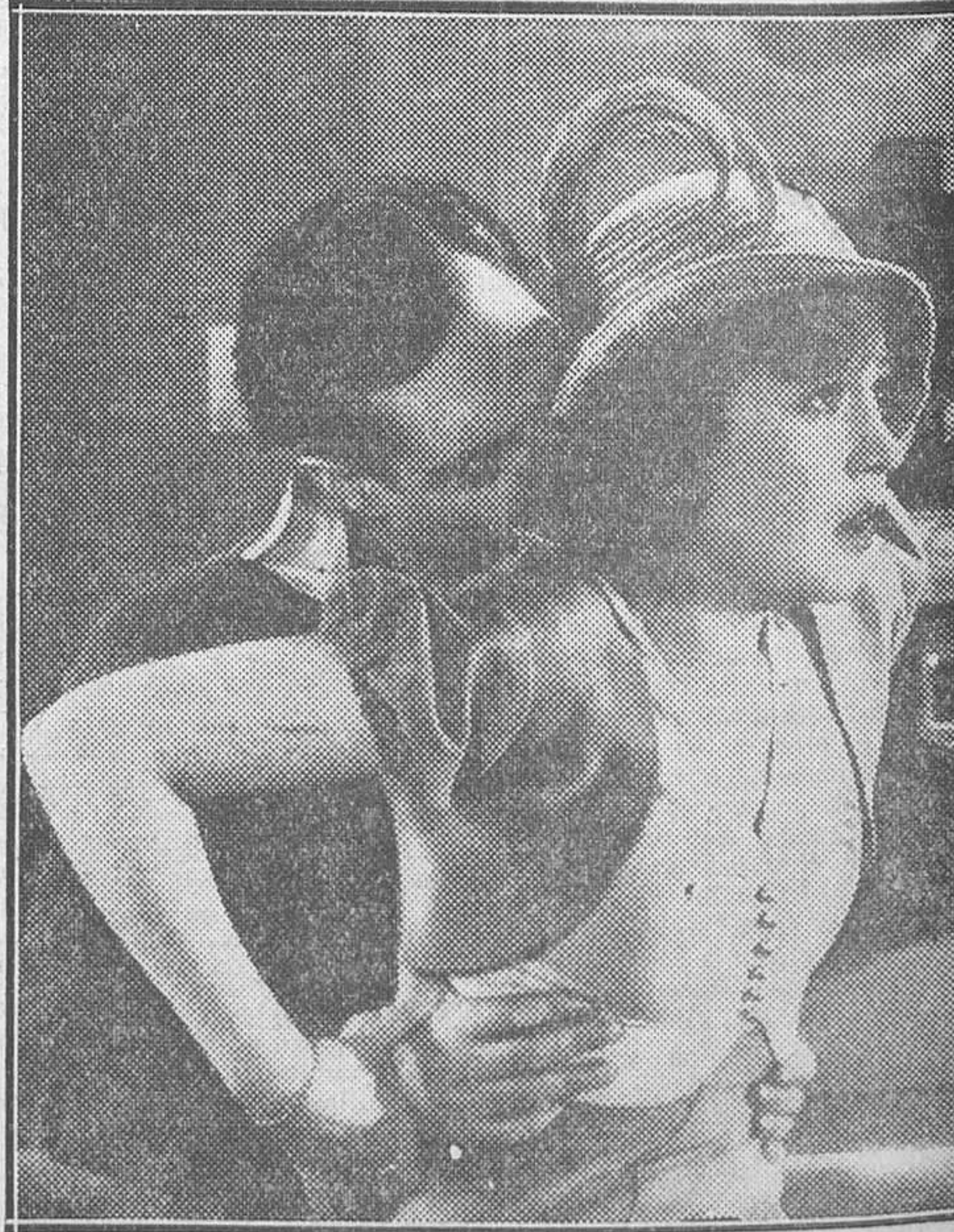
MARTHA EGGERTH EN LA OPERETA, A. F. A. «ERASE UNA VEZ UN VALS», QUE EL LUNES SE ESTRENA EN EL CALLAO

JANET GAYNOR RECIENTE CASADOS CHARLES FARRELL