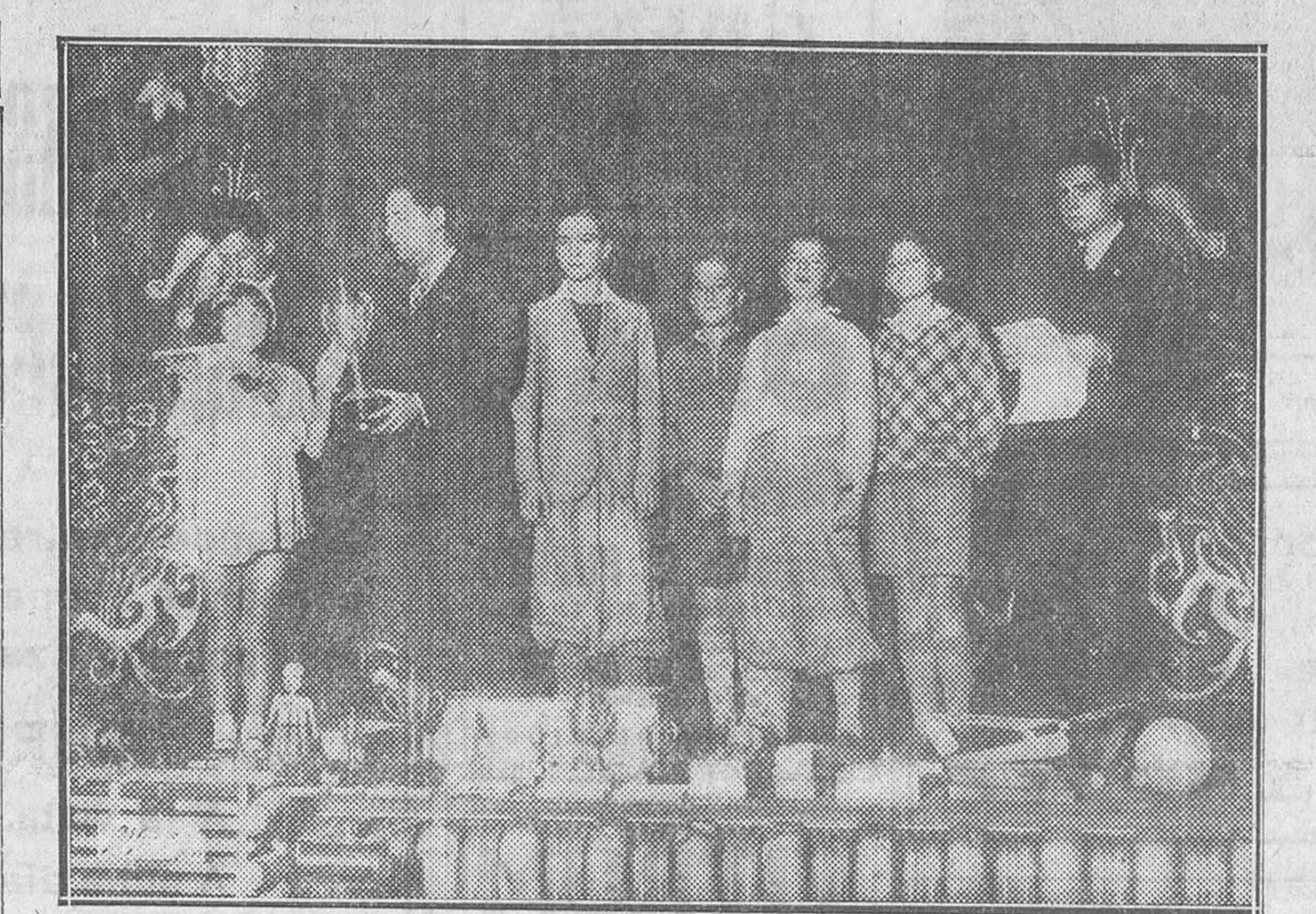
Reparto de premios a los niños que tomaron parte en el campeonato infantil de natación celebrado en La Isla el domingo último

Oído el informe del Sr. Cárcer, que asistió al partido Racing de El Ferrol-Celta como delegado del Comité ejecutivo, y enterado éste de los incidentes ocurridos en El