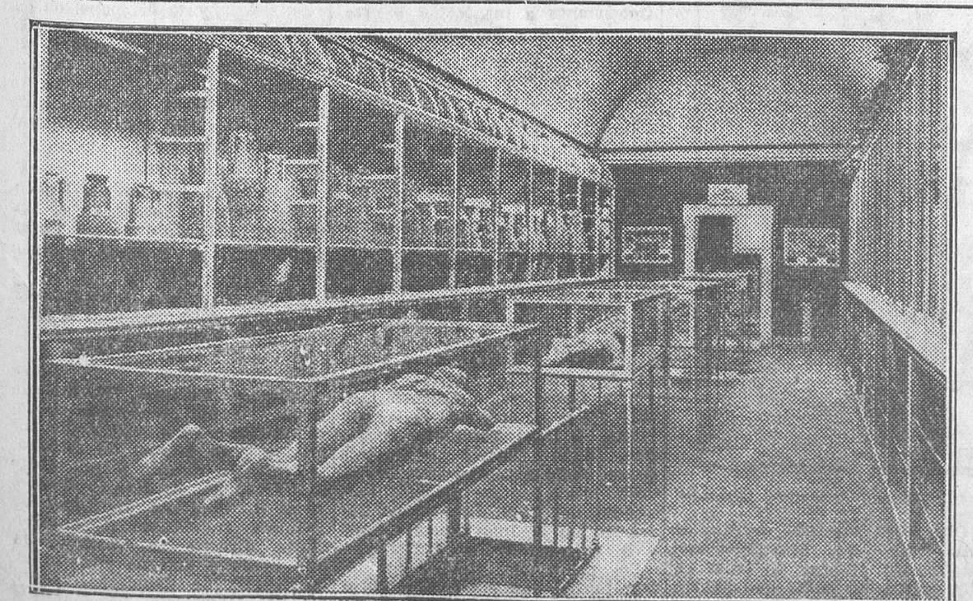
MUSEO DE POMPEYA.—Cuerpos petrificados de algunas víctimas de la catástrofe que destruyó la famosa ciudad el año 79 (después de J. C.)

Zaragoza, 5.—El gobernador civil manifestó a los periodistas que, por orden del ministro de la Gobernación, han sido puestos en libertad varios de los detenidos por los sucesos de Letux que no estaban sometidos a procedimiento judicial.