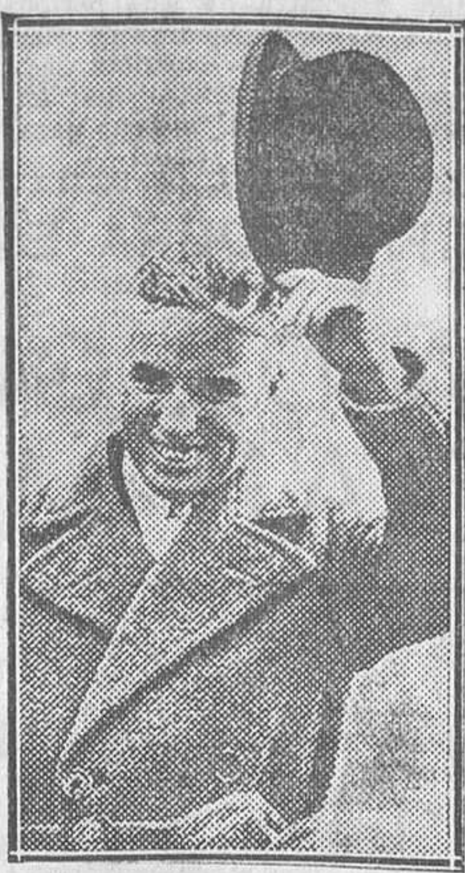
Este hombre de franca sonrisa, de gesto acogedor, de aspecto juvenil y fuerte, a pesar de su cabellera gris, casi blanca, es el Sr. Charles Spencer Chaplin.