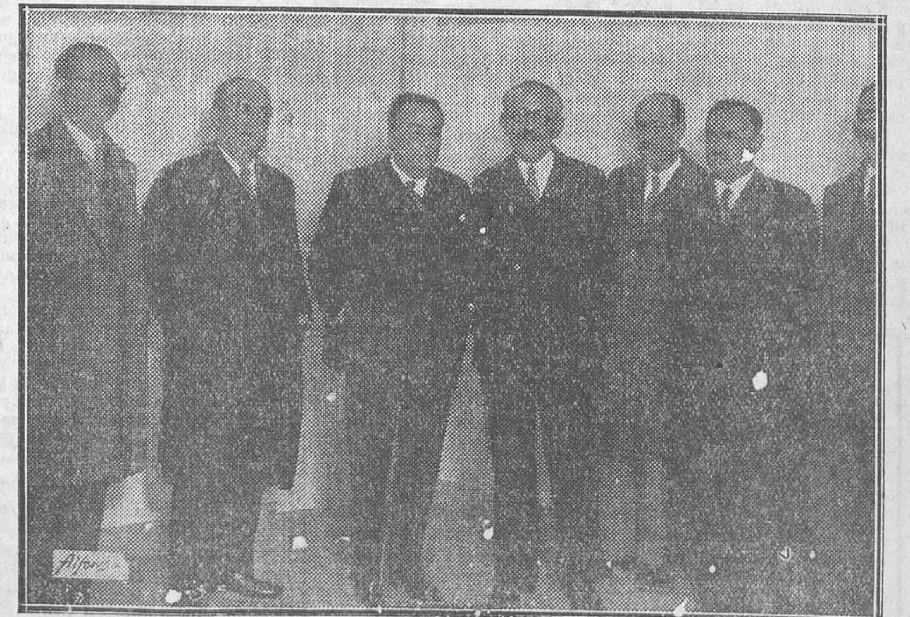
M. Paul Langevin, profesor de Física del Collège de France, al terminar la notabilísima conferencia que dió ayer en el Instituto Francés