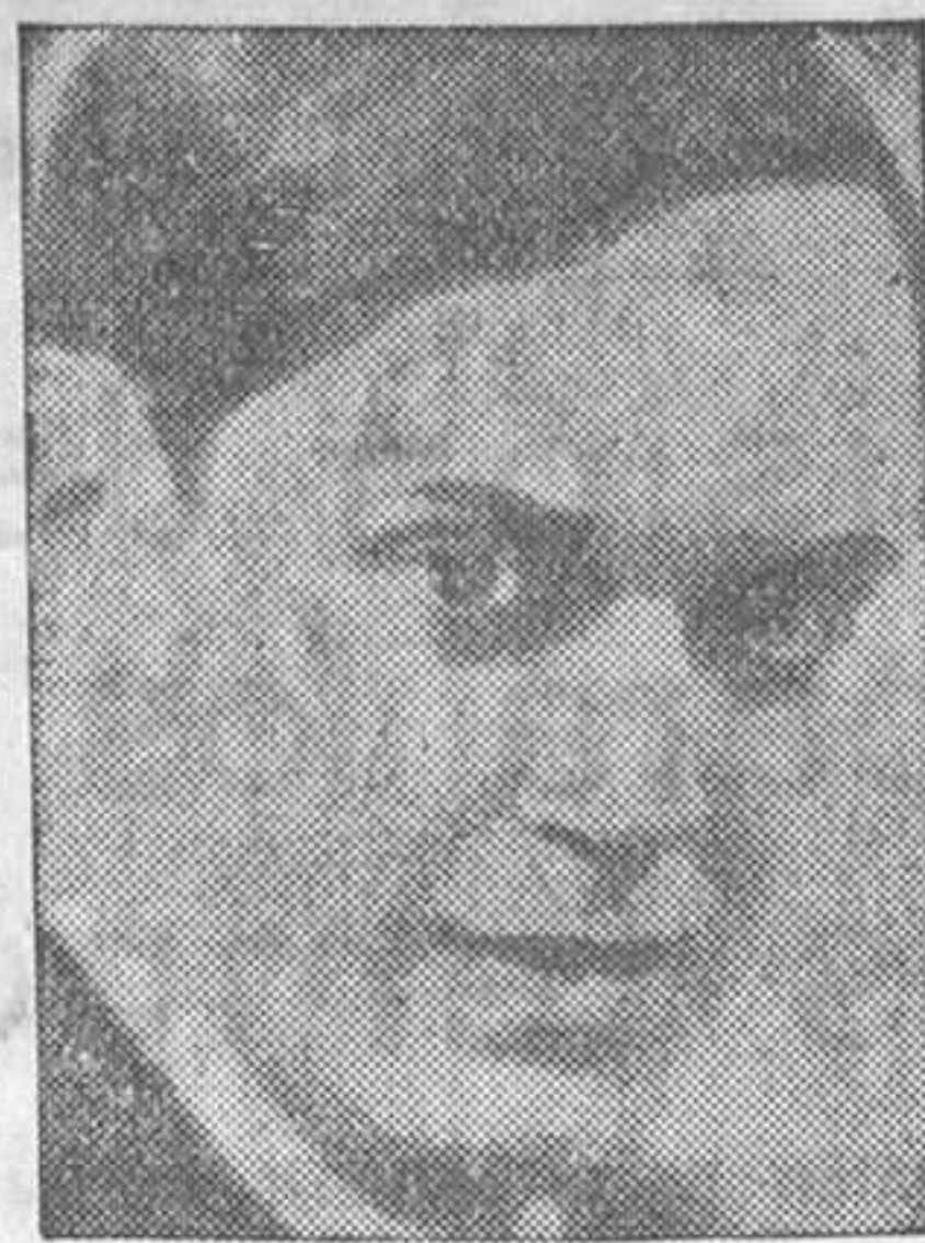
El popular compositor cubano Ernesto Lecuona, que se ha presentado en Madrid al frente de un sugestivo espectáculo de folklore de su país

Instalamos oficinas en el acto. 11, Caballero de Goya, 11. T. 0 18657