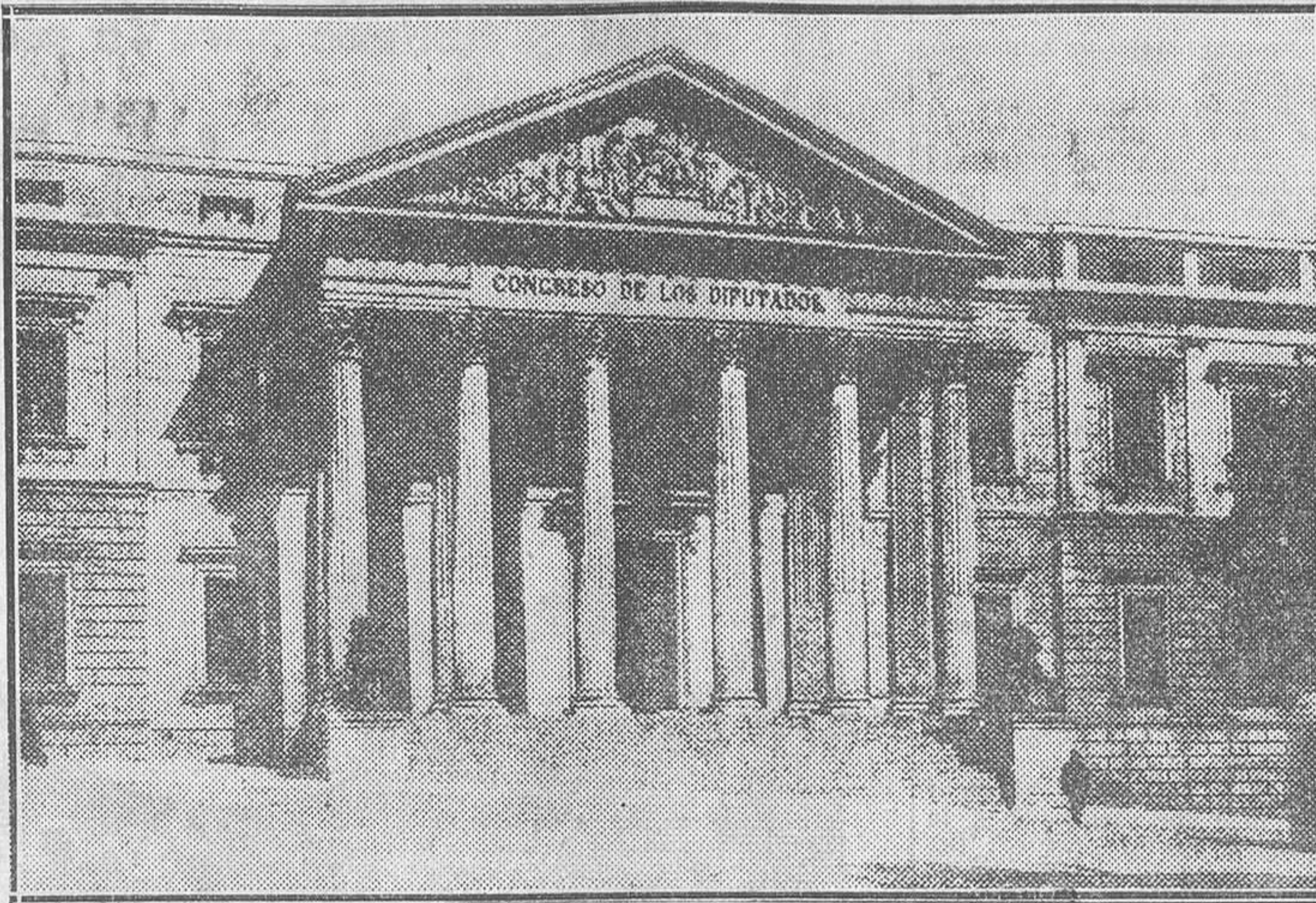
Palacio del Congreso, donde ayer fué aprobada y promulgada la Constitución de la República española, instaurada el 14 de Abril del año actual