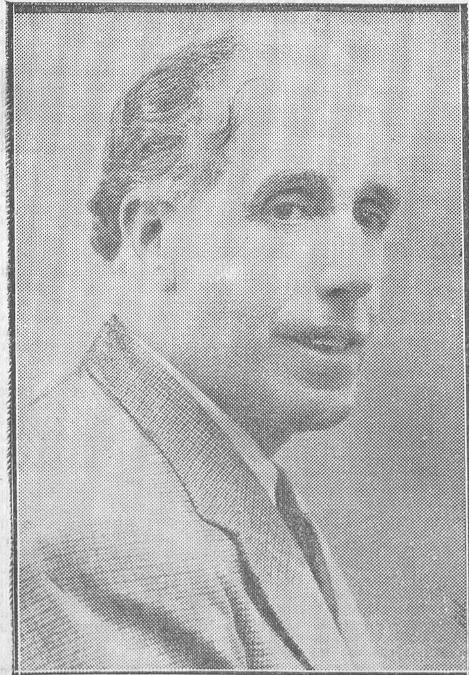
Don Julián Besteiro Fernández, presidente de la Cámara Constituyente

Y ahora, señores diputados, después de estas reflexiones, justo es, creo yo, cuando consideramos sin vanidad, con serenidad, nuestra obra, que pensemos que esta Constitución, en la cual hemos puesto todos nuestros entusiasmos, no puede ser para nosotros, no puede ser para el país, un punto de término, sino que tiene que ser un punto de partida; que lo que pedimos a esta Constitución es que aliene, que estimule las iniciativas individuales y colectivas pa-