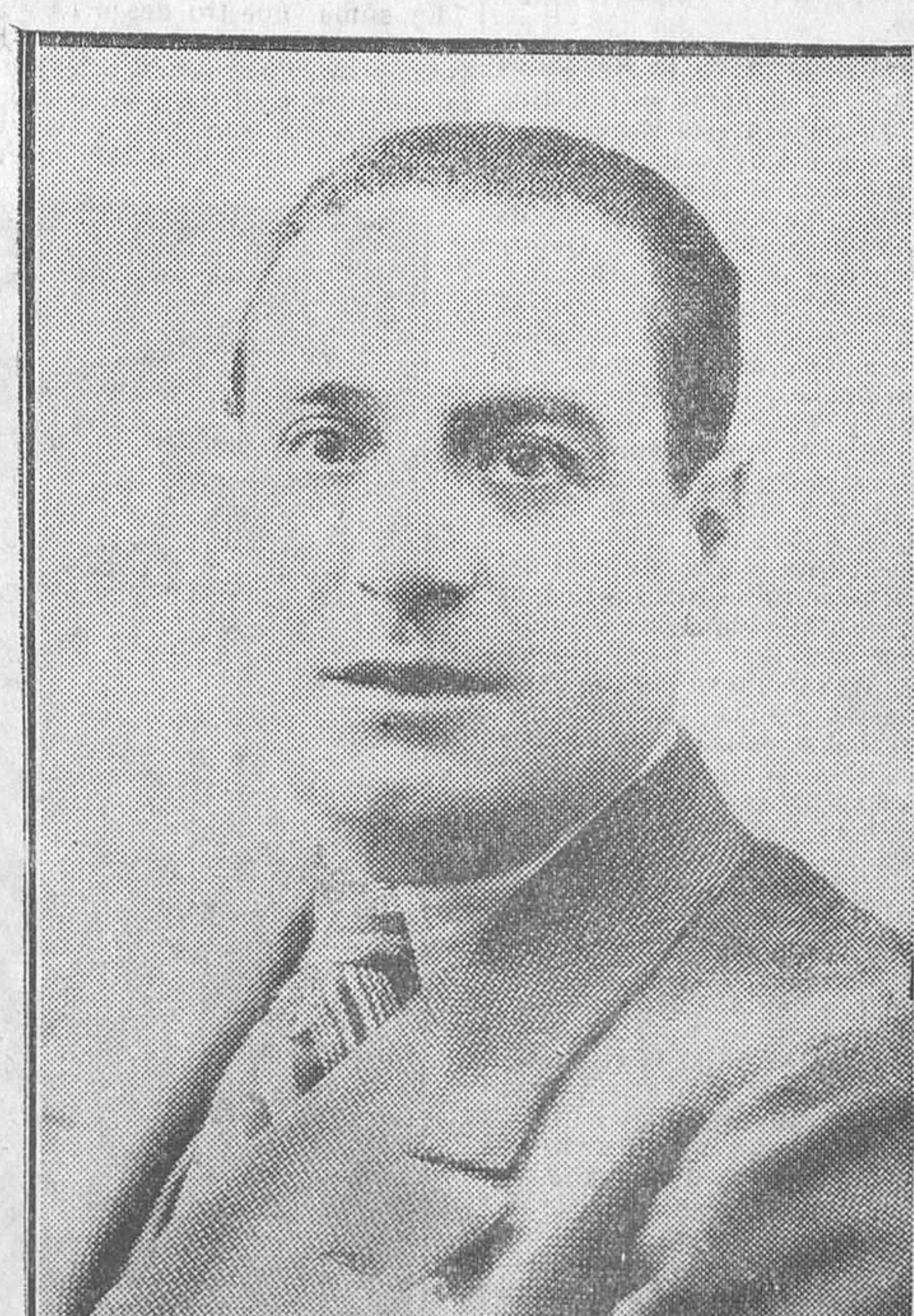
Don Luis Jiménez de Asúa, presidente de la Comisión de Constitución