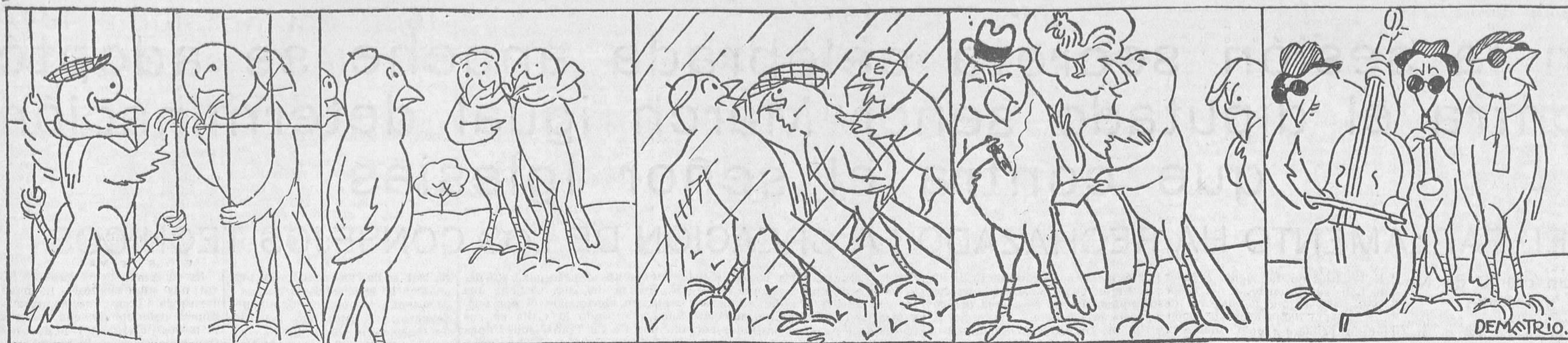
Gorrion.—¡Si yo fuese canario flauta como tú, me iba a estar «encerrao», por la otra punta!...