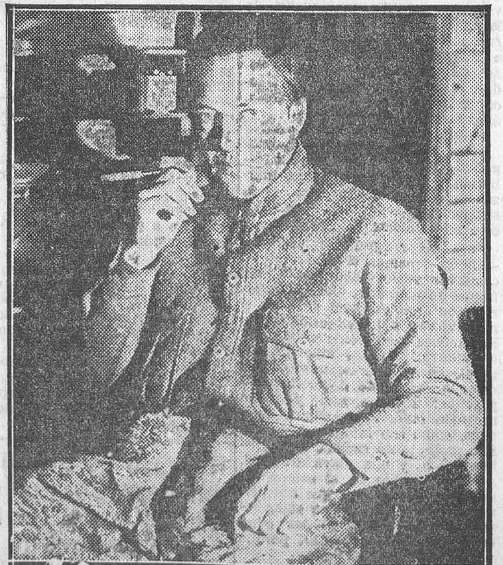
EL ALMIRANTE NORTEAMERICANO BYRD, JEFE DE LA FAMOSA EXPEDICION EN LA QUE SE FILMO LA PELICULA PARAMOUNT «CON BYRD EN EL POLO SUR», QUE SE EXHIBE EN EL CALLAO