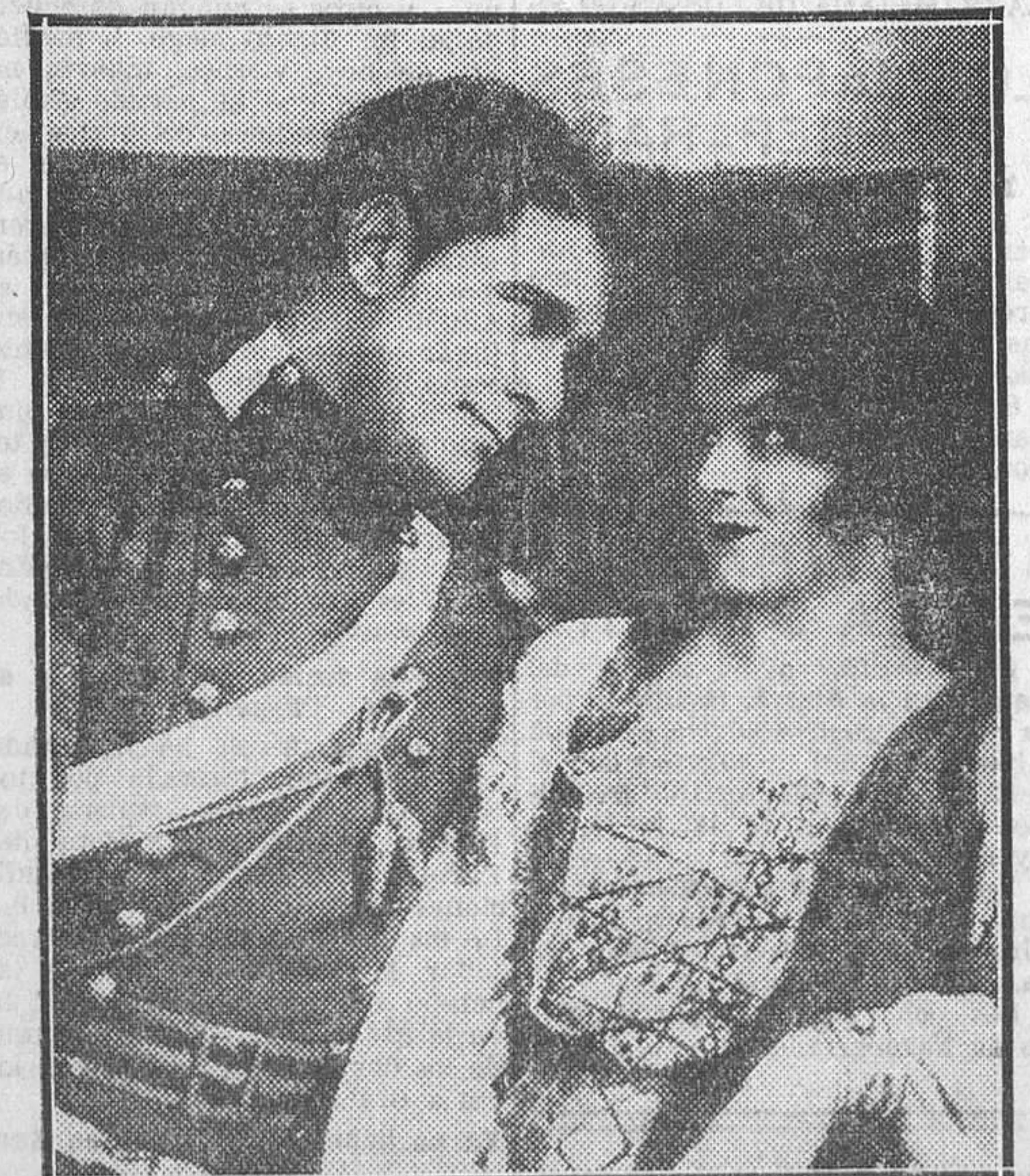
UNA ESCENA DE «BALACLAVA», EL FILM HISTORICO DE AMBIENTE RUSO QUE LAS SELECCIONES FILMOFONO PRESENTARAN EL LUNES PROXIMO EN REAL CINEMA Y ROYALTY