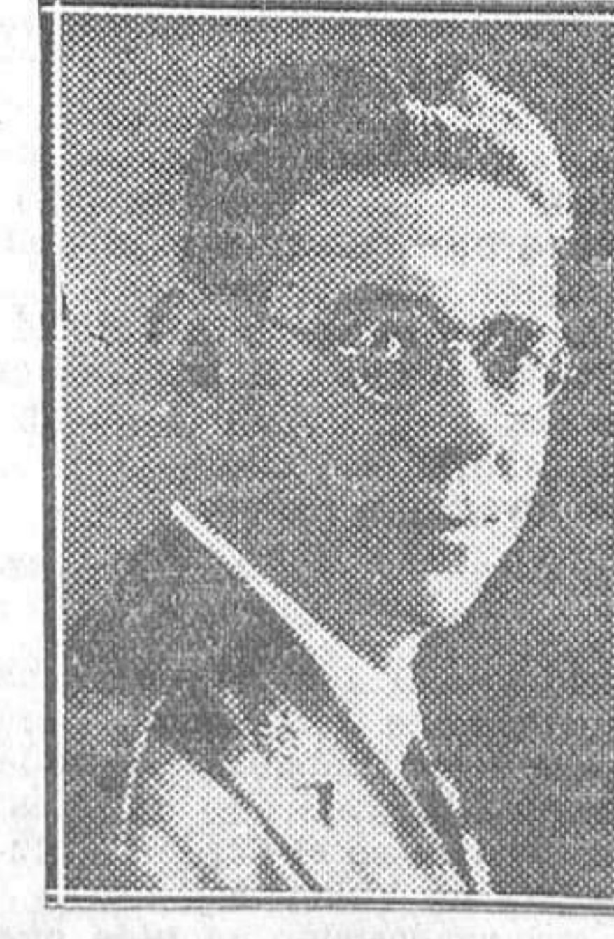
El director de Seguridad, general Mola, levemente herido en el accidente de automóvil de la madrugada de ayer