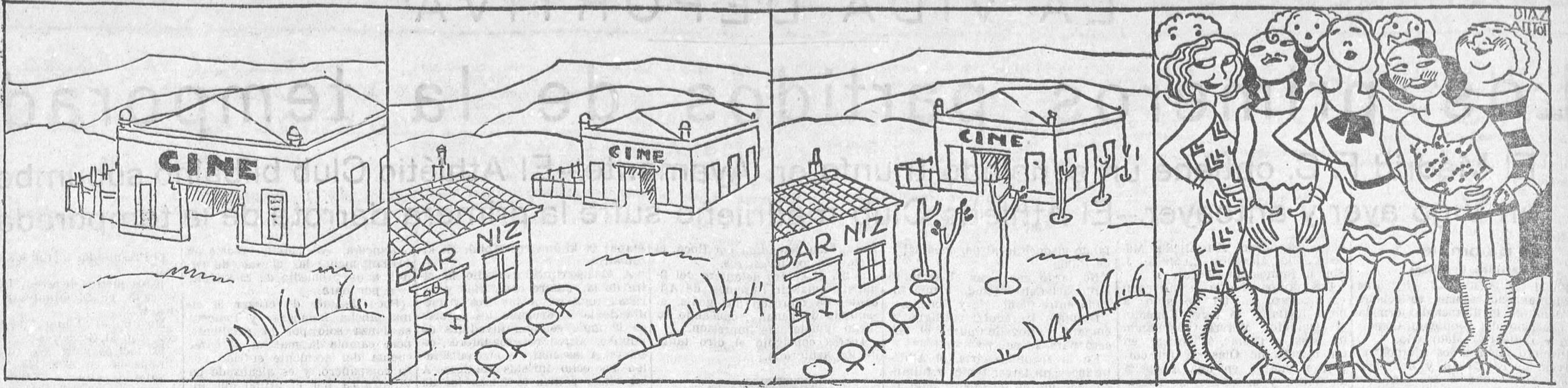
Se construye un cine...