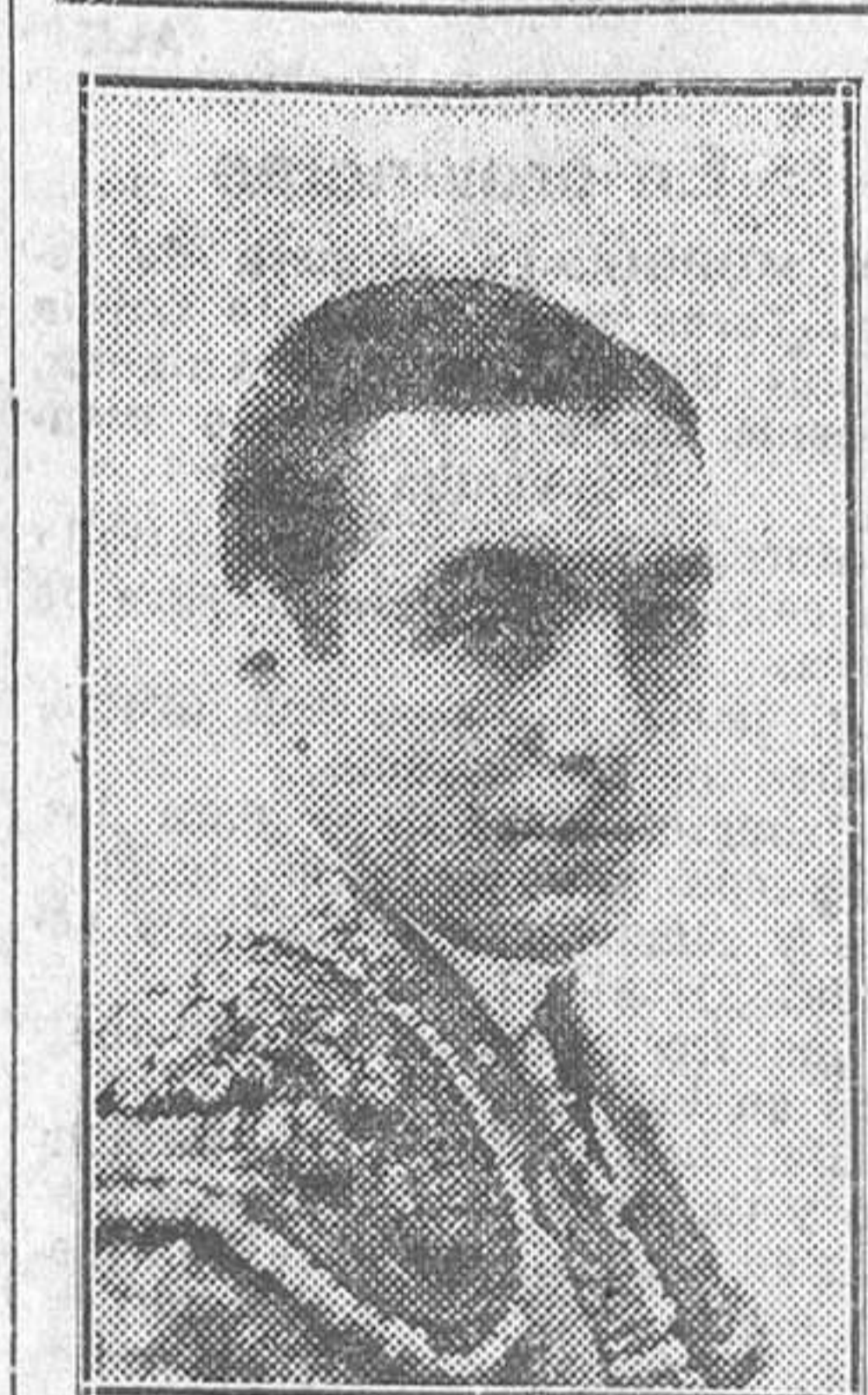
El valiente matador de toros Faustino Barajas, gravísimamente herido por un toro en Barcelona

Tomás Belmonte, en el primero dió unas verónicas colosales, hizo una faena con la izquierda por naturales y dió un superior volapié. (Oreja y rabo.) En el segundo estuvo valentísimo con capote y muleta e inmenso matando. (Oreja y rabo.)