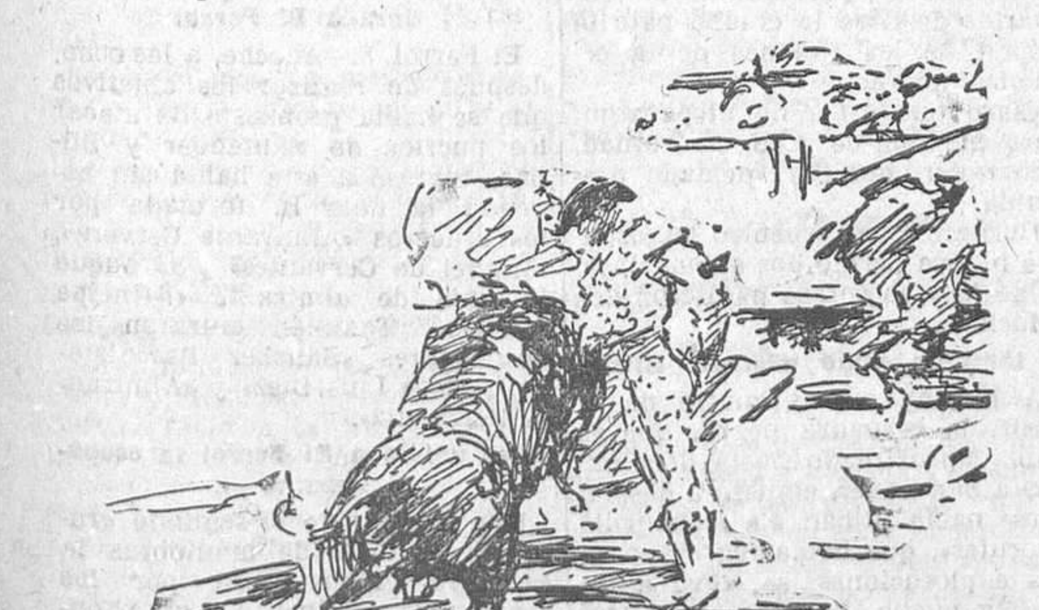
EL DOMINGO, EN MADRID.—Alcalareño II toreado de frente por detrás en el sexto toro