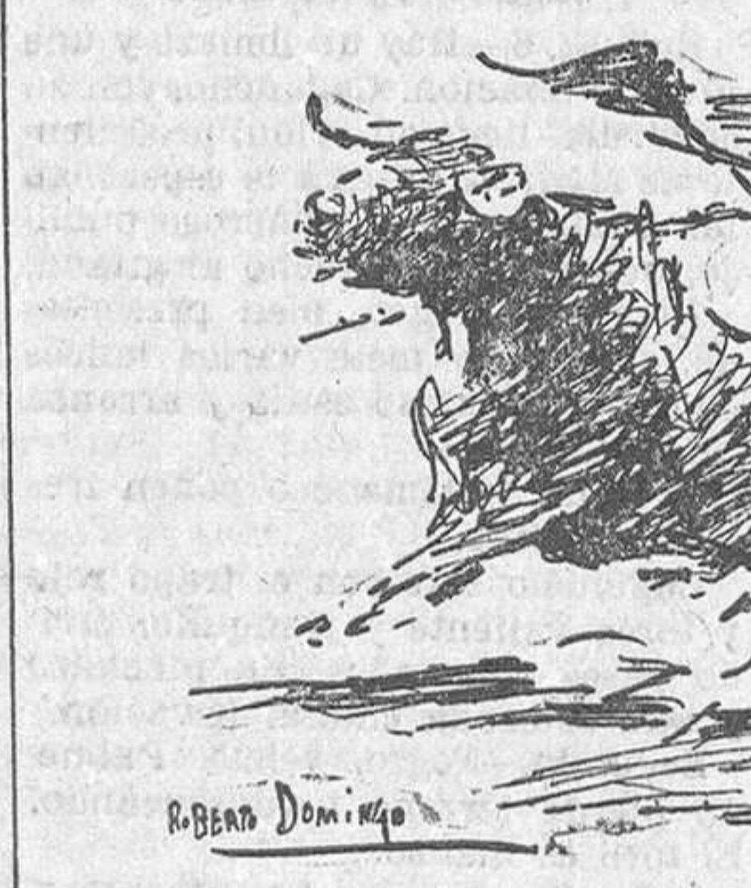
EL DOMINGO, EN MADRID.—Pozo Cueto en un pase al tercer toro

Hace luego una gran faena de muleta, por ayudados, altos, de pecho, en redondo, afarolados y molinetes y da un pinchazo, me-