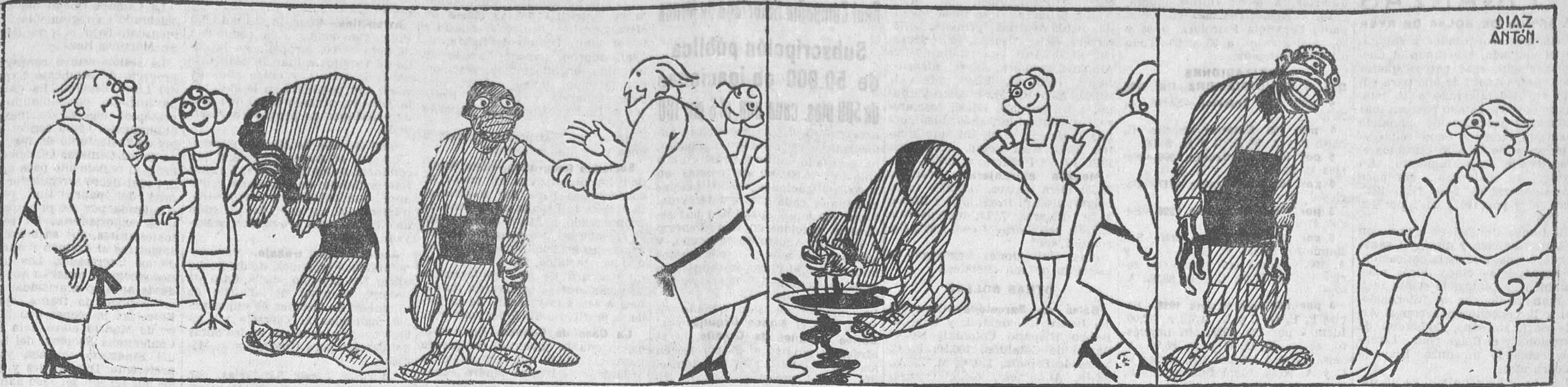
La señora.—¡Pobres carboneros, tan sucios siempre, por la indole de su oficio!...