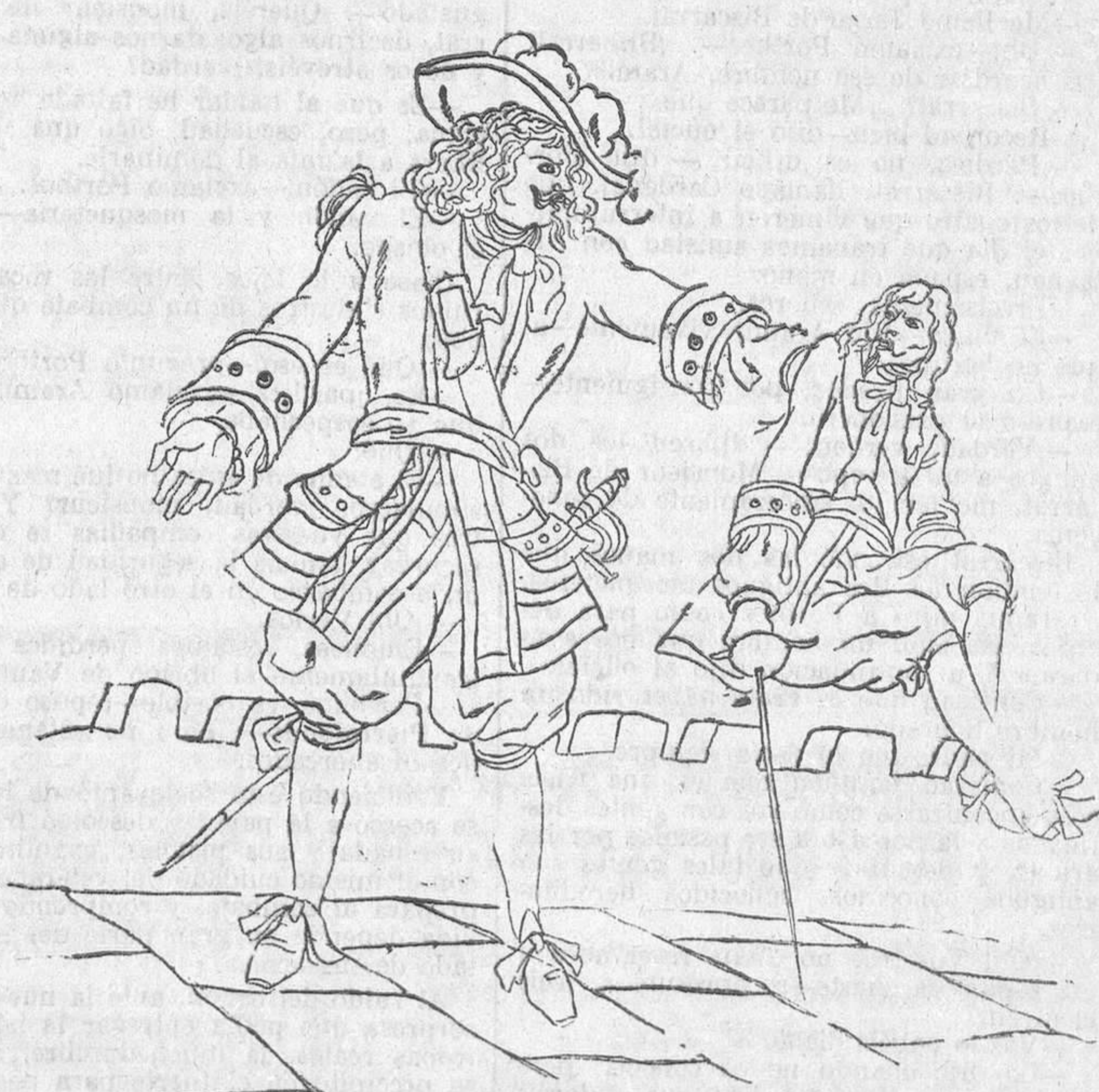
El brazo del gigante arrebató aquella presa, que le sirvió de escudo para volver a subir...

hombre, se dejó dulcemente cautivar por el ingenio de Aramis y la cordial sencillez de Porthos. —Pedonadme—dijo—si os hago una pregunta; pero unas personas que están en su sexta botella tienen el derecho de ser un poco francas. —Preguntad—dijo Porthos—; preguntad. —Hablad—añadió Aramis. —¿No pertenecisteis los dos a los mosqueteros del difunto rey? —Sí, y de los mejores, si no lo tomáis a mal—contestó Porthos.