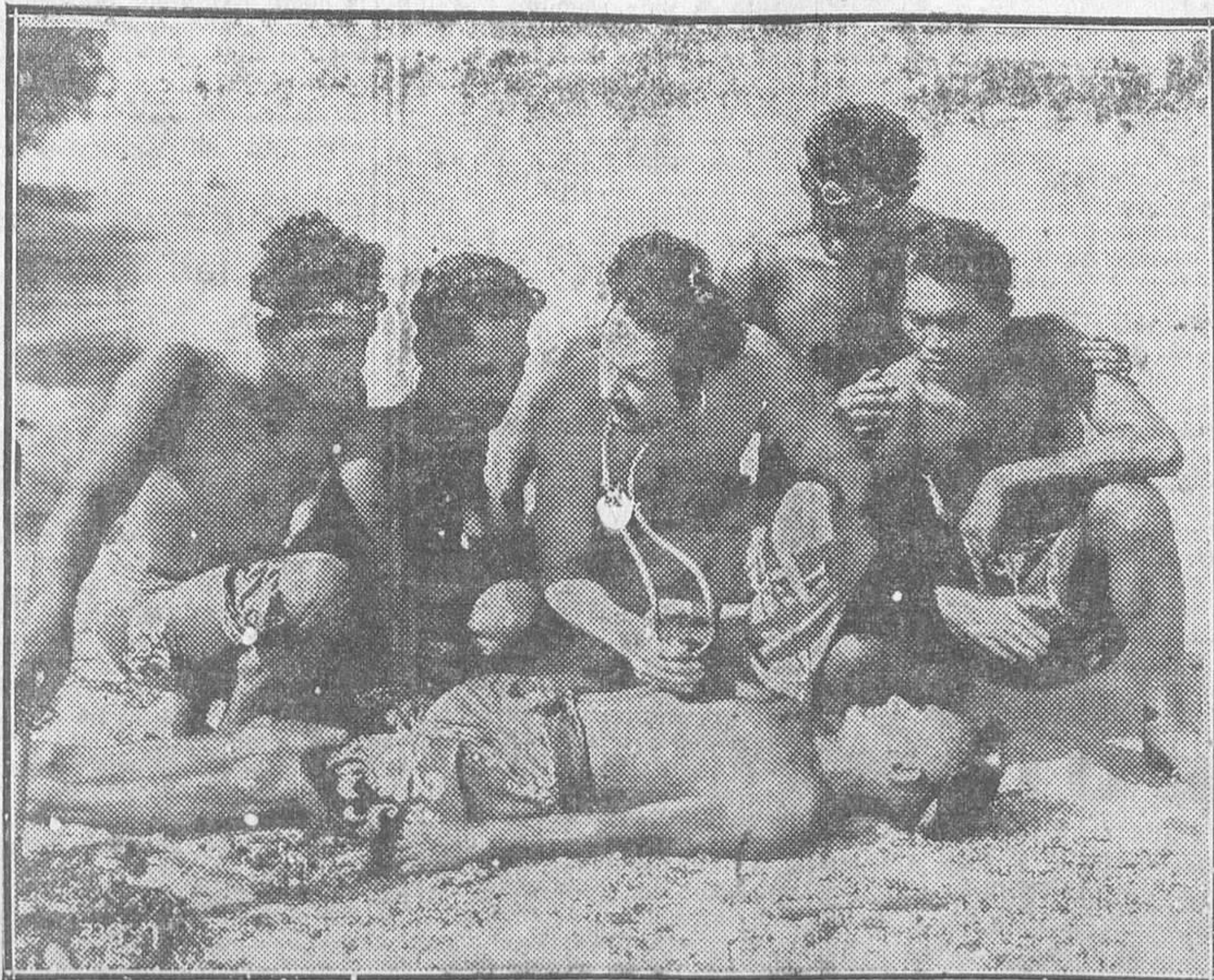
UNA ESCENA DE LA EXTRAORDINARIA SUPERPRODUCCION METRO GOLDWYN, «SOMBRAS BLANCAS», QUE EL LUNES SE ESTRENA EN EL PALACIO DE LA MUSICA