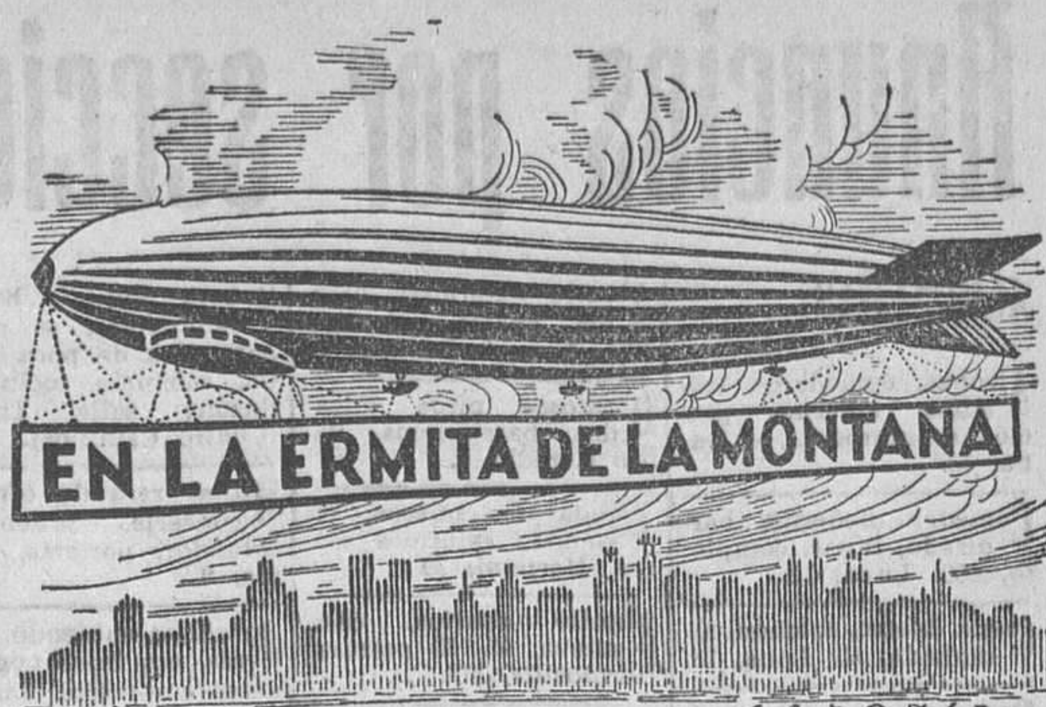
EN LA ERMITA DE LA MONTANA