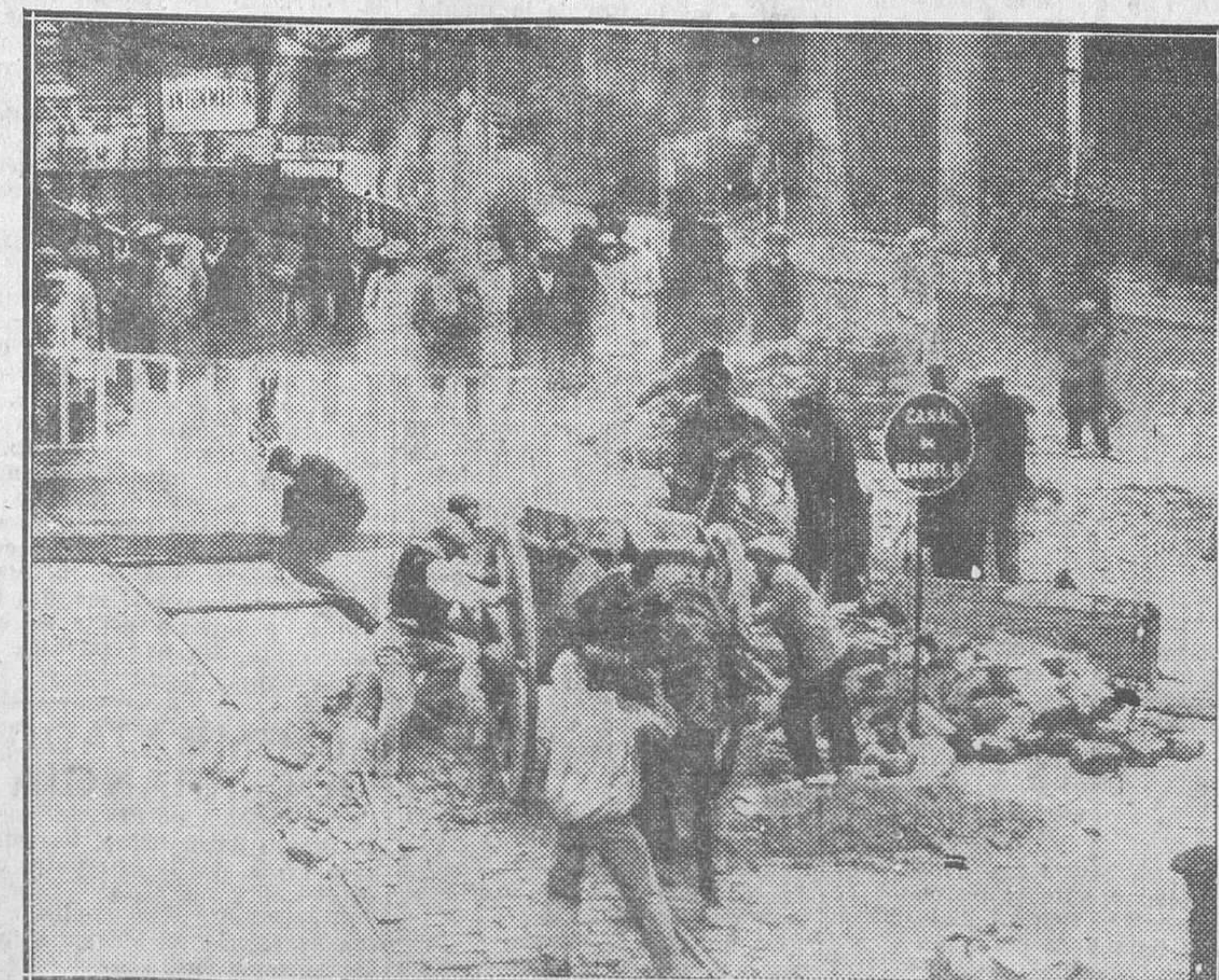
El hundimiento de la plaza de Antón Martín

«Los obreros panaderos de Madrid, reunidos en magna asamblea convocada por el Comité Central del Sindicato de Obreros de las Artes Blancas Alimenticias, conocidos los antecedentes y finalidad perseguida por la clase patronal al suprimir por un acuerdo de la misma la ley y pactos sobre descanso semanal en la industria panadera, con cuya determinación, si llegase a cristalizar, quedarían sin ganar el sustento y el de sus familias cerca de un millar de trabajadores que no tienen otro medio de vida que los dos o tres días de jornal semanal, trabajados en virtud de la ley que concede un día de des-