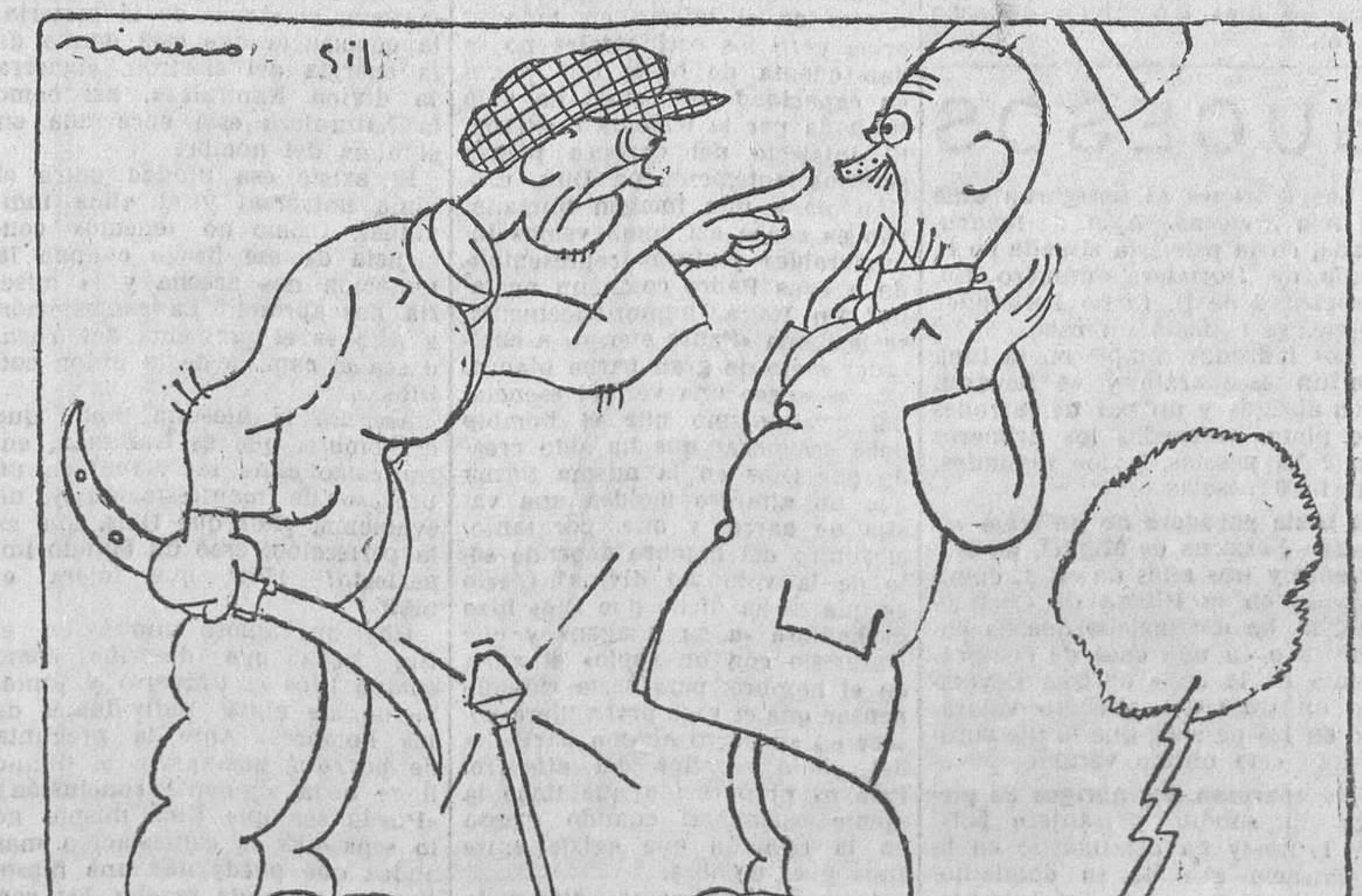
—¡La bolsa o la vida! —¡Caray! ¡Ni en Nueva York!

Y en todas sus facetas innúmeras, la fabricación de zeppelines, la operación del cáncer, el «match» de hidroplanos, el baldeo de un submarino, las regatas de yolas, el discurso de Briand o de Mac Donald, una boda en Silesia, una procesión en Bretaña, son las mismas revistas que poco antes hemos dejado en nuestro despacho, y que ahora en el cine (para que rabie Pirandello), por el «flat lux»—y por el «flat verbum»—de la «talkie», operan en nuestros sentidos, avivándonos, excitándonos, universalizándonos, despertando nuevos afanes de curiosidad.