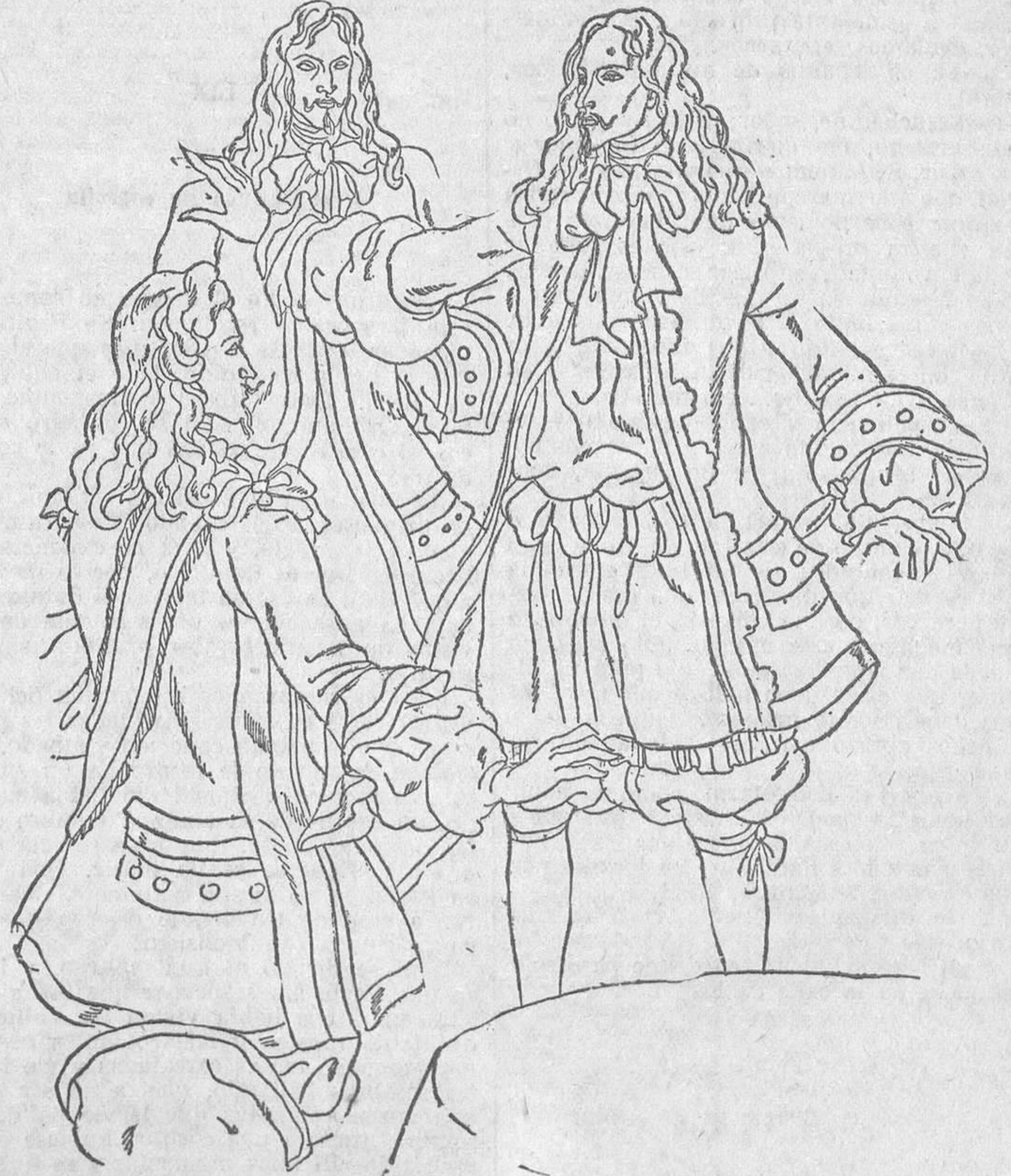
—... Serviré a un amo más poderoso que el rey: serviré a Dios

temple tal, que en ellos toda emoción quedaba oculta, sin dejar rastro, cuando habían resuelto ahogarla en su corazón.