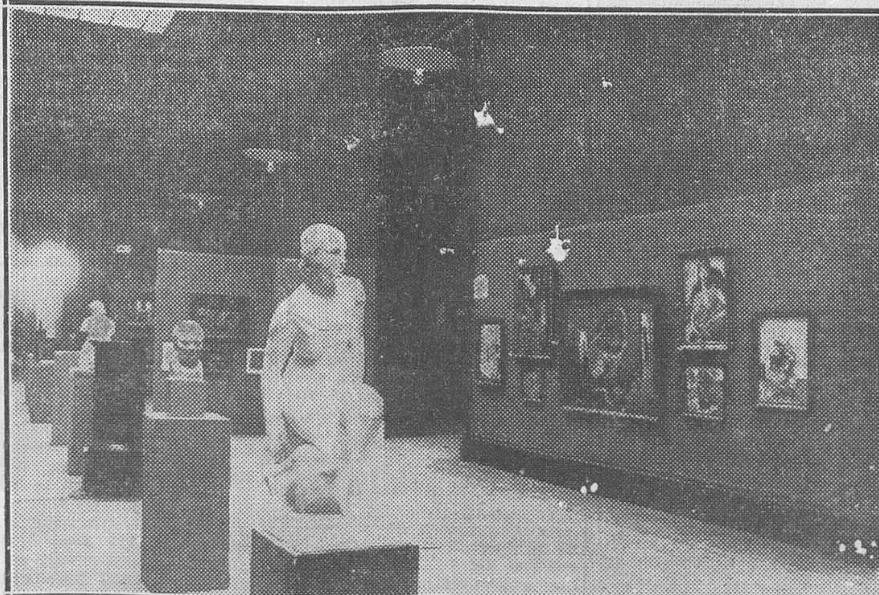
Se acaba de inaugurar con gran brillantez y concurrencia el Salón de Independientes, de París