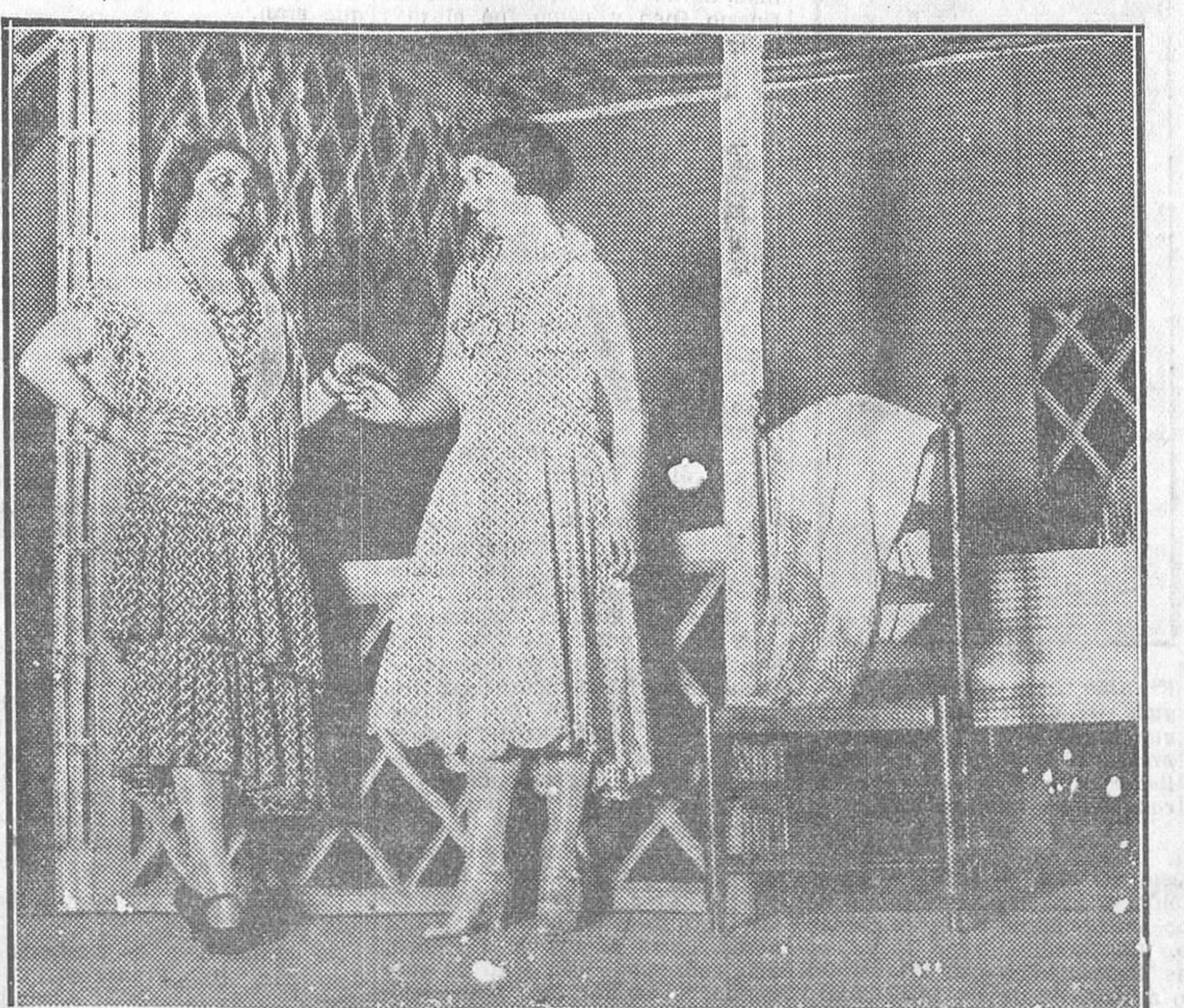
Uno de las escenas más interesantes del segundo acto de la obra de Manuel y Antonio Machado «La Lola se va a los puertos», que se estrenará hoy, por la noche, en Fontalba

Berlín, 7.—Tres mujeres han tomado parte por primera vez en un concurso público de fumar.