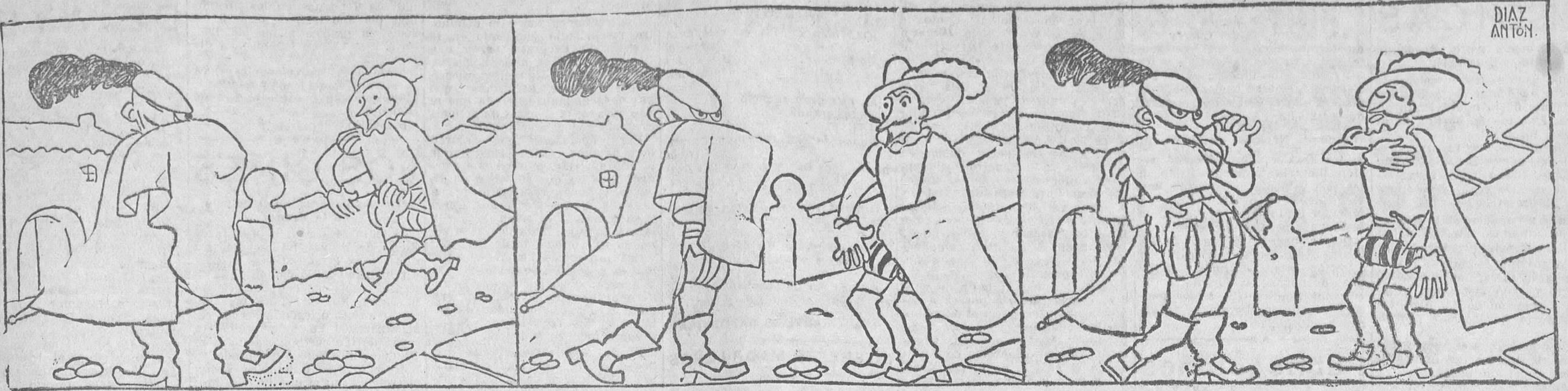
—¡Aquí llega el traidor! ¡Ardo en deseos de provocarle y matarle!