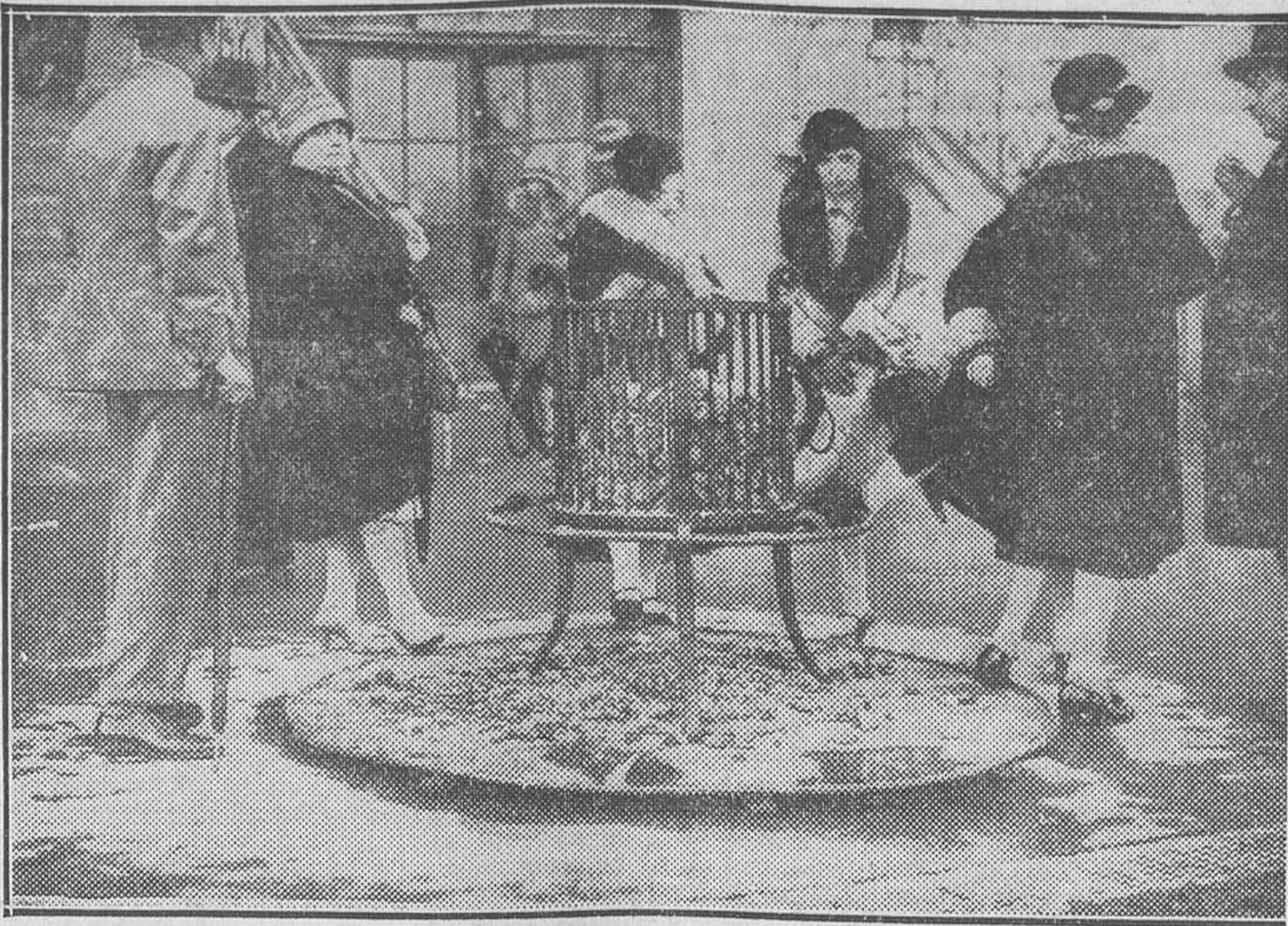
Los primeros fríos. Los braseros del Hipódromo de Auteuil

El «Matin» dice que los principales puntos de la política exterior que se propone desarrollar el Sr. Briand, y que expondrá ante la Cámara en la sesión de