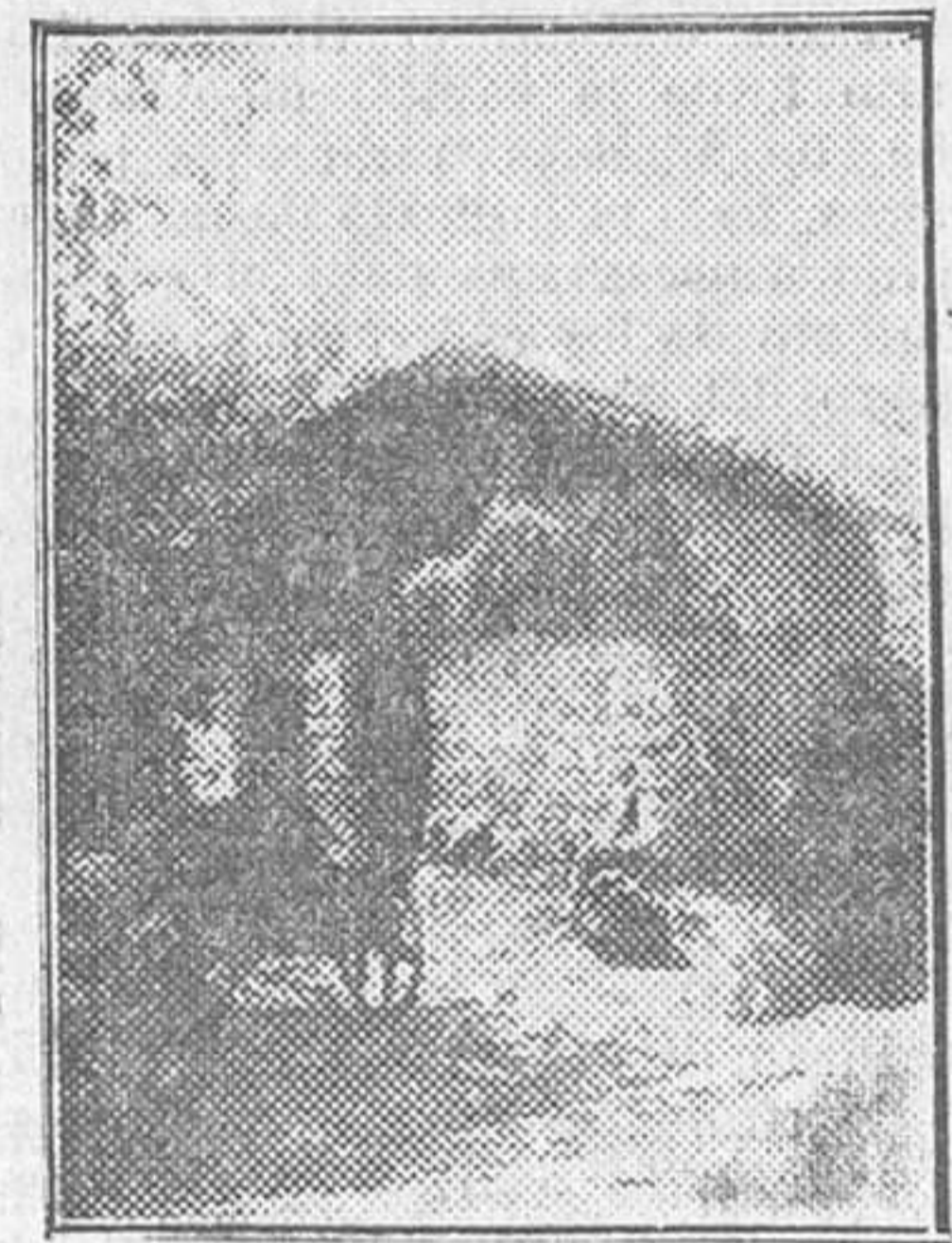
«La Raposera», caserío perdido en las montañas de Asturias, donde puso fin a su vida el Búrgana»