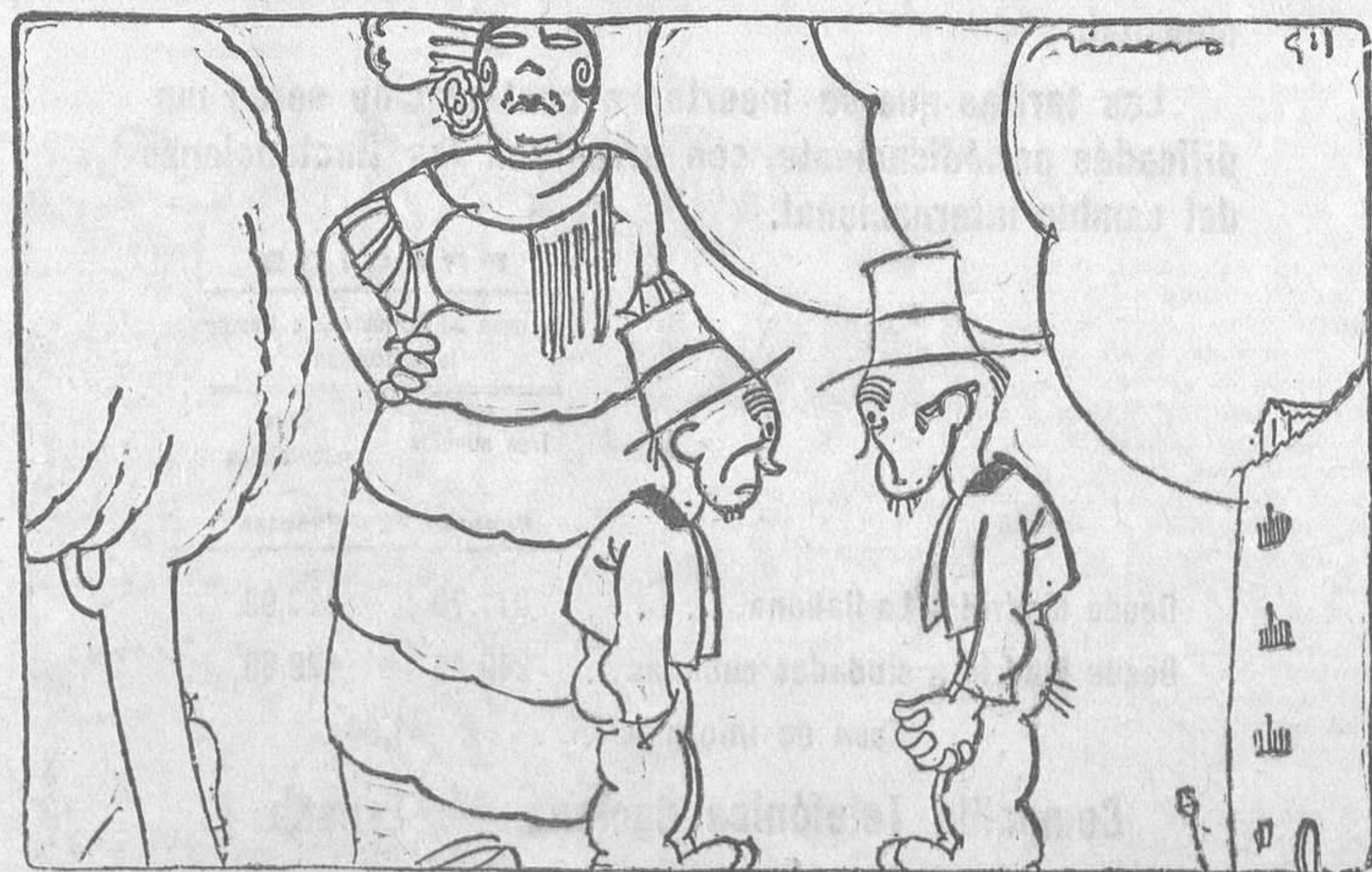
--Quieren hacerla un monumento. --¡Yal ¡Yal Verás como acabamos nosotros dedicándonos a las labores propias de su sexo.

La revisión de este proceso ante el citado Tribunal será en última instancia.