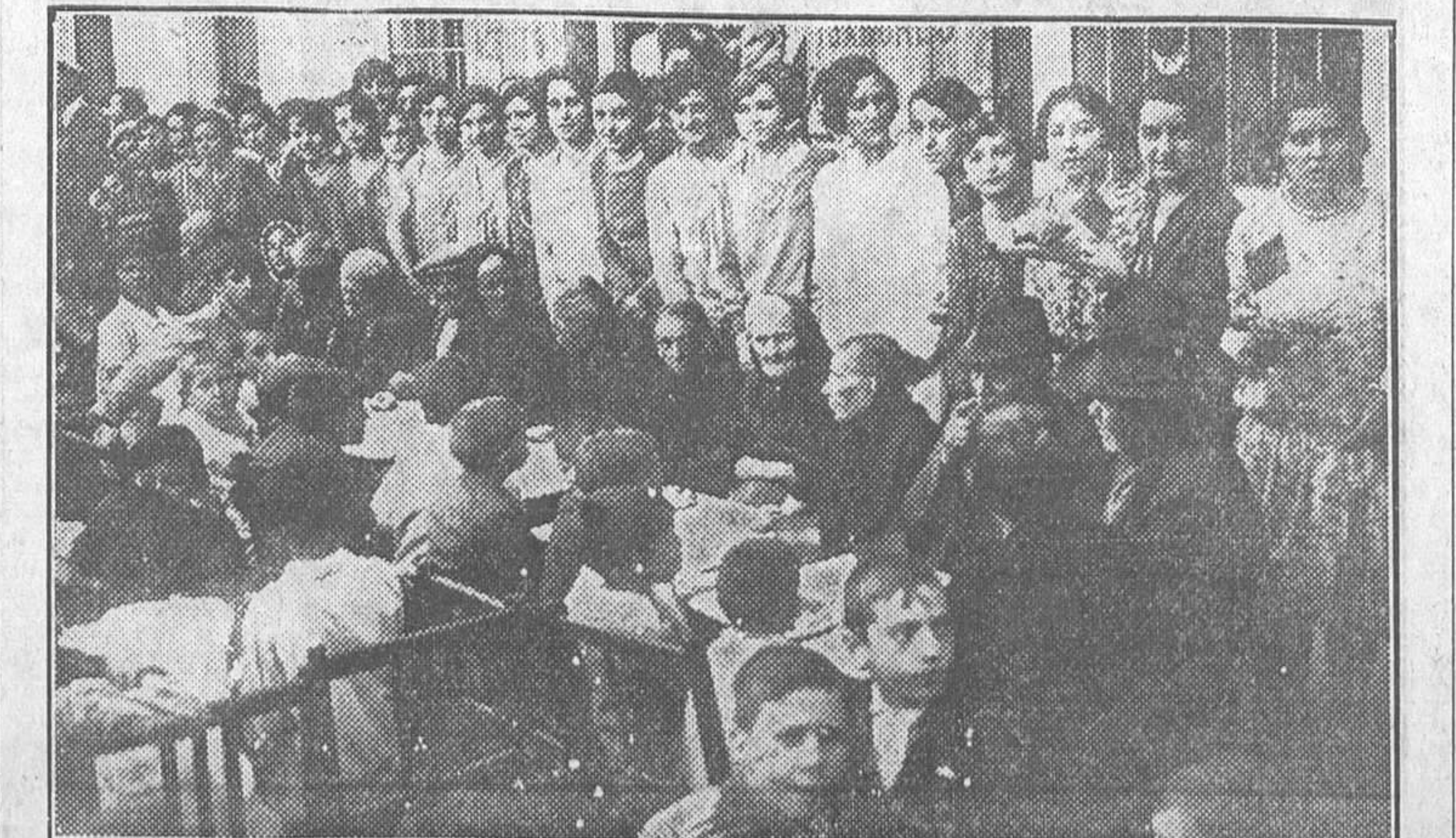
PUENTE DE VALLECAS.—El homenaje a la Vejez y a la Infancia, celebrado en el distrito del Sur

La cantidad desfalcada asciende a 70.000 pesos.