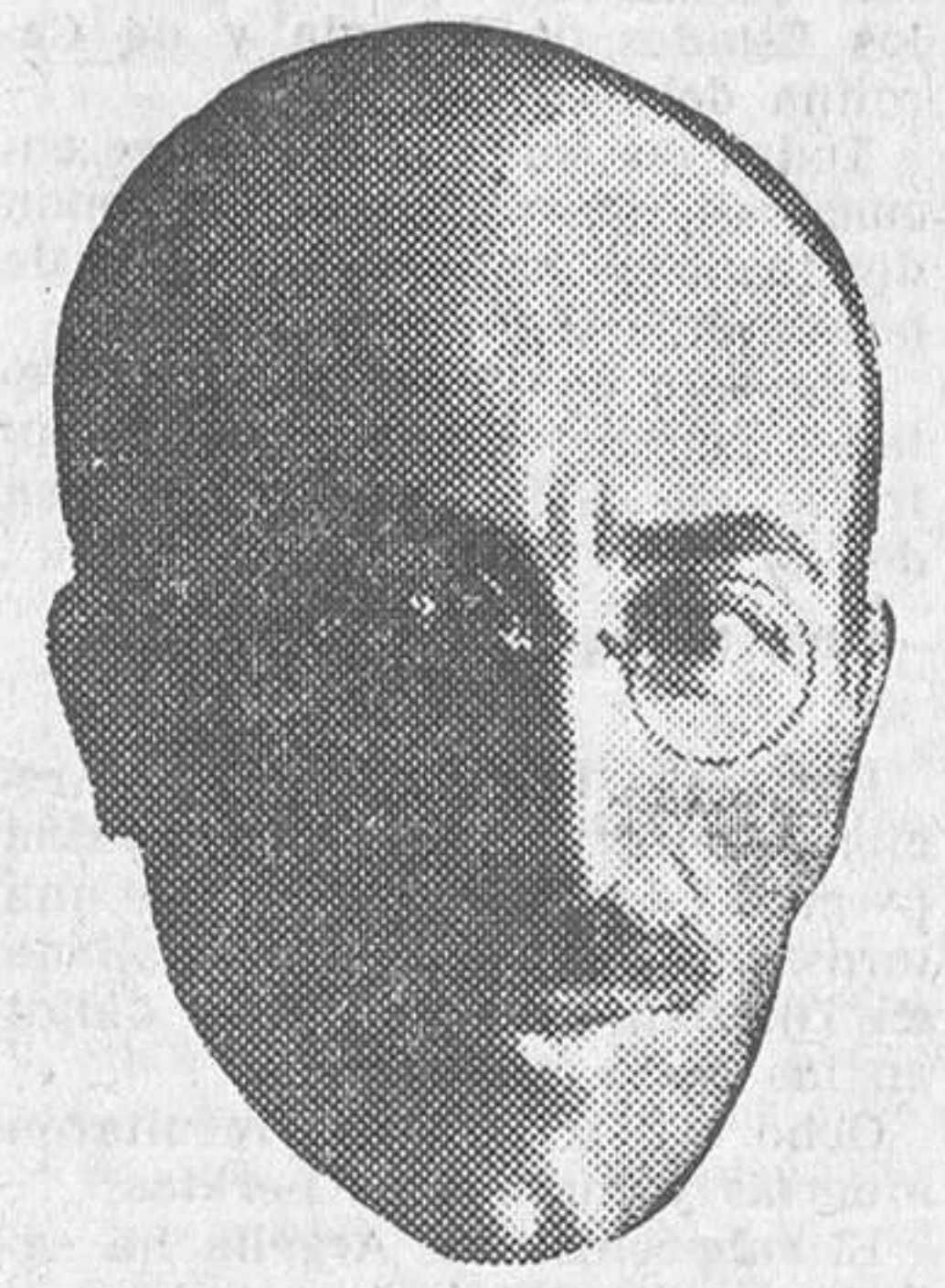
Enrique González Fiol, "El Bachiller Corchuelo"