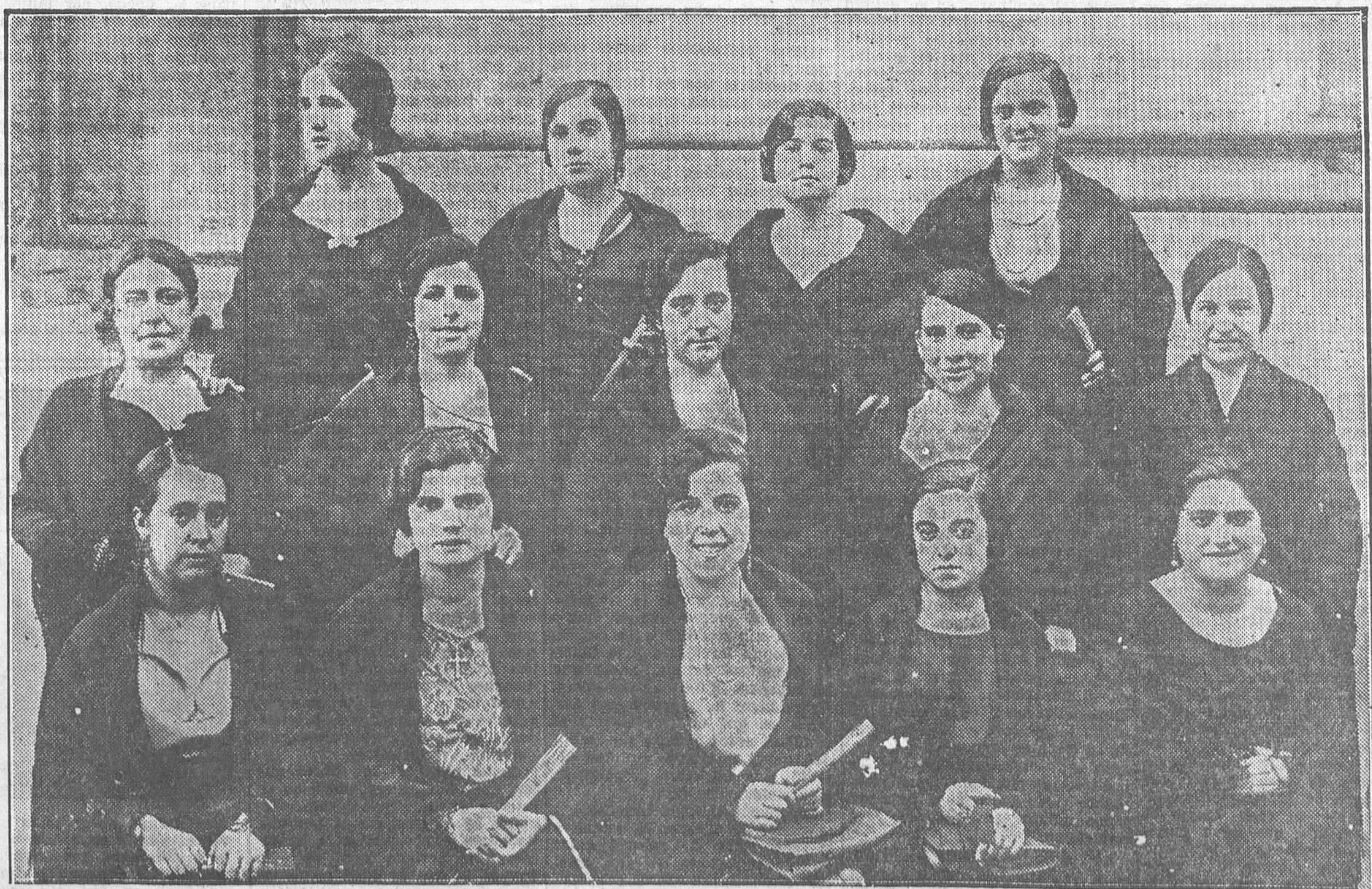
Diezce castizas madrileñas, premiadas en el concurso de mantones de crespón negro, celebrado con motivo de la verbena de la Paloma