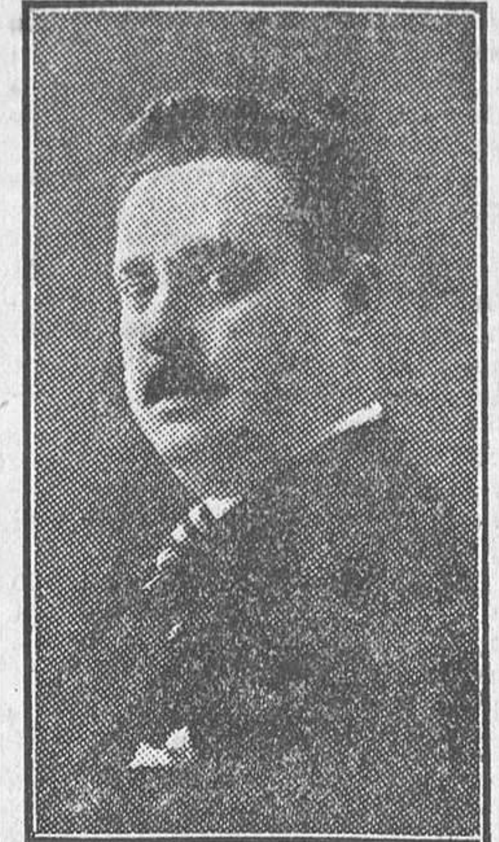
Doctor José P. Juggiar, liberal y democrata, elegido presidente de la República del Paraguay

Asunción, 17.—Después de prestar el juramento constitucional, ha tomado posesión del cargo de pre-