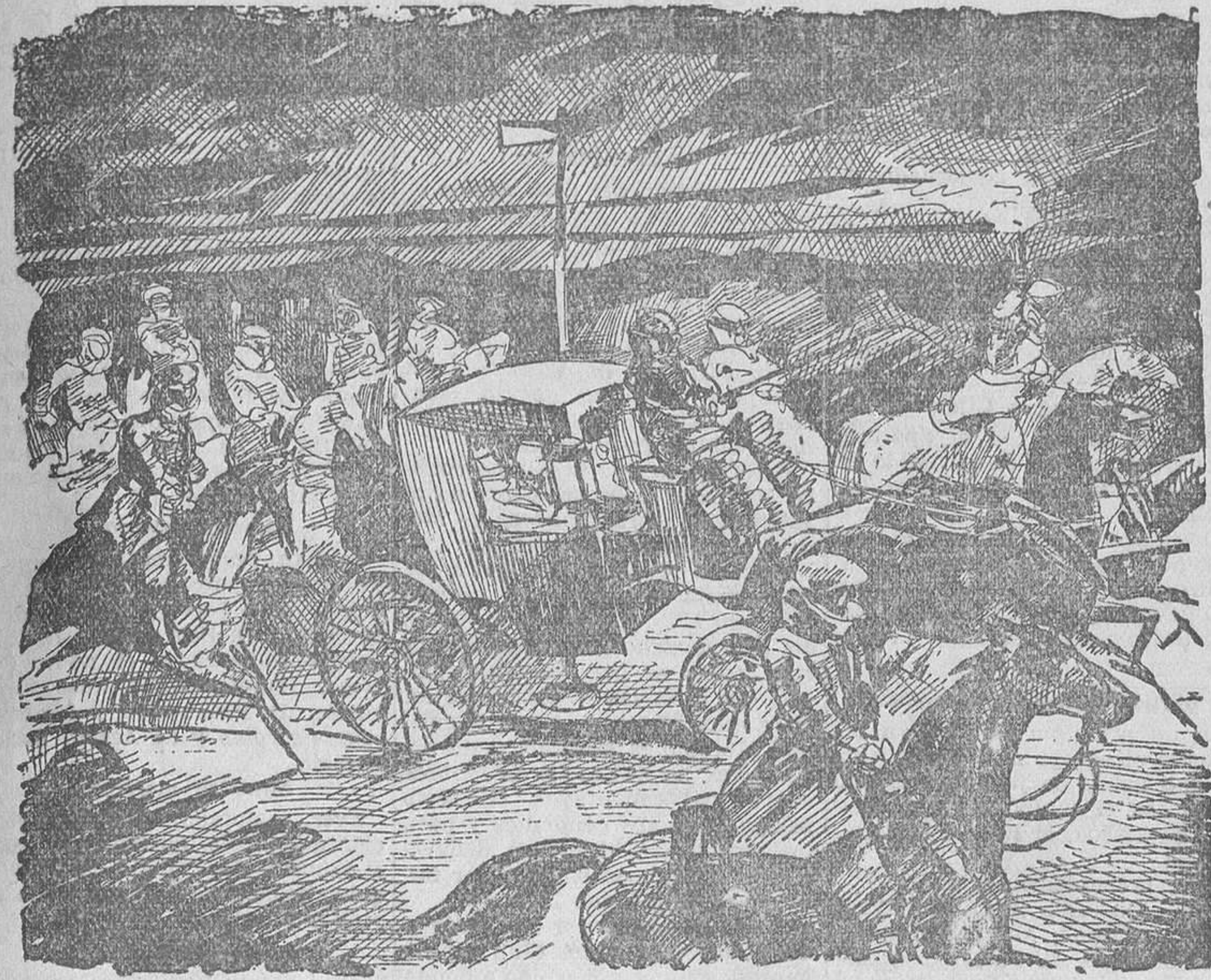
Don Carlos busca refugio en Francia (Estampa de Enrique García Ormaechea.)

—No lo recuerdo. Venga de ahí. —En el patio de cierto convento hallábase un ganapan, fornido y nervudo, metiendo en caja, morced a un gran pison de madera y a puros golpes, varios adoquines que se habían salido de su sitio, y a medida que iba dando sobre el pedruzco, objeto de sus energías varoniles, exhalaba un ¡jaáá coincidente con el tremen-