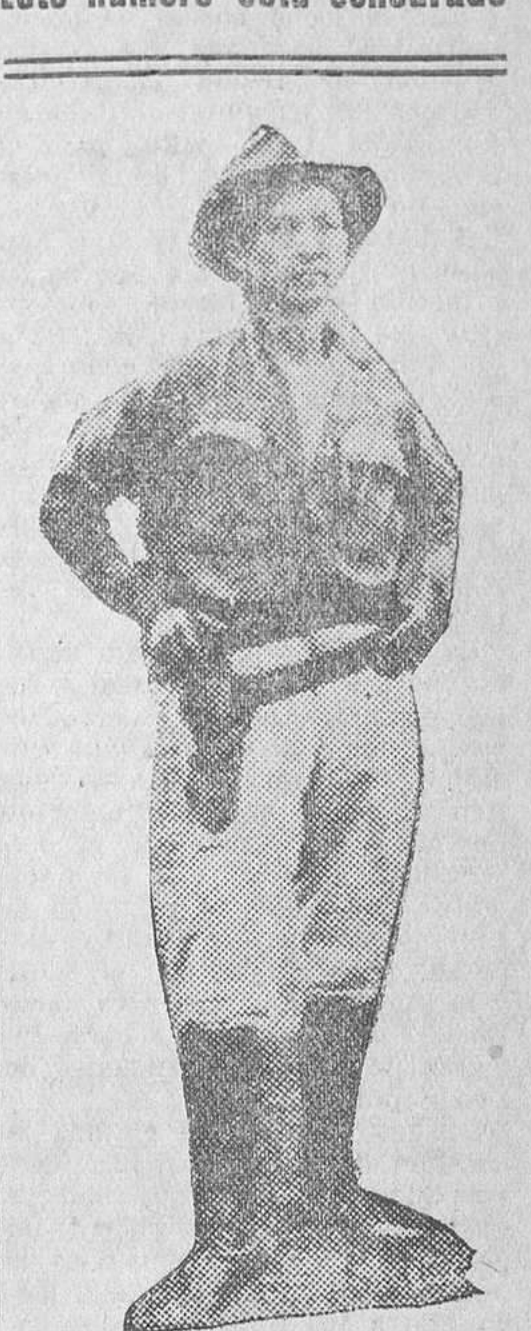
El general Sanfán, héroe de la independencia en Nicaragua