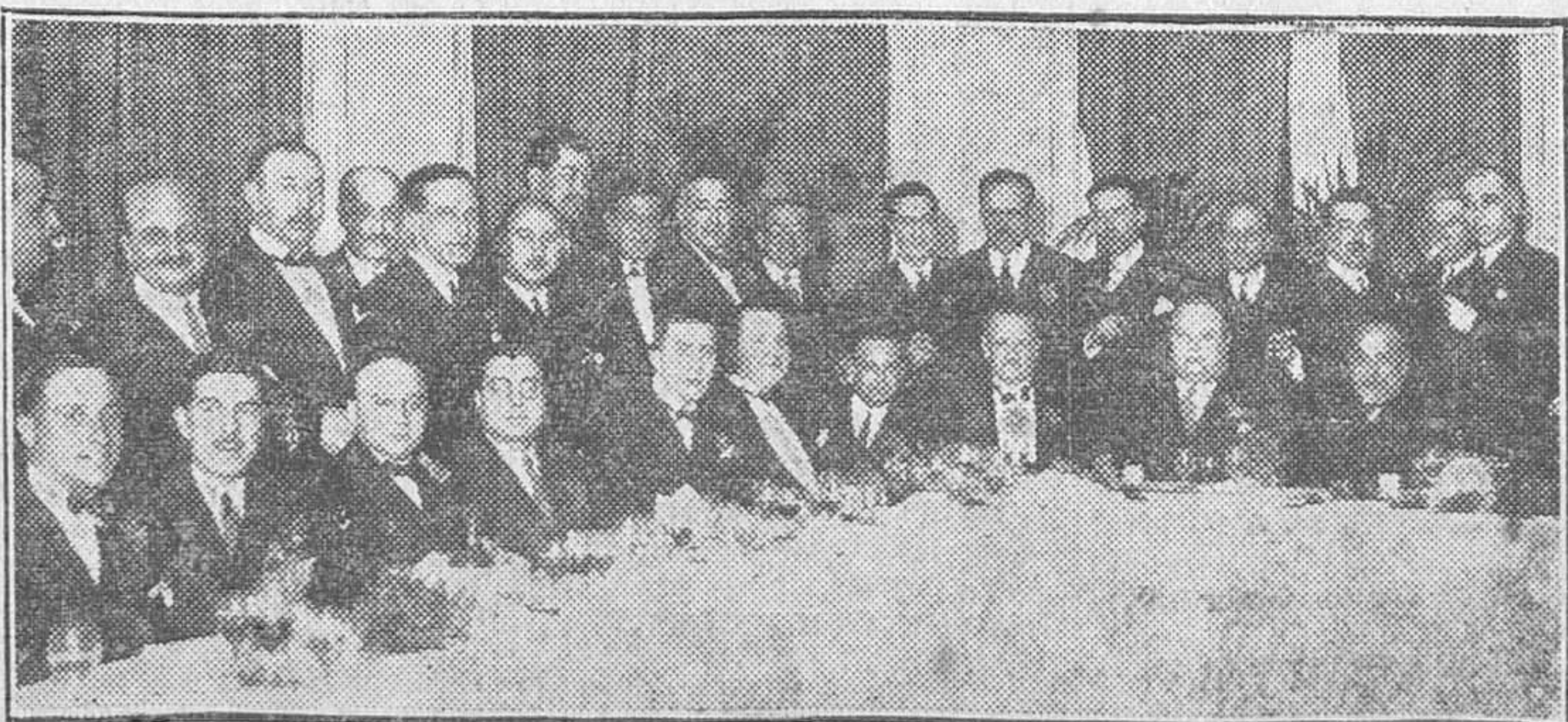
Los abogados republicanos, reunidos anoche en el Ritz para celebrar con un banquete el aniversario de la proclamación de la República en España