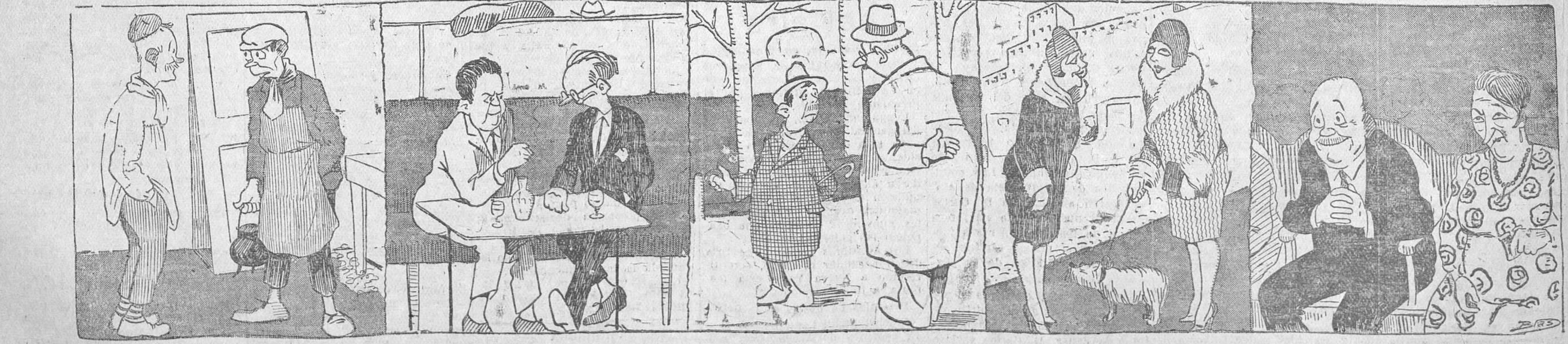
—Hemos «formao» una estudiantina «pa» estos carnavales el «Manga», el «Chirri», servidor y otros estudiantes. —Bueno; ¿pero vosotros qué estudiáis? —Un pasodoble. —Estuviste en el estreno de «En plena locura»? —¡Ahí, ¡pero han estrenado ya su comedia Muñoz Seca y Azorín? —El movimiento en la Isla de Creta parece cosa seria; lo dirige Konduros. —Gente práctica; porque los movimientos hay que hacerlos con duros. —Me han dicho que haces una magnífica boda. —¡Figúrate! Me caso con un hombre que no paga impuesto de salidas. Un matrimonio presenciado la representación de una revista frívola.