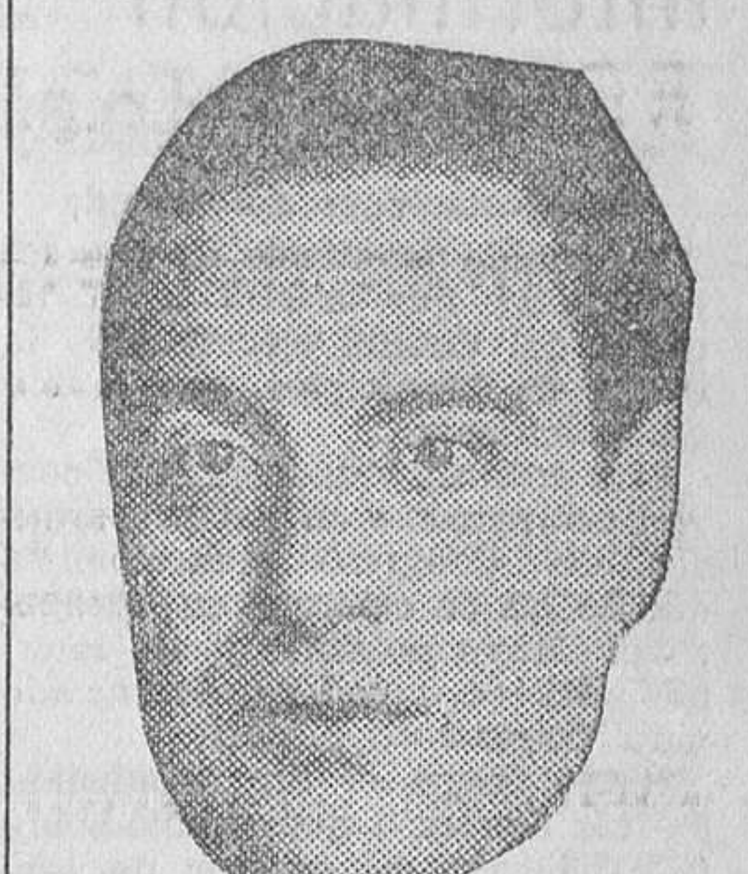
El catedrático e insigne pensador Luis Jiménez de Asúa

Dijo que el cuidado por la raza se manifestó ya en los brahmanes, que tenían la costumbre de matar o abandonar a los niños que después de dos meses de nacidos les parecían de mala con-textura. Algo parecido hacían los espartanos, y los celtas efectuaban verdaderas prácticas de eutanasia, pues daban muerte, además a los niños deformes, a los ancianos valedurnarios. El conferenciante dice que incluso en nuestros días conservan esas cos-