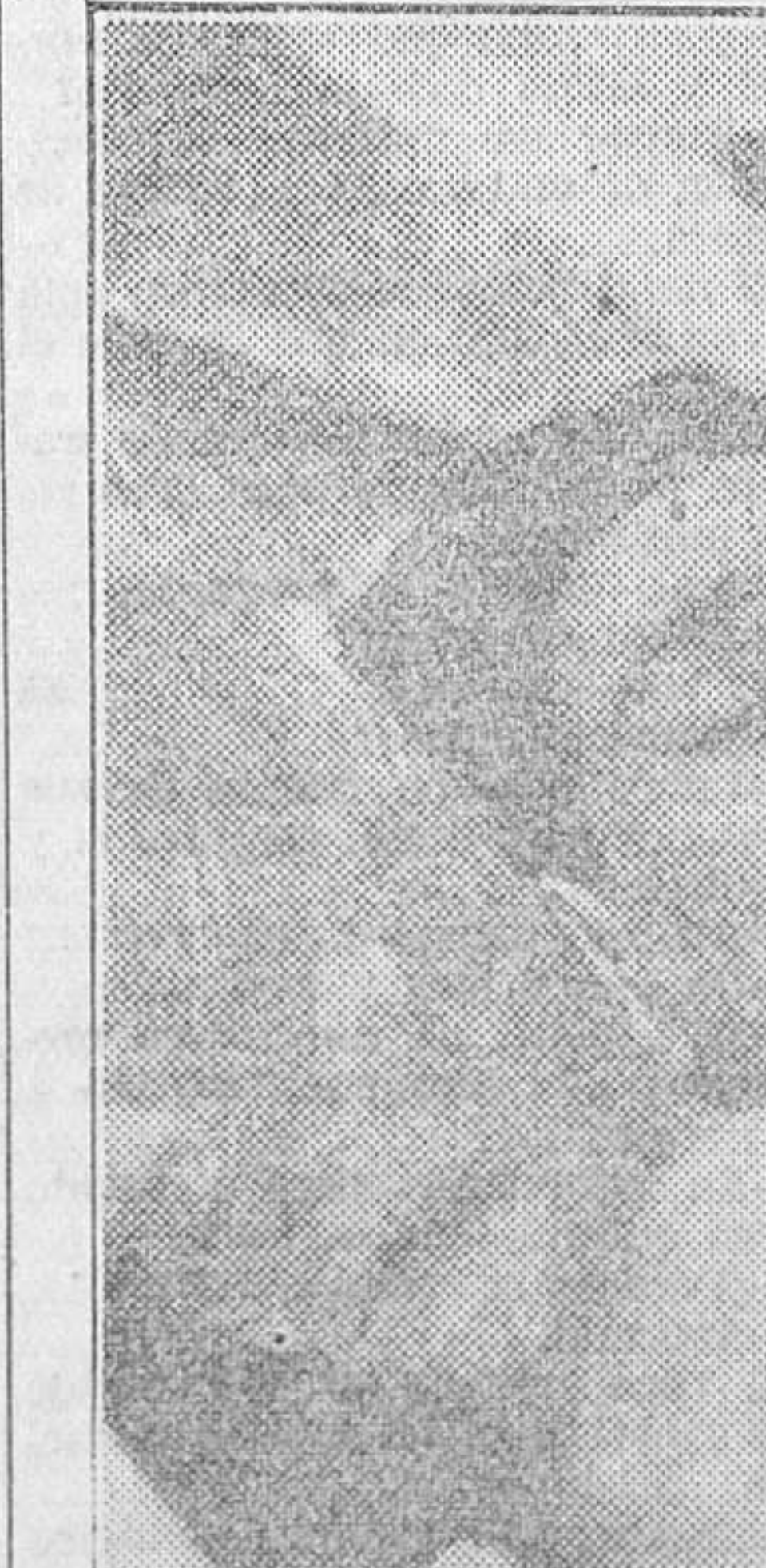
Emilio Pesquero, muerto de un tiro en el corazón por el hermano de su novia

Tan pronto salió aquél a la puerta del establecimiento, y luego de cambiar con el soldado dos o tres palabras, sonaron dos disparos de arma de fuego y se vió caer al ofi-