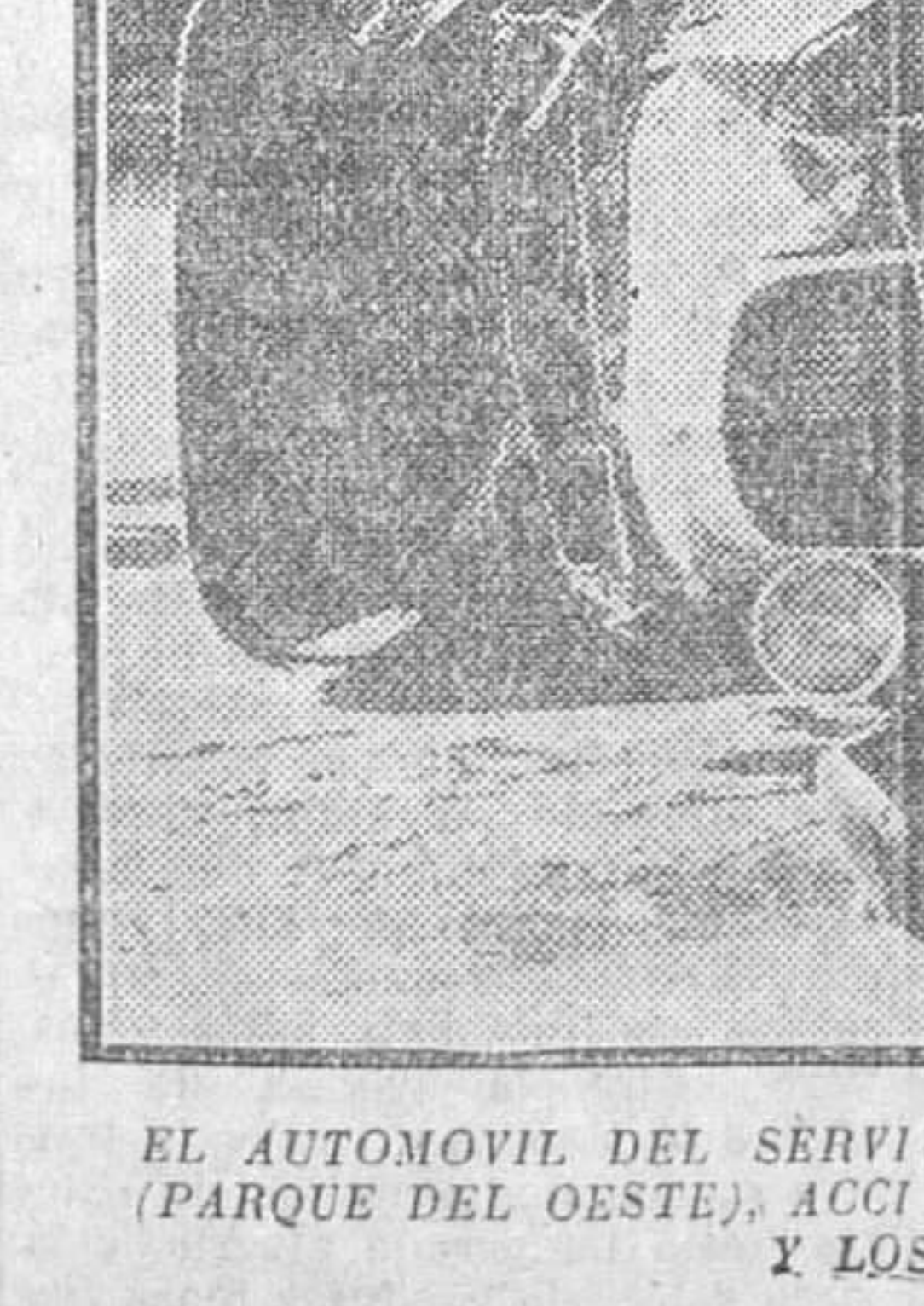
EL AUTOMOVIL DEL SERVICIO PUBLICO QUE VOLCO AYER EN LA PLAZA DE CAMOENS (PARQUE DEL OESTE), ACCIDENTE EN EL QUE RESULTARON HERIDOS EL CONDUCTOR Y LOS DOS VIAJEROS QUE LO OCUPABAN

DOS ACCIDENTES MARITIMOS Un pesquero a pique y otro incendiado Gijón, 18.—Ayer, al regresar de la faena el pesquero de la matrícula de Luanco 'Santa Clementina', de la propiedad del señor Nebral, al entrar en el puerto chocó contra un bajo por estar muy