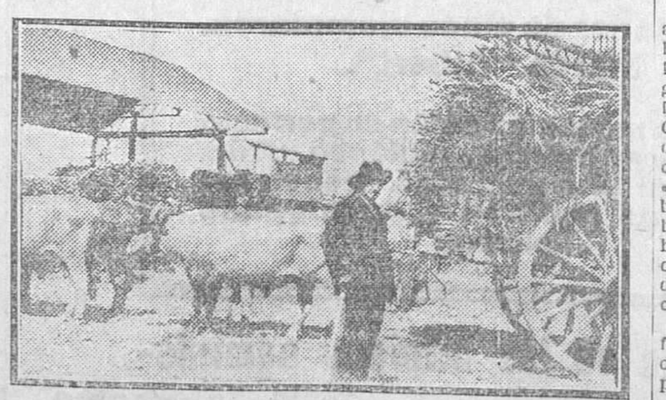
TRANSPORTED E LA CAÑA