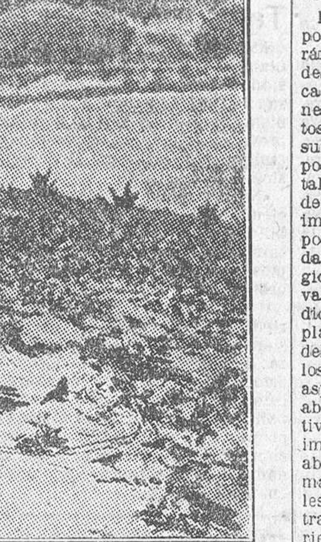
PLANTACION DE UNA VARIEDAD DE FRESONES—FRAGARIA CHILONENSIS—EN SECANO. EN LAS ORILLAS DEL RIO AMBATO (ECUADOR)

que procedan a su inmediata constitución. De la Asamblea de fruteros. Con motivo de la Asamblea de productores de frutas, celebrada con gran entusiasmo en Calatayud, el ilustre ingeniero agrónomo Sr. Lapazarán ha hecho en la Prensa local interesantes apreciaciones.