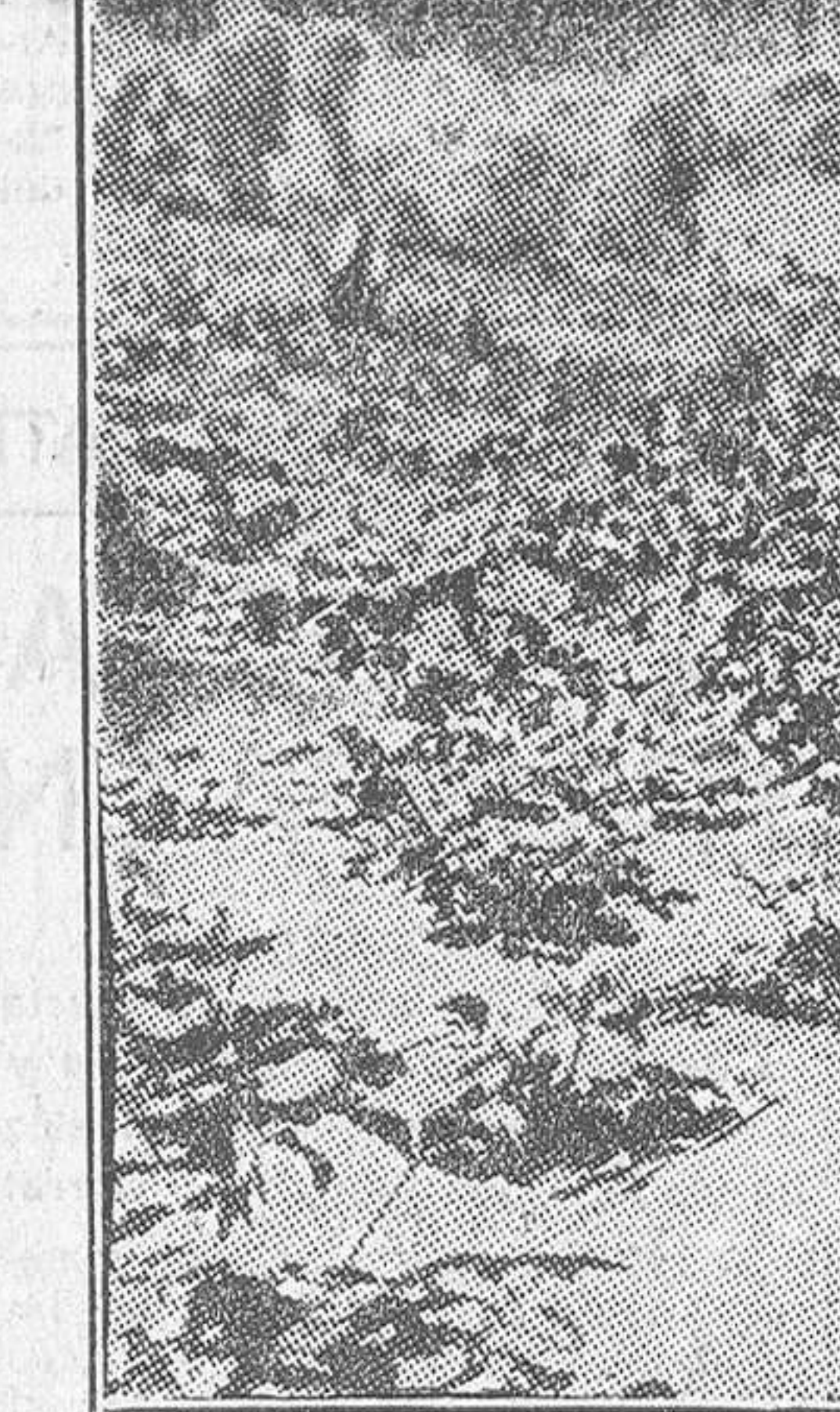
PLANTACION DE UNA VARIEDAD DE FRESONES—FRAGARIA CHILONENSIS—EN SECANO. EN LAS ORILLAS DEL RIO AMBATO (ECUADOR)

posible de todo punto de trillar. Las yuntas, en lugar de trotar la parva, fueron al barbecho o a los rastros, que—no hay mal que por bien no venga—están ahora como nunca para dar la labor de alzar.