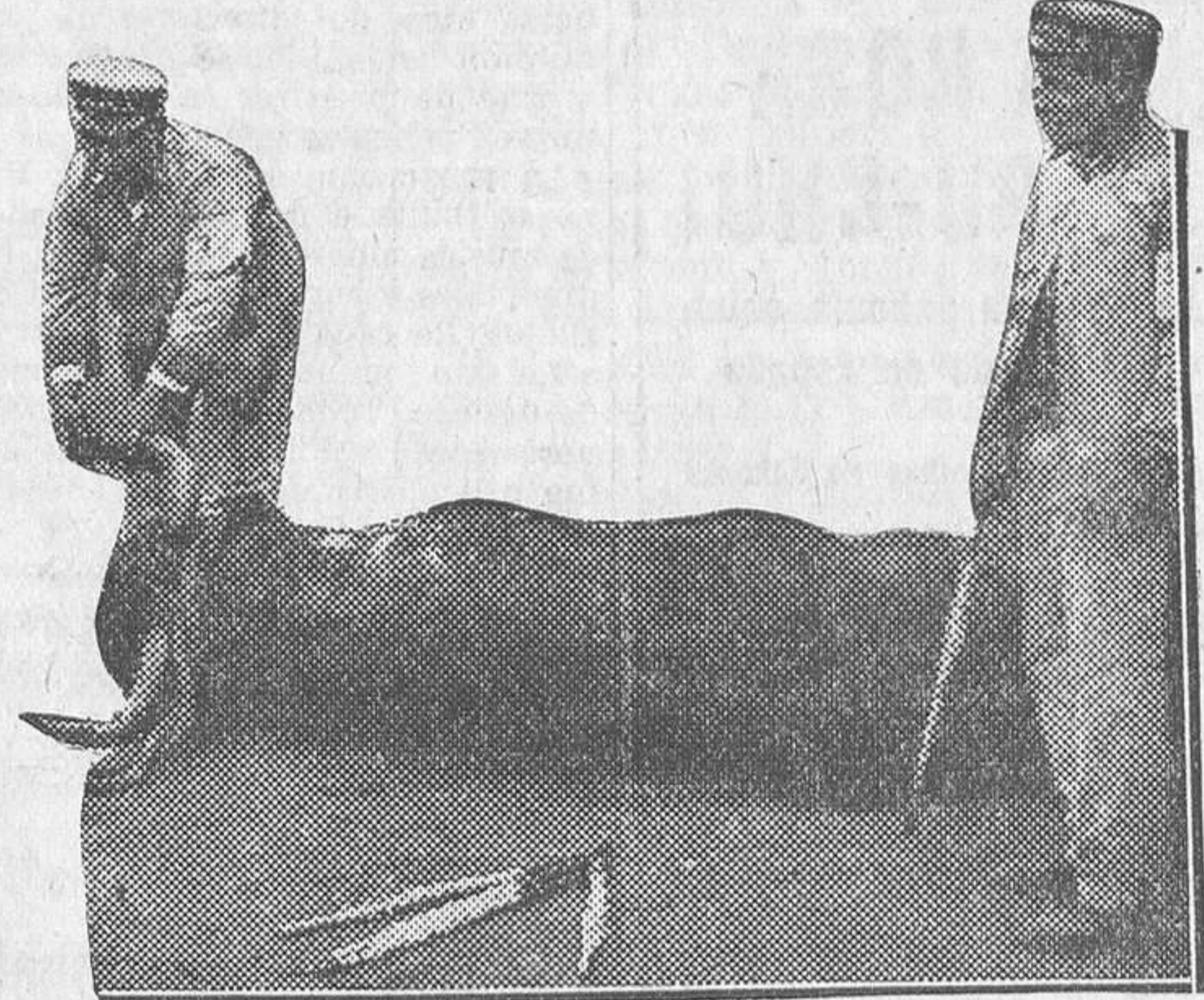
Los encargados de entutar a un manso en las corridas de la pasada feria sevillana

El importe de lo estafado asciende a varios miles de duros.