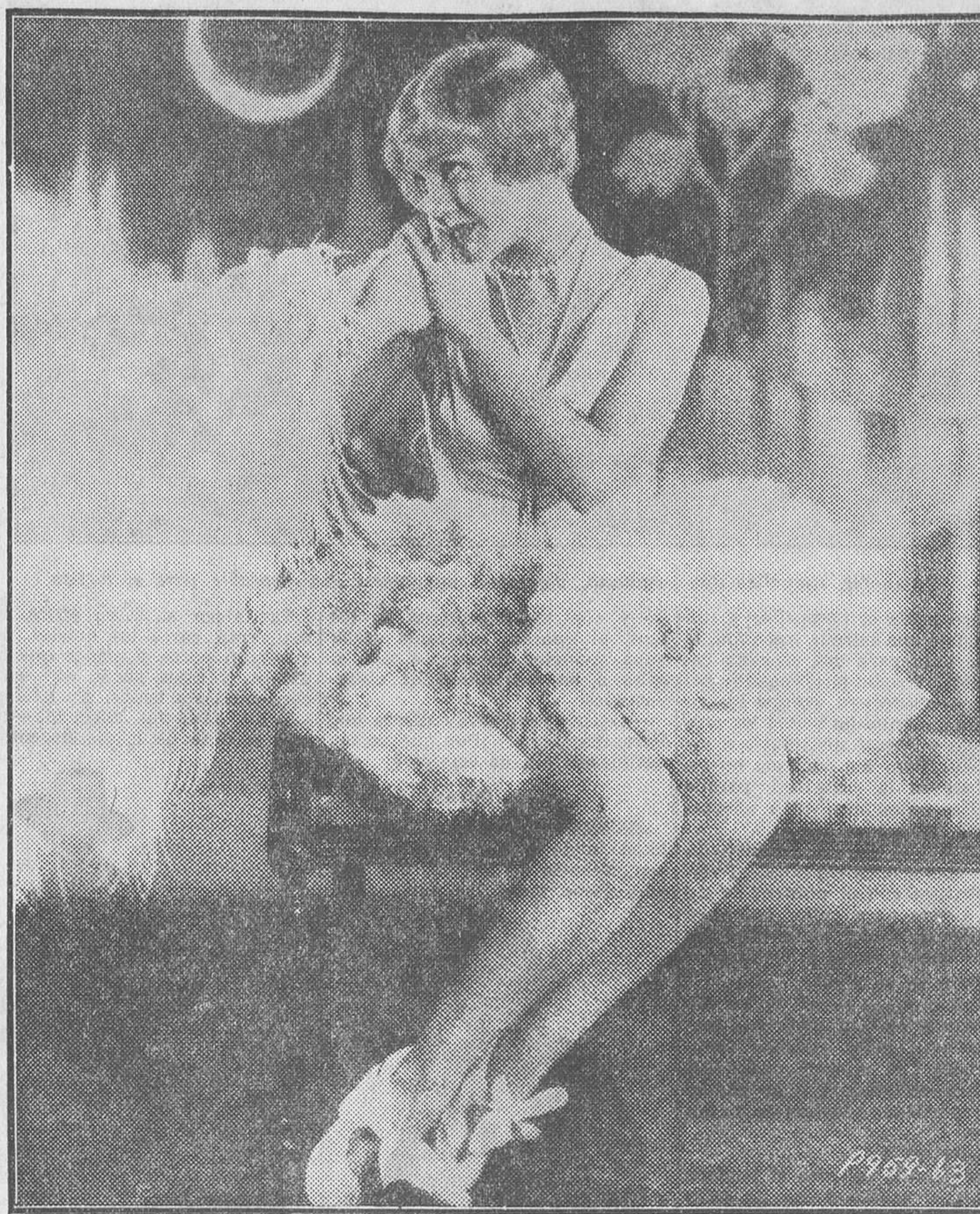
LA ESCULTURAL NANCY CARROLL, PROTAGONISTA DE LA PELIOLA «UNA CANA AL AIRE», QUE EL LUNES SE ESTRENA EN EL CALLAO

Una excepción, y sin duda la más significativa, la constituyen los programas del Callao. Ciertamente, este suntuoso salón, que en anteriores temporadas realizó una brillantísima campaña, que culmi-