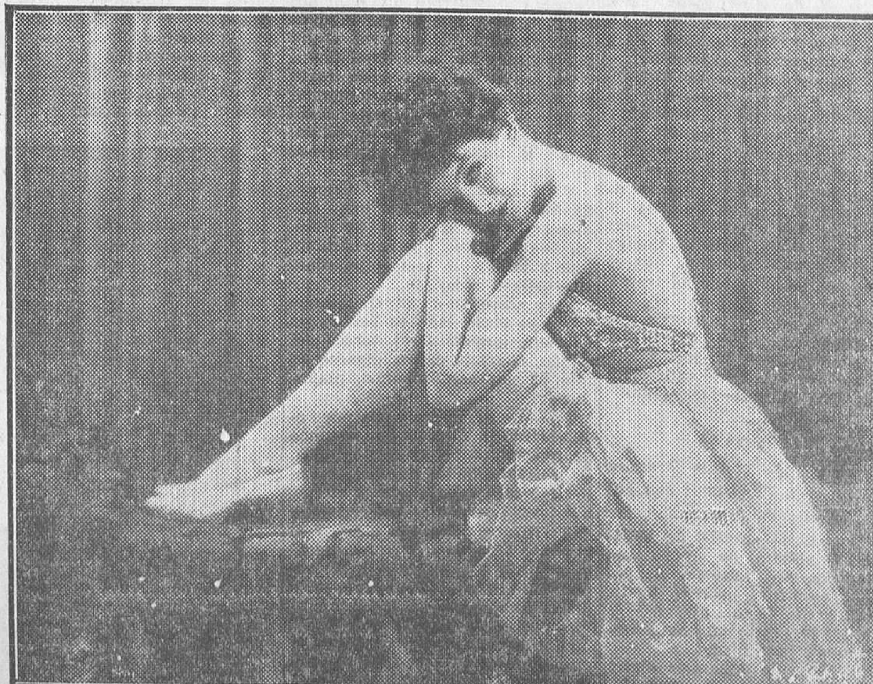
MYRNA LOY, LA BELLA Y SUGESTIVA AOTRIZ DE LA WARNNER BROS, POSANDO PARA LA PROPAGANDA DE SU ULTIMA PELICULA