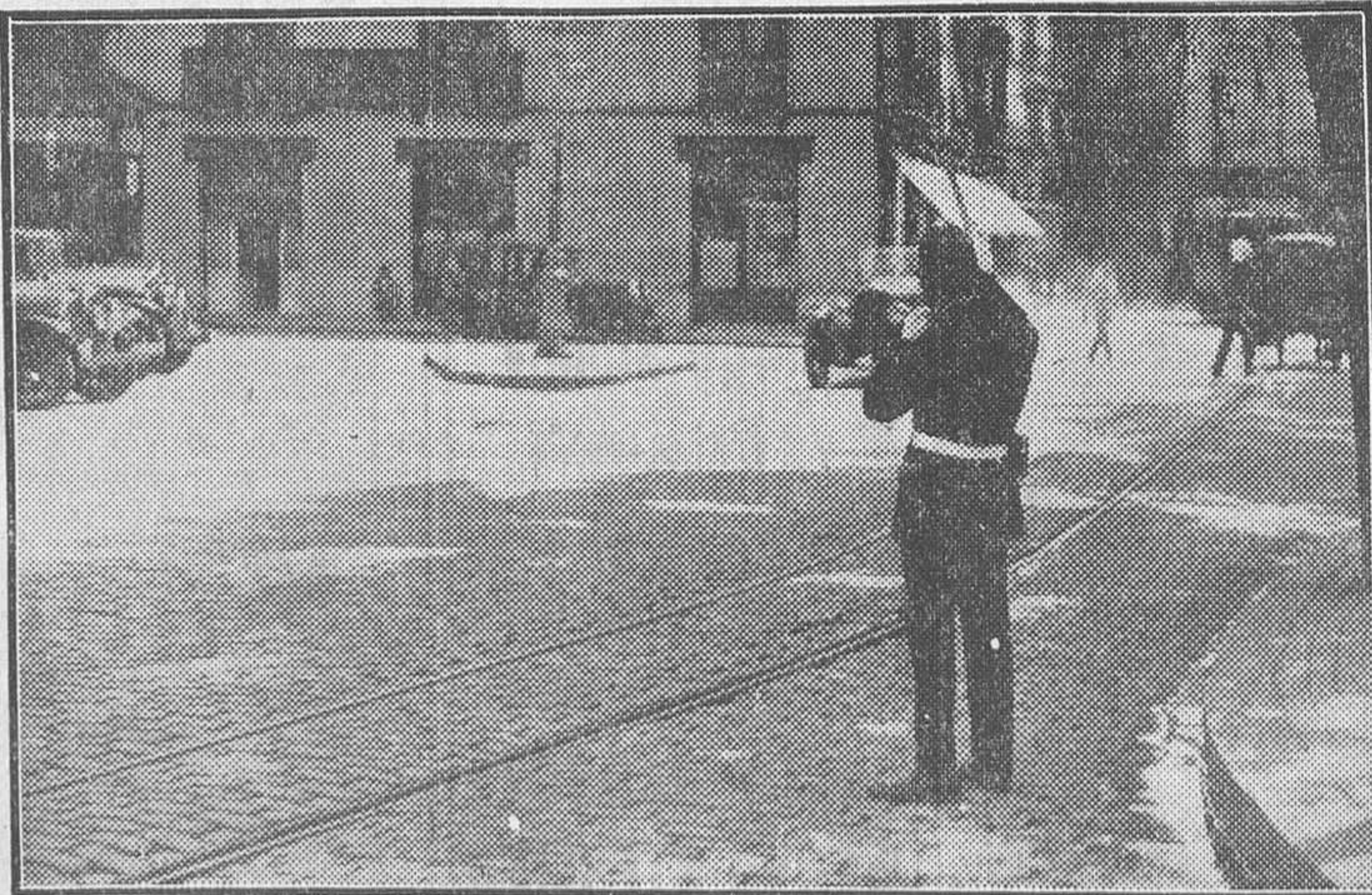
Los guardias urbanos de Sevilla en sus nuevas funciones de organizar la circulación

El guardia, mi buen amigo el guardia, ante aquella tormenta que se le venía, hizo unos gestos magníficos. Y en el acto, dándose cuenta que tenía que esgrimir toda su autoridad para restablecer la marcha normal en la calle, levantó el