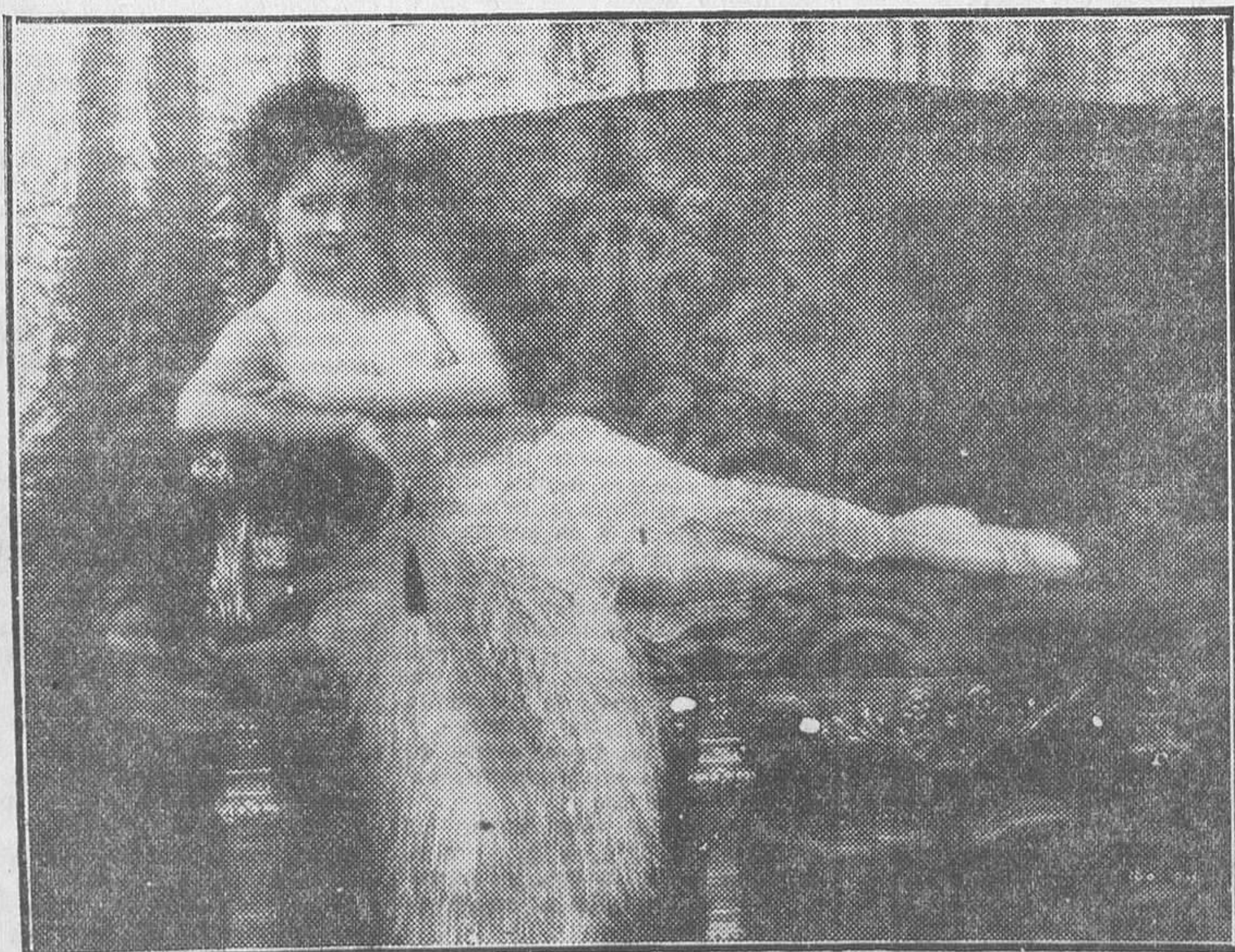
LA ENCANTADORA ESTRELLA DE LA FIRST NATIONAL, BILLIE DOVE, EN SU ULTIMO FILM, AUN SIN TITULO EN CASTELLANO