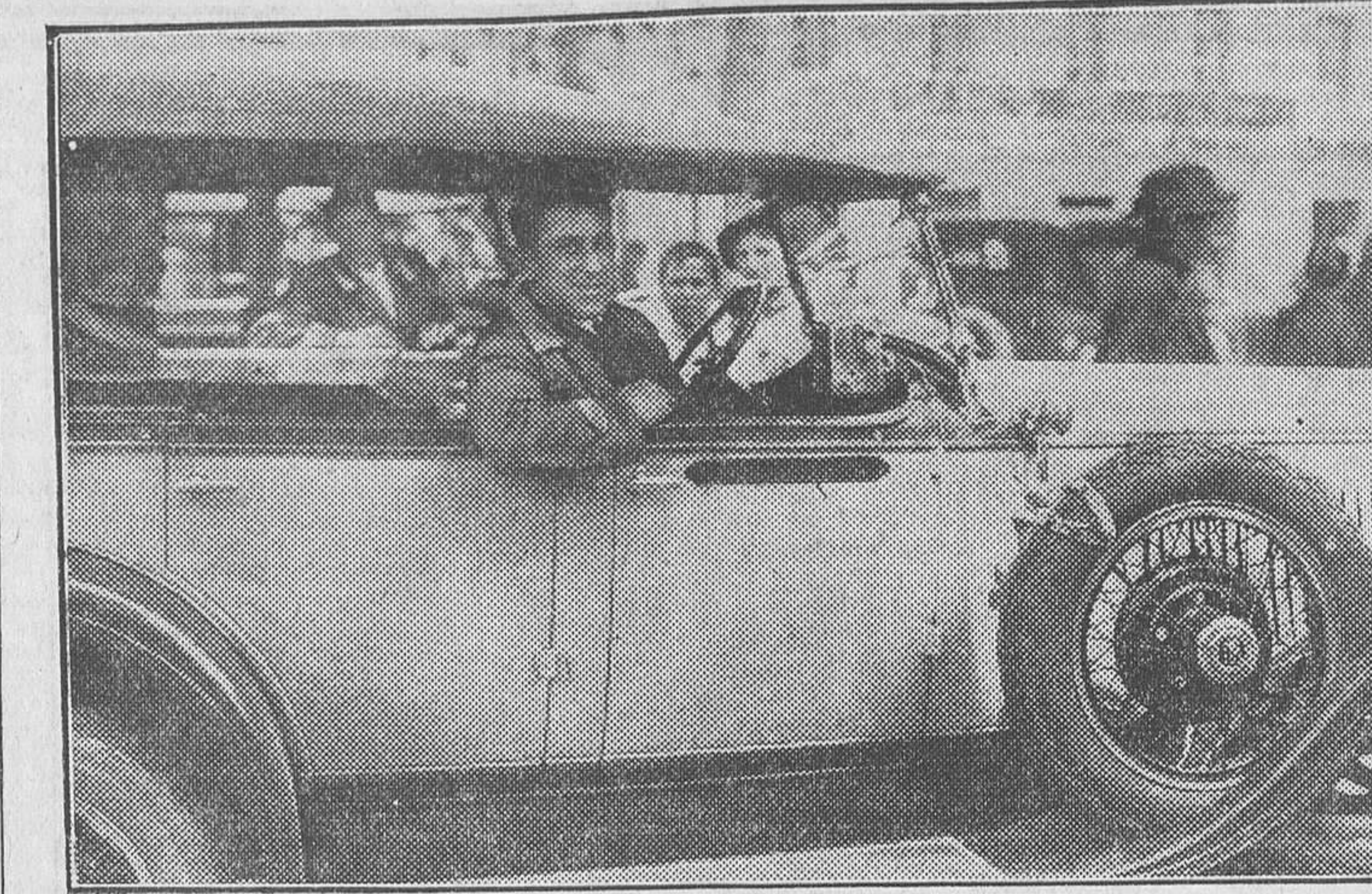
Un chofer, simpático tipo sevillano, magnífico «cicerone», indispensable para el turista

Pero ayer le ocurrió algo insólito al guardia de la calle de Velázquez. Estaba de servicio unos minutos antes de las tres y media de la tarde. Lucía sus impecables guantes; tenía entre sus labios el silbato; esgrimía en la mano derecha, y como bandera, el puntero autoritario. Iban y venían los transeúntes, con los ojos puestos en el faro municipal, que indicaba los