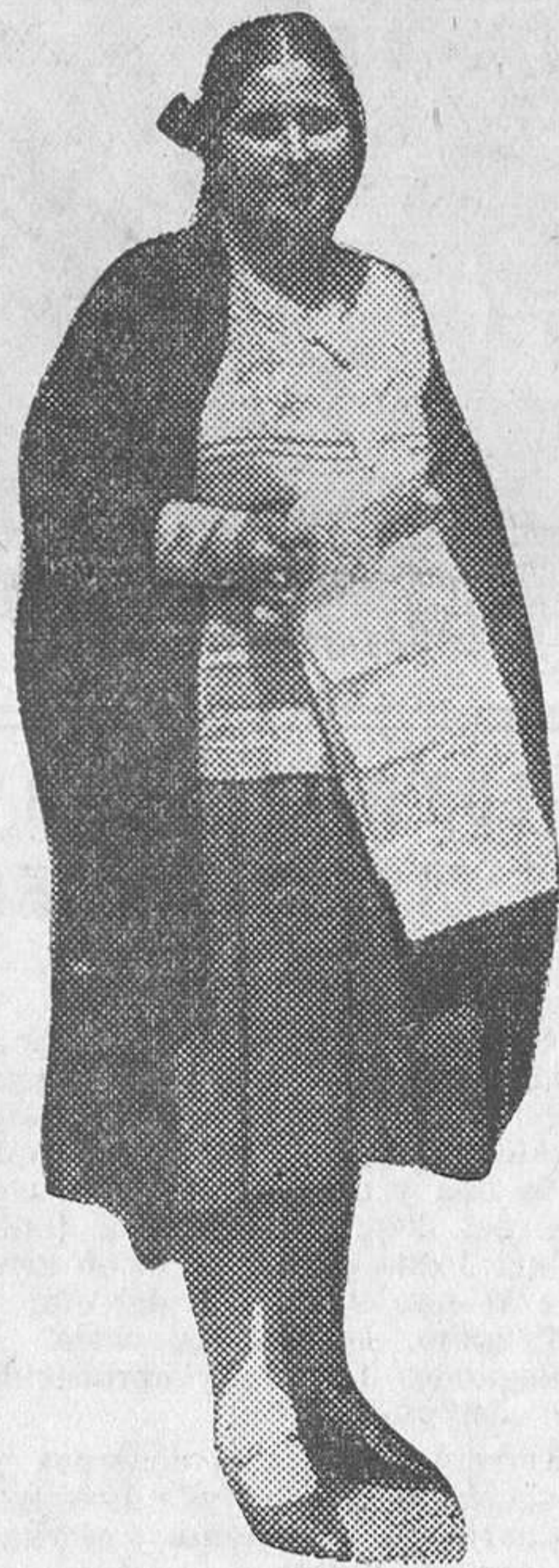
La niña de los décimos, muy popular en Sevilla

«El Noticiero Sevillano» llama al buen juicio a los industriales y comerciantes de Sevilla, que este año, como todos los años, pare-