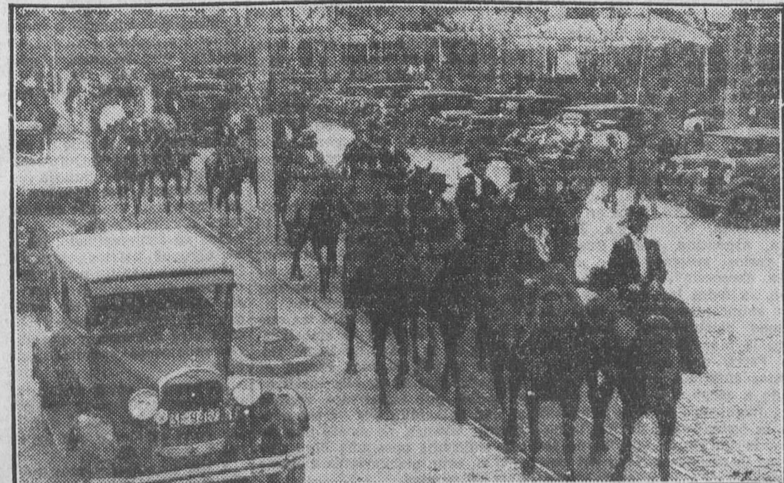
Desfile de caballistas en la feria, ante los automóviles detenidos a lo largo del paseo