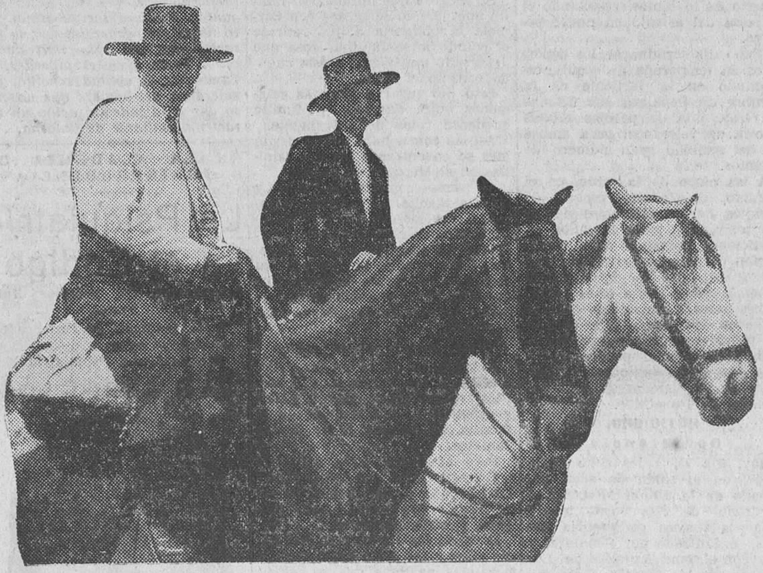
El que fué célebre torero Ricardo Torres (Bombita), paseando por la feria, acompañando a una sobrina suya