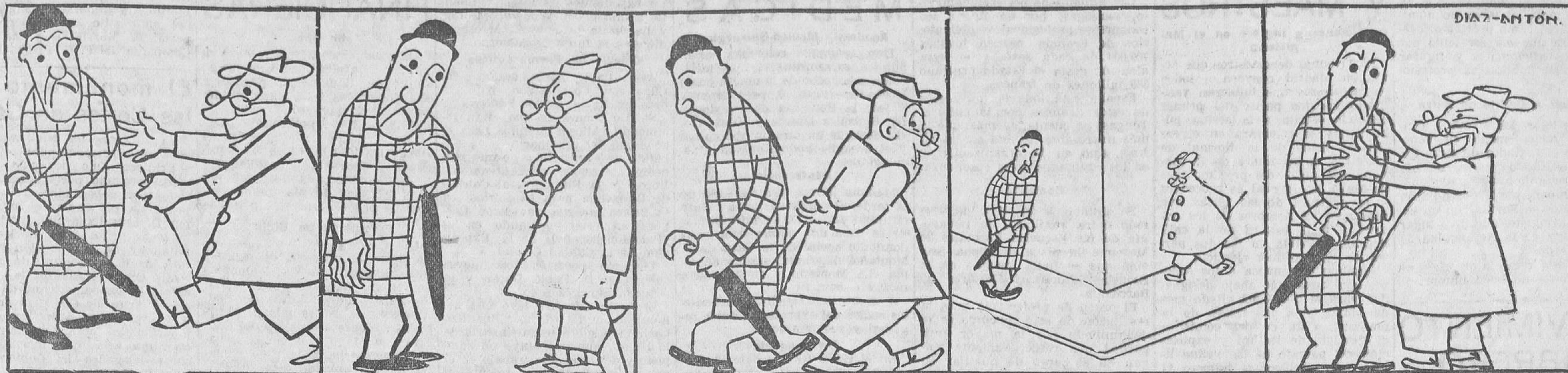
—¡Querido doctor Eficaz!... Tanto tiempo sin verle! —Advierto a usted que no soy el doctor Eficaz... —Usted perdone, caballero. —¡Qué plancha! —¡Qué impertinente! —Antes de molestarle a uno debieran fijarse... ¿Qué tengo yo que ver con el doctor Eficaz? —No se me va del pensamiento el planchazo. —¡Hola, querido doctor Eficaz! ¡Caramba, si viera usted el chasco que acaba de darme un señor que se le parece mucho!...