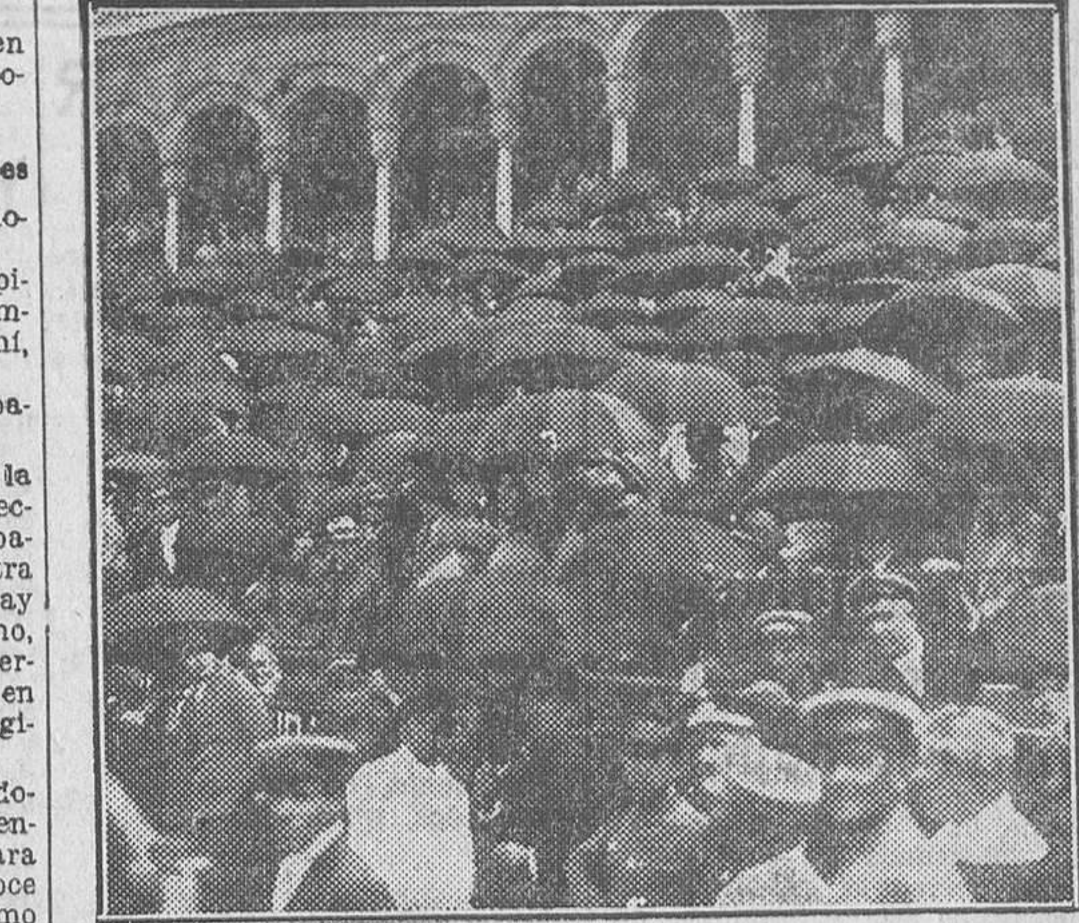
El número de los paraguas en la plaza de toros de Sevilla