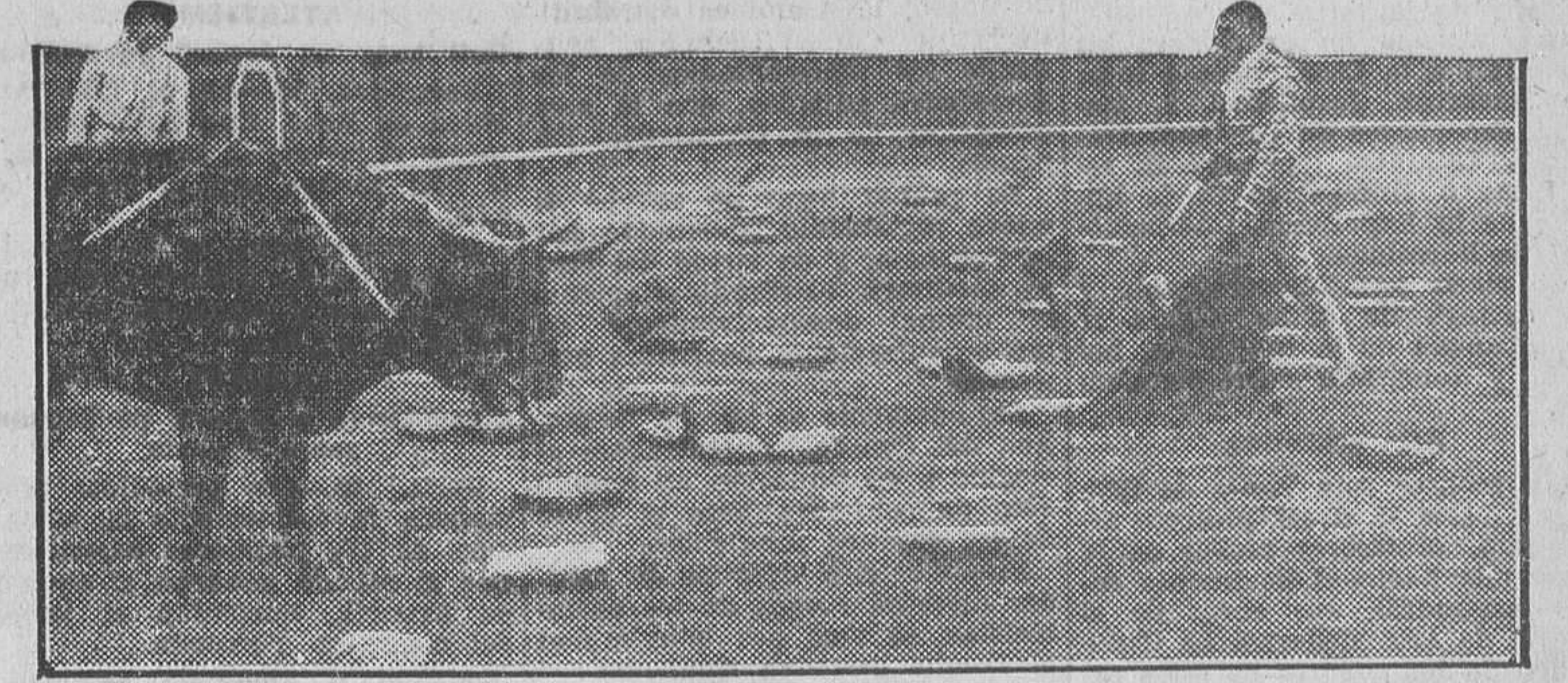
La importancia de llamarse Cagancho. La «faena» del «genial» torero en la plaza sevillana

«Siente usted mucho lo ocurrido? —Lo que es naturá. No crea usted que a mí me asusta ná, porque