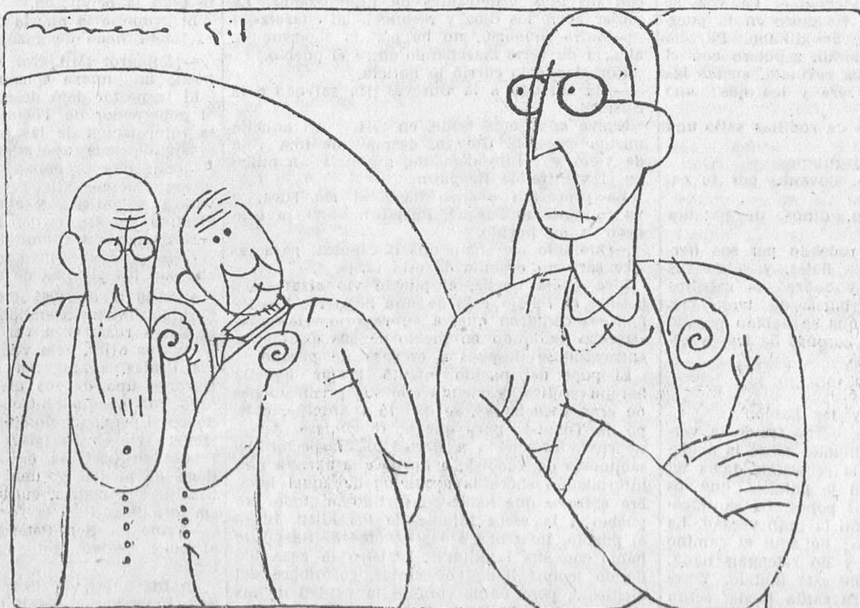
--Dicen que es un sabio. --Pero si no tiene barba...

Sigan los enemigos de la difusión de la cultura sus campañas contra la Prensa. Ellas serán inútiles e infecundas. Se han empeñado en detener, a fuerza de puños, la rotación de la Tierra sobre su eje, la marcha de las constelaciones en el espacio sideral, la evolución providencial de las ideas y de las cosas. Es una tarea que puede parecer excelente en el ca-