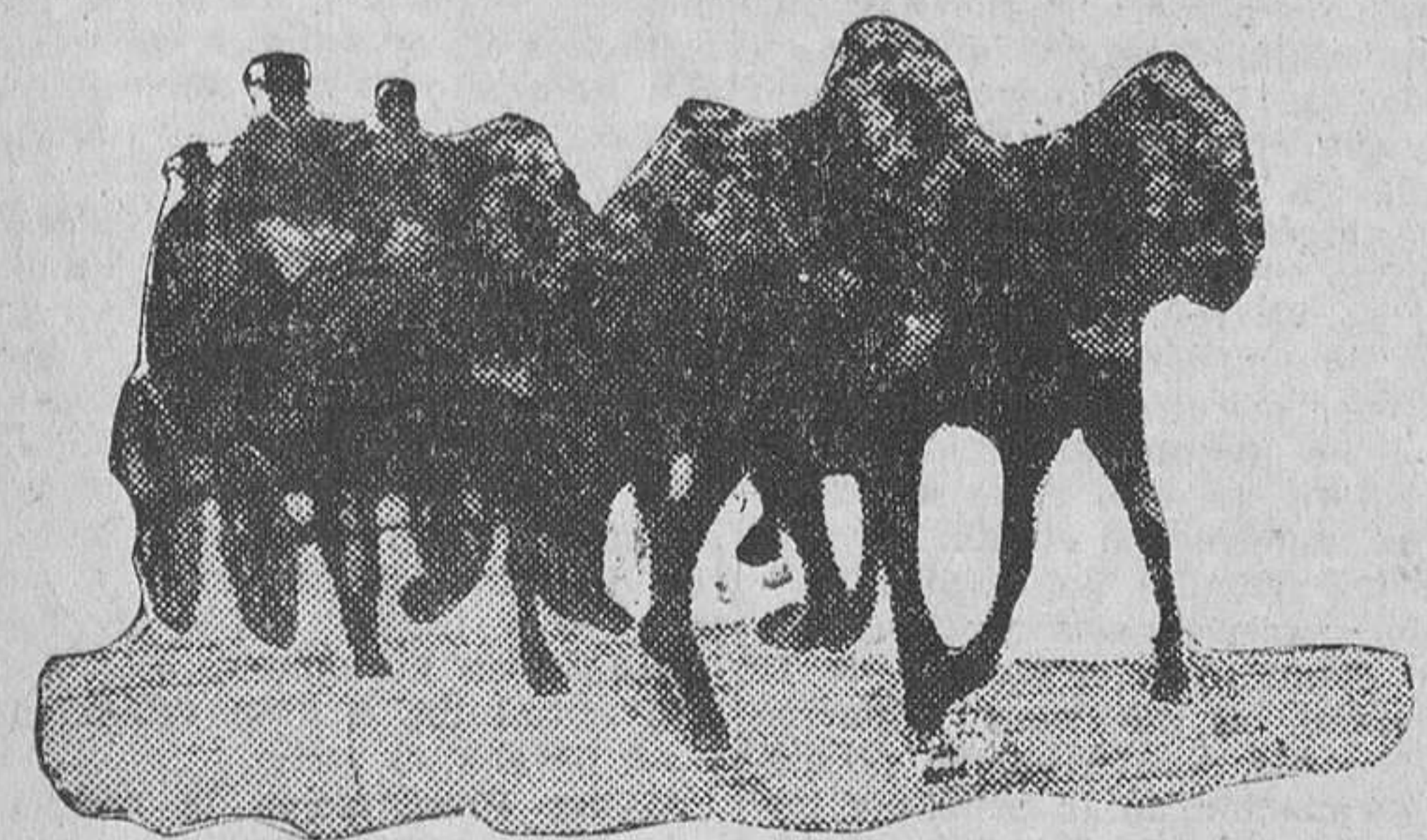
El único coche de caballos que ha circulado este año por la feria sevillana, ocupado por los últimos rondalleros

«Le Journal», que acaba de presentarse en la Maestranza nada menos que la muerte alevosa de Juan Belmonte; que acaba de hablar mano a mano con la heroína «Carmen» en un patio de la Fábrica de Tabacos, y que acaba de beberse unas copas de vino rubio con el propio «Don José», el del bello uniforme azul oscuro y el bicorneo con galones blancos.