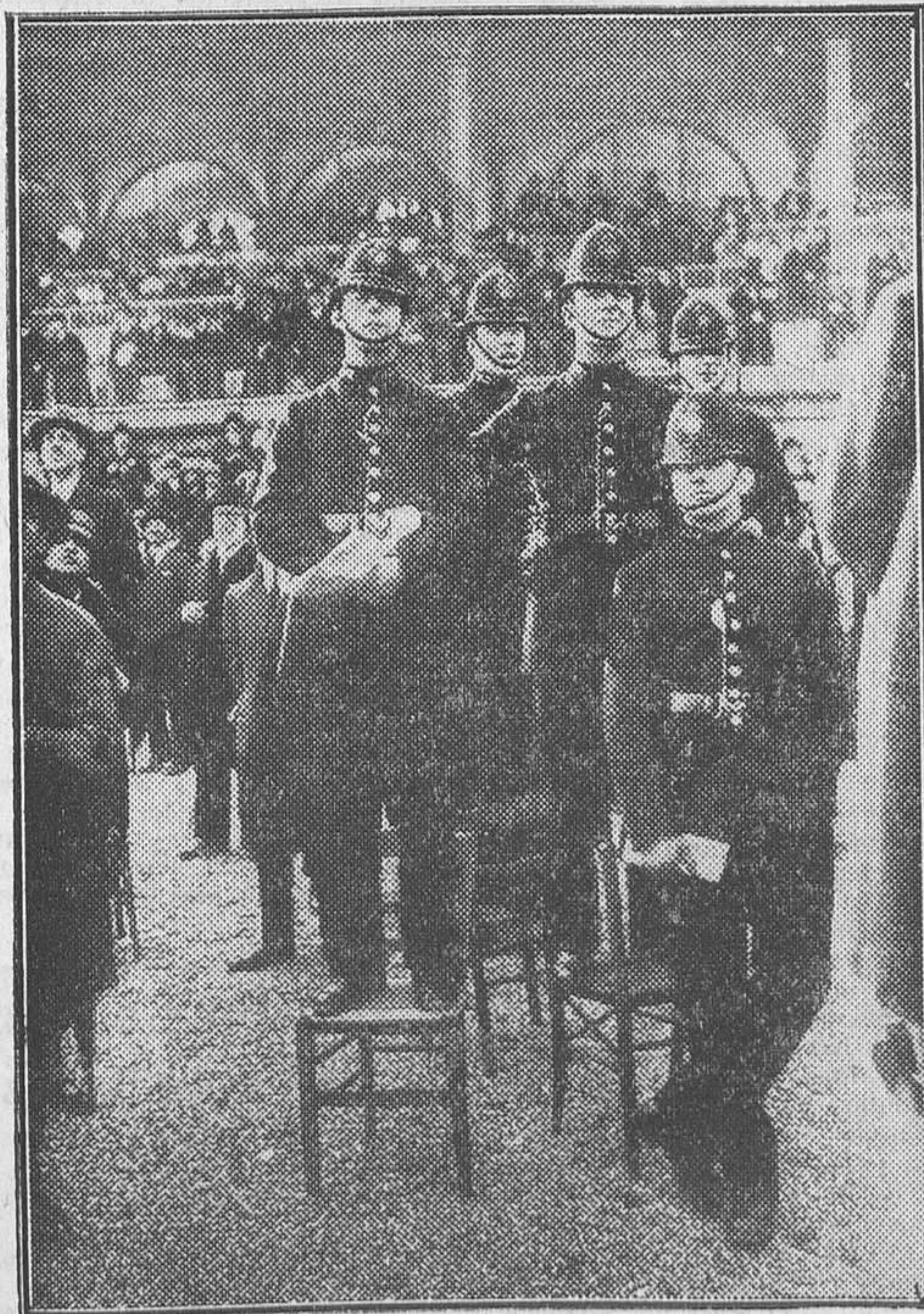
PARIS.—Policías inglesas presenciando las carreras en el Hipódromo de Longchamp

Nantes, 23.—Ayer ha sido botado al agua un submarino, construido en los astilleros de este puerto por cuenta del Gobierno polaco.