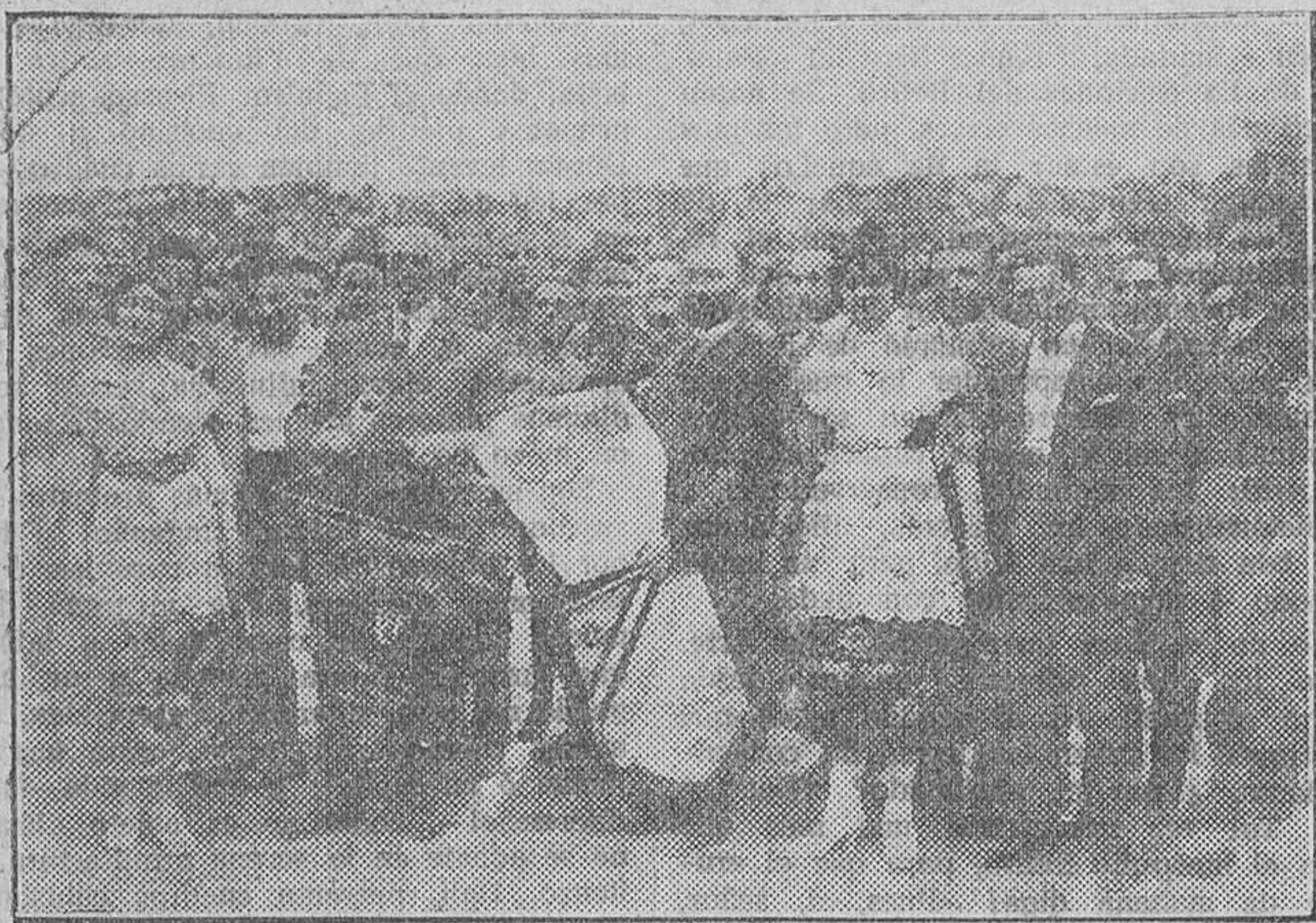
Los delegados nacionales de España é Italia, recibiendo el homenaje del Valencia F. C.

Reunidos en el centro del campo de juego los dos equipos y los delegados de las federaciones nacionales respectivas, hubo intercambio de hermosos estandartes, cambiando asimismo, los dos capitanes, preciosos ramilletes de flores. También el