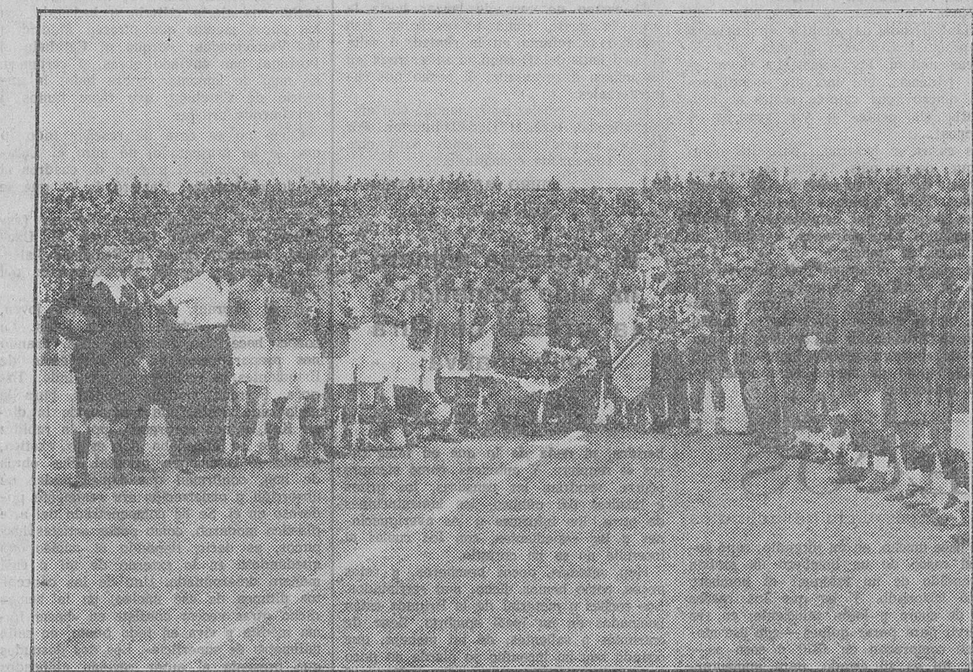
Los equipos y sus directivos antes del match

legítimo es su título de internacional. Pero también Cubells en esta primera y en toda la segunda parte, dejó de aprovechar algunos momentos, en que el goal no ofrecía caracteres imposibles. Sin embargo, en justificación de Cubells, hay que decir que á él debió Errazquin el primero y único tanto que apareció en el marcador. Y aun al recoger Errazquin el balón servi-