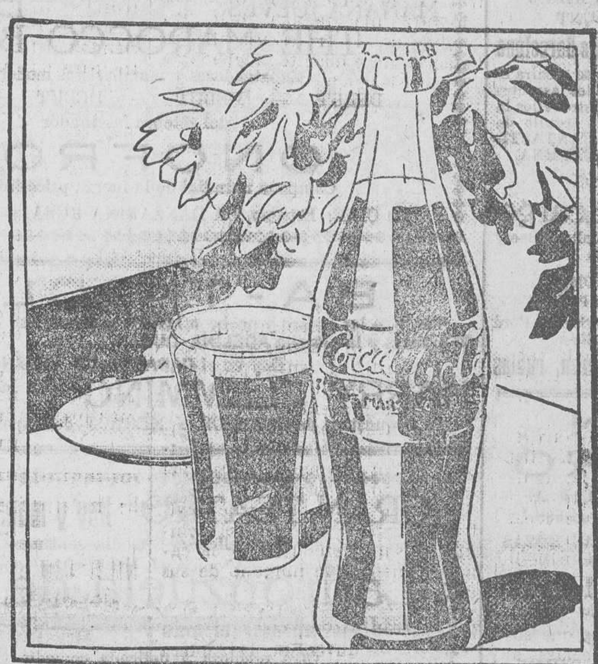
La bebida elegida por todos en los sitios más concurridos

Pídala hoy mismo. Le entusiasmará. De venta en todos los cafés y bares