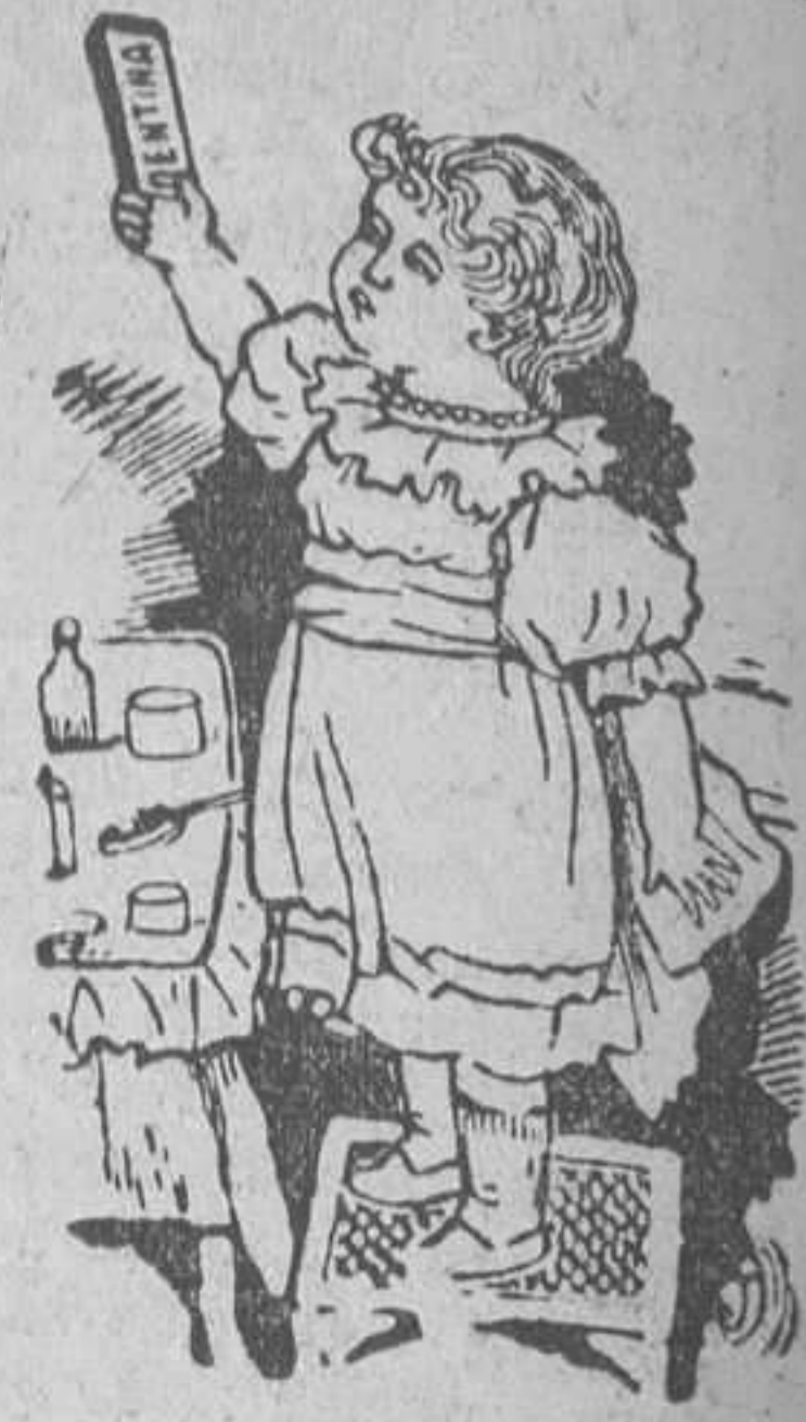
Después de tomar la DENTINA