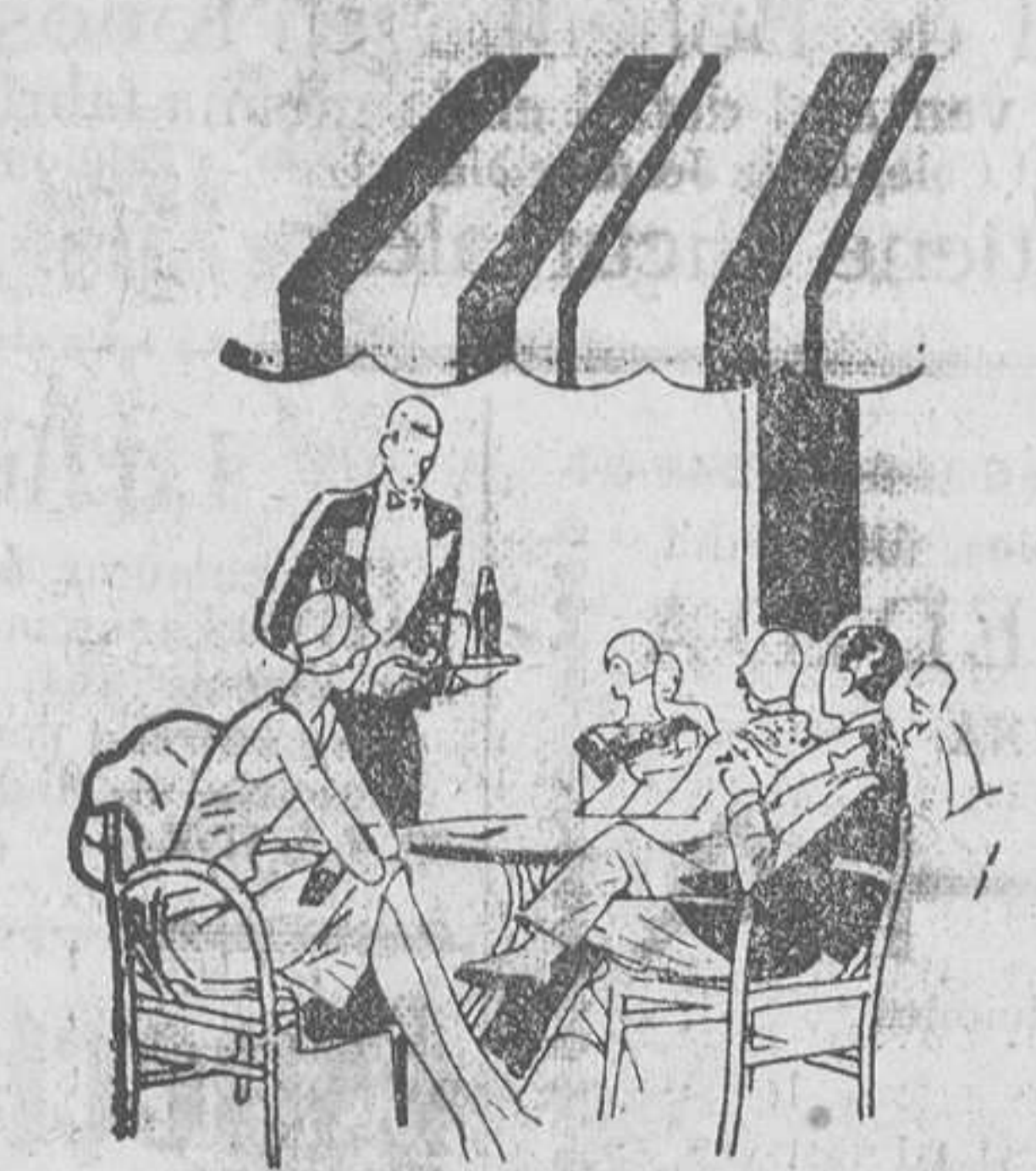
... en las terrazas de los bares elegantes...