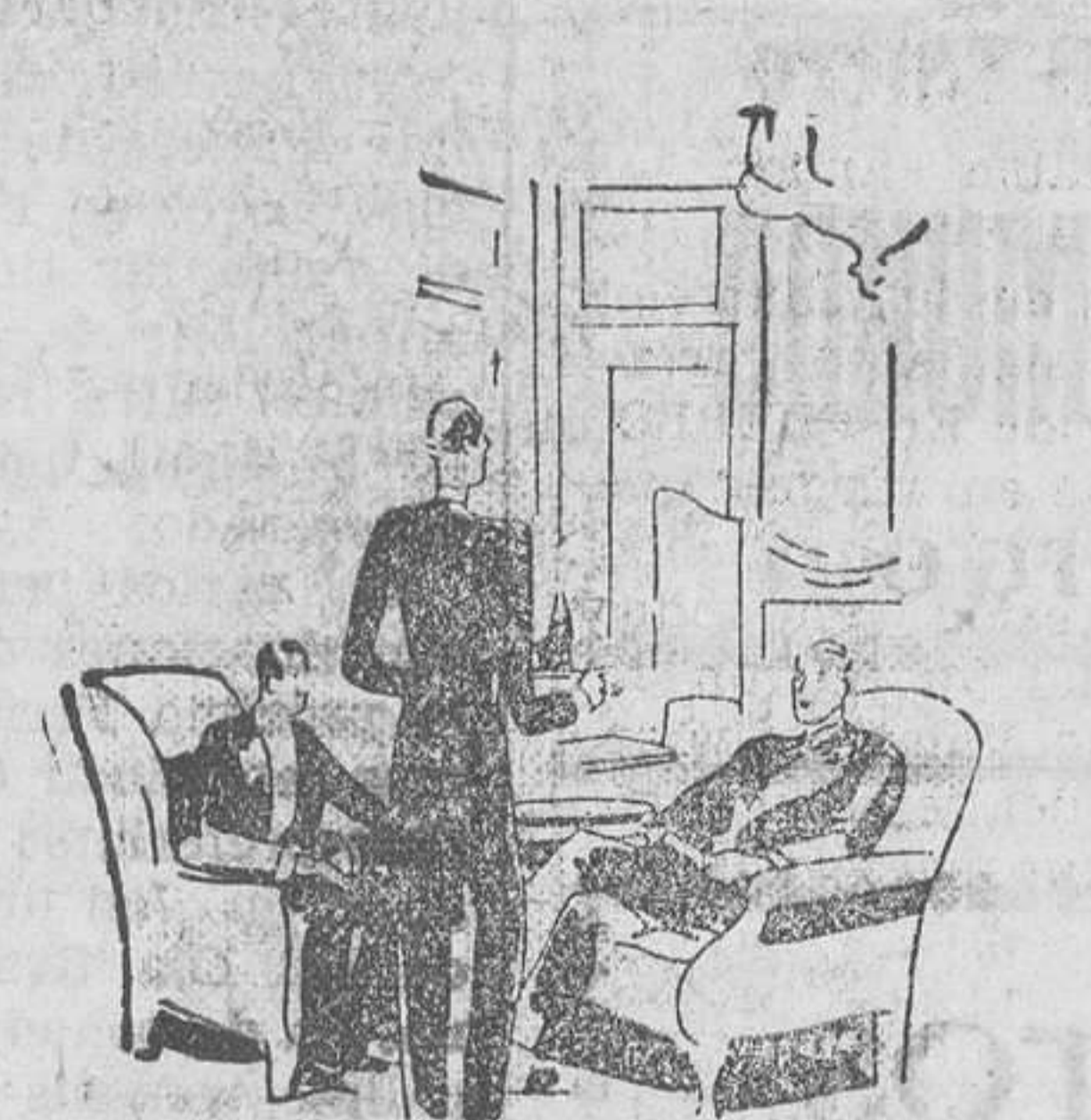
... en el club... ¡Coca-Cola es preferida siempre!

SU exquisito gusto seduce desde el primer momento. En todas partes, casinos, clubs, cafés y campos de deportes, oirá usted esto de labios de cuantas personas toman Coca-Cola, la bebida universalmente conocida.