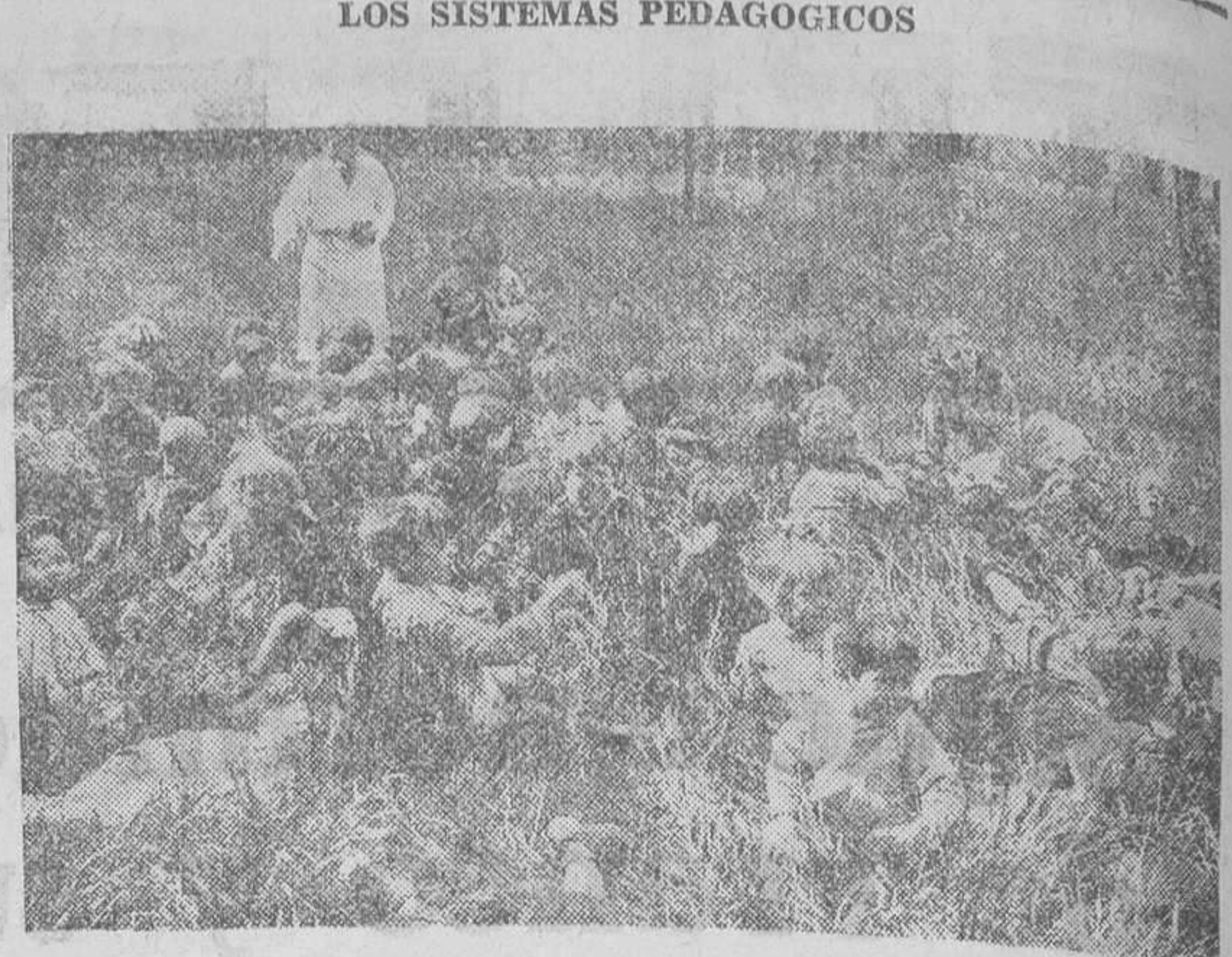
En Dugny (Francia), se ha inaugurado una escuela en la que todas las enseñanzas se dan al aire libre

C. D. Rayo, 2; C. D. Artesano, 0. El domingo por la tarde se celebró con gran concurrencia este encuentro, que fué otro nuevo