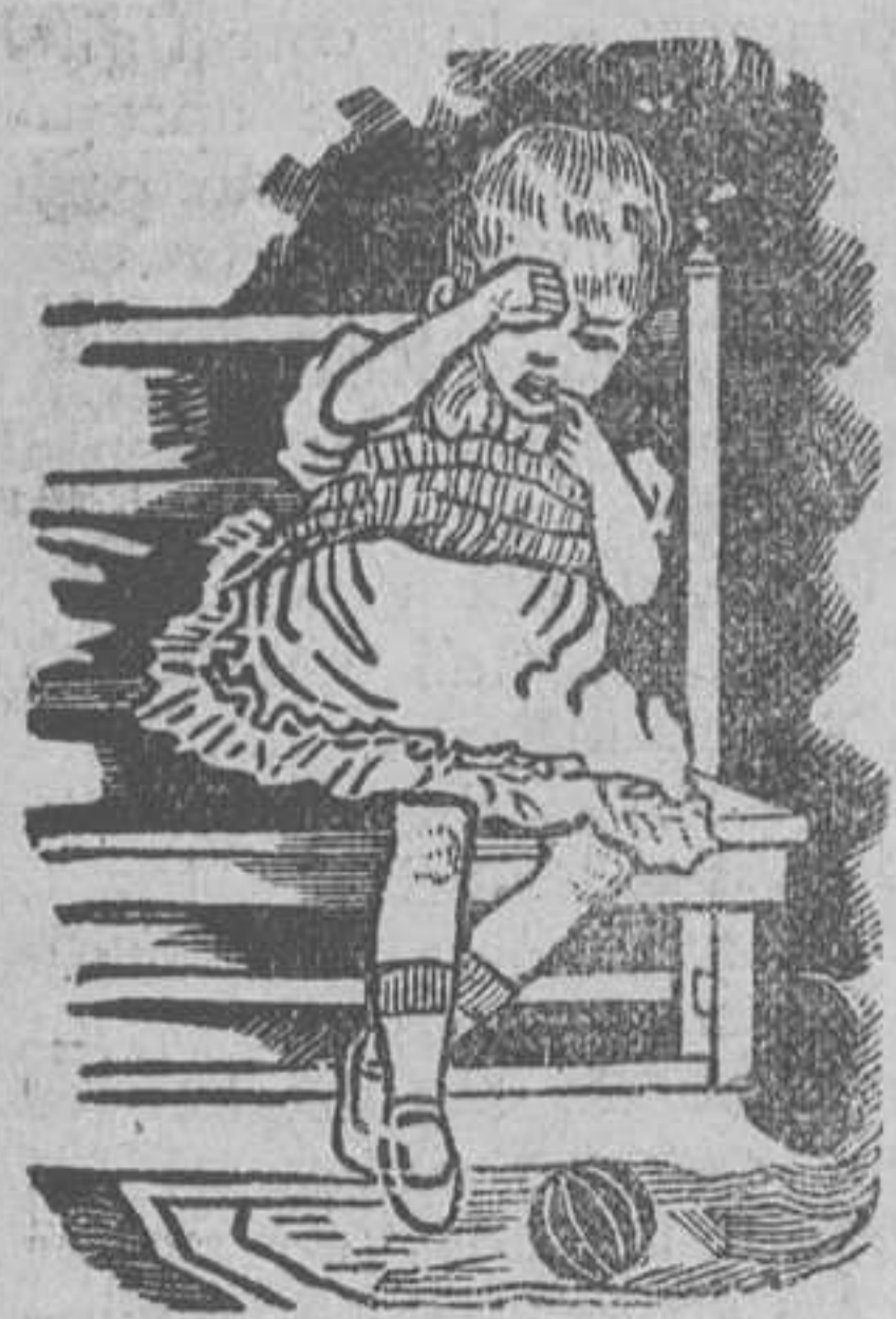
Antes de tomar la DENTINA

Laboratorio y farmacia Cañizares, calle de Caballeros, número 47, Valencia