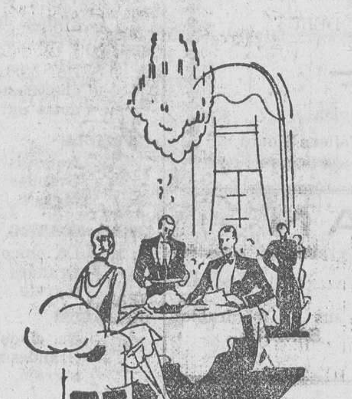
... al descansar de un rato de baile en el casino...