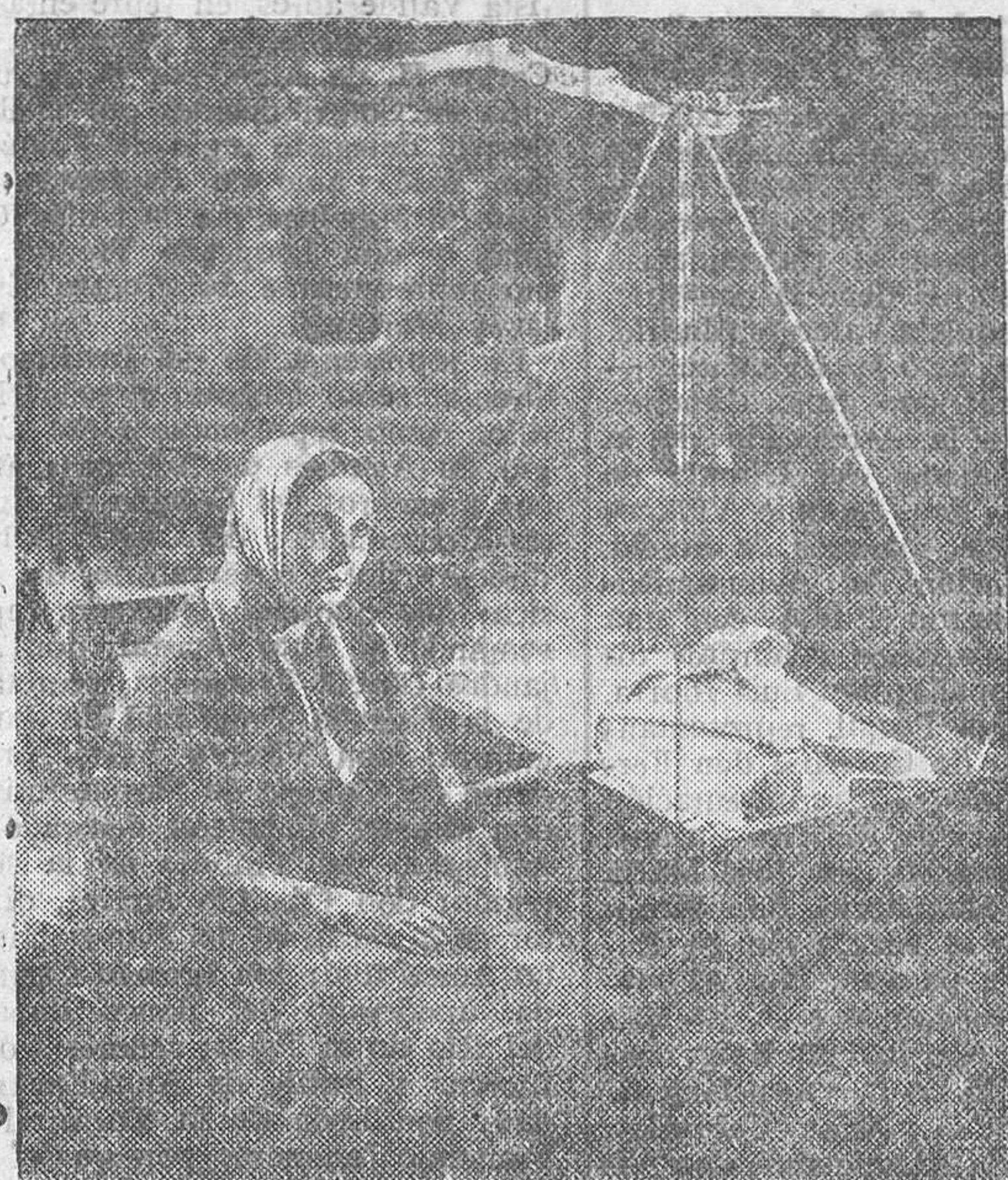
La grandiosa novela del CONDE LEON TOLSTOI, magistralmente interpretada por la inimitable artista DOLORES DEL RIO y ROD LA ROCQUE; una buena película de LOS ARTISTAS ASOCIADOS

de su «troupe» de «girls» y el encuentro con su padre, dan lugar a unos «quid pro quo» muy burlescos y complicados, y la madre se entera de tal manera que noche entera y a nada del malito asunto. Lo que flota y se acrecienta en todo este enojoso asunto es el amor que encadena los corazones y las almas de lord Alberto y de Suzy Saxofón; con la llegada desde Londres de la verdadera Suzy Hille, prometida a un estudiante con quien se casará pronto, acaba de resolverse el enigma, y todos los personajes de esta aventura pueden recobrar su verdadera personalidad.