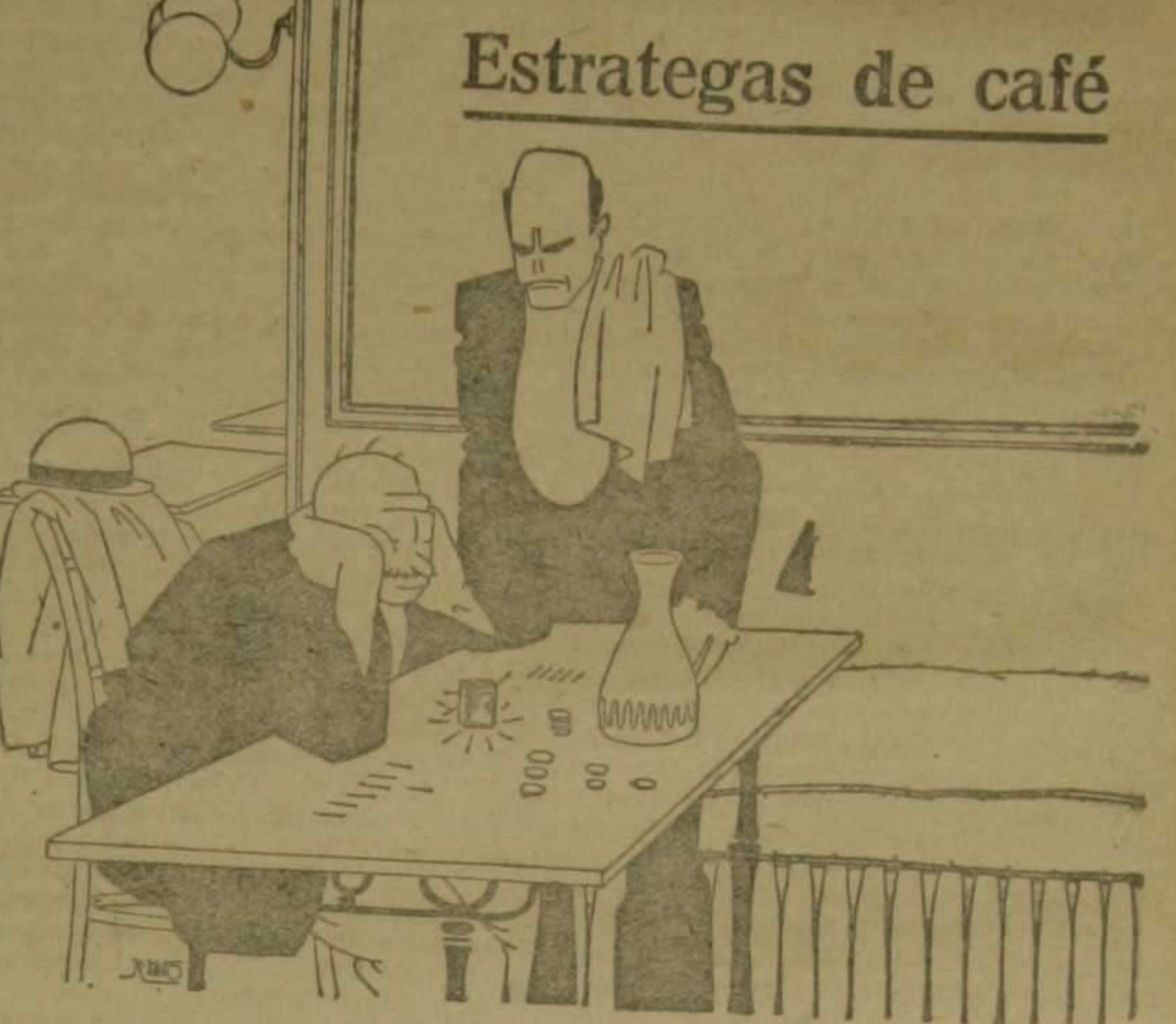
—¿Qué va usted a tomar? —Berlín