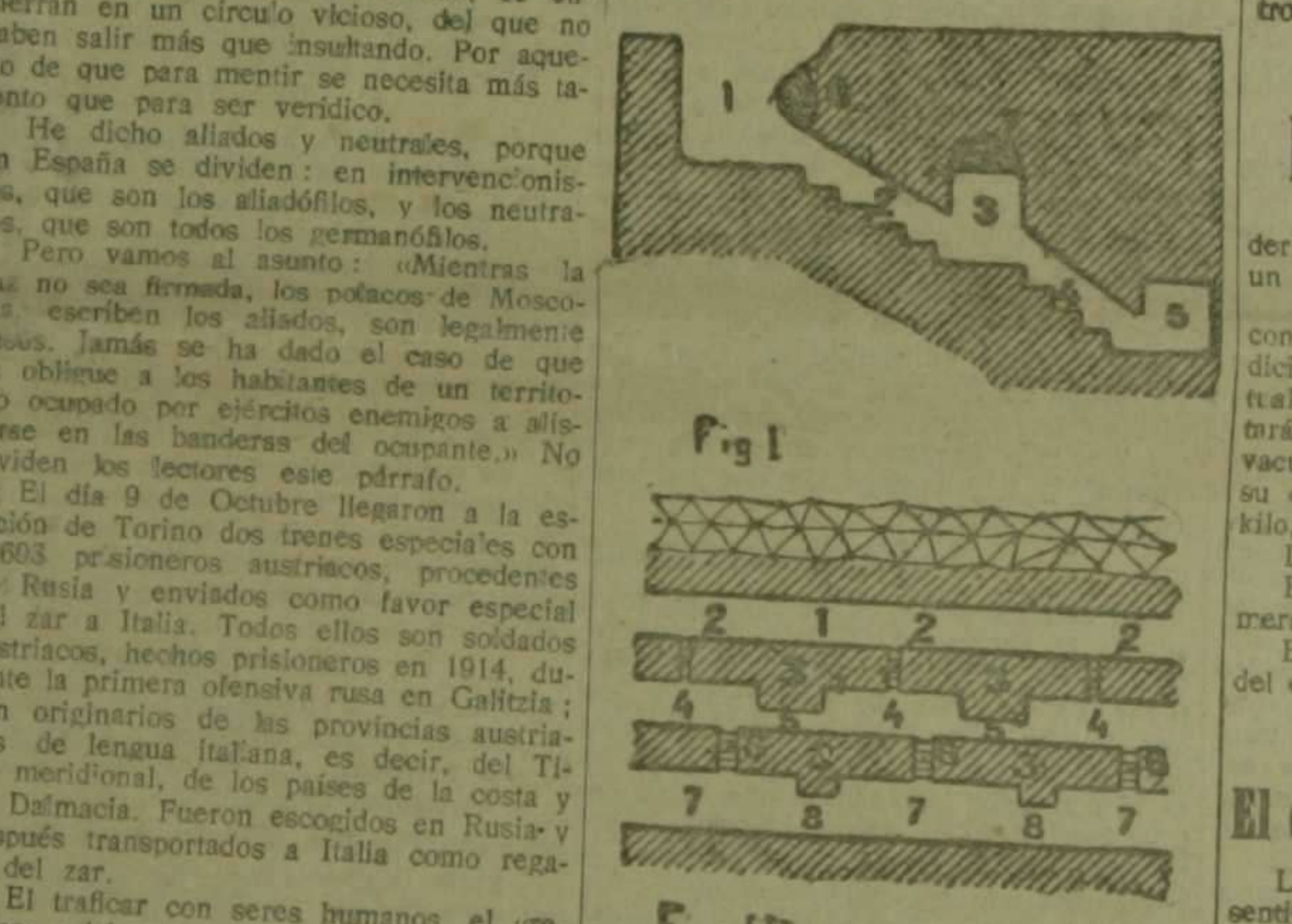
Fig. I. 1. Trincheras.—2. Escalera de acceso.—3. Primer 'stollen'.—4. Segunda escalera.—5. Segundo 'stollen'.—6. Capa de cemento que protege la entrada.—7. Capa de cemento protector del primer 'stollen'.