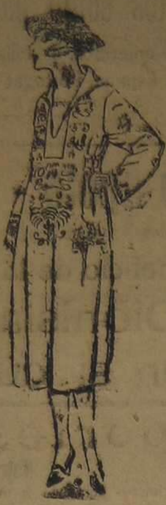
Vestidos de lanilla, estambre, gabardina, etc., en negro, azul y color, adornos bordados. De ptas.