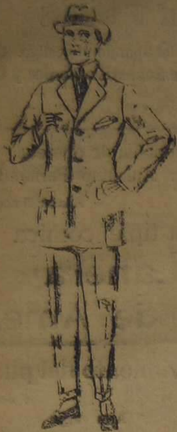
Trajes de cheviot, corte elegante, para sportman. De ptas. 60 a 100.

SUCURSALES: Madrid, Barcelona, Alicante, Almería, Bilbao, Cádiz, Cartagena, Gijón, Granada, Málaga, Palma de Mallorca, Santander, Sevilla, Valladolid y Zaragoza.