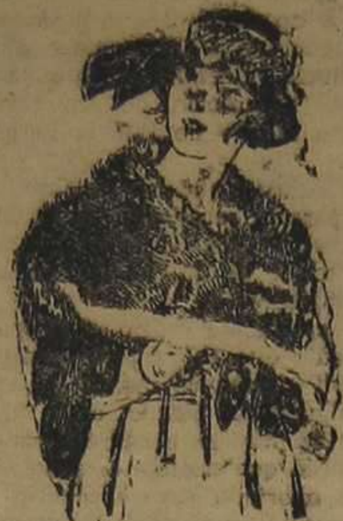
Cuellos para jovencitas, imitación renardina. De ptas. 22 a 40.