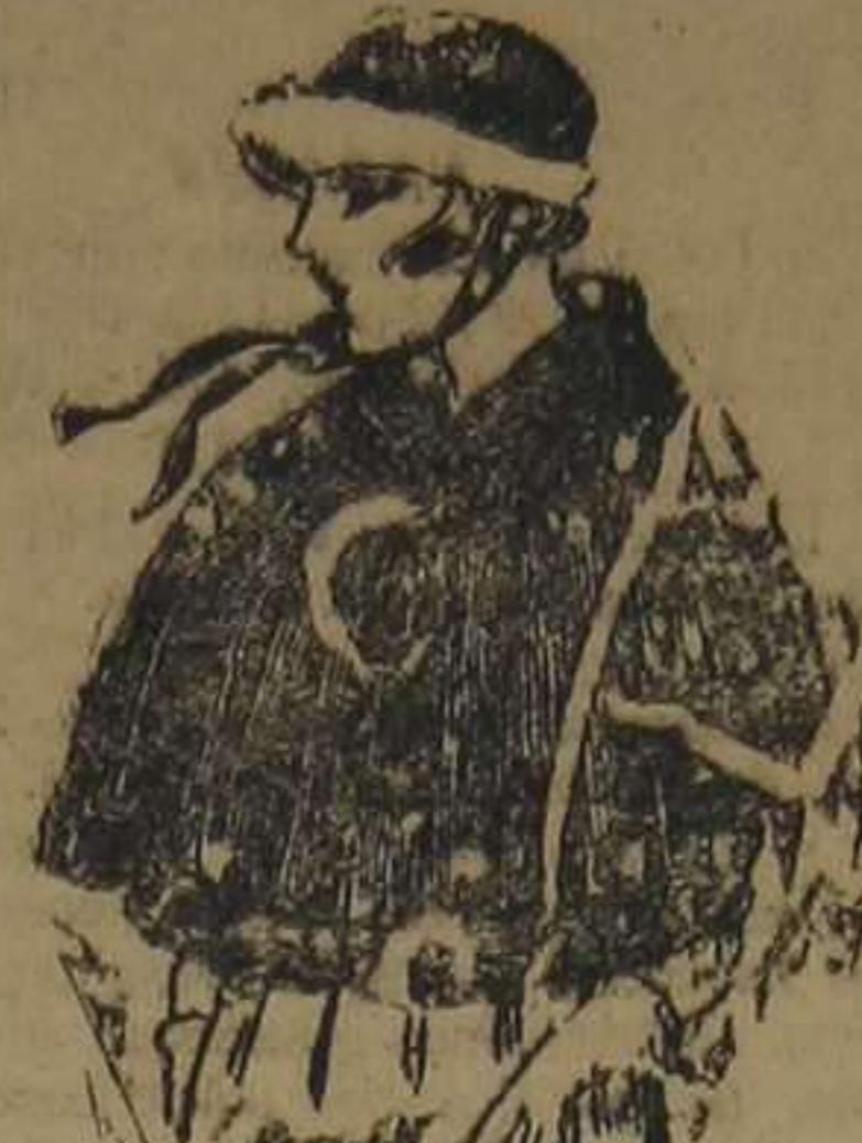
Cuellos forma capa, de piel Colombia, marrón. De ptas. 150 a 200.