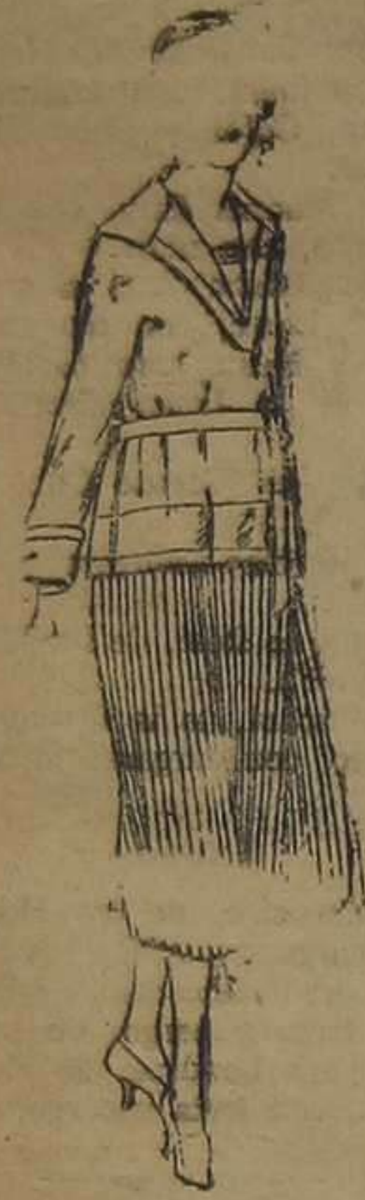
Paleots de punto de lana, negro y colores. De ptas. 33 a 110. En seda y tejidos oro. De ptas. 220 a 250.