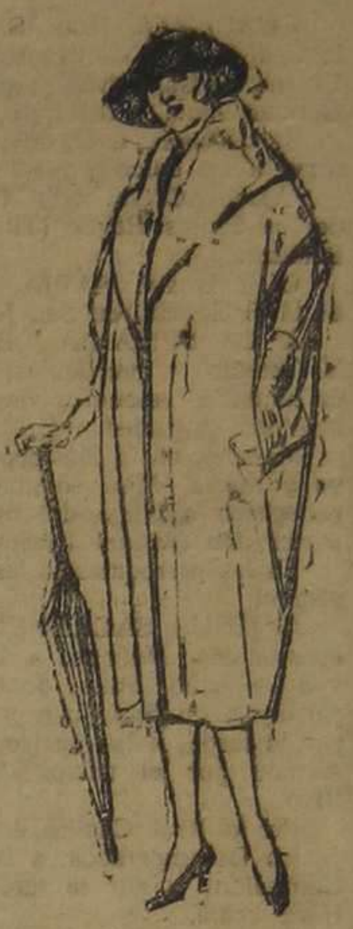
Capas de gabardina, pañete, etc., diferentes colores. De ptas. 127 a 150.