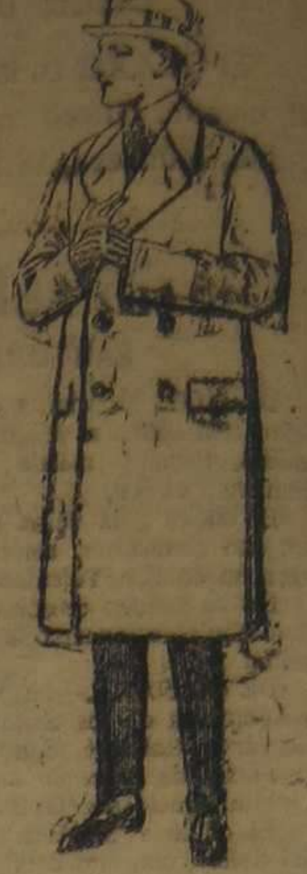
Impermeables raglán, en azul y colores. De ptas. 45 a 100.