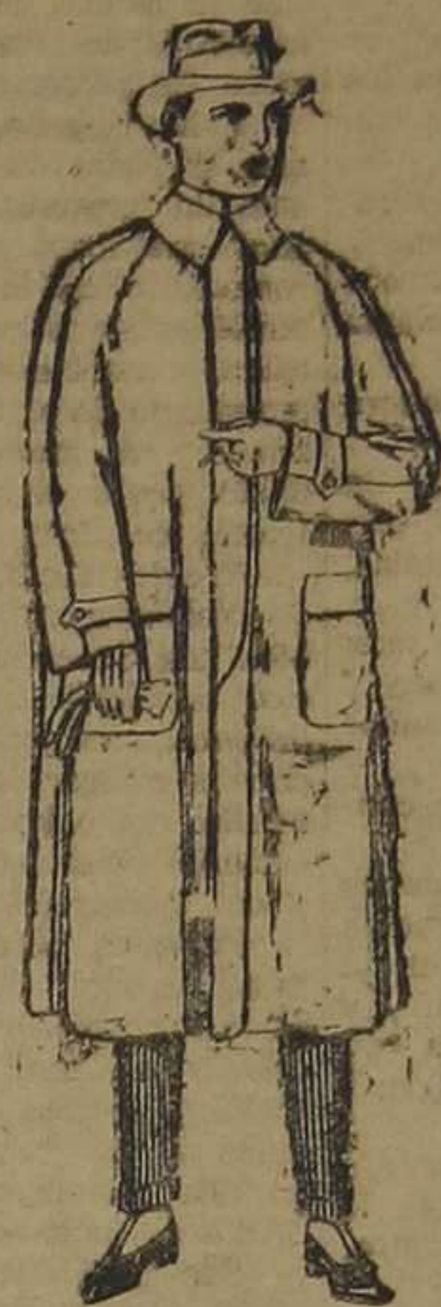
Gabanes de patén, gamuza o cover. De ptas. 70 a 100.