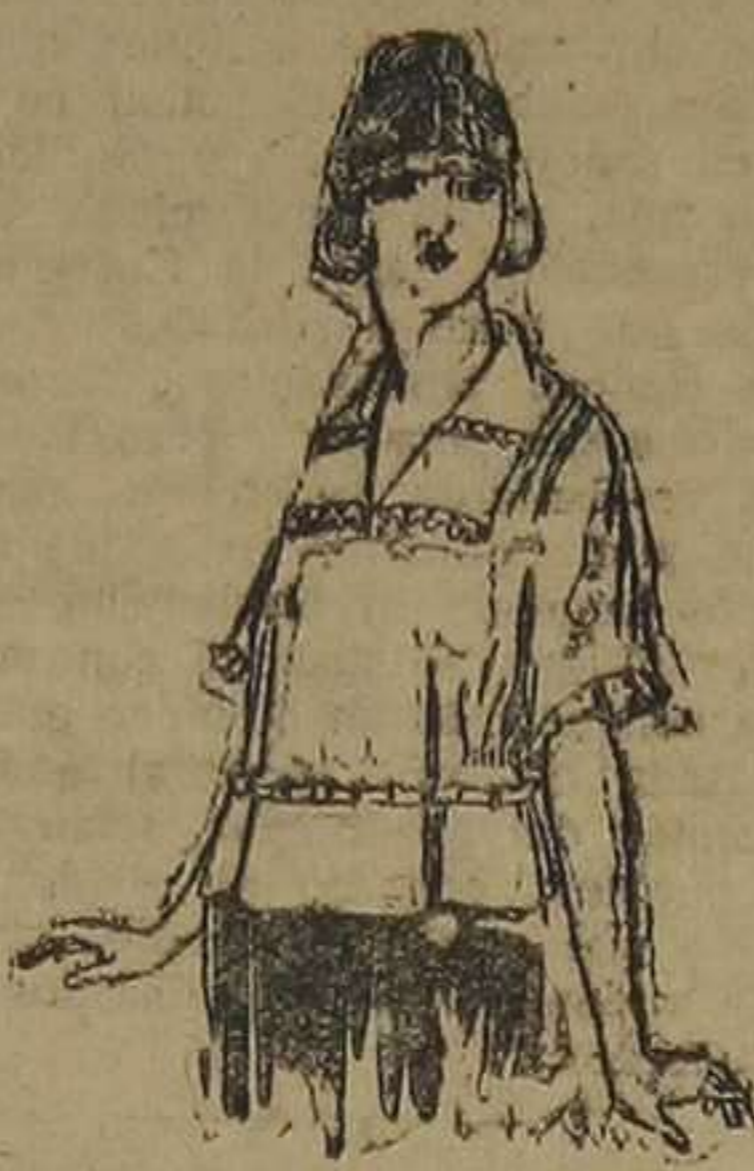
Blusas de crespón de seda, granadina, charmeuse, etc. De ptas. 48 a 70.