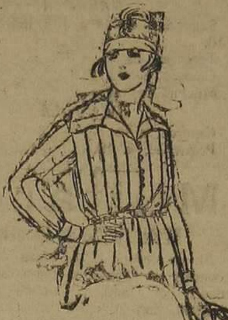
Blusas de franela listada. De ptas. 9 a 15.