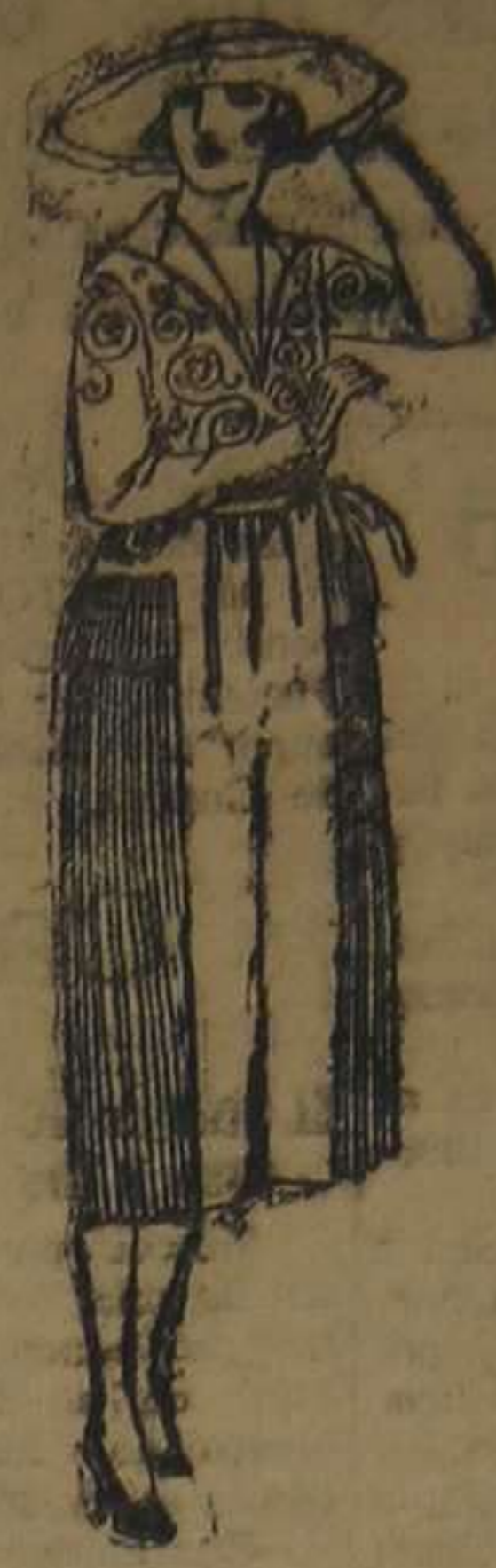
Vestidos de lanilla, gabardina, estambre, etc., en negro, azul y color, adornos bordados. De ptas. 110 a 150.