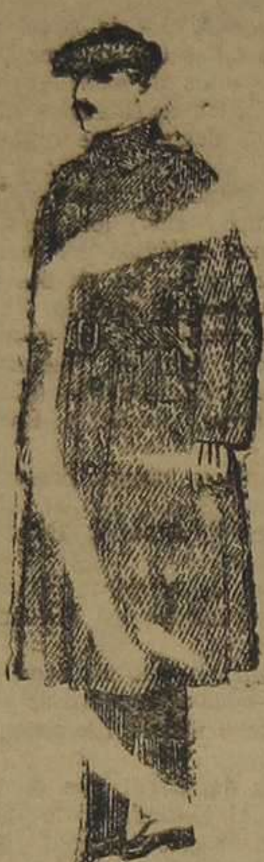
Gabanes de patén, cheviot o cover. De ptas. 90 a 100.