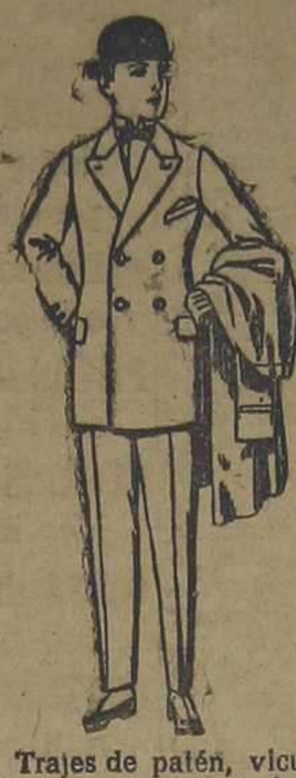
Trajes de patén, vicuña, etcétera, para niños de 10 a 12 años. De ptas. 39 a 85