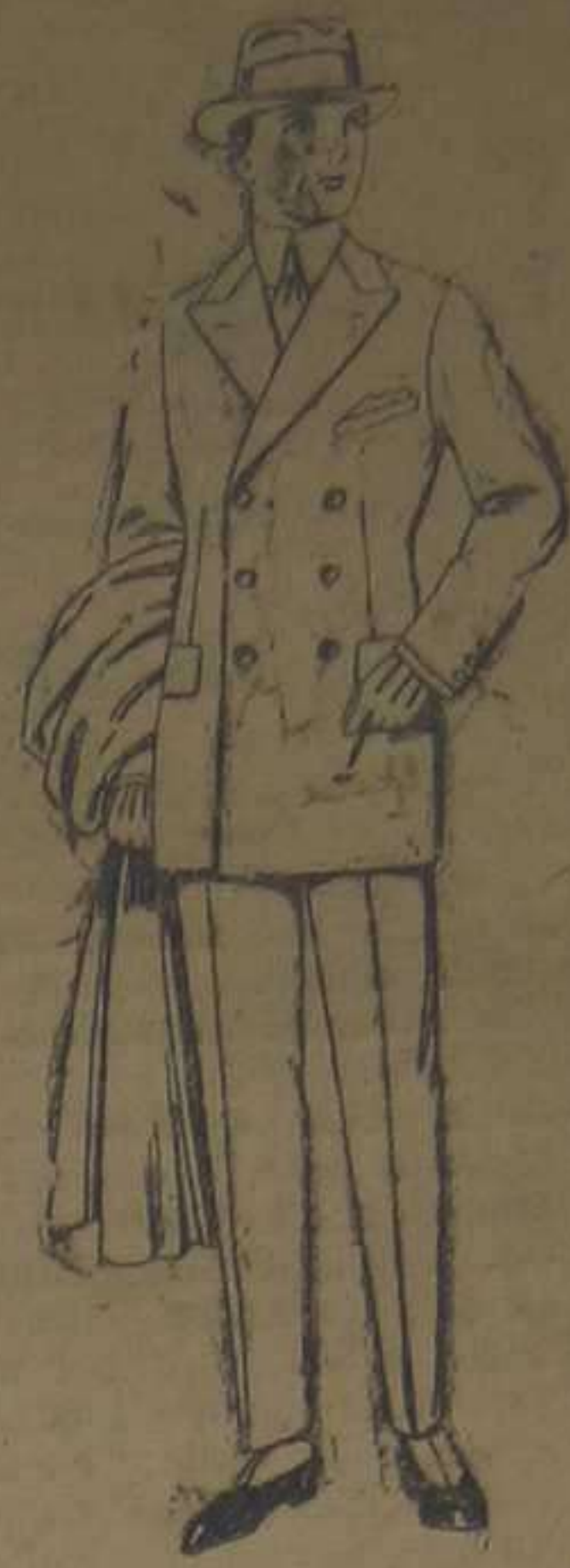
Trajes de cheviot, melton, vicuña o jerga. De ptas. 55 a 100