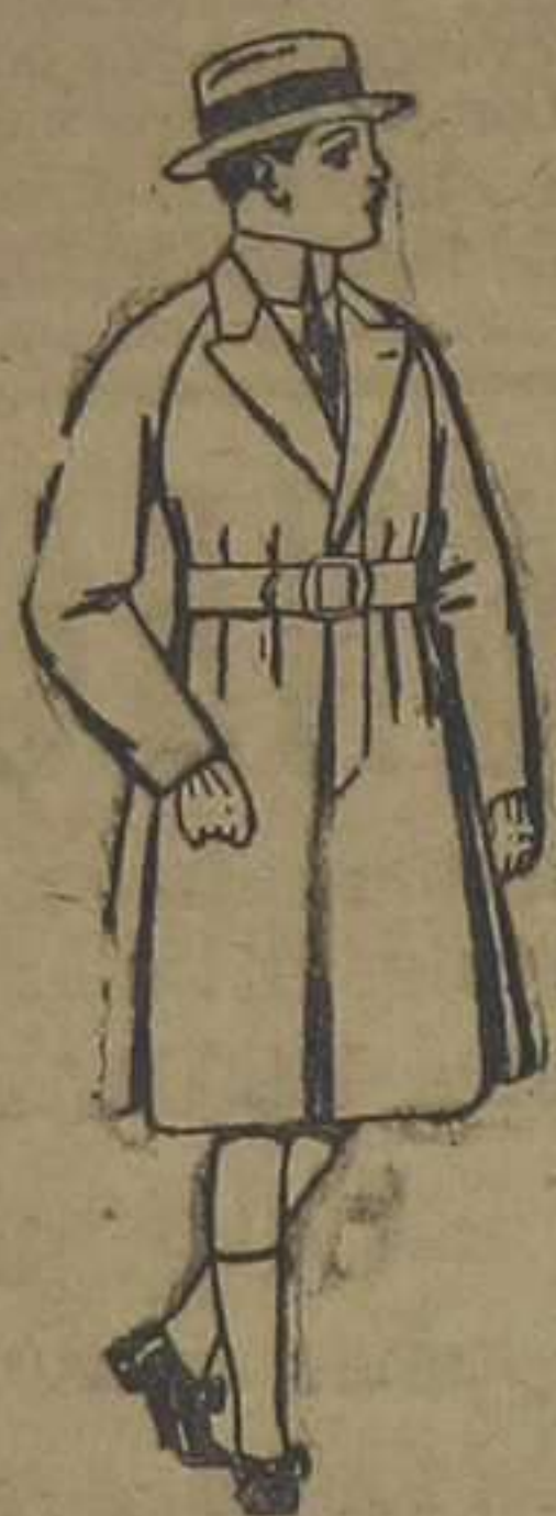
Gabanes de patén, para niños de 4 a 9 años. De ptas. 30 a 55