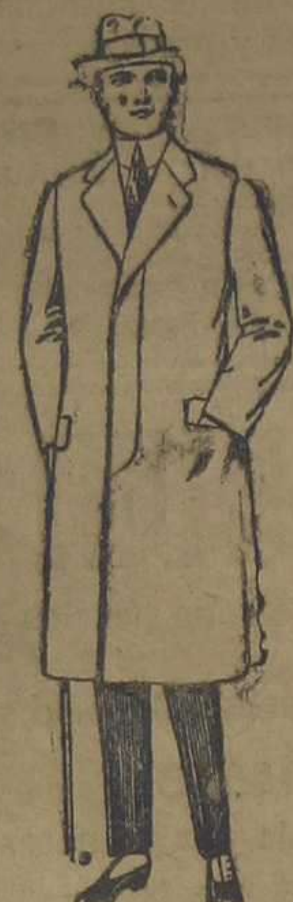
Gabanes de cheviot, gamuza, patén, etc. De ptas. 55 a 70