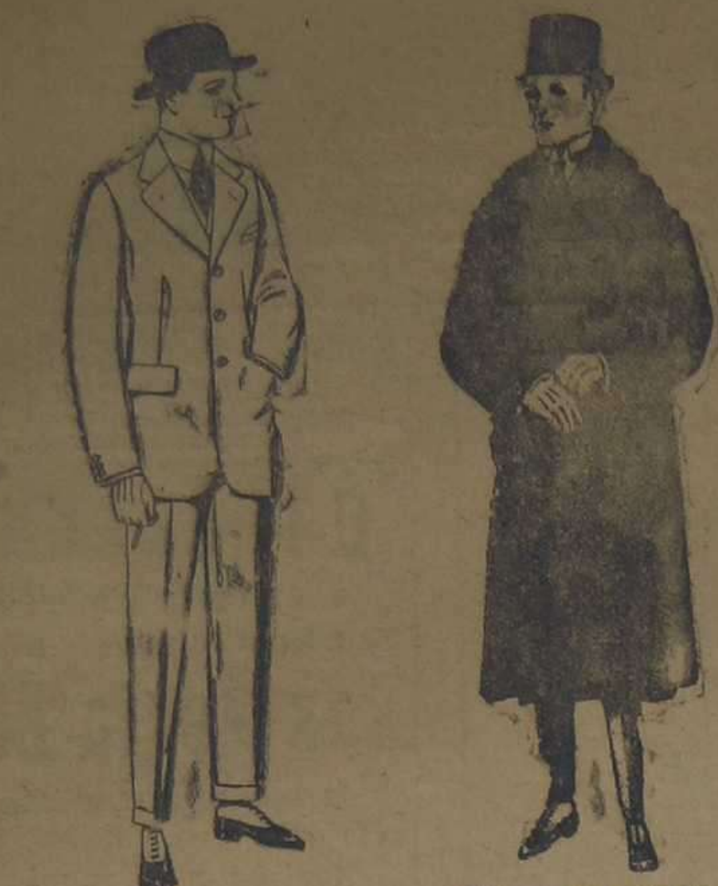
Trajes de cheviot, melton, vicuña o jerga. De ptas. 47 a 190

Madrid, Barcelona, Alicante, Almería, Bilbao, Cádiz, Cartagena Gijón, Granada, Málaga, Palma de Mallorca, Santander, Sevilla, Valladolid y Zaragoza