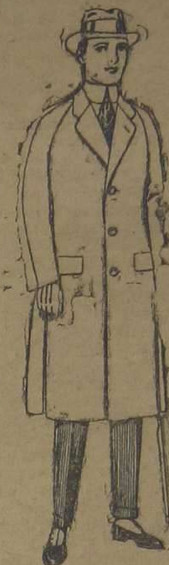
Gabanes de patén, melton o cheviot, con forro de seda, satén o escocés. De ptas. 68 a 185

Ropas confeccionadas para caballero, señora, niño y niña Peletería, Camisería, géneros de punto, corbatería, guantería, sombrerería, zapatería, paraguas, bastones y artículos de viaje