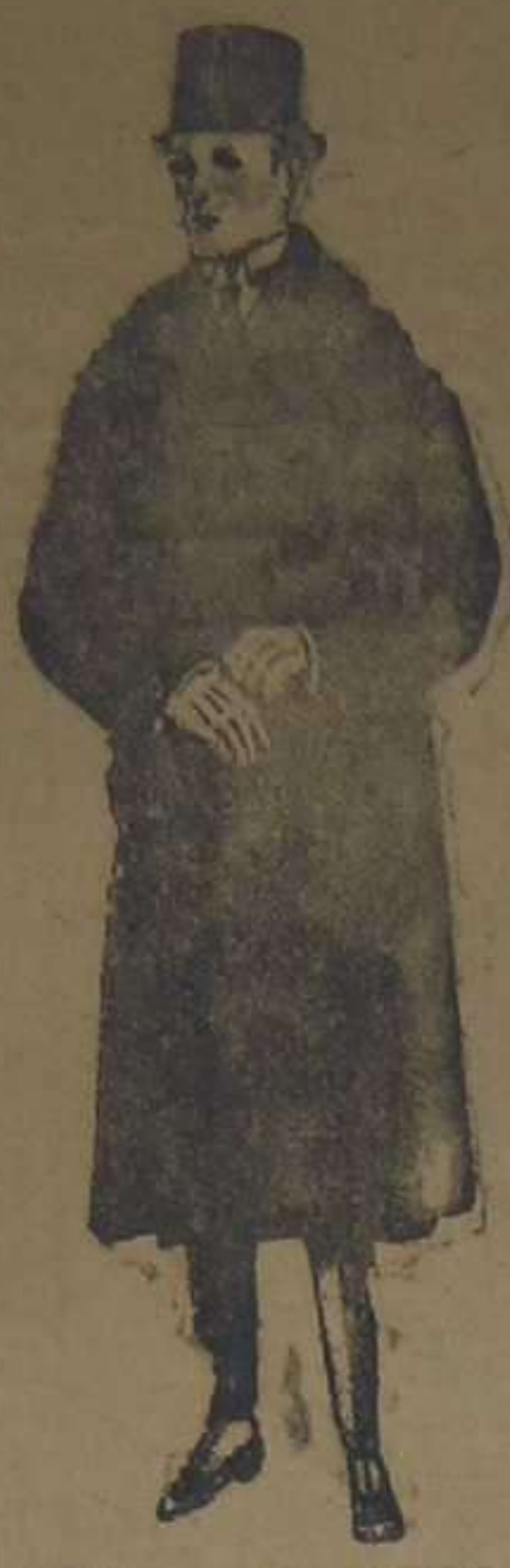
Gabanes de edredón negro, con cuello y vistas de piel. De ptas. 220 a 450