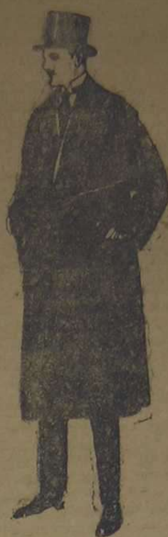
Gabanes de gamuza o vigonia, con vistas de seda. De ptas. 175 a 220