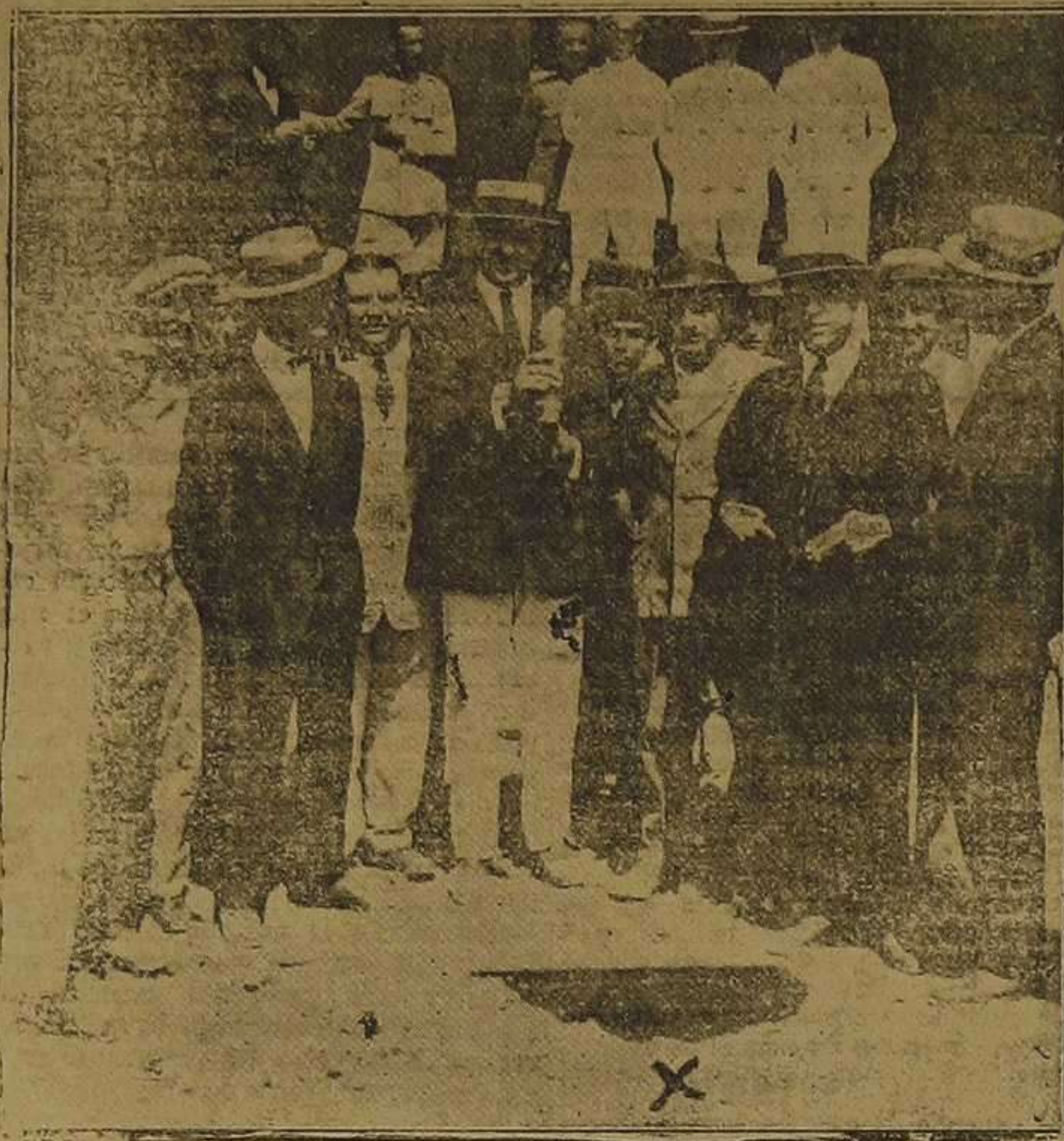
Melilla.—En la estación del ferrocarril de Minas, junto a la plaza de España, cayeron cinco granadas.—(X) Efectos de una de las explosiones.—En el centro del grupo, un individuo con una granada que no estalló. (Foto. Litrán).

En el Ministerio de la Guerra se ha facilitado una nota en la que se